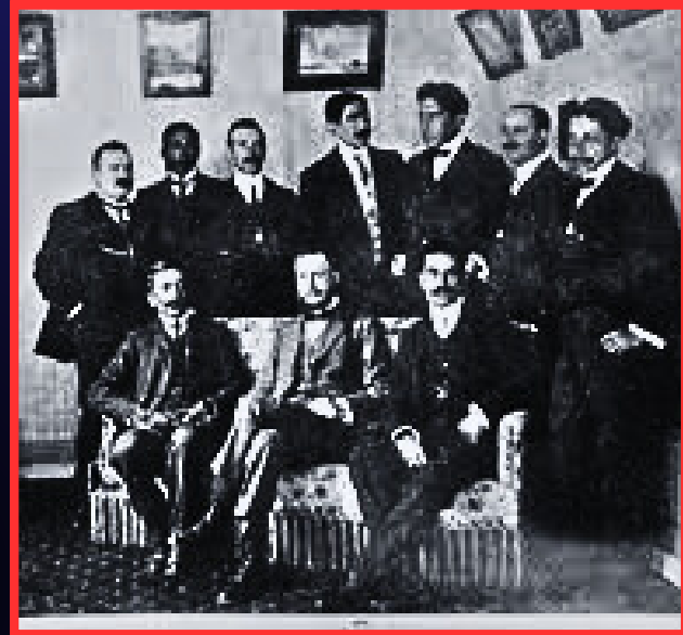
PLANTEL DOCENTE “MARISCAL SUCRE B” “INSTITUTO DE EDUCACIÓN BANCARIA” DE POTOSÍ” AÑO: 1975