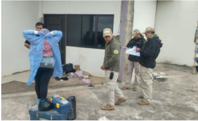
Investigación por feminicidio en Riberalta

Se han recopilado pruebas como el acta de levantamiento legal del cadáver y el acta de recolección de indicios materiales para esclarecer el