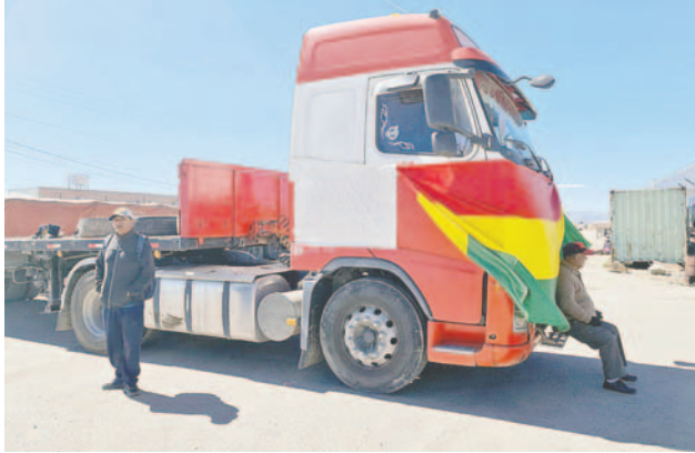
La jornada se tornó conflictiva por los bloqueos

“Con la gerente de la Aduana de Pasto Grande, hemos avanzado en el tema local con los problemas que tenemos, el tema de valores que no era estable, no se respeta canal amarillo y algunos técnicos que han puesto la soga al cuello a los comerciantes y transportistas, por las multas e irregularidades en aranceles”, informó el representante de la Cen-