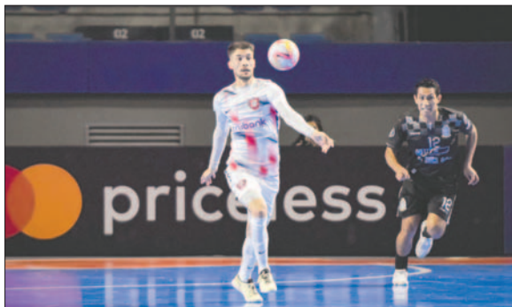
El cuadro orureño no pudo ante San Lorenzo en el torneo internacional