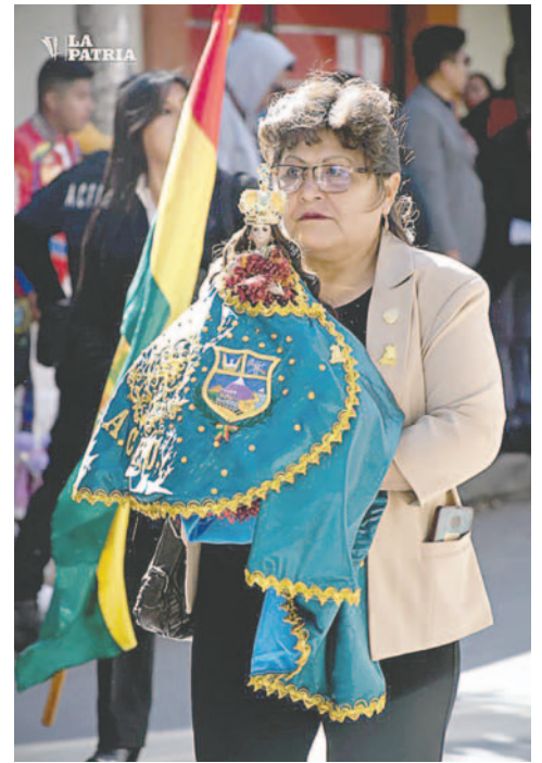
Entrada de la Obra Maestra, en conmemoración a la proclama del Carnaval de Oruro