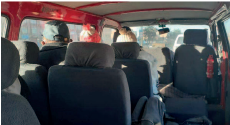
La mujer se encontraba al interior de un minibus cuando se acercó el agresor /REFERENCIAL

El esposo de la víctima llegó al lugar de los hechos, pero el agresor le impidió ingresar al minibus. Posteriormente, el cuñado de la mujer pidió ayuda a