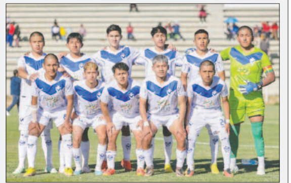
El cuadro orureño no puede hacer pie en el torneo nacional

Hasta el momento, Guabirá y Oriente Petrolero lideran el grupo "B" con seis puntos cada uno. The Strongest, CD San Antonio y Wilstermann tienen tres unidades. Independiente y Royal Pari no han sumado puntos, pero solo han disputado un partido. Por su parte, GV San José no ha logrado sumar puntos en sus dos presentaciones.