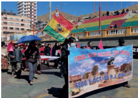
Vecinos protagonizaron un desfile multitudinario

aniversario de Conaljuve-Bolivia, resaltó el trabajo que realiza la institución, destacando que desde el Gobierno Municipal de Oruro se están aprobando planimetrías para las distintas urbanizaciones de reciente creación. Sin embargo, la demanda aún es alta en este sentido.