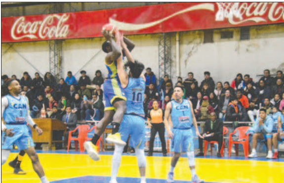
Carl A-Z y CAN disputarán partidos de visita esta semana