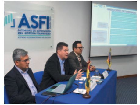
La ASFI sancionará a entidades financieras que no otorguen dólares