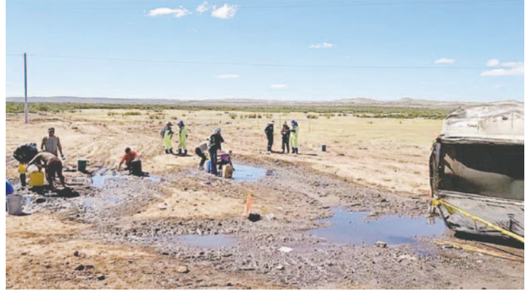
El accidente ambiental sucedió el sábado 18 de mayo en el puente Wichinkullo