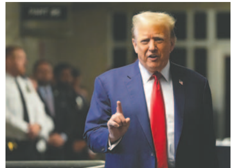
Donald Trump, expresidente de Estados Unidos y propietario de la empresa Trump Media que engloba su red Truth Social

de abril, la empresa tiene alrededor de 621.000 accionistas que respaldan su objetivo de ser líderes en la defensa de la libertad de expresión contra la censura de las grandes empresas tecnológicas como Meta o X, que en el pasado prohibieron a Trump en sus plataformas.