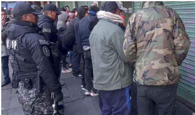
Los miembros del clan familiar delictivo que fue arrestado en la pre-entrada del Gran Poder