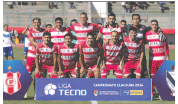
Independiente necesita ganar para no caer en zona de descenso

Cabe mencionar que el cuadro chuquisaqueño perdió contra Boli-