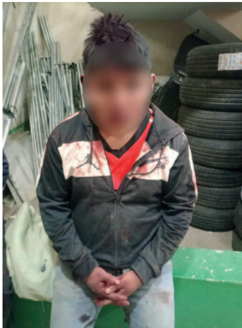
Los sujetos están acusados de abusar sexualmente de una niña