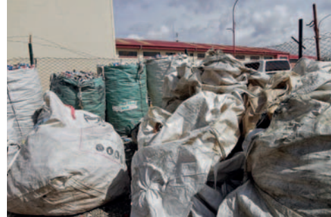
Campaña de sensibilización ambiental /LA PATRIA

"Como DSA en coordinación con el Concejo