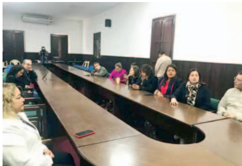
La elección de la nueva directiva de la Brigada Parlamentaria Cruceña fue suspendida por cuarta vez

Solo 16 de los 66 asambleístas se hicieron presentes, lo que impidió alcanzar el mínimo de 33 necesarios para instalar la sesión, situación que se repite desde el pasado marzo, cuando se convocó por primera vez la elección de la nueva directiva, informó El Deber.