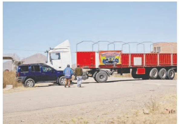
El Transporte Pesado lideró el bloqueo de carreteras

Esta medida de presión fue liderada por el Transporte Pesado, que demanda mejoras en el tema impositivo para el sector, debido a aparentes abusos de la Aduana y la Dirección Nacional de Prevención de Robo de Vehículos (Diprove), la escasez de dólares y el abastecimiento normal de combustibles.