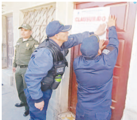
Night Club “G.G.” fue clausurado