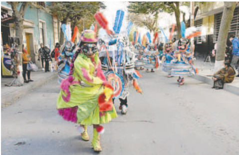
Destacaron el movimiento económico que se generó entre el 17 y 19 de mayo

Los miembros de la Secretaría Municipal de Cultura del GAMO, aseguraron que en los siguientes días se tendrá una evaluación conjunta con la Asociación de Conjuntos del Folklore de Oruro (ACFO) y el Comité Departamental de Etnografía y Folklore (CDEF).