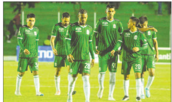
Oriente Petrolero venció a FC Universitario y quiere seguir en esa senda