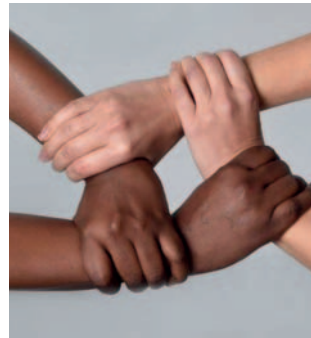
La marcha contra el racismo y discriminación está programado para el 24 de mayo

El 24 de mayo, en conmemoración al Día Nacional contra el Racismo y Toda Forma de Discriminación,