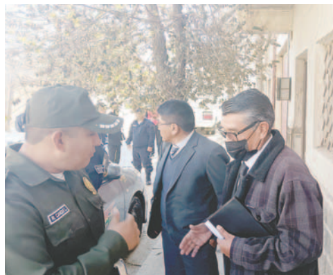
Actividad económica tiene 24 horas para justificar documentación de funcionamiento

cedió con la clausura temporal del local por diez días y se impuso una multa de 3 mil UFV, equivalentes a aproximadamente siete mil bolivianos, por el