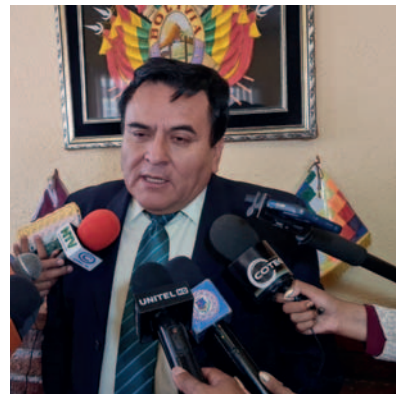
El Fiscal Departamental refirió que esta sentencia es ejemplar y se buscará más resultados en otros casos

Esta sentencia es un paso importante en la búsqueda de justicia para la víctima, quien luchó por más de un año para que su agresor fuera castigado.