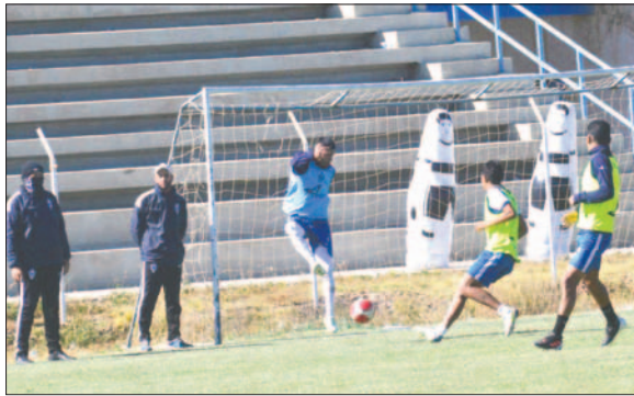
La preparación continuará, ahora pensando en San Antonio / LA PATRIA

Debido a los bloqueos presentados en diferentes puntos del departamento de Oruro, la dirigencia de GV San José se vio obligada a emitir una nota a la FBF explicando que, ante esta eventualidad, el conjunto orureño no pudo emprender el viaje hasta la ciudad de Cochabamba para luego tomar el vuelo hacia a Santa Cruz, sede del partido contra Real Santa Cruz, por la tercera fecha del torneo Clausura.