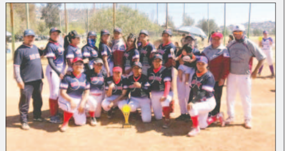
Red Sox estuvo a un paso de lograr el primer lugar