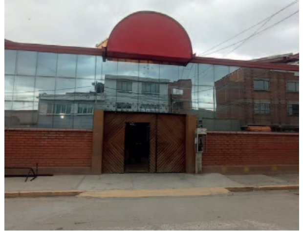
La justicia determinará a quien pertenece el derecho propietario del ex Centro de Salud Santa Lucía / DIO

“Hoy (lunes) tenemos una reunión con todo el personal para poder trasladar todas las cosas durante esta semana y, a fin de no perjudicar, puedan organizar hasta el fin de semana y que la población pueda venir a estas instalaciones nuevamente y recibir atención”, manifestó.