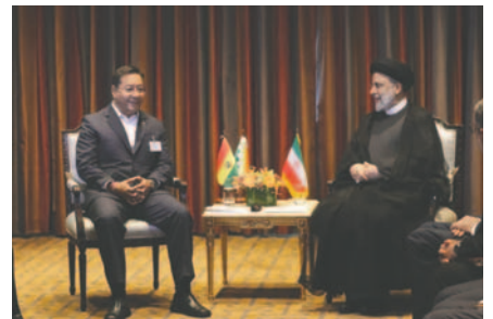
Luis Arce con Ebrahim Raisi en un pasado encuentro