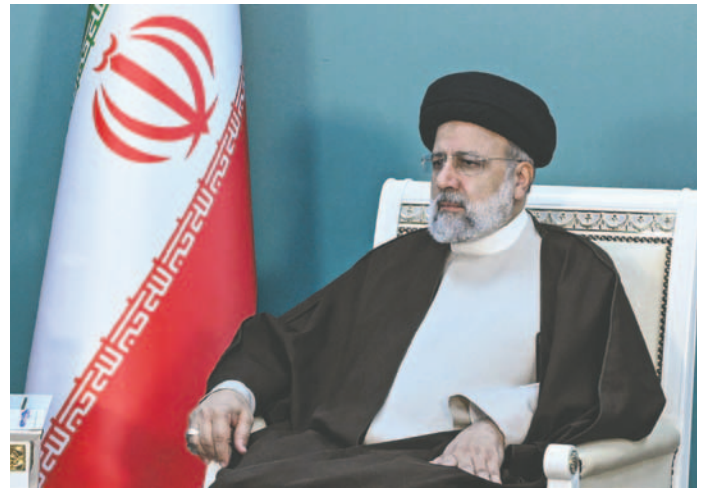
Imagen del fallecido presidente iraní Ibrahim Raisi durante su participación este domingo en la inauguración de una presa en la frontera entre Irán y Azerbaiyán

Después del anuncio de la muerte de Raisi, el líder supremo de Irán, Ali Jamenei, aprobó este lu-