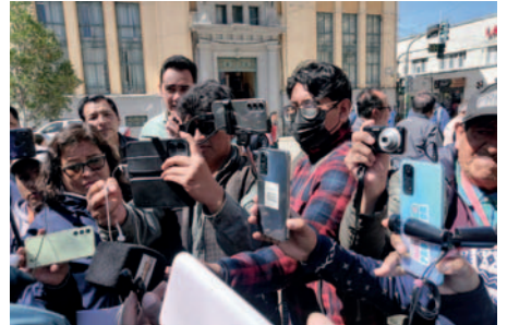
Agresiones a periodistas son recurrentes