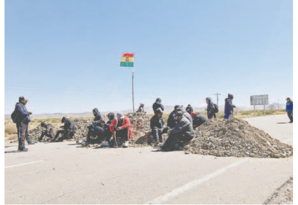
Chóferes exigen solución a la escasez de dólares

tral de Transporte Pesado Nacional e Internacional Incorporados Oruro, Castillo Sánchez.