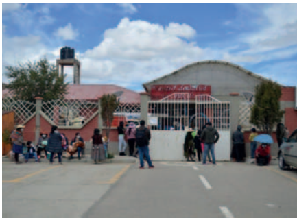
La campaña se realizará en instalaciones del Centro de Salud María Auxiliadora