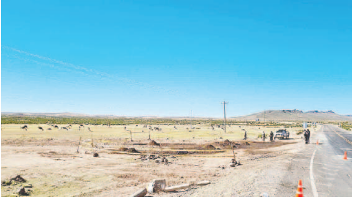
Persiste la preocupación por segundo derrame de combustible en el sector