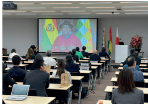
El vicepresidente de Bolivia, David Choquehuanca en Simposio Bolivia-Japón sobre agricultura

El vicepresidente, David Choquehuanca, participó de forma virtual y durante su discurso resaltó la relevancia de la quinoa para las futuras generaciones, recordando que es un cultivo sembrado en el pasado por las culturas ancestrales de Bolivia.