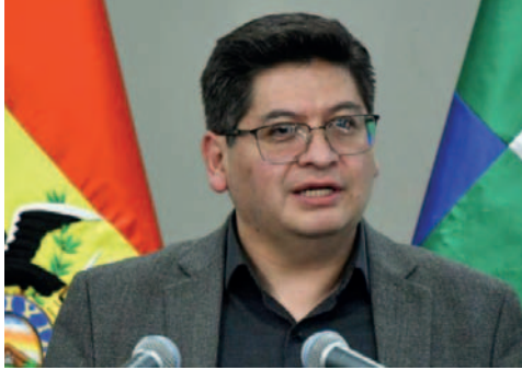
El ministro de Economía, Marcelo Montenegro /MEYFP

Los transportistas denunciaron que el flujo del comercio exterior ha disminuido debido a la falta