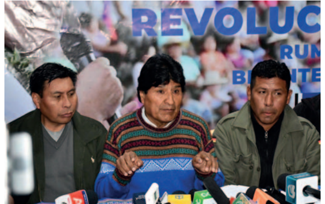
Evo Morales señaló que se debe fiscalizar los créditos que sean aprobados

Con relación al Congreso del bloque renovador, el expresidente