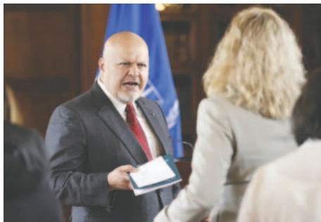
El fiscal de la Corte Penal Internacional (CPI), Karim Khan, ha solicitado este lunes al tribunal la emisión de órdenes de arresto contra el primer ministro israelí, Benjamin Netanyahu, así como el líder de Hamas, Yahya Sinwar, por presuntos crímenes de guerra y de lesa humanidad

Khan los considera penalmente responsables de crímenes de guerra y lesa humanidad cometidos en territorio de Israel y el Estado de Palestina desde al menos