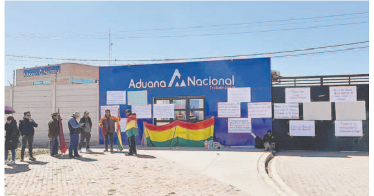
En Oruro se obstruyó la ruta hacia La Paz y el sector de la Aduana de Pasto Grande

A nivel nacional, el transporte pesado de va-