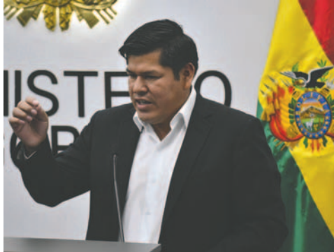
El viceministro durante una conferencia de prensa

“Estas aseveraciones son totalmente infundadas. Quiero desmentirlas categóricamente. Me sorprende que el expresidente hable como si conversara