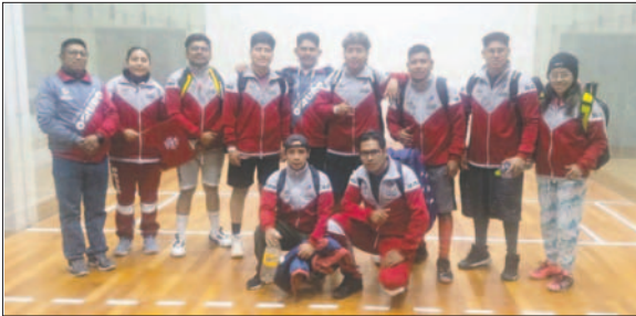
Buena participación de la delegación orureña en la Villa Imperial