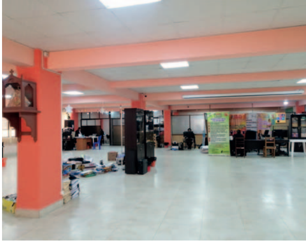
La DIO se trasladará nuevamente a los ambientes de la Dirección de Desarrollo Económico

Durante toda la semana, la DIO, que había realizado el traslado de sus muebles, activos y carpetas a estas instalacio-