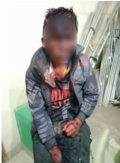
Los presuntos antisociales fueron golpeados con severidad