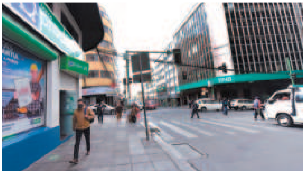
Varios bancos en las calles céntricas de la ciudad de La Paz.

Además aclaró que la norma dispone la obligatoriedad de que las instituciones supervisadas, de manera mensual, reporten sus tarifas a la ASFI, a efectos de controlar que no excedan las fijadas en el mencionado Reglamento. También determinan lineamientos específicos para el cobro de comisiones por los servicios de transferencias y giros al exterior, incorporando una banda de 5% a 10% que se aplica tanto para aquellas en dólares estadounidenses, así como en otras monedas extranjeras, estableciendo criterios para las transferencias de recursos al exterior.