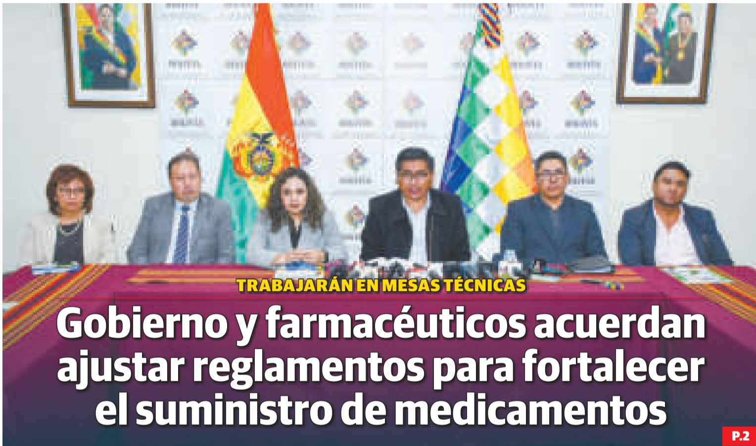
TRABAJARÁN EN MESAS TÉCNICAS