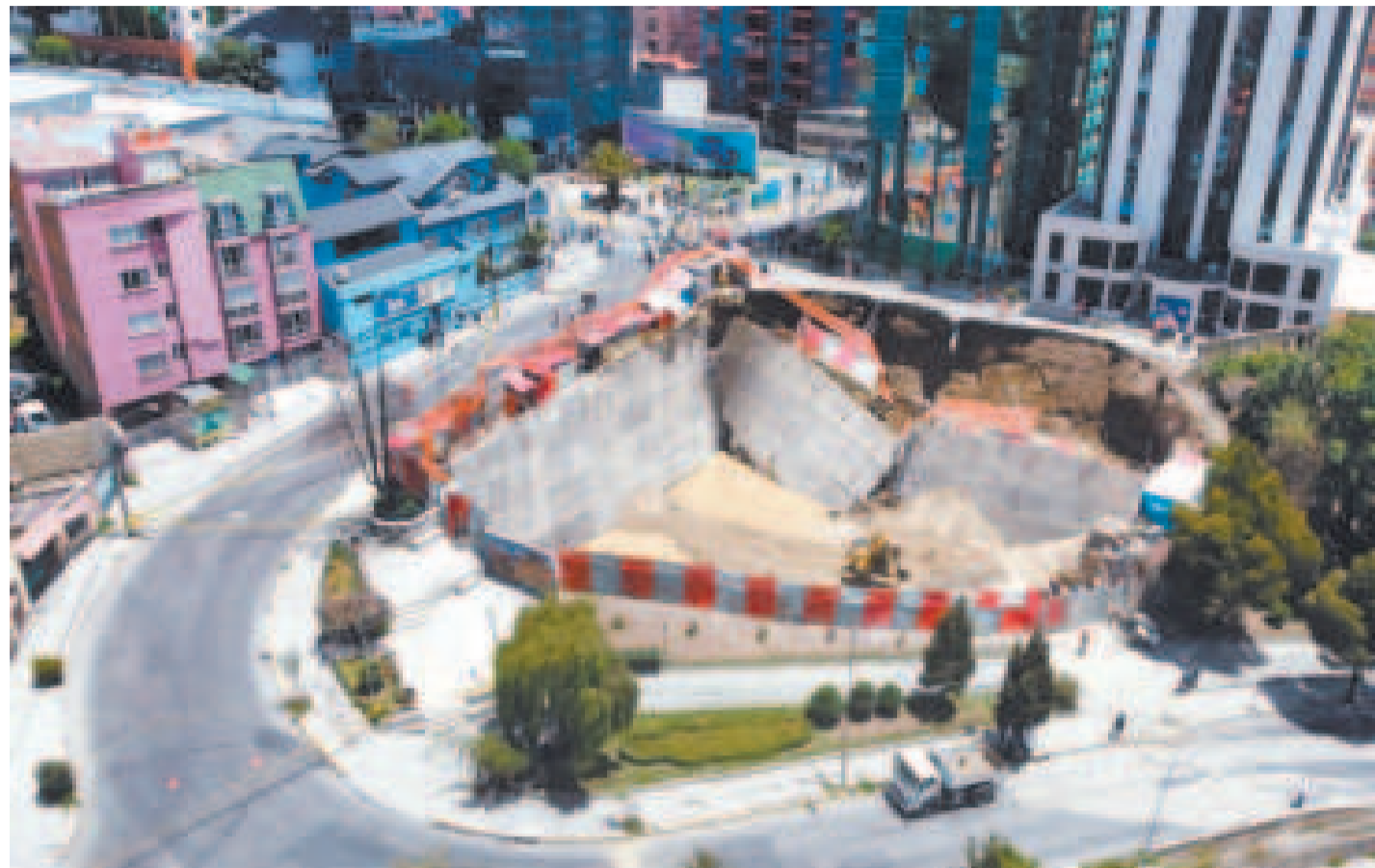
El terreno en el que se encontraba la Casa Pagoda.

La concejal detalló que dicho informe dio vueltas por varias unidades y que se enteró el informe una vez que se