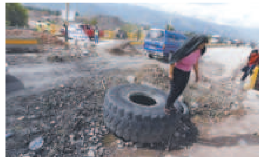
Bloqueo con llantas en una de las carreteras del país.

an que sería un "grave error" tratar de la repostulación de Morales en 2025.