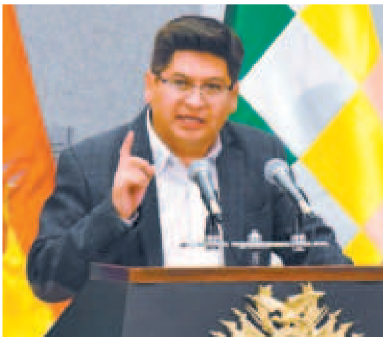
El ministro de Economía y Finanzas Públicas, Marcelo Montenegro.