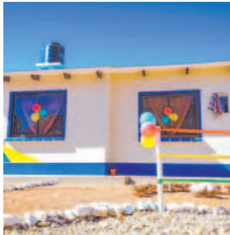
Una de las viviendas que entregó el Gobierno en Chuquisaca, en pasados días.

Ponce de León auguró que con el encuentro se contribuirá a la integración comercial histórica entre Bolivia y Brasil.