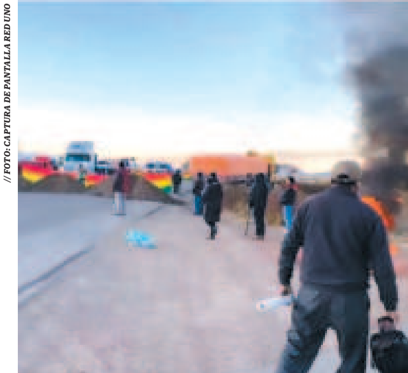
Transportistas bloquean la carretera La Paz-Oruro.