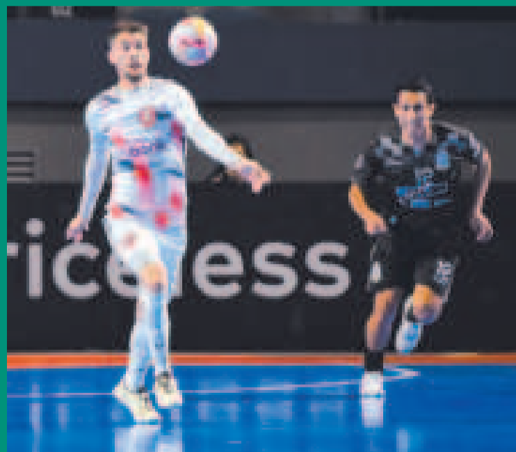
Una escena del encuentro entre San Lorenzo y Fantasma Morales Moralitos.