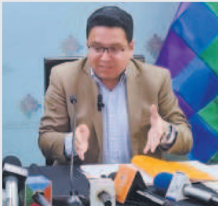
El procurador general del Estado, César Siles, en conferencia de prensa.

sión, la PGE analizó la Opinión Consultiva Nro. 28/21 de 2021, emitida por la Corte Interamericana de Derechos Humanos, que interpretó los artículos 1, 23, 24 y 32 de la Convención Americana sobre Derechos Humanos, artículo XX de la Declaración Ameri-