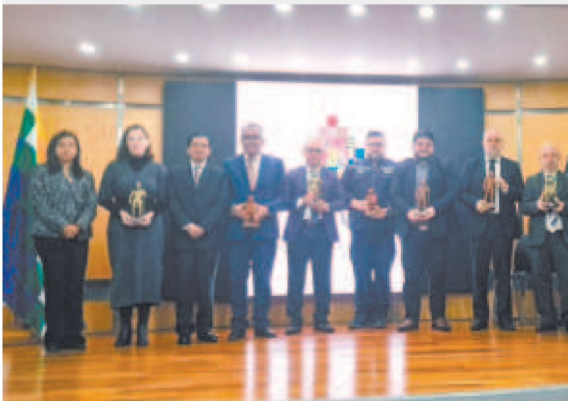
Las autoridades y representantes de los operadores de transporte terrestre de Bolivia y Brasil que participan en la reunión.

“El presidente Lucho también va a seguir entregando más obras en el departamento de Chuquisaca. Este es el esfuerzo, este es el cariño, este es el amor que tiene nuestro presidente para todos los departamentos”, dijo.