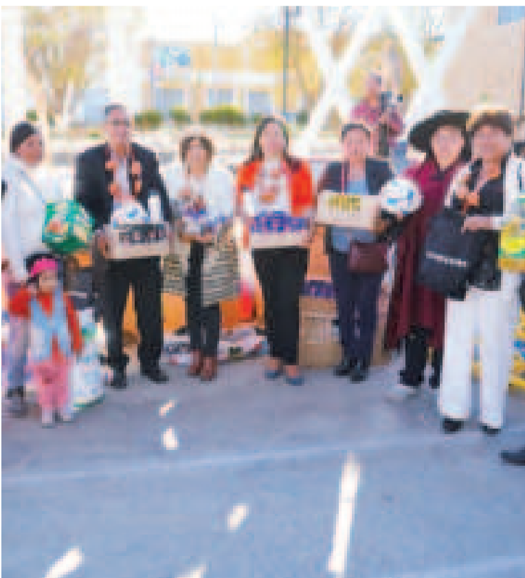
Autoridades y beneficiarios durante el evento.