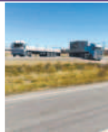
Bloqueo en la vía La Paz-Oruro.

Luego de ese estudio, la PGE concluyó que la “prohibición de la reelección presidencial indefinida busca evitar que una persona se perpetúe en el poder y, de este modo, asegurar el pluralismo político, la alternancia en el poder, así como proteger el sistema de frenos y contrapesos que garantizan la separación de poderes”.