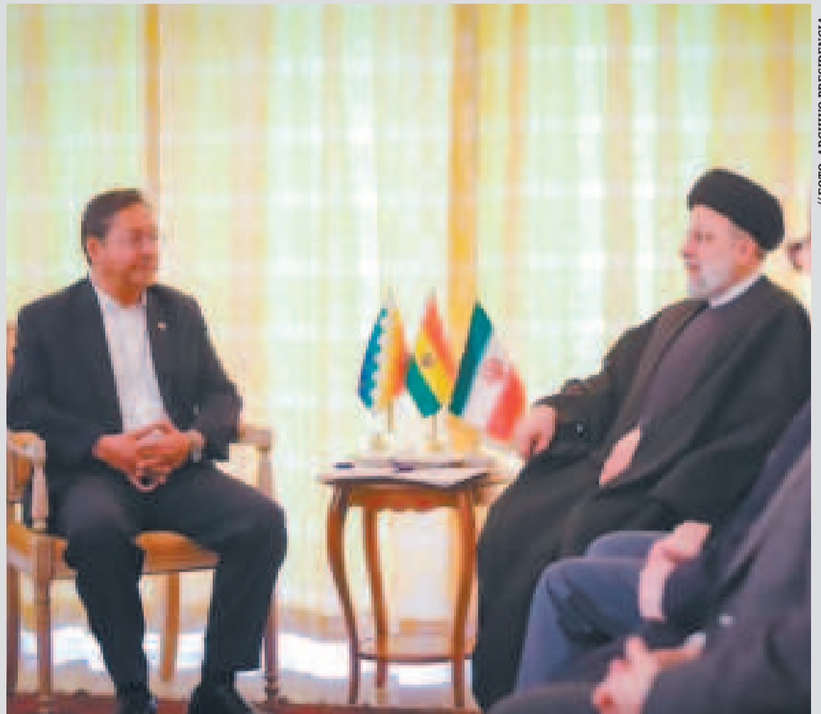
Los presidentes Luis Arce y Ebrahim Raisi en una reunión en el marco del Foro de Países Exportadores de Gas en Argelia.

El vicepresidente David Choquehuanca y la Cancillería también lamentaron el fallecimiento del presidente de Irán. “Enviamos nuestras condolencias al Líder Supremo Ali Jamenei, al Gobierno, a los familiares y a todo el pueblo iraní”, señaló Choquehuanca en sus redes sociales.