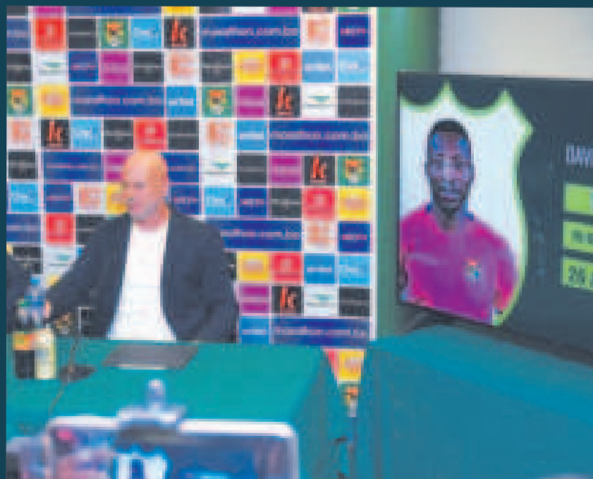
El DT de la Selección, Antonio Carlos Zago, trabaja en la elaboración de la lista de convocados.

Anunció que en las próximas horas se buscará un espacio en el calendario para fijar fecha y hora del compromiso. "Estimamos que se reprogramará para después del 30 de mayo", puntualizó.