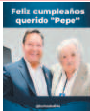
Arce y Mujica en una gráfica de archivo.

“Lograr la reunificación completa de China es una aspiración compartida de todos los hijos e hijas de la nación china”.