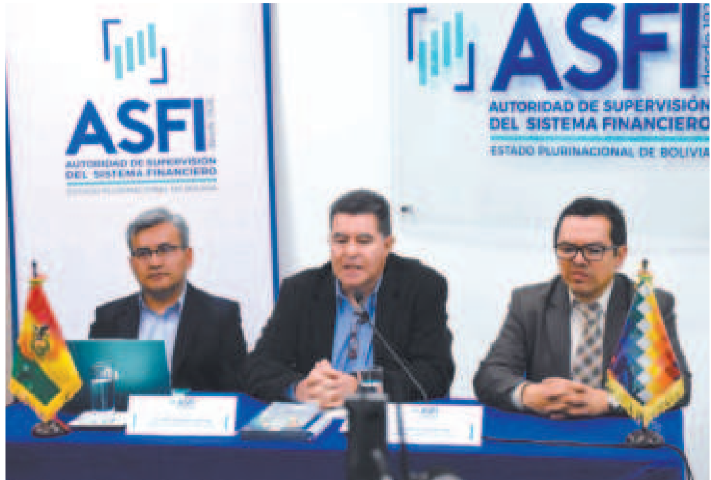
Autoridades de la ASFI explican las sanciones a las entidades financieras.

Recordó que las entidades supervisadas para el cobro de