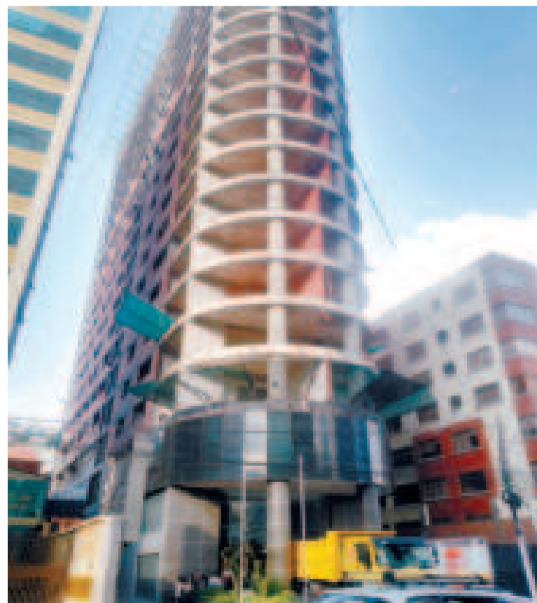
Edificio de Las Loritas construido en el terreno de una casa patrimonial.