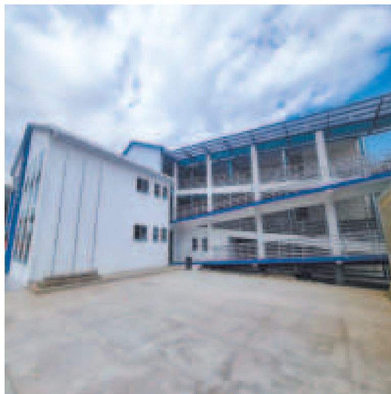
Moderna estructura inaugurada en Poroma.

Esto fortalece la relación entre la escuela y la comunidad.