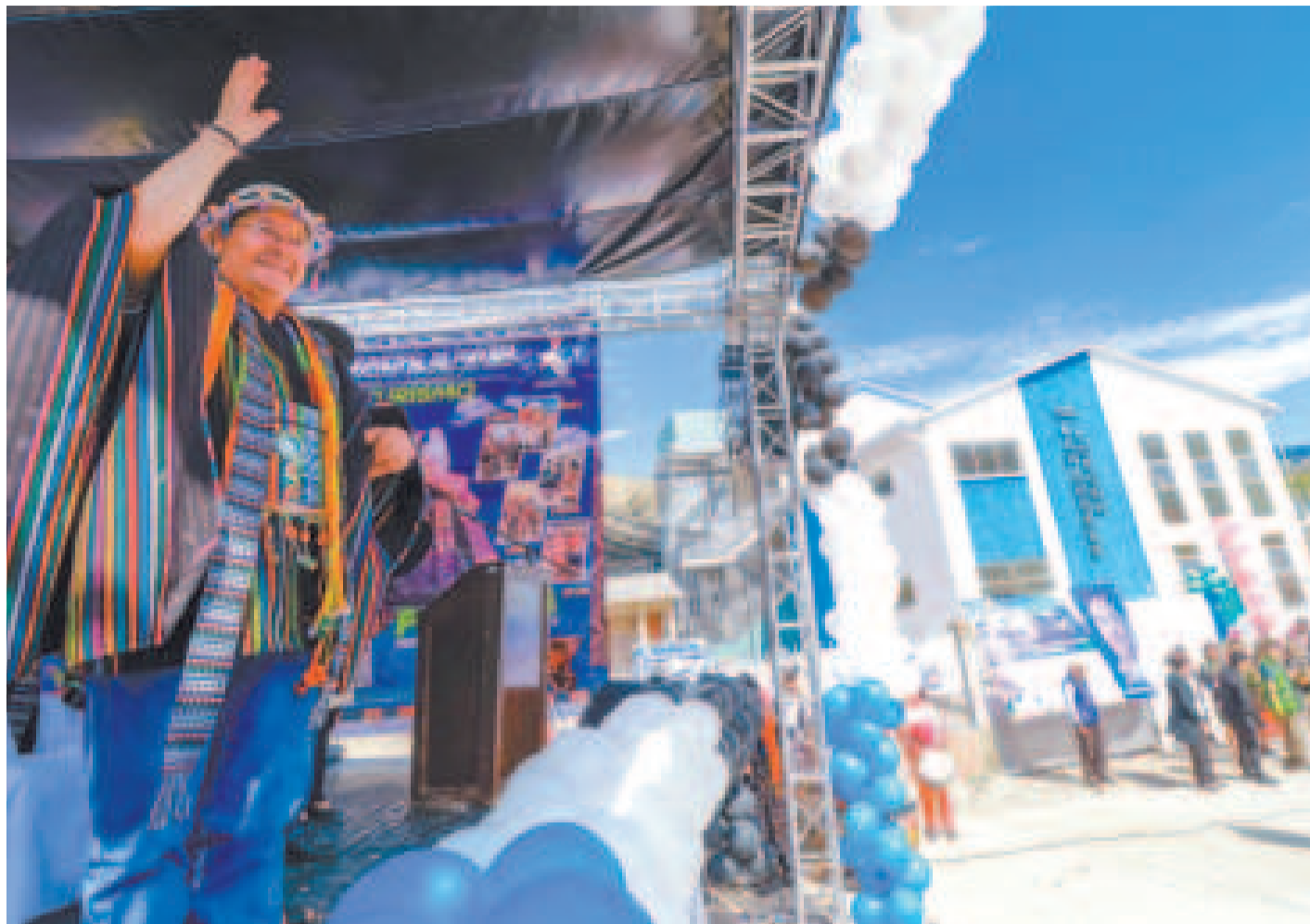
El Presidente en Poroma, donde entregó tinglados para 15 unidades educativas.

Las estructuras permiten ampliar el espacio educativo, creando nuevas aulas o áreas para actividades extracurriculares, talleres o eventos. Esto es especialmente importante en zonas rurales donde las