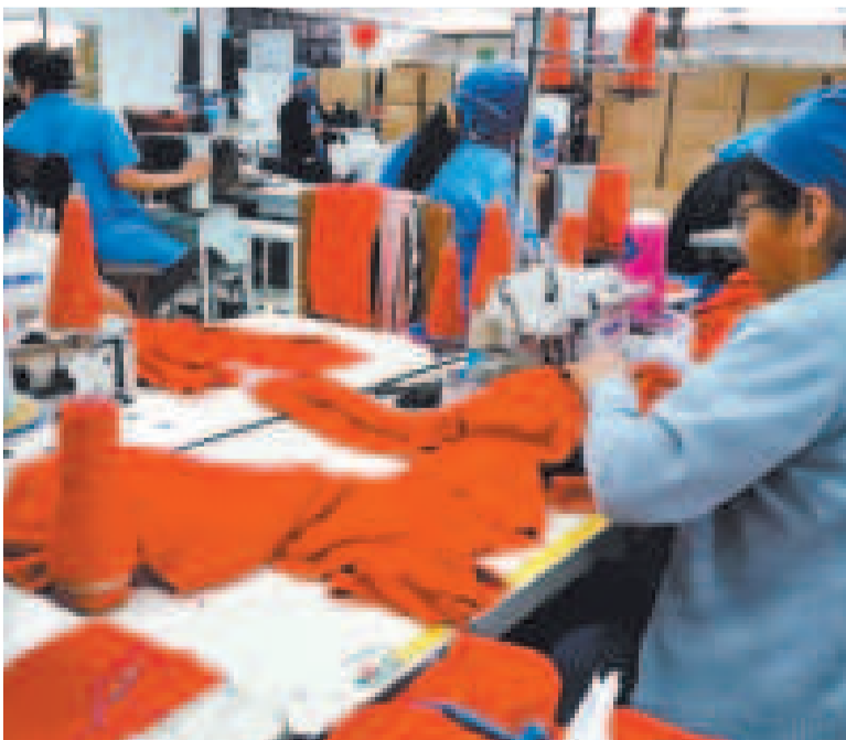
Los fabriles conmemoran hoy las luchas por mejores condiciones laborales.