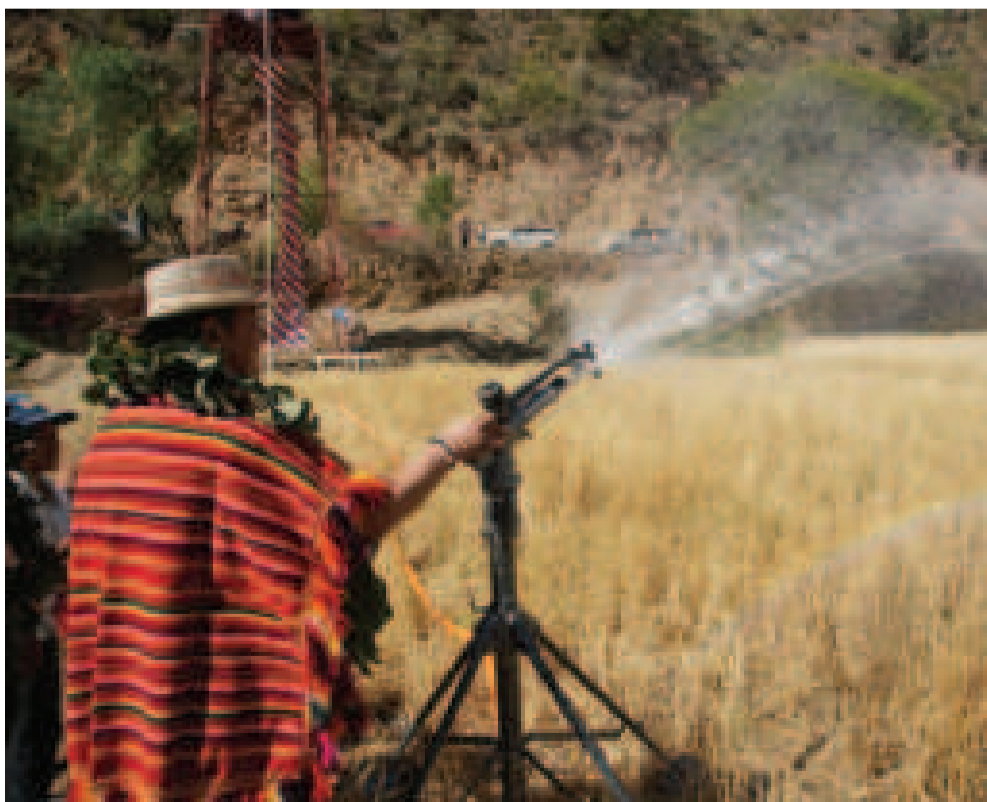
El presidente Luis Arce comprueba el sistema de riego entregado en el municipio de Presto.

La electrificación rural promovida por el Gobierno, a través de ENDE Corporación, mejora la calidad de vida de las familias y fortalece la economía de comunidades donde se desarrollan actividades productivas, optimizando la prestación del servicio de energía eléctrica en centros de salud, educación y otras actividades comerciales que promueven el desarrollo económico de la región, destacó la estatal.