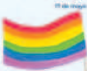
Cartel por el Día Internacional contra la Homofobia.

Día Internacional contra la Homofobia, Transfobia y Bifobia