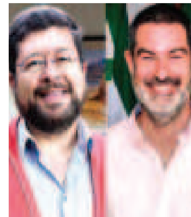
Líderes opositores de derecha.

“Ese decreto ya ha sido abrogado por el presidente Lucho. Nosotros pedimos la medida para evitar que se convierta en una confusión y que cualquier otra norma sea socializada antes”, dijo el dirigente en Panamericana.