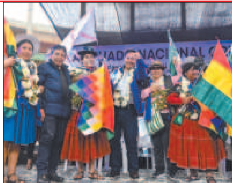
El presidente Luis Arce junto a las mujeres ‘Bartolina Sisa’.