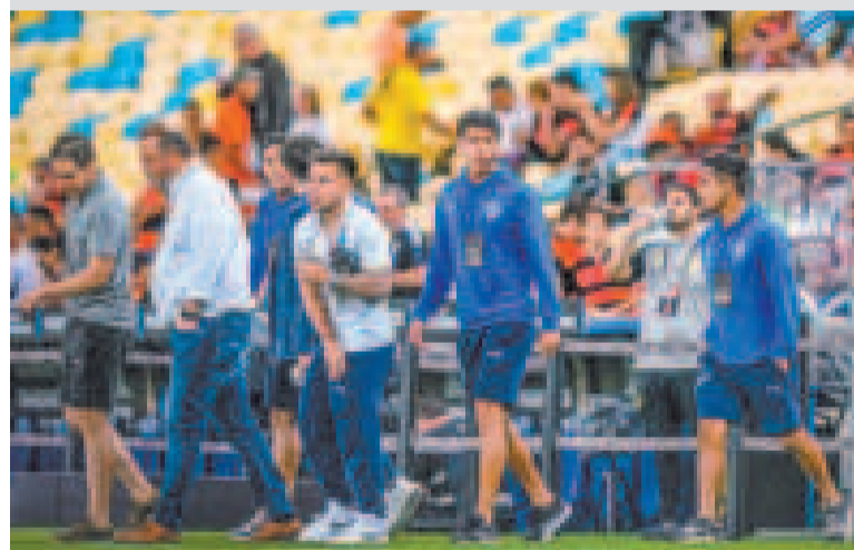
Jugadores de Bolívar en el estadio Maracanã de Rio de Janeiro.