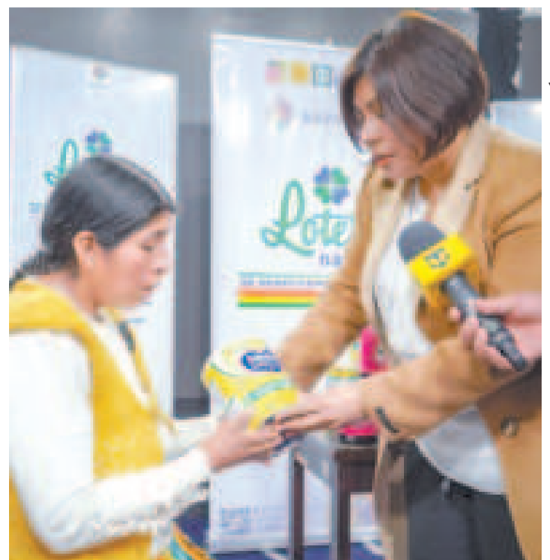
La beneficiaria recibe el apoyo de la Lotería Nacional, de manos de la directora.