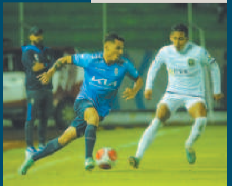
Una incidencia del compromiso que se jugó anoche en el estadio 'Tahuichi' Aguilera.