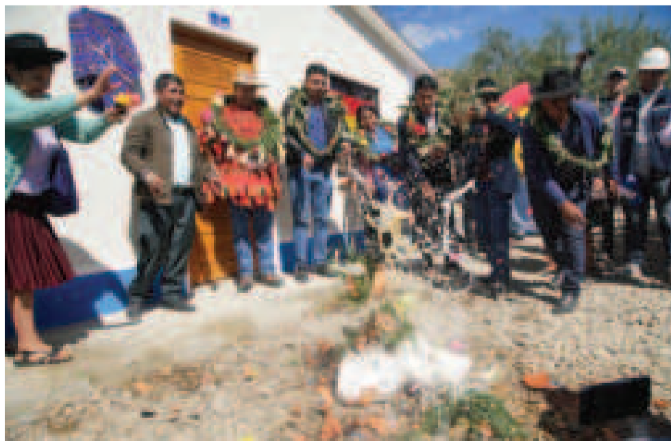
La ch'alla de una de las viviendas sociales entregadas ayer.

Entregó además 53 viviendas sociales para los habitan-