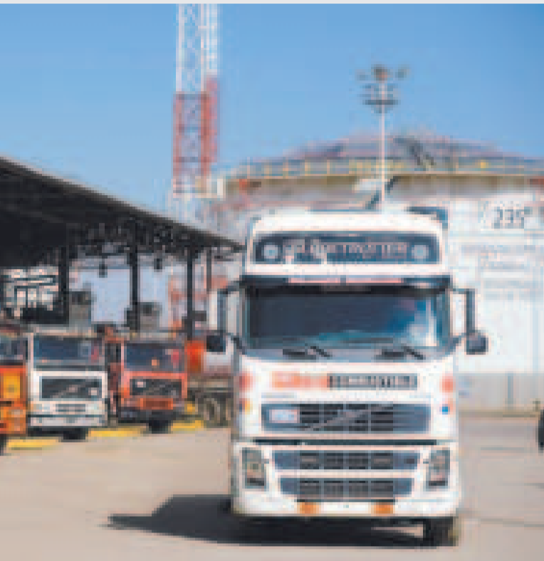
Camiones cisterna que se encargan de transportar los carburantes.