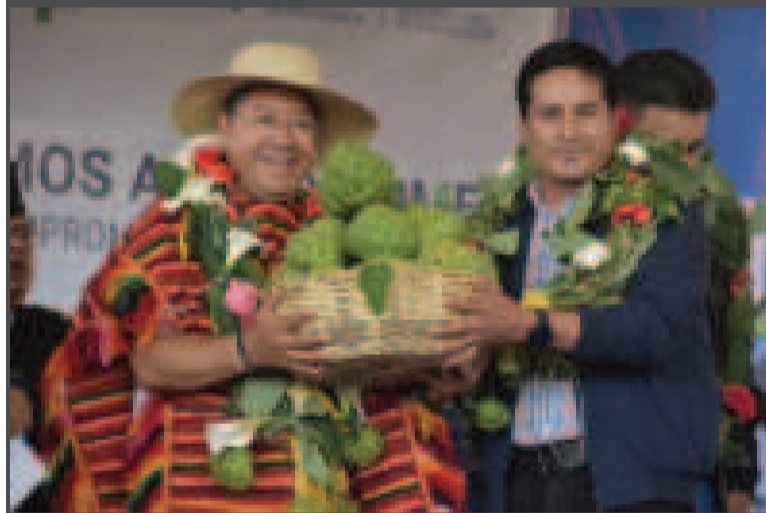
El presidente Luis Arce recibe un presente de la producción de chirimoya de Presto.

“También se entregó el sistema de riego tecnificado por goteo que beneficiará a pequeños productores de manzana en el municipio de Presto, la obra fue ejecutada a través de los programas Empoderar, IPDSA, Iniaf y Senasag, con una inversión total de Bs 473.262,00”, informó la cartera de Estado.