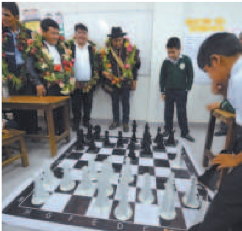
El Vicepresidente en una partida de ajedrez con estudiantes de Mojocoya, Chuquisaca.