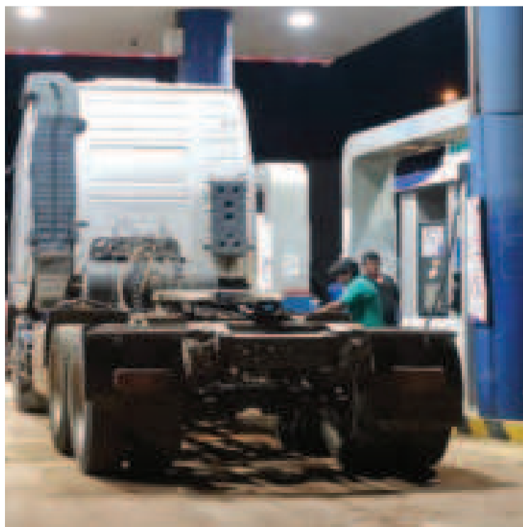
Venta de diésel en una estación de combustible en Santa Cruz.