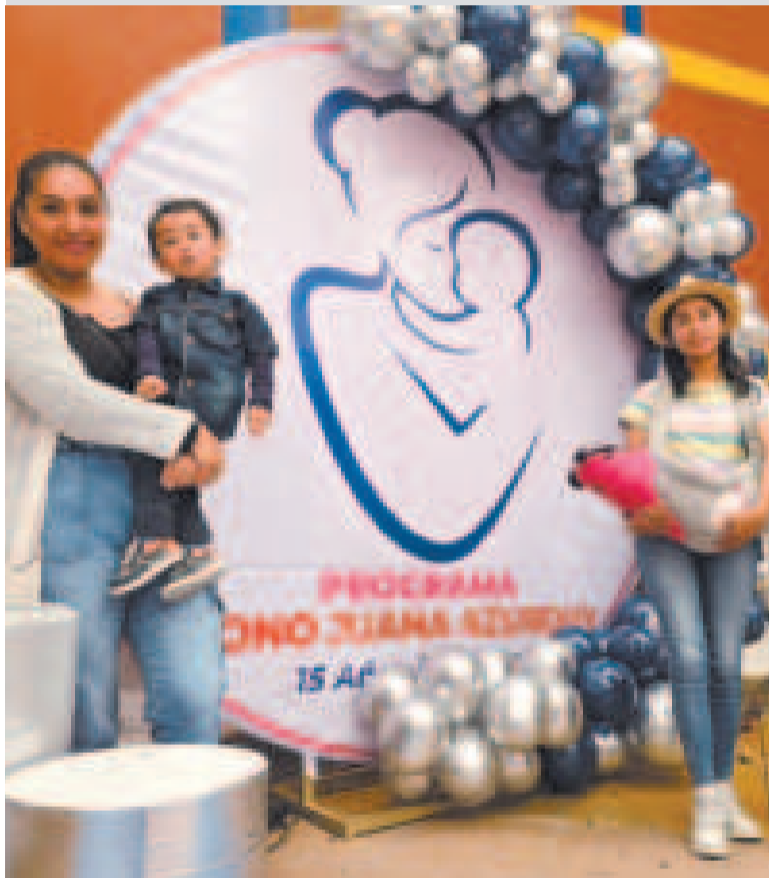
Madres durante el festejo del aniversario de este beneficio nacional.