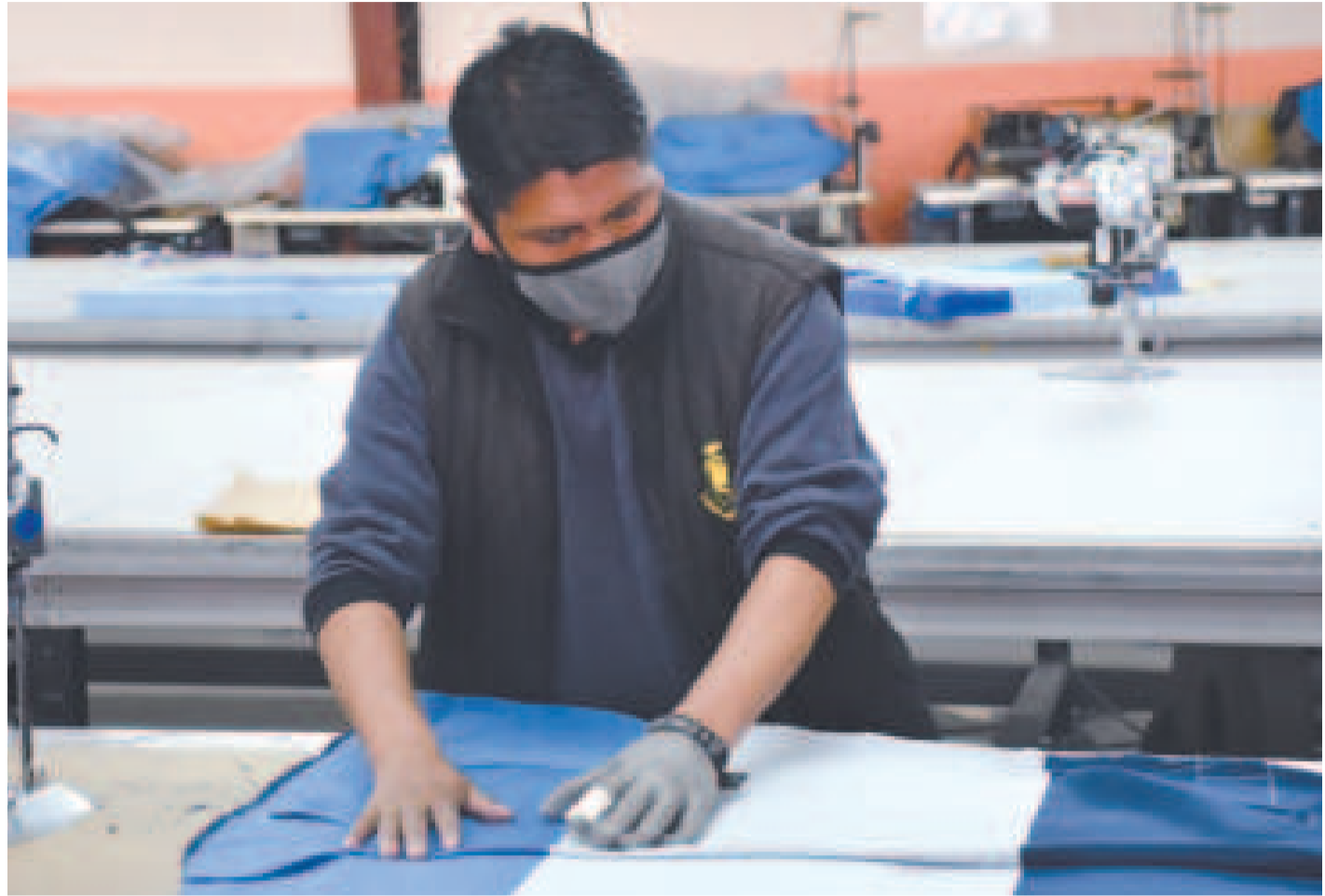
El sector de la micro y pequeña empresa se beneficia de los programas estatales.