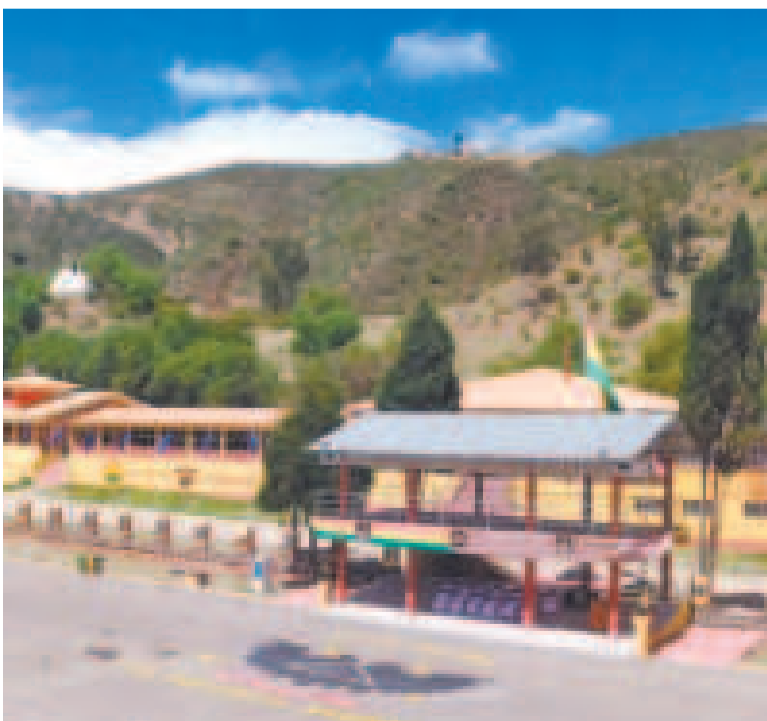
El Liceo Militar en Sucre.