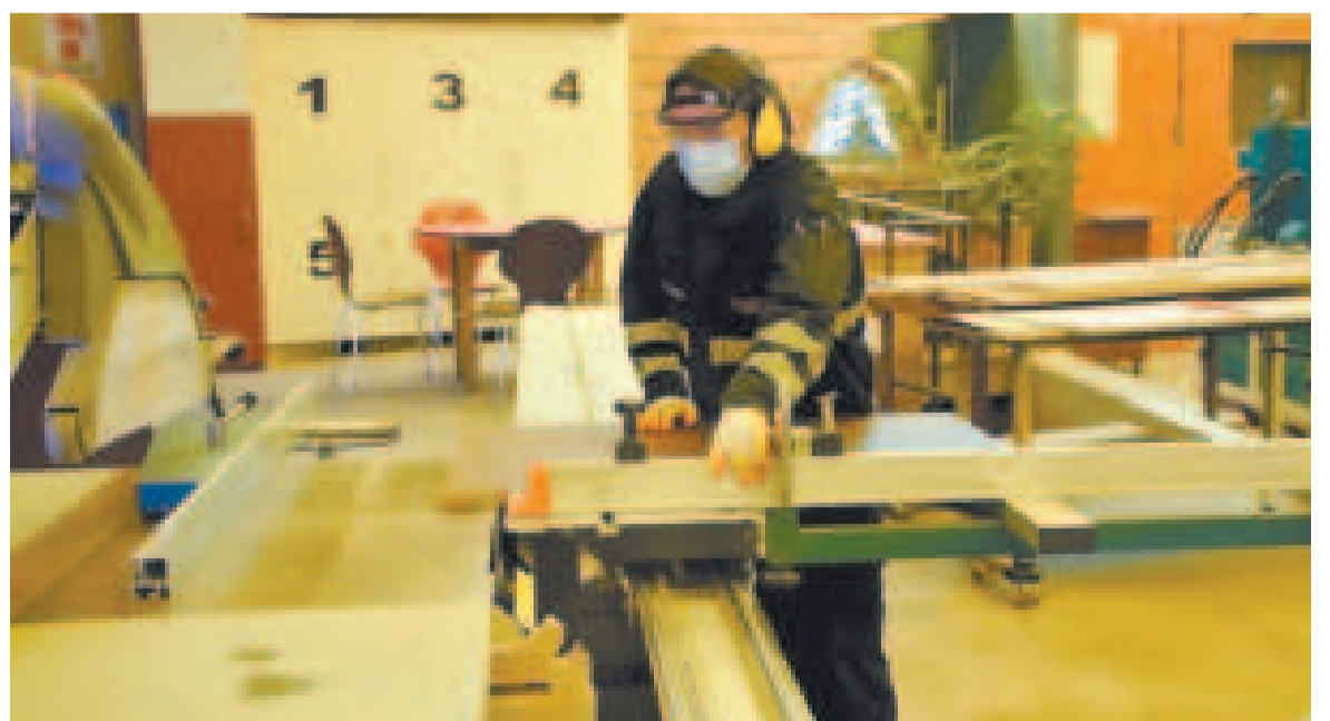
La producción nacional tiene el reto de sustituir importaciones.

La autoridad también señaló que se está trabajando en programas de articula-