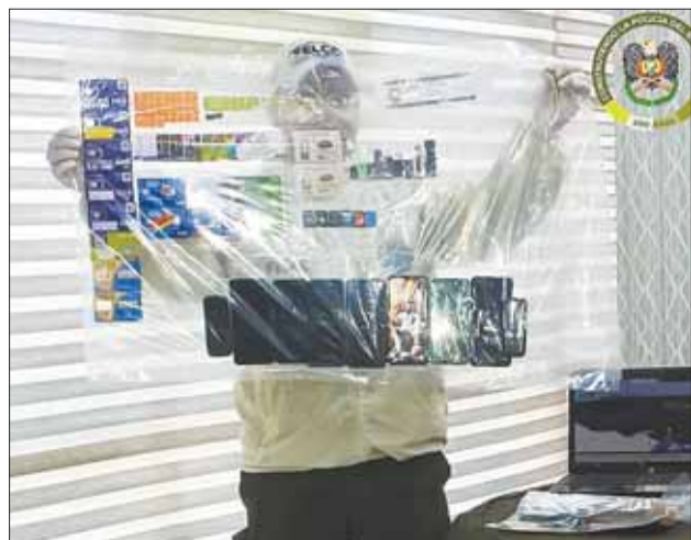
SECUESTRO. Celulares fueron hallados en el operativo.

'Los antisociales operaban desde una granja de click'