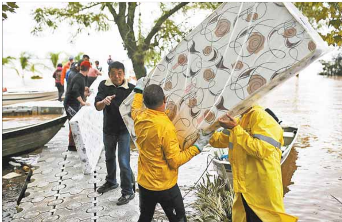
RESCATE. Los trabajos de auxilio no paran, pese a que las lluvias siguen, pero las aguas bajaron.

Por otro lado, el Gobierno de Brasil puso en marcha un plan de ayuda de 5.100 reales (unos $us 992) para unas 200.000 familias