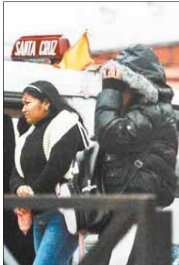
Las temperaturas bajarán.

Las bajas temperaturas seguirán en el país este fin de semana