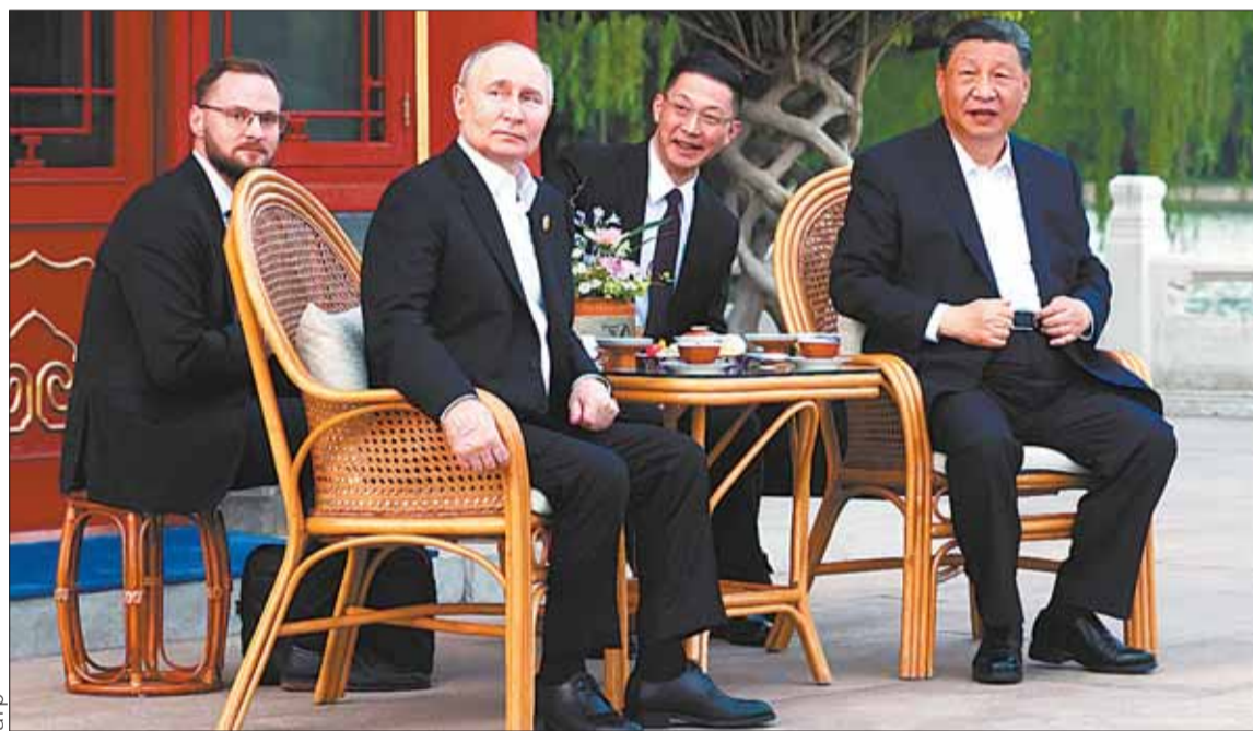
ACUERDOS. Los presidentes de Rusia y China posaron para las cámaras de los medios.