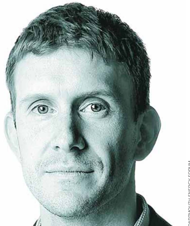
DARTMOUTH ENERGY FORUM

PERIODISTA DE TECNOLOGÍA DEL NEW YORK TIMES