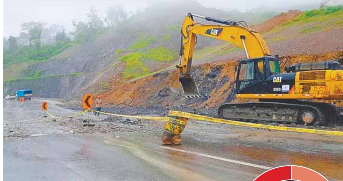
TRABAJOS. Mantenimiento de la nueva carretera entregada en 2023.