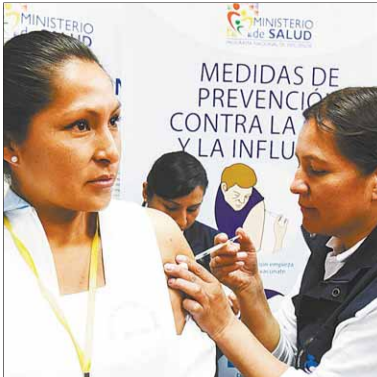
MEDIDA. Personal de salud es parte del grupo beneficiario de esta fase.

Para todos los beneficiados, las dosis están disponibles de forma gratuita en los establecimientos de salud y puntos de inoculación.