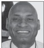
Charles M. Blow es columnista de The New York Times.

En un mitin en Wildwood, Nueva Jersey, Donald Trump dijo que si es reelegido, “deportará inmediatamente” a cualquier manifestante universitario que “viene aquí de otro país y trata de traer el yihadismo, el antiamericanismo o el antisemitismo”. Por supuesto, Trump se basa en la imprecisión lingüística. ¿Qué significa “tratar de traer”? ¿Estamos utilizando sus definiciones de yihadismo, antiamericanismo y antisemitismo? ¿Cómo se monitorearían esos sentimientos? ¿Las deportaciones serían extrajudiciales? ¿Las deportaciones serían solo de titulares de visas de estudiantes o incluirían a titulares de tarjetas verdes?