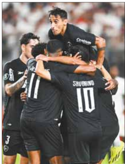
Los jugadores de Botafogo celebran.

El cuadro brasileño anotó su nombre en los octavos de final de la Libertadores