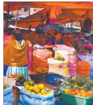
Alimentos de la canasta familiar.

Ante la consulta del porqué los precios de algunos alimentos como la cebolla y la carne de res se incrementaron en algunos centros de abasto, el Ministro indicó que hay algunas personas, principalmente los intermediarios, que especulan con el costos los productos.