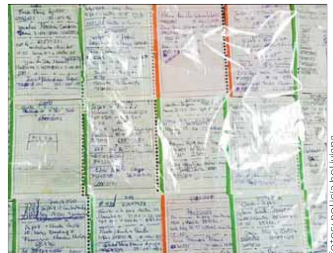
REGISTRO. Los estafadores anotaban nombres de víctimas.