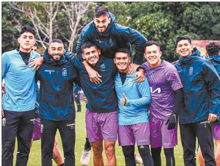
CONFIANZA. Los jugadores de Blooming, en su complejo deportivo.

Los dirigidos por el argentino Carlos Bustos saben sobre la necesidad que se tiene para conseguir una clasificación internacional, por eso, todo punto sirve, pero cuando