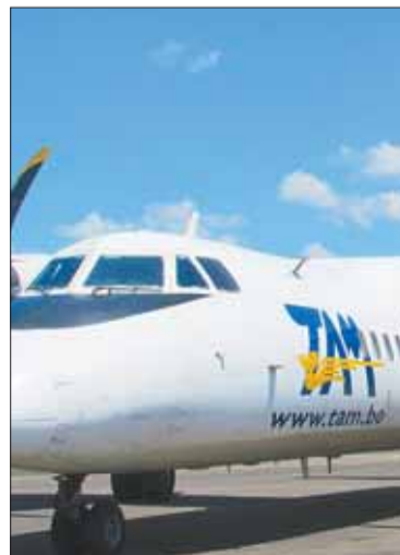
Una aeronave del TAM (archivo).

Cubrirá las rutas entre La Paz, Cochabamba, Santa Cruz y Cobija (Pando)