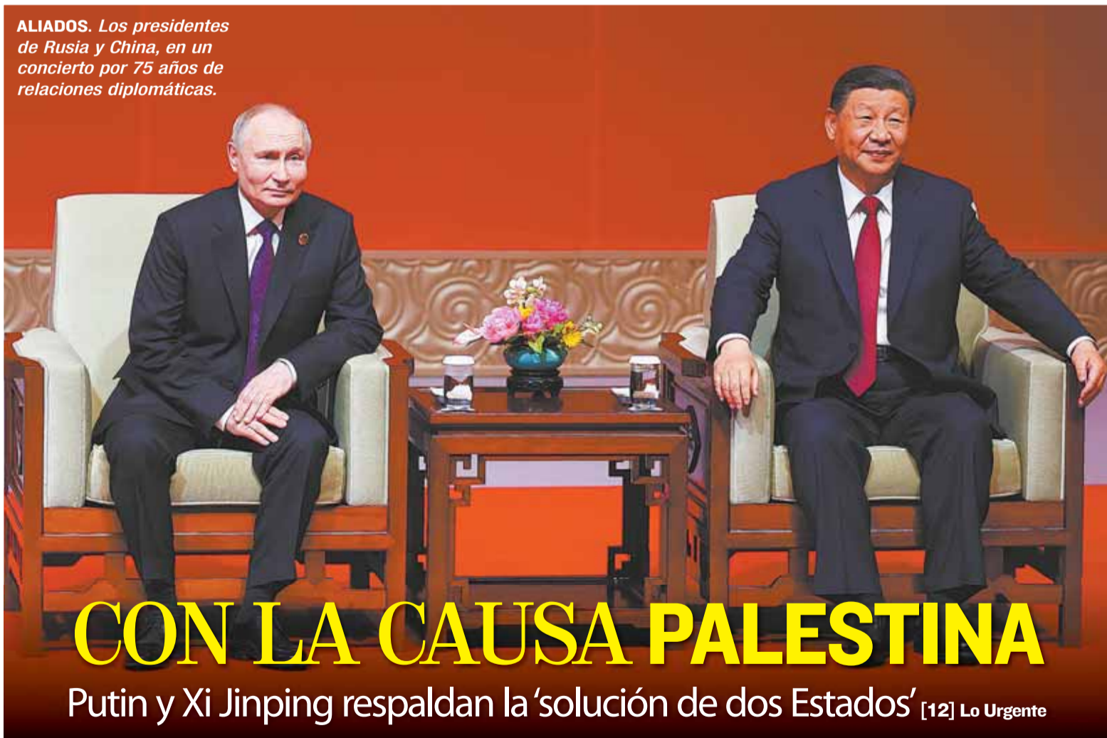
ALIADOS. Los presidentes de Rusia y China, en un concierto por 75 años de relaciones diplomáticas.

Representante de empresa es aprehendida en el caso YLB