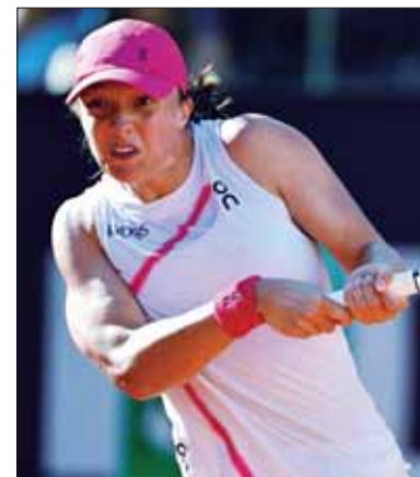
La tenista polaca Iga Swiatek.