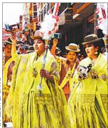
Cientos de bailarines participarán.

Más de 75 fraternidades harán su paso por el recorrido en La Paz