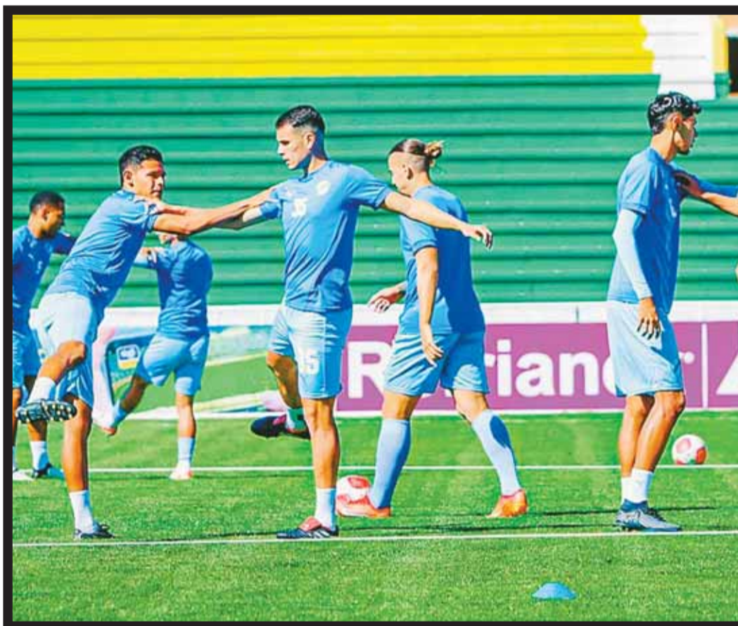
PREPARACIÓN. Los jugadores de Bolívar durante un calentamiento muscular en el estadio Patria.

El plantel regresó dolido, pero firme y convencido de sumar ante Palestino en casa