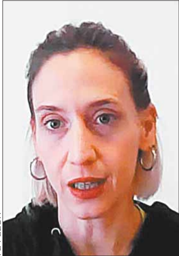
Trabuco en LA RAZÓN.