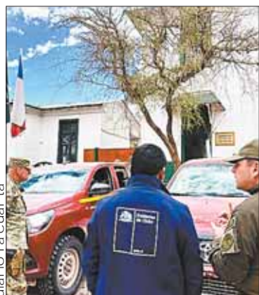
Las camionetas recuperadas.

ECONOMÍA. Autoridades de Chile afirman que llevaban coches robados