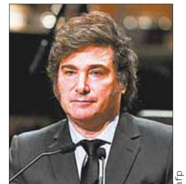
Milei se va de viaje a España.

"La fuerte implicación y la aplicación decidida por parte de las autoridades de su plan de estabilización están dando resultados mejores de lo esperado", afirmó Julie Kozack, directora de comunicaciones del Fondo en rueda de prensa en Washington. Citó el primer superávit fiscal trimestral en 16 años, la "rápida recuperación" de las reservas internacionales y una mejora del balance del banco central, así como una rápida reducción de la inflación, que pasó del 25% en diciembre al 8,8% en abril.