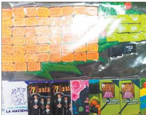
CHIPS. Más de 80 tarjetas SIM fueron secuestradas.