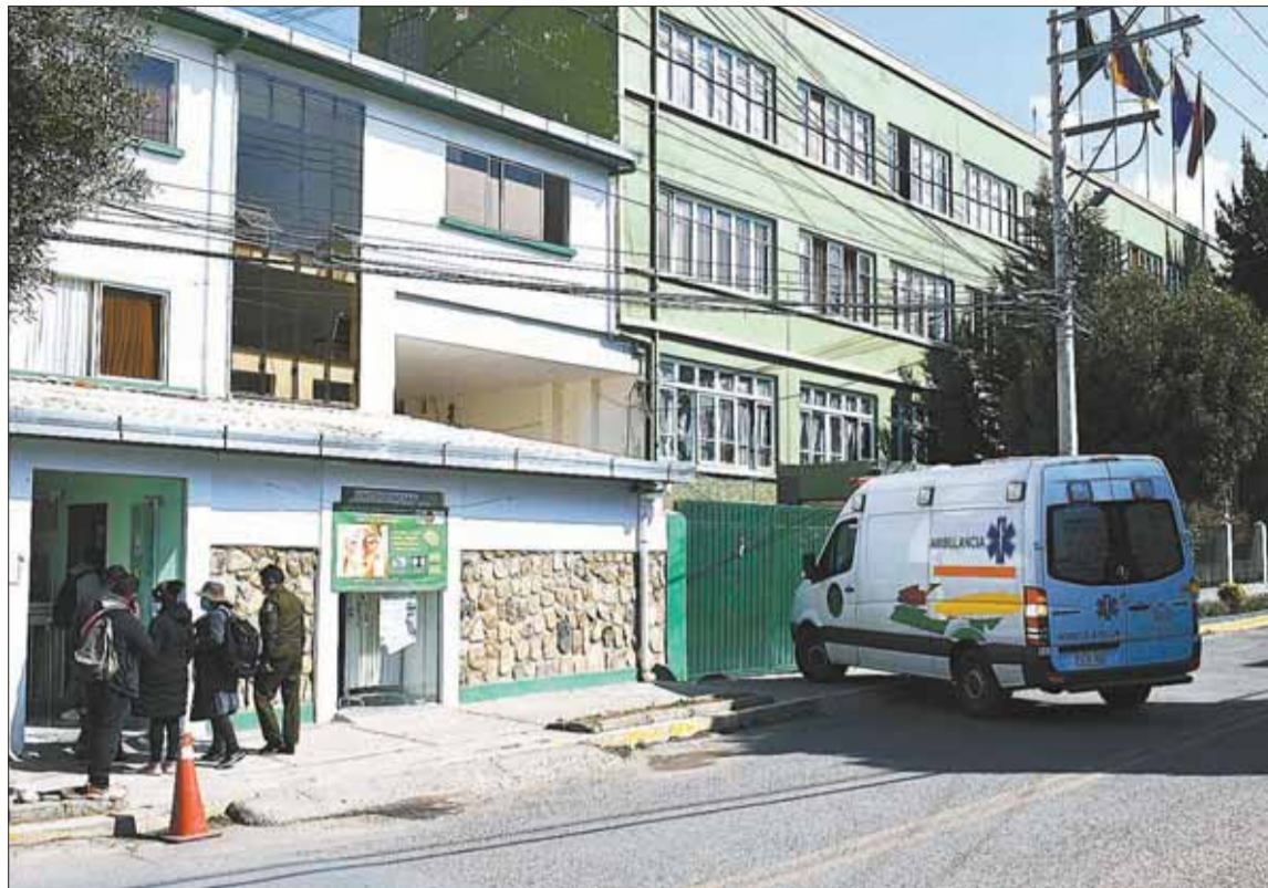
PREVENCIÓN. Una ambulancia ingresa a la Academia Nacional de Policías, tras los casos de meningitis.