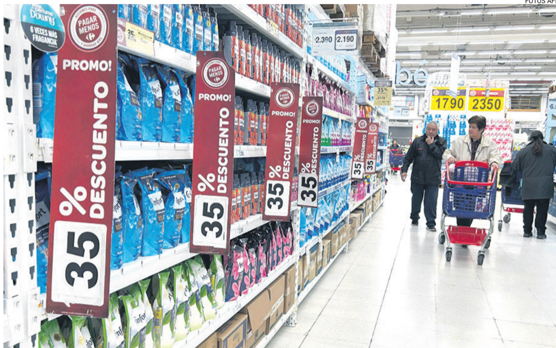
La desaceleración de la inflación es motivo de elogios de parte de los organismos financieros

grande de la historia de la humanidad", aseguró Milei en el Consejo Interamericano de Comercio y Producción.