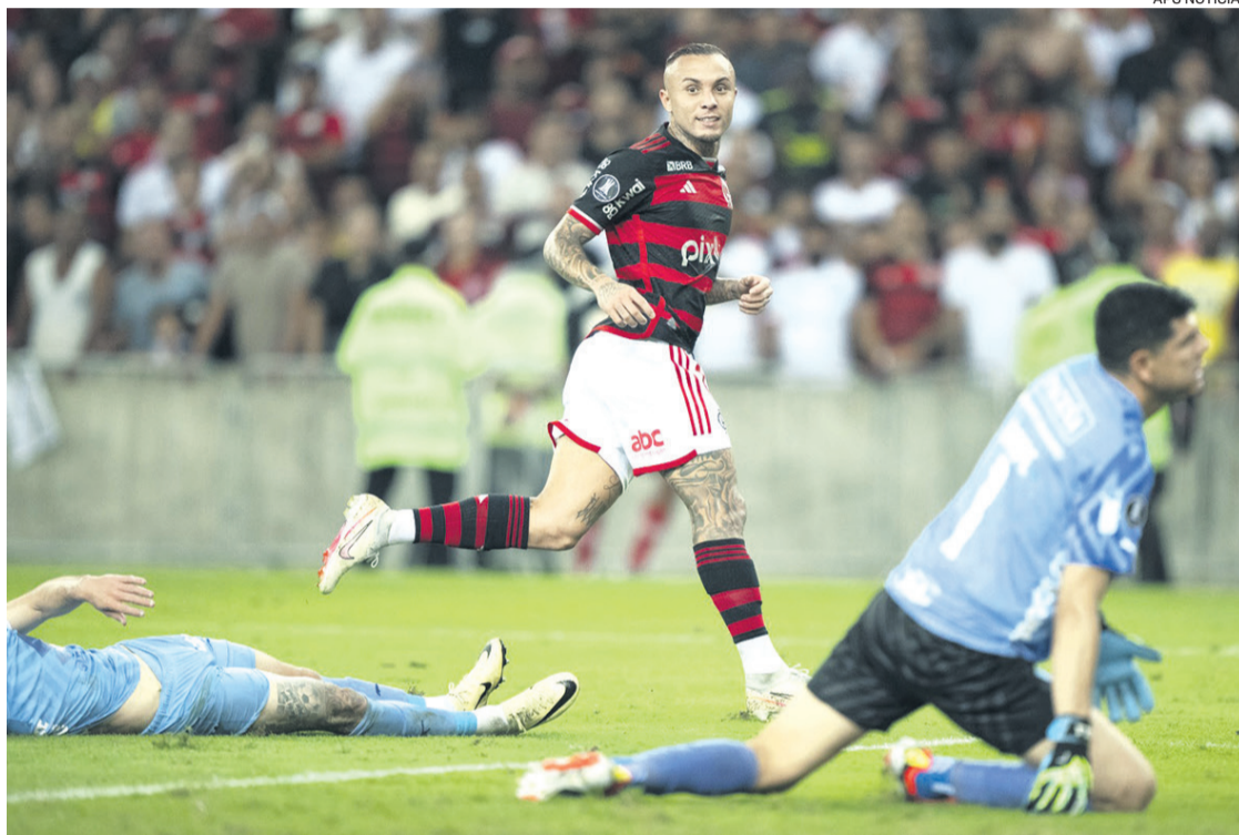
Bolívar no jugó bien y terminó goleado. Dio licencias en la última línea y las acabó pagando. Recibió un gol antes del primer minuto

Hasta que a los 39' llegó el 2-0 a través de Ayrton Lucas que aprovechó un despeje corto de Orihuela para liquidar a un expuesto Lampe. No todo acabó ahí, ya que Bolívar decayó y le permitió a Pedro y al mismo Gerson volver