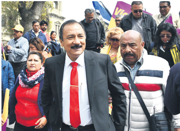
Vicente Cuéllar es uno de los candidatos en carrera presidencial

el 58% de los consultados no avala ningún nombre para ser el próximo candidato que enfrente al partido oficialista. Sin embargo, el mayor porcentaje, con apenas el 14,8%, eligió al alcalde de Cochabamba, Manfred Reyes Villa, como aquel que estaría “más capacitado” para derrotar al MAS.