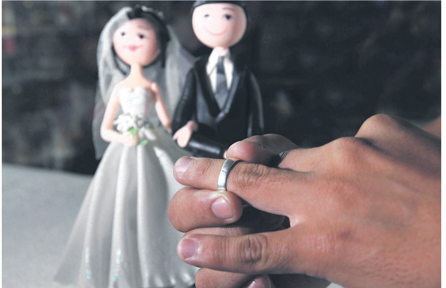
La separación de los padres provoca traumas en los hijos. Un proyecto de ley pretende regular las visitas paternas

Ningún frente político del país mostró unidad. Todos están divididos