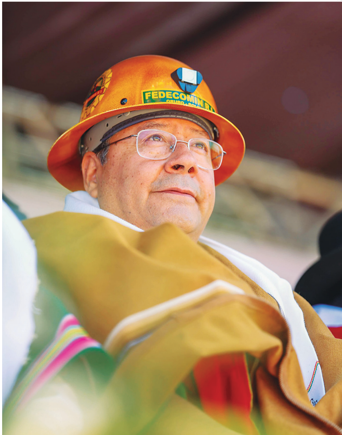
Arce derogó el Decreto Supremo 5143, pero no consiguió calmar a sectores movilizados

Identifican dos decretos y dos proyectos de ley que supuestamente atentan contra el derecho a la propiedad privada de los ciudadanos