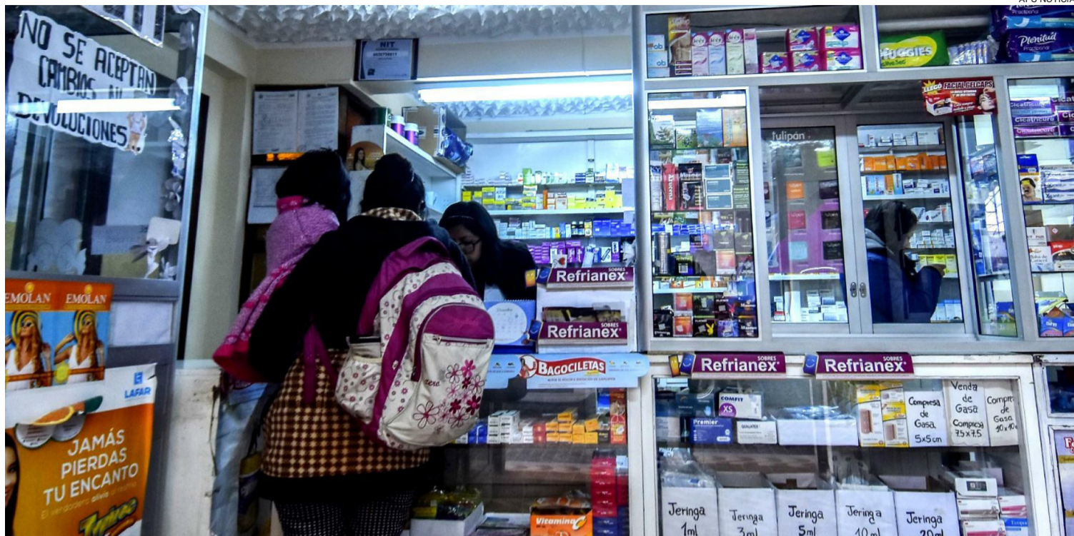
Laboratorios e importadoras hicieron llegar notas a las farmacias para informarles sobre ajustes en los costos de los productos