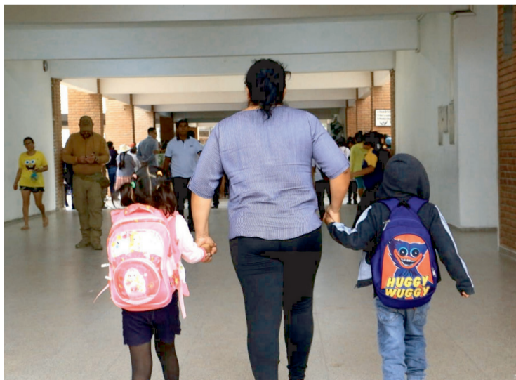
Los estudiantes ingresarán media hora después del horario habitual

El horario de invierno consiste en un ingreso media hora más tarde y una salida media hora antes de lo habitual. “Esto significa que, si una unidad educativa ingresa a las 7:30, ahora ingresa a las 8:00 y