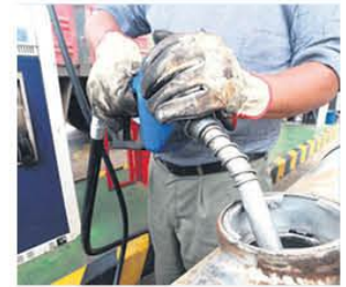
Bolivia importa diésel

bricantes, farmacias e importadoras de medicinas y aseguran que ellos pueden acceder a dólares en el Banco Unión. A8