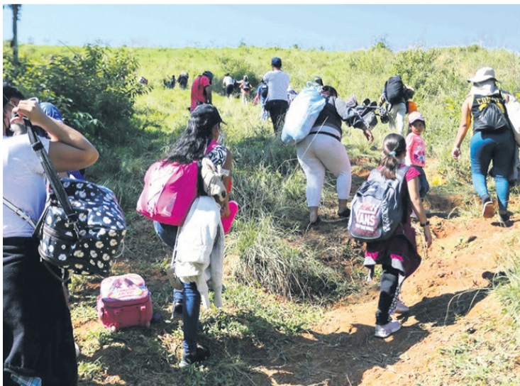
La migración hacia Estados Unidos es una cuestión de preocupación

Esto ha llevado al gobierno de Biden a emitir una alerta para notificar a las aerolíneas, operadores de vuelos chárter, agentes de viajes y proveedores de servicios sobre las formas en que las redes de tráfico de migrantes explotan los servicios de transporte para facilitar la migración irregular.