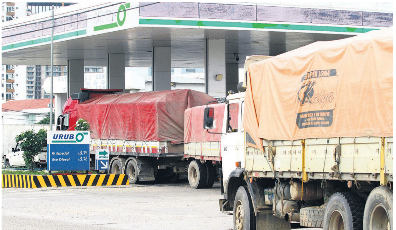
El transporte urbano cruceño denunció que las filas que se registran en los surtidores de Santa Cruz de la Sierra son de hace varios días

“¿Qué es lo que está pasando con el dólar? Todos los importadores y privados están pagando sus fletes en dólares y el transportista debería recoger en dólares”, cuestionó.