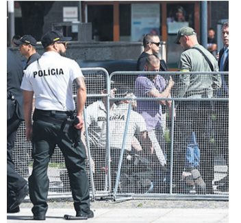
Arresto del autor del atentado

"Una de las cosas que más nos ponderó el FMI es cómo todos los días levantamos restricciones en el mercado de cambios", añadió.