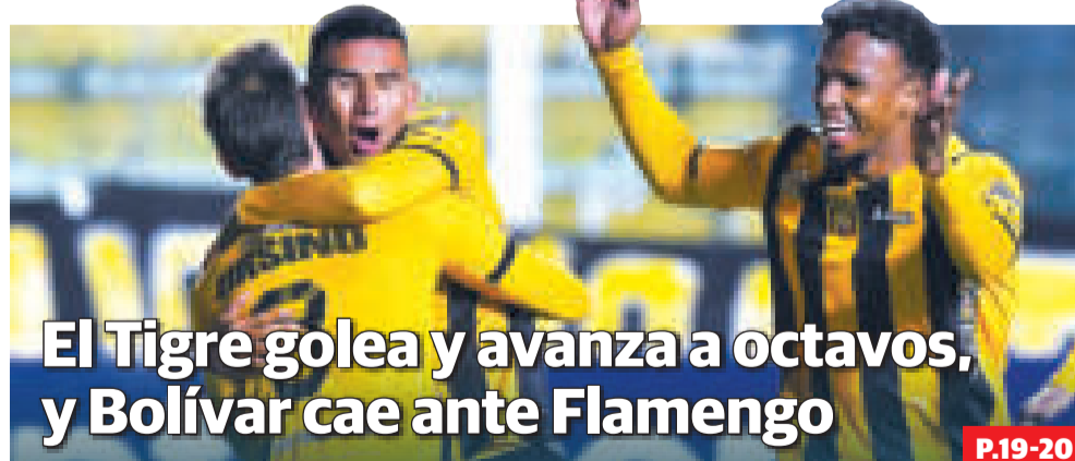
El Tigre golea y avanza a octavos, y Bolívar cae ante Flamengo