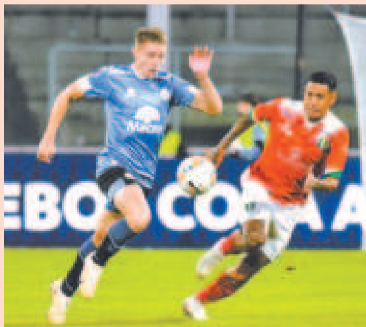
Una incidencia del cotejo entre Belgrano y Real Tomayapo, que se jugó en Córdoba.