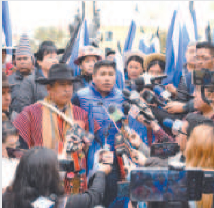
El Pacto de Unidad con la nueva directiva del MAS-IPSP.

lo “inhabiliten” como candidato presidencial.