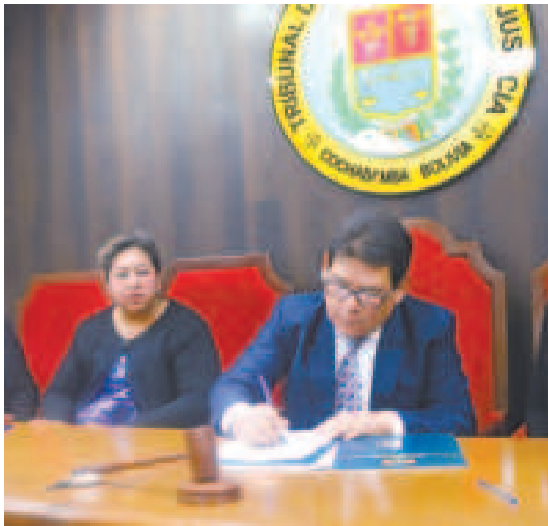
Firma de convenio entre el TDJC y la Fundación Oapsi.