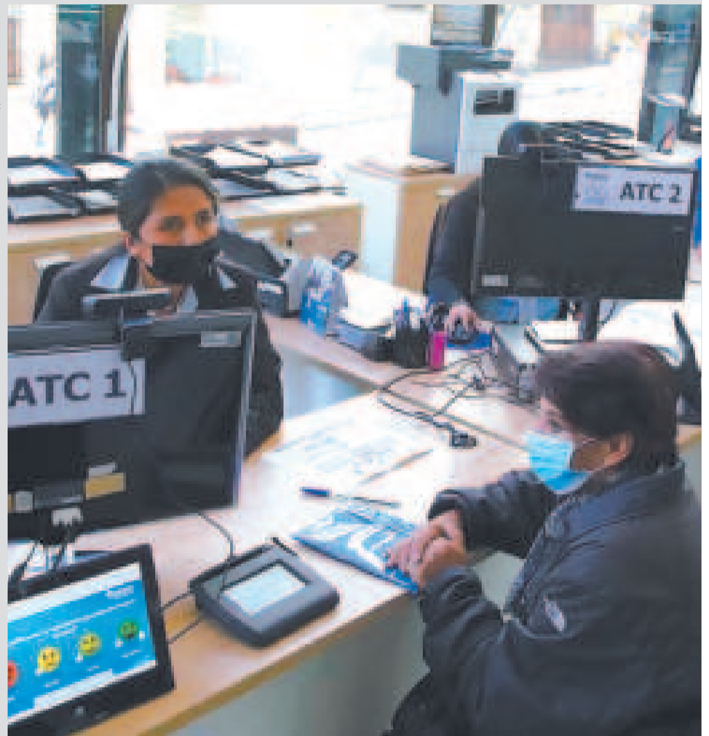
La atención a los asegurados mejoró con el incremento de las oficinas.