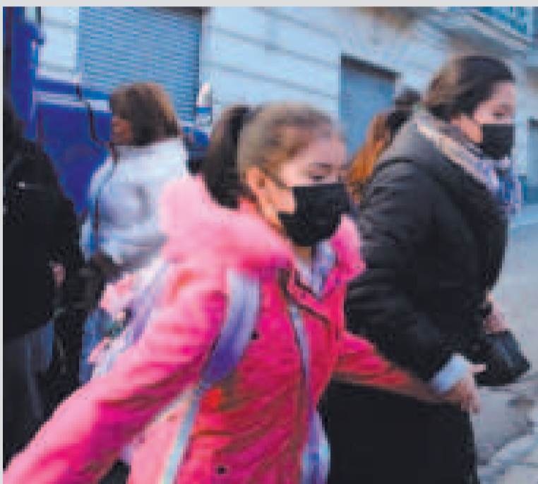
Los padres de familia deben asegurarse de que sus hijos vayan abrigados al colegio.