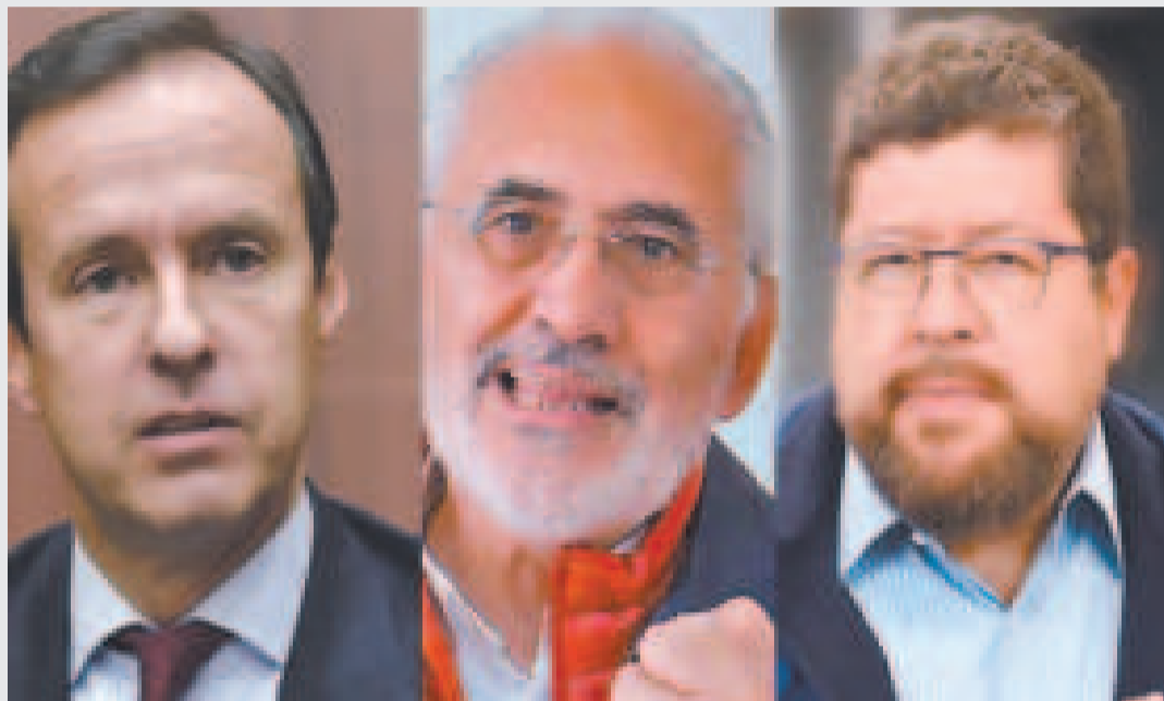
Jorge Quiroga, Carlos Mesa y Samuel Doria Medina.