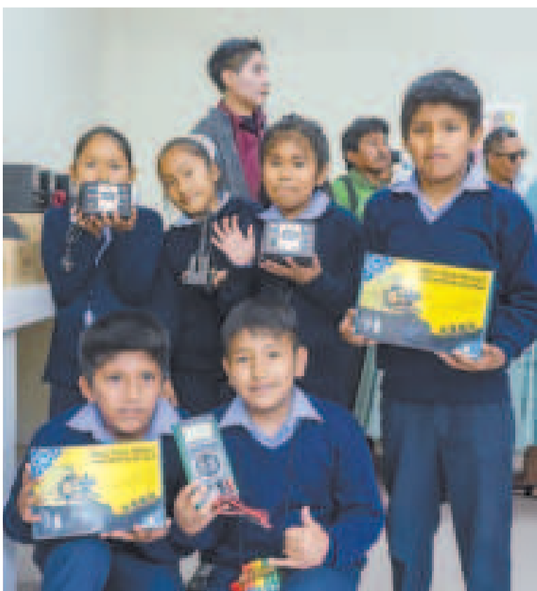
Los niños durante la inauguración del CCIT.

La implementación de estos centros es parte del programa Sueño Bicentenario, destinado a destacar el potencial humano del país y la democratización de la tecnología, deporte, cultura, entre otros ámbitos de desarrollo.