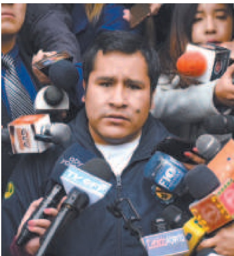
El presidente de la Cámara de Diputados, Israel Huaytari.

El legislador comentó que no es la primera vez que lo atacan, pero espera que todo se aclare.