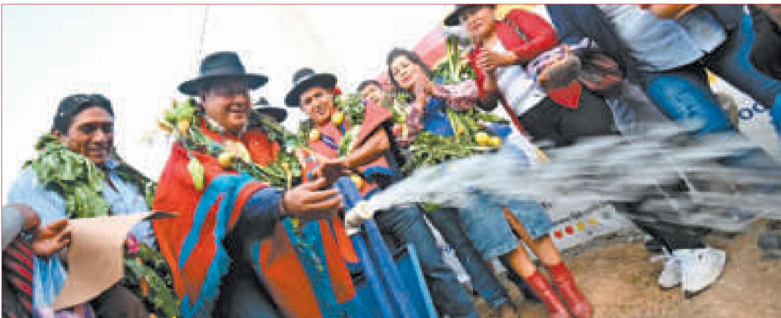
SE INAUGURÓ LA PLANTA DE TRATAMIENTO DE AGUAS RESIDUALES DE YOTALA