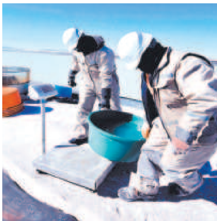
Trabajos de la estatal YLB en el salar de Uyuni, Potosí.

DÍAS HÁBILES tienen las empresas para presentar documentación sobre sus estados financieros.