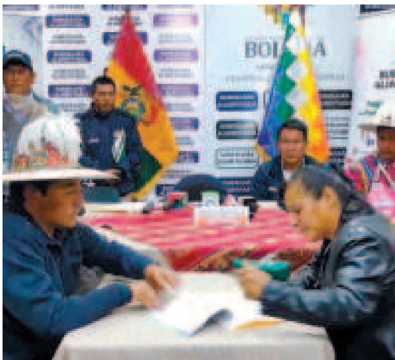
Las autoridades durante la firma del convenio en La Paz.