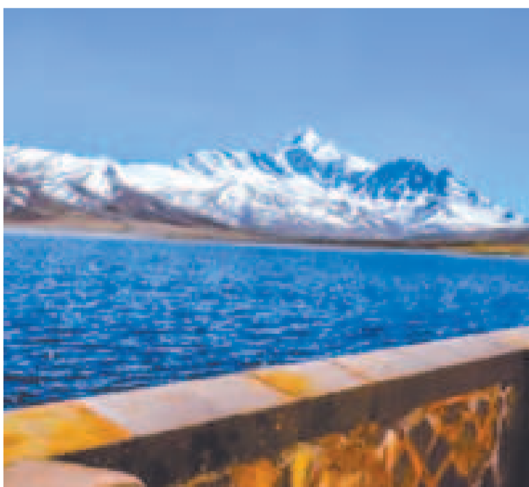
La represa de Milluni.