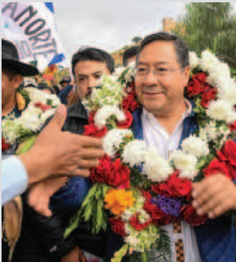
El presidente Luis Arce Catacora.