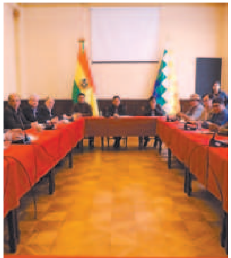
Una reunión anterior con los jefes de bancada de los partidos en la Vicepresidencia.

Los senadores que responden a la línea del expresidente Evo Morales y a las bancadas opositoras de Creemos y Comunidad Ciudadana (CC) fracasaron ayer en su intento de aprobar una ley corta interpretativa de la 1549 Transitoria para las Elecciones Judiciales 2024 por trámite de dispensación en la sesión que se instaló en la Cámara Alta.