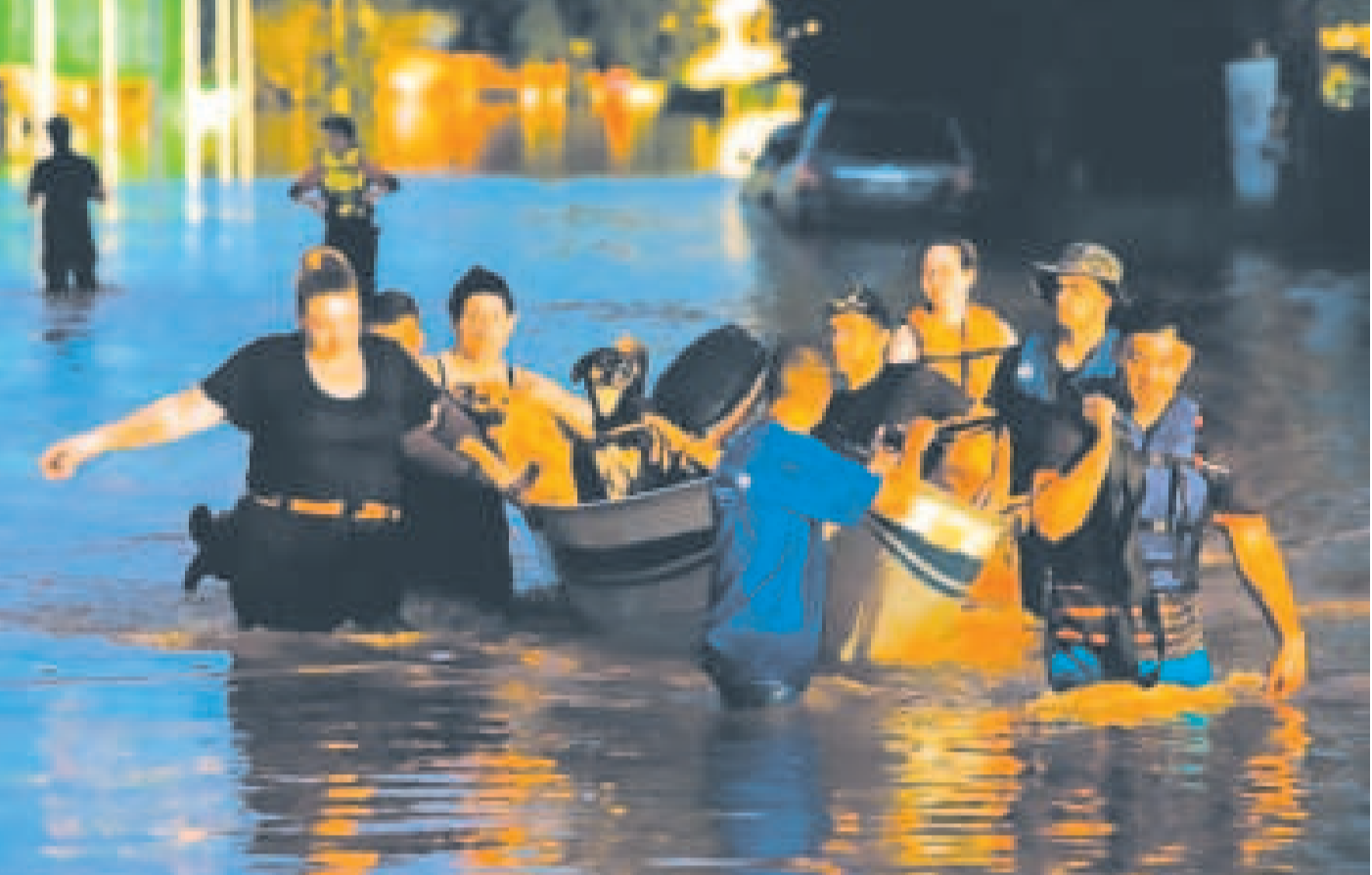
Brasileños afectados por las fuertes lluvias que han provocado inundaciones históricas en el estado de Rio Grande do Sul.

Novillo dijo que la ayuda será recogida en cooperación entre los distintos ministerios. El Ministerio de la Presidencia, a través de la Unidad de Acción Comunitaria de Gestión Solidaria, donará 10 mil kilos de leche en polvo, 10 mil kilos de arroz, 2.500 kilos de frijol, 1.500 unidades de carpas de lona, 1.000 unidades de tiendas de campaña y 2.000 unidades de mantas.