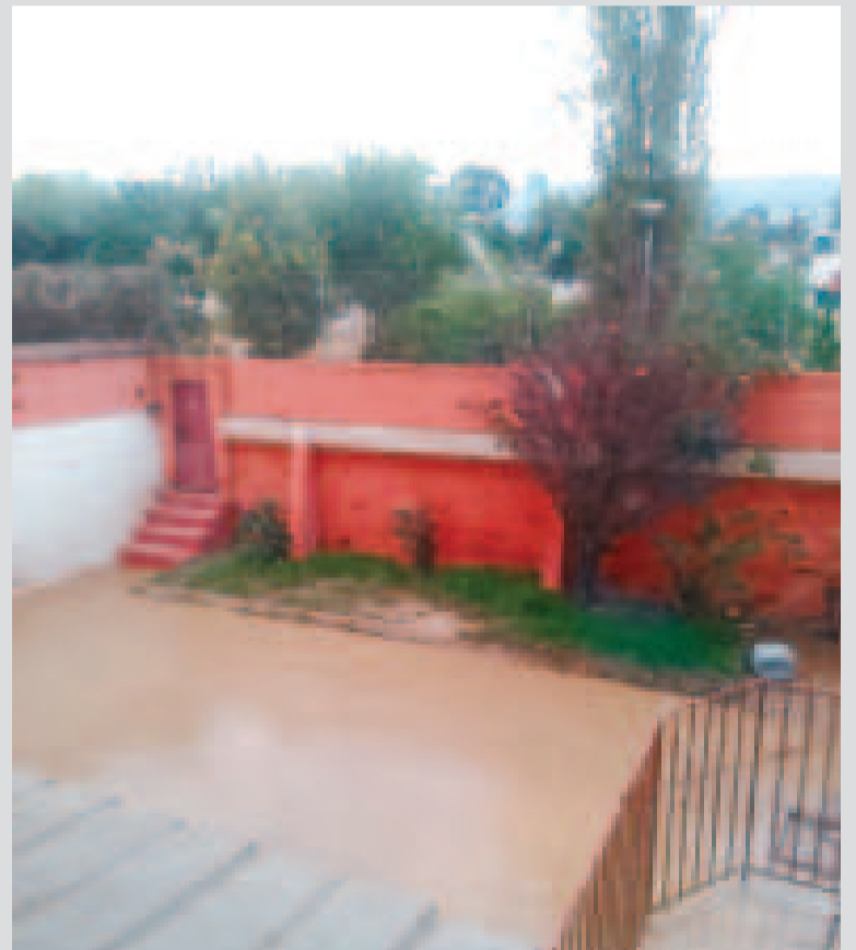
El patio de una de las casas afectadas completamente inundado.

Los vecinos pidieron al municipio parar los trabajos de la avenida para utilizar los recursos en la limpieza del río Remedios y en habilitar el sector. “Nunca nos había pasado algo así y ahora ya es la tercera vez que se inunda el barrio”, dijo una afectada.