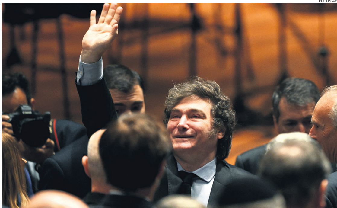
El FMI dice que los resultados del gobierno argentino de Javier Milei son 'mejores de lo esperado'

La organización internacional considera que las autoridades argentinas "han realizado esfuerzos