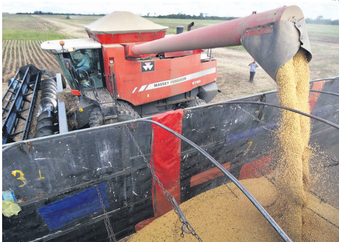
El sector exportador en Bolivia es uno de los más afectados, entre muchos otros, por la falta de divisas.

Según Montenegro, se convocó al sector de venta externa para expresar la molestia e inquietud porque muchos de los exportadores no están trayendo el 100% de los ingresos por las exportaciones al país. "Se ha establecido que muchos de ellos no traen el 100% (de los dólares) y obviamente eso está generando un problema en la disponibilidad de divisas, porque uno de los compromisos era aperturar (sic) las exportaciones de oleagi-