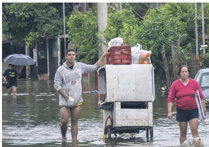
El drama para los damnificados en el sur brasileño se acentúa

Lula suspendió una visita oficial a Chile, inicialmente prevista para el 17 y 18 de mayo, ante la necesidad de "monitorear" la emergencia, según la Presidencia. Y