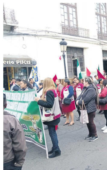
El congreso se realizó en la capital tarijeña

El dirigente no descartó que, a mediados de la próxima semana, se acate el bloqueo de carreteras