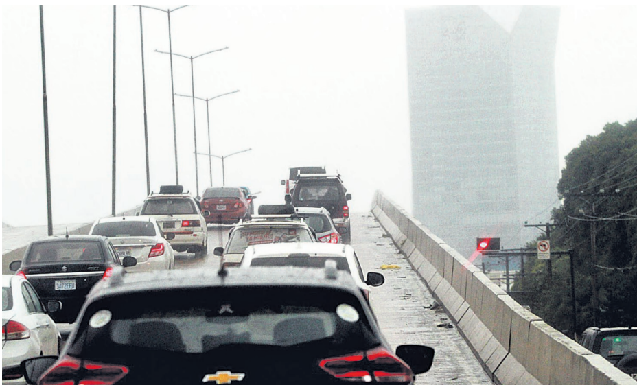
La poca visibilidad por las condiciones climatológicas que se registran en la ciudad