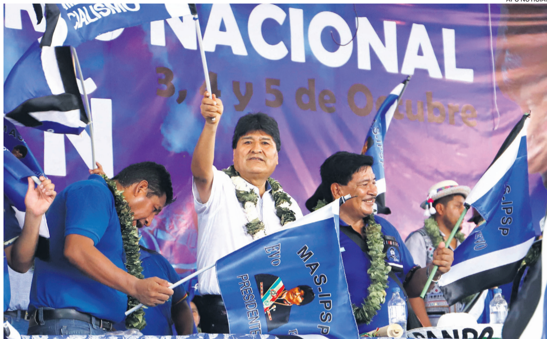
Evo Morales reunirá a sus bases en un nuevo congreso para extender su poder en el MAS

Si hay prorrogados, no habrá elecciones judiciales y si hay elecciones judiciales, Arce pierde poder