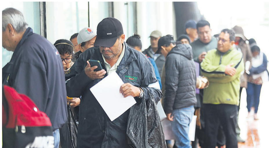
La gente espera atención, soportando el frío, en las oficinas de la Gestora Pública

“Estamos iniciando el mes de mayo y se nos viene la época más cruda o más fría, que es en junio y julio”, detalló el director departamental de Educación en un encuentro con medios.