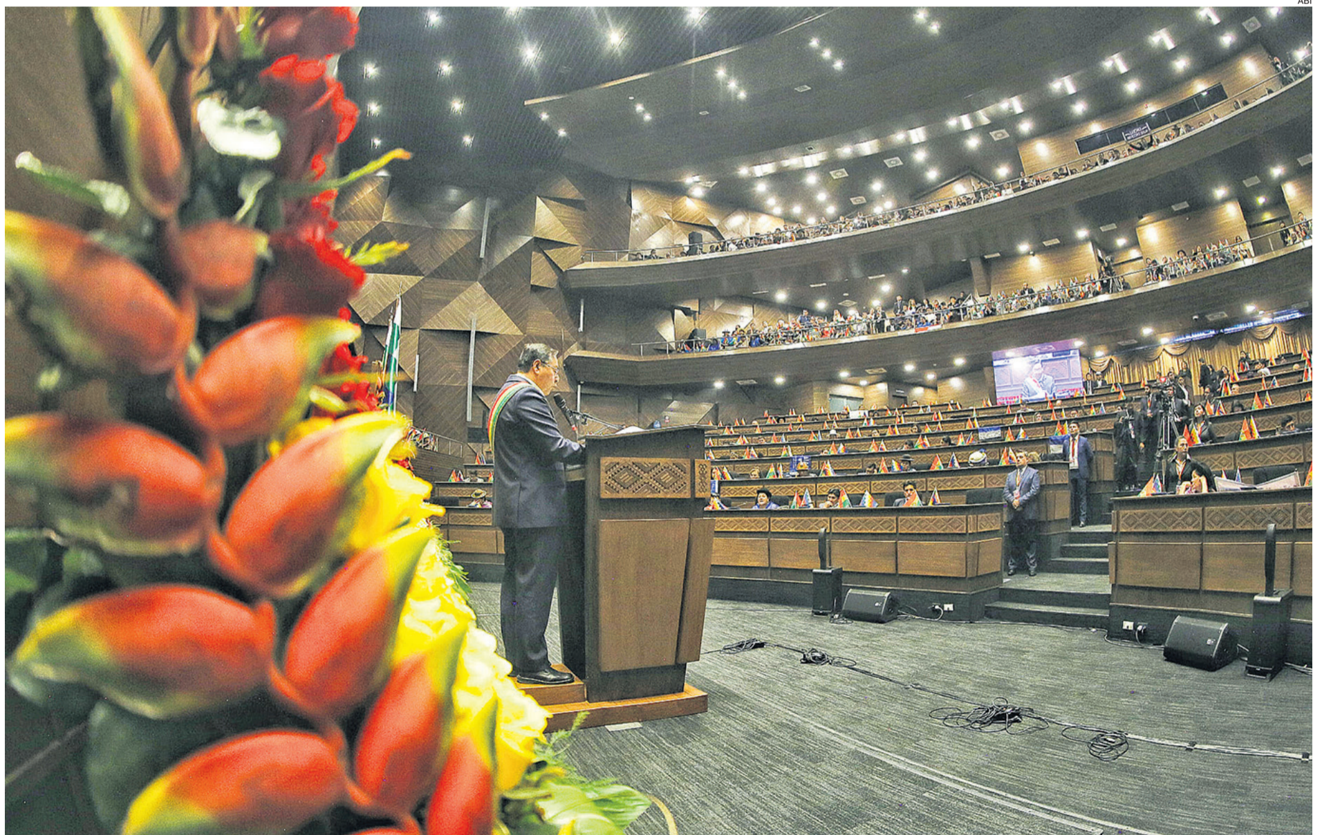
Arce presenta informe de gestión en la Asamblea Legislativa Plurinacional. La crisis interna del MAS resta peso a la ALP refuerza el protagonismo del Tribunal Constitucional

"El objetivo final de Lucho (Luis) Arce es mantenerse en el poder el 2026 con o sin elecciones y el instrumento que va operativizar ese plan son los magistrados auto prorrogados que también se van a mantener hasta 2026. Los requiere a los magistrados para que ellos legalicen este plan ma-