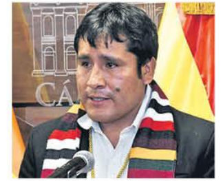
Huaytari preside a Diputados

de provisión del grano de oro afectará los eslabones que generan riqueza y fuentes de empleo. DINERO 4-5