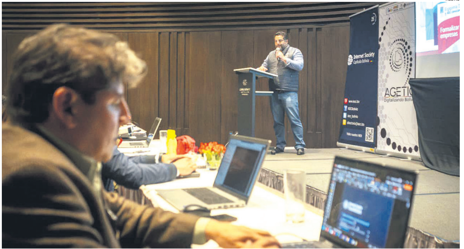
La licitación de los servidores por parte de Agetic se mantiene vigente a pesar de frenarse el Decreto sobre Derechos Reales

"Llevar adelante la adquisición de una Infraestructura Tecnológica de misión crítica, suficiente y ne-