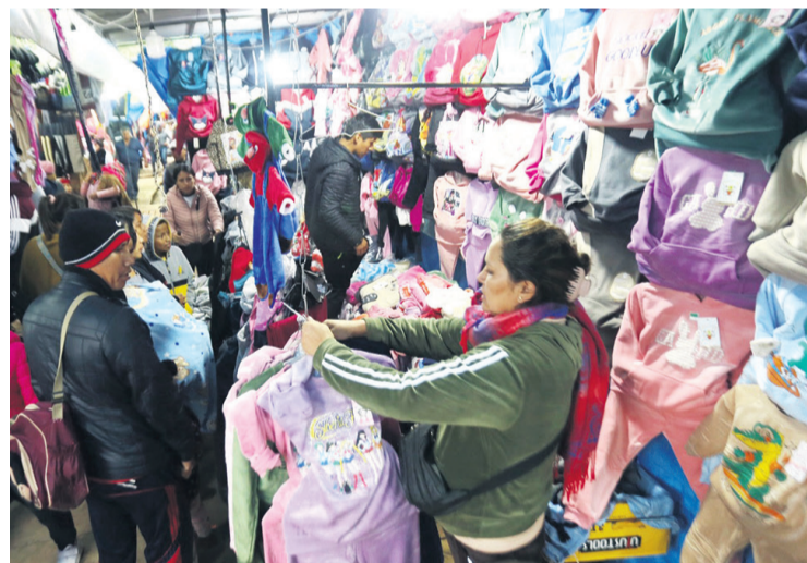
La gente busca abrigos en la feria de invierno en la zona de Alto Pedro

Las personas también se ven obligadas a hacer filas para los trámites