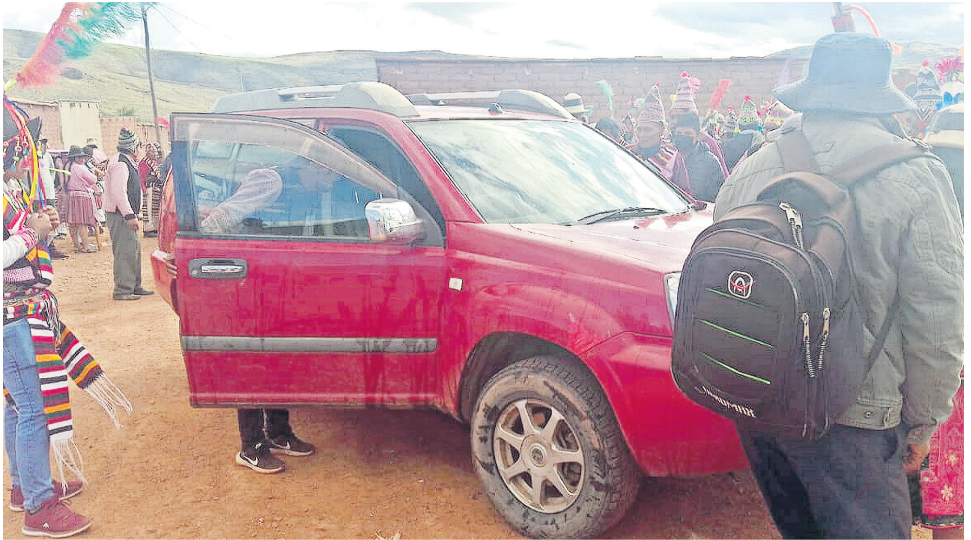
El 13 de marzo de 2023 entregó un vehículo indocumentado a dirigentes de la subcentral Humajila del municipio de Macha

CALIFICA COMO FALSOS LOS DOCUMENTOS EN SU CONTRA