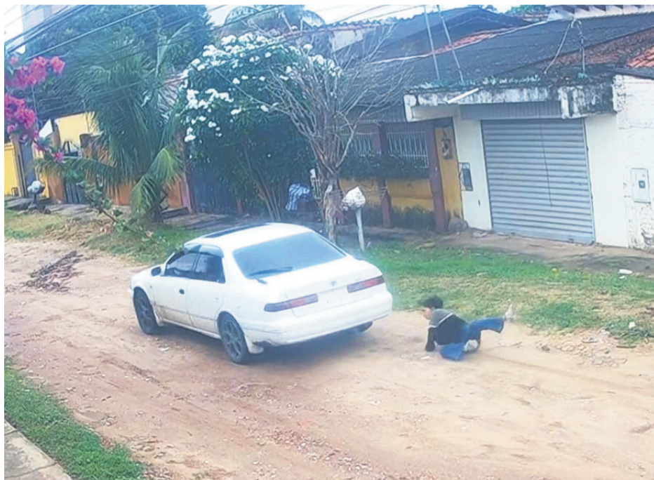
Las cámaras de seguridad capturaron a la estudiante colgada de la puerta trasera del vehículo mientras es arrastrada. En la segunda gráfica, la adolescente cae y el auto se aleja