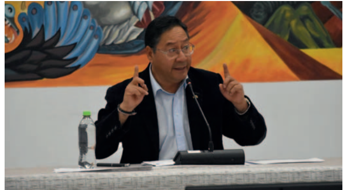
El Presidente Arce en conferencia de prensa

“Tenemos que construir, y ese es el modelo que estamos llevando a cabo en nuestra gestión”, expresó el Presidente Arce durante la conferencia de prensa.