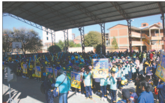
El acto central se realizó en la cancha de la escuela Ferroviaria

En el acto central, se realizó el encendido del fuego olímpico, así como la promesa deportiva. Los pequeños concluyeron con el desfile de los diferentes cursos para luego dar inicio a los primeros encuentros programados para esta primera fecha.