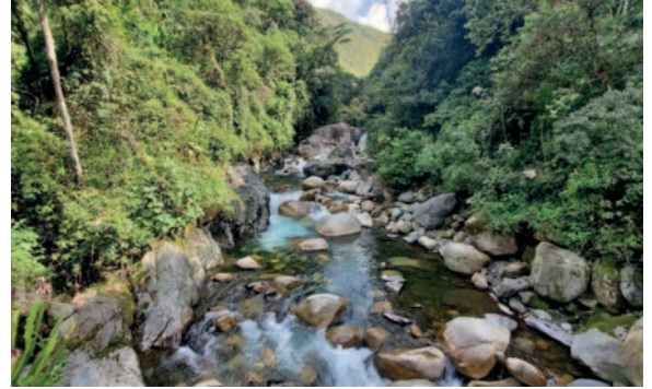
Las denuncias de posible actividad minera ilegal se hicieron en RRSS

continúa con su labor preventiva para desarticular posibles actividades mineras ilegales. Esta acción refleja el compromiso de la Autoridad Minera en proteger los recursos naturales.