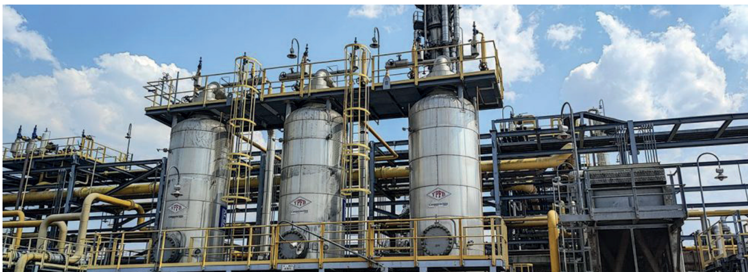
Planta de gas de Yacimientos Petrolíferos Fiscales Bolivianos /YPFB