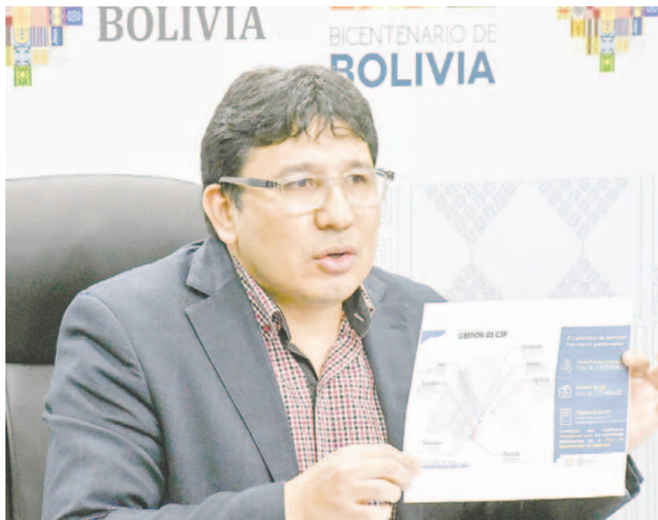
Ministro de Hidrocarburos y Energías, Franklin Molina

Según Molina, se espera que estas negociaciones fortalezcan la relación energética entre Bolivia y Brasil, generando beneficios económicos para ambas naciones. Además, se prevé que esta colaboración impulse el desarrollo y la expansión del sector hidrocarburífero en la región, promoviendo la inversión y el crecimiento sostenible.