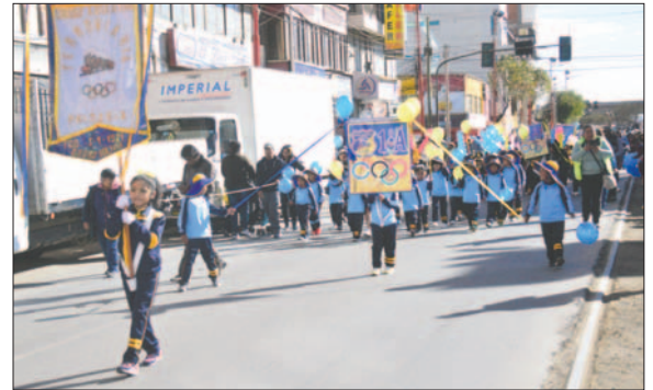
Correctamente uniformados los alumnos participaron en el desfile inaugural

De este modo se llevó a cabo la inauguración del Año Deportivo