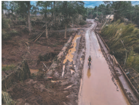
Ciclista pasando por el puente tras inundación por el desbordamiento del río Taquari, en la ciudad de Lajeado en el estado de Rio Grande do Sul en el sur de Brasil

En Rio Grande do Sul se han visto afectados 425 municipios, algunos de los cuales están totalmente sumergidos bajo el agua y donde 6.200 han quedado