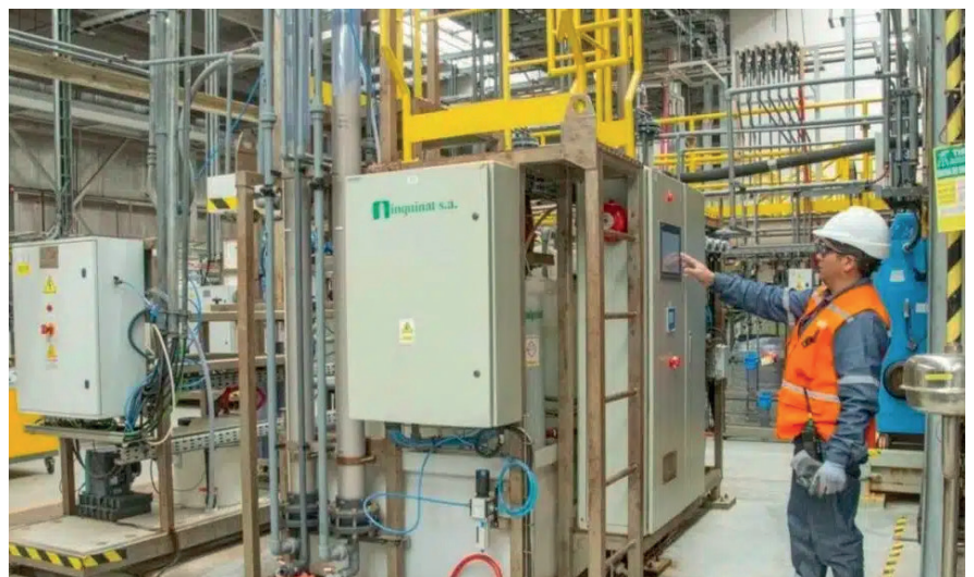
Se registró más de 1.016 puestos de trabajo ocupados por mujeres en el sector, en la Provincia de Salta /rum-BOMINERO.COM

En cuanto a datos adicionales relevantes, se destaca que los esfuerzos tanto del sector público como privado por fomentar la inclusión y políticas de género en la actividad minera han dado frutos con un incremento significativo del empleo femenino en Salta. Además, se revela que actualmente hay más de 1.016 puestos ocupados por mujeres en el sector minero, lo que implica un crecimiento interanual del 66%.