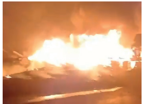
Los vehículos ardieron y dejaron un fallecido y 3 heridos

Las investigaciones iniciales apuntan a que la colisión fue provocada por una invasión de carril, lo cual ha llevado al conductor de la cisterna a ser puesto bajo custodia para esclarecer