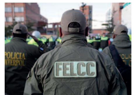
Un grupo de efectivos policiales

Los operativos para dar con el peruano Amadeo Bello G. P., de 76 años de edad, continúan en diferentes zonas de la ciudad y regiones fronterizas.