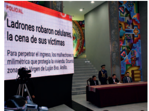
Ayer se presentó el proyecto de ley

El comandante regional destacó la importancia de que todos los vehículos de transporte público cumplan con los requisitos legales establecidos, como tener las dos placas de control correspondientes y el pintado lateral en color amarillo y negro. Estas medidas buscan garantizar la identificación adecuada de los vehículos y mejorar la seguridad vial en la ciudad.