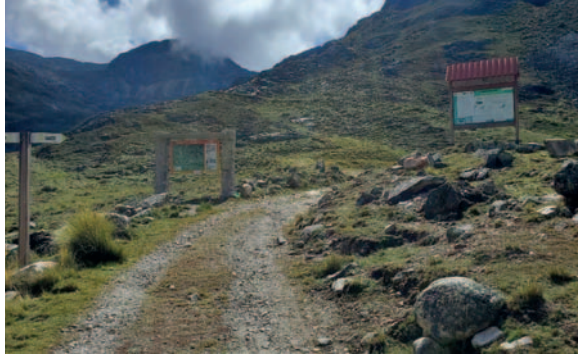
Personal de la AJAM recorrió la zona

En el marco de sus competencias establecidas en la Ley 535 de Minería y Metalurgia, la AJAM