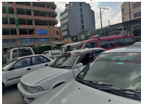
Los vehículos retenidos en El Alto

Se constató que algunos vehículos no tenían placas o les faltaba una placa, lo cual constituye una infracción grave a las normativas de tránsito. El comandante regional, coronel Gunther Agudo, informó que los propietarios deberán regularizar sus trámites en un plazo de 15 días para obtener o recuperar las placas faltantes.