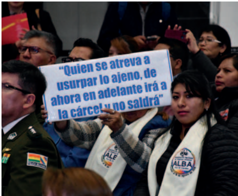
Mensajes contra delitos de robo y hurto se vieron durante la presentación

“Tenemos que dejar en el pasado la idea de que el robo es una manera de vivir. Hay que sancionar drásticamente el robo. Nuestros hermanos aquí en el país deben comprender que hay que trabajar y buscar una fuente de empleo (...) Por eso estamos trabajando en la industrialización”, afirmó.