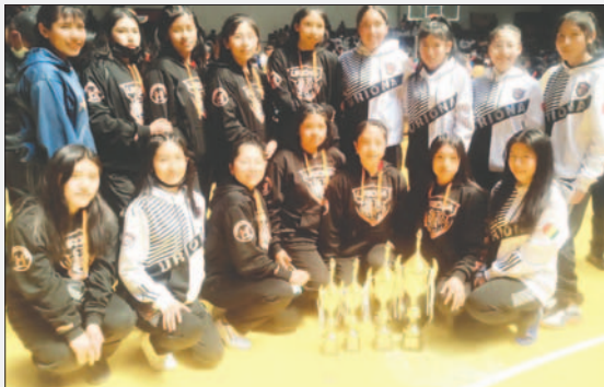
Uriona es uno de los representantes de Oruro en la Libomenor; además aporta con una jugadora a la preselección boliviana