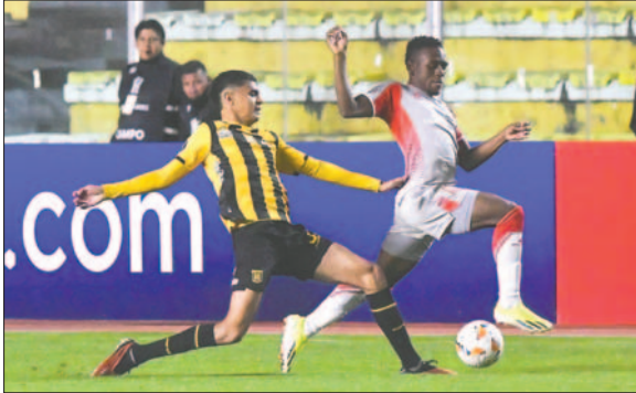
Estudiantes buscó el empate y estuvo a punto de lograrlo