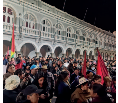
Sectores del MAS del ala radical, convocaron a la marcha

Según el artículo 1 del Decreto Supremo 5143, esta normativa tiene como objetivo "reglamentar la Ley de 15 de noviembre de 1887, de Inscripción de Derechos Reales, concordado con las disposiciones del Código Civil y otras disposiciones legales relativas al funcionamiento y organización de Derechos Reales, a fin de modernizar el Registro de Derechos Reales".