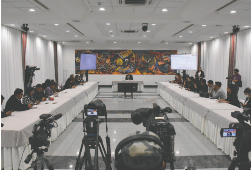
El Primer Mandatario habló ante los medios de comunicación

“Somos la economía que más rápidamente ha recuperado el empleo postpandemia. Eso está documentado por la Cepal. En el extranjero nos reconocen, hay un reconocimiento de lo que estamos haciendo... Sentimos mucho nueva-