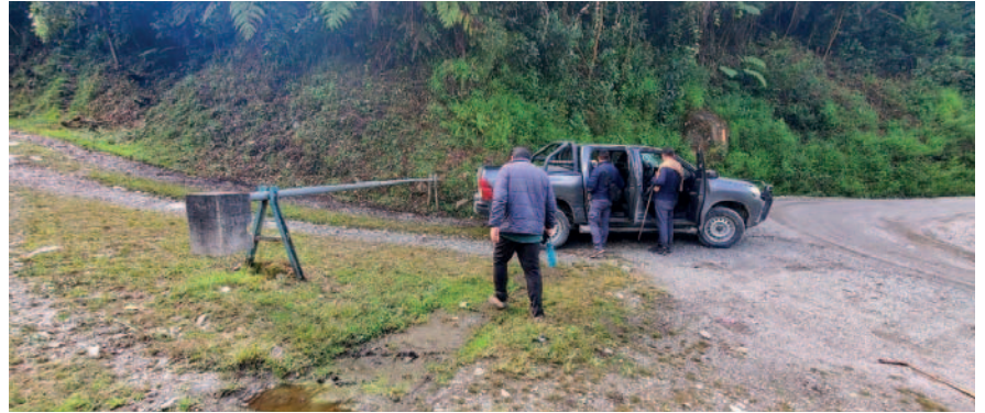
Tras culminar la inspección, las autoridades aseguraron que continuarán efectuando trabajos similares

La AJAM destaca que seguirá realizando inspecciones periódicas e interponiendo acciones legales para garantizar que no se lleven a cabo actividades mineras ilegales en esta zona estratégica. Asimismo, solicita colaboración ciudadana para detectar y denunciar cualquier tipo de actividad minera ilegal que pueda afectar el entorno natural del lugar.