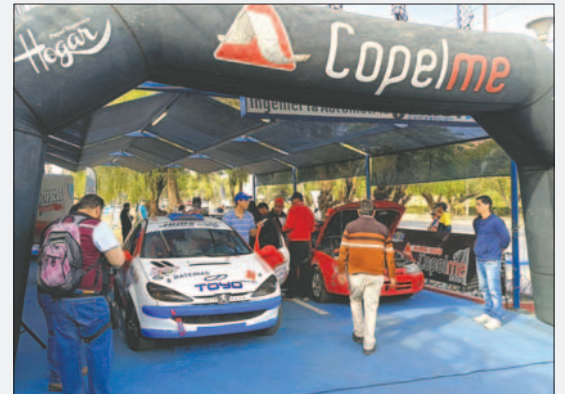
Durante la inspección a los motorizados ayer en Cochabamba