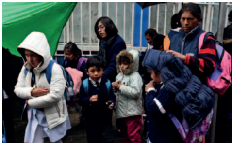
Incremento de bajas temperaturas, propagan infecciones respiratorias en niños y adolescentes