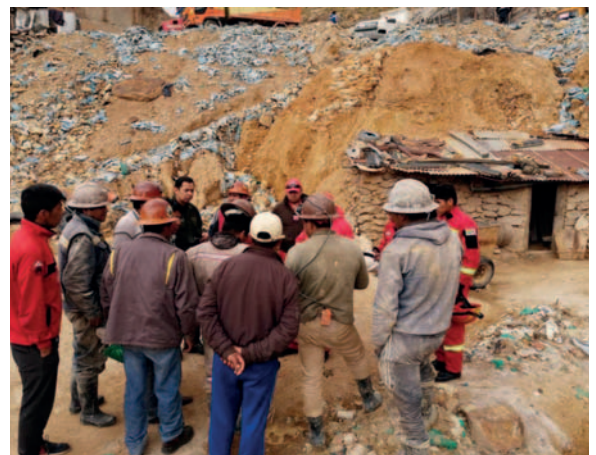
Contabilizan al menos 53 mineros muertos en 2024

Al volver a su domicilio, el ciudadano perdió el equilibrio y cayó en un cañadón. Los golpes por la