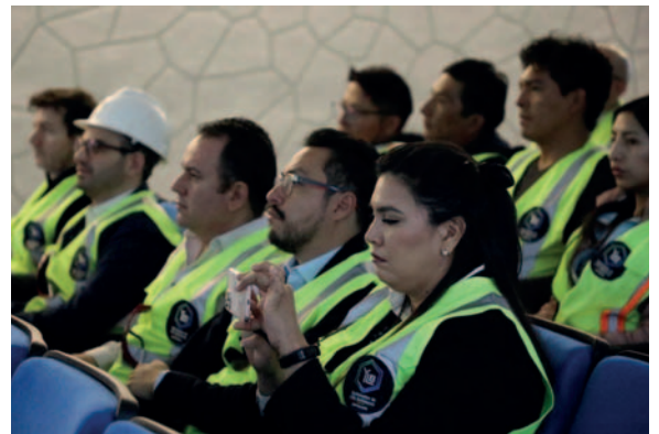
Esta experiencia sirvió para intercambiar conocimientos sobre la explotación de litio

presidenta de Yacimientos de Litio Boliviano (YLB), los visitantes quedaron impresionados por el nivel tecnológico mostrado en el centro de investigación.