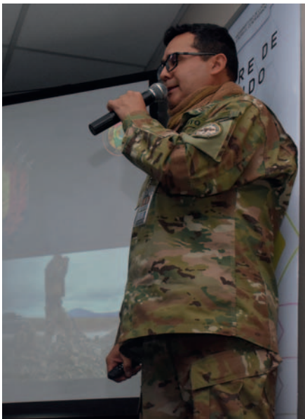
Informaron los detalles de este hecho en conferencia de prensa