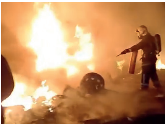
Los bomberos y voluntarios ayudaron a sofocar el fuego

Según reportes preliminares, tres personas resultaron heridas como consecuencia directa del choque y posterior incendio. Un oficial informó a los medios de comunicación sobre el hallazgo de los restos humanos en el ca-