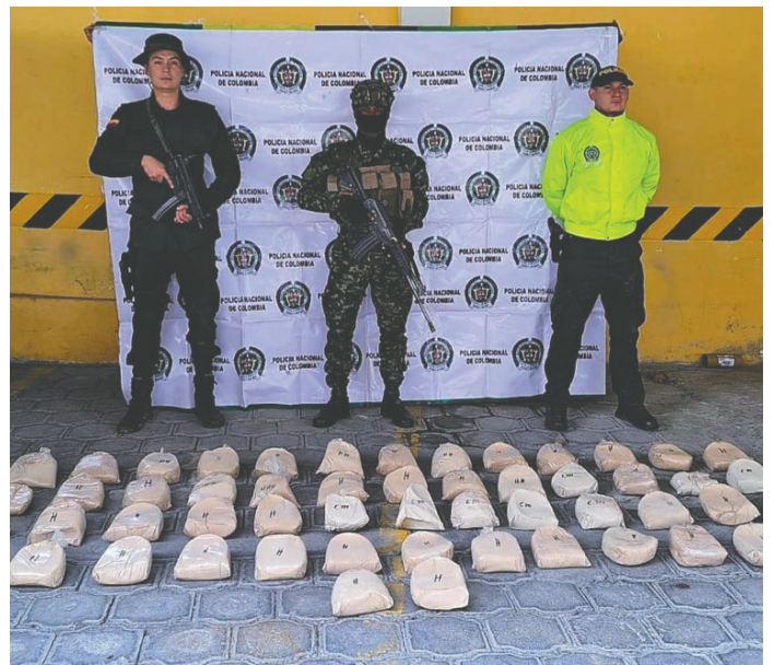
Policía incauta 53,5 kilos de heroína en Nariño, Colombia