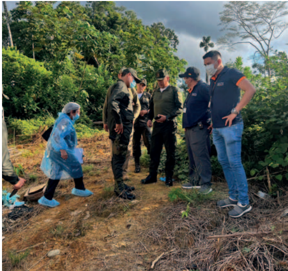
Efectivos policiales y de la Fiscalía en el lugar donde murieron linchadas tres personas

Sin embargo, los efectivos del módulo policial de Ivirgar-