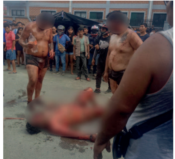
Uno de los presuntos antisociales tras ser linchado

Ríos lamentó el comportamiento del grupo de pobladores por hacer justicia con mano propia y recordó que en el país rige el estado de derecho y el debido proceso.