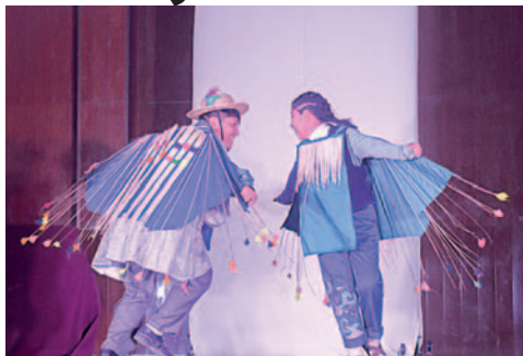
La obra relata la tragedia y resistencia que tiene el pueblo Uru

“Es un trabajo de investigación constante y también de madurez de nosotros mismos como