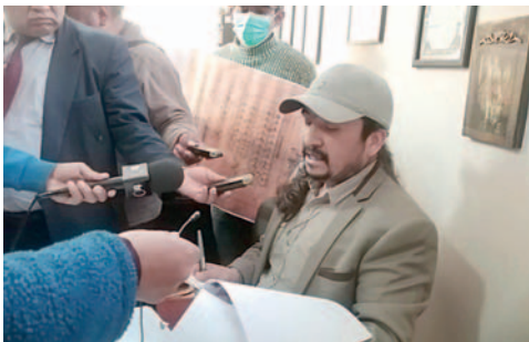
Defensa legal de las víctimas pide acelerar el juicio

En ese sentido, la defensa legal de las víctimas llamó a la autoridad judicial a dar celeridad en el desarrollo del juicio y llegar a una sentencia.