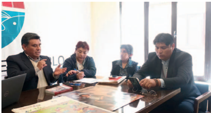
Reunión entre distintas instancias delimitó funciones y competencias /DIO

bir las situaciones en las cuales se deberá intervenir y mantener la continuidad del sistema de protección integral. También se determinó que las mesas de trabajo continuarán el próximo 16 de mayo.