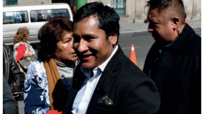
Presidente de la Cámara de Diputados de Bolivia, Israel Huaytari Martínez

Además, criticó que las acciones legales estén avanzando sin que se le haya informado nada al respecto. Por lo tanto, afirmó que no puede emitir ningún criterio sobre el tema hasta que tenga la infor-