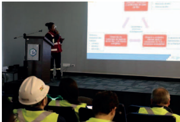
El encuentro fue con representantes de cuatro países

Durante el taller, la delegación visitó el centro de investigación y las plantas piloto de materiales catódicos y baterías, donde los profesionales bolivianos compartieron su experiencia en el desarrollo de materiales activos, celdas y baterías de litio. Según Karla Calderón,