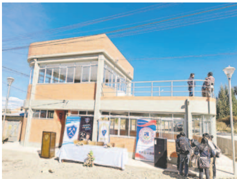
Acto de entrega de albergue para estudiantes de la FNI/UTO

Según el informe técnico de la obra a cargo del