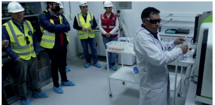
Visitaron las instalaciones de las plantas de litio y laboratorios

La delegación estuvo compuesta por representantes de Argentina, Chile y México, acompañados por la CAF y la cooperación alemana. La cooperación entre estos países busca fortalecer la industria del litio en la región y promover la innovación tecnológica en este sector estratégico.