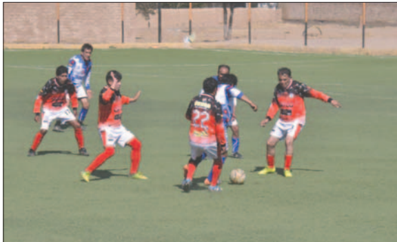
La emoción del fútbol en Máster y Sénior vuelve este fin de semana