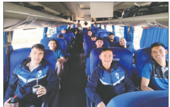
La delegación orureña viajó con anticipación a Tarija