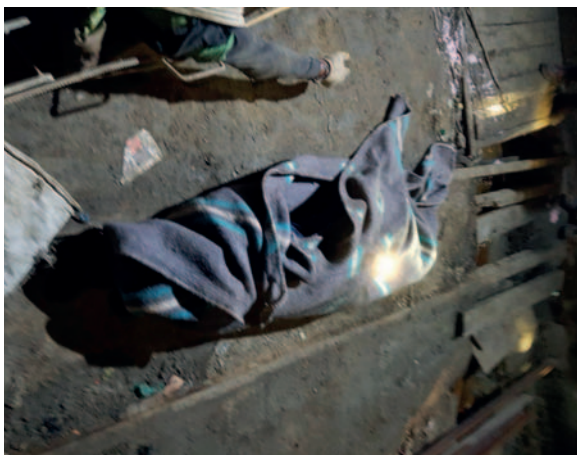
El cadáver del trabajador minero fue trasladado a una morgue en Potosí