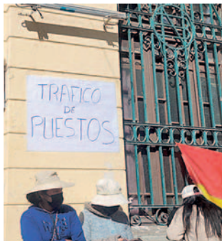
Comerciantes acusaron de tráfico de puestos a autoridad edil

mana, la Unidad de Mercados realizó un relevamiento de información para conocer cuántos comerciantes ambulantes se encuentran en la calle 6, en la cual ya no existe circulación vehicular debido a que los comerciantes se instalaron en medio de la vía.