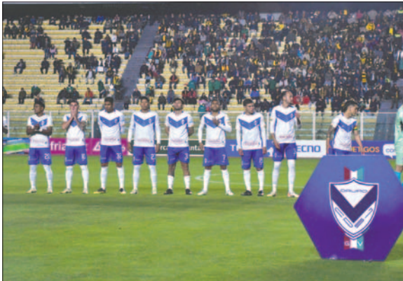
GV San José tiene en mente realizar una mejor campaña que en el Apertura