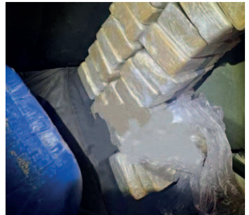
La droga encontrada en el vehículo del efectivo policial