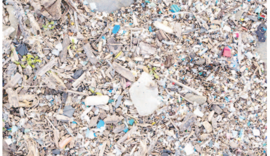
En la imagen de archivo, plásticos, mesoplásticos y microplásticos en una playa

la cantidad de perlas de plástico libres disminuyó gradualmente, ya que fueron atraídas por los microrobots. Posteriormente, los investigadores ensamblaron los robots