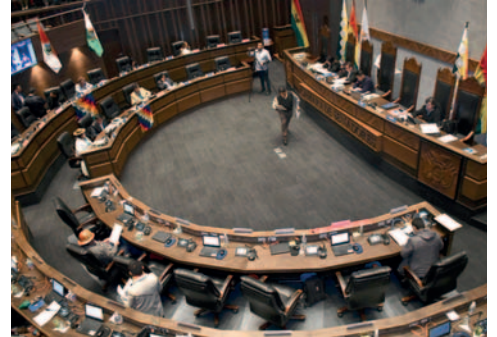
Legisladores piden iniciar acciones legales ante resoluciones que frenaron proceso de preselección de candidatos

Asimismo, el presidente de la Cámara de Senadores, Andrés Rodríguez, informó que la presidencia de la Cámara solicitó a las Comisiones Mixtas de Constitución y Justicia Plural el informe sobre la situación de las elecciones judiciales, para que después, en una evaluación conjunta, las tres bancadas soliciten a Choquehuanca una reunión.