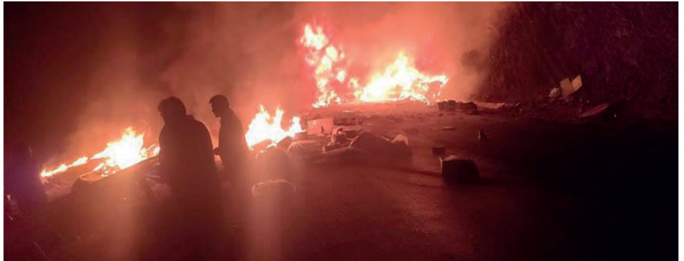
El vehículo ardió en la carretera

De momento las autoridades continúan con la investigación y se espera mayor información para esta jornada.