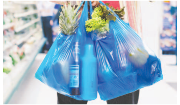
Evitar utilizar bolsas plásticas, entre los objetivos de las autoridades

ferentes mercados, donde resaltó la entrega de la ley a las diferentes organizaciones, para que traten con la Ley Municipal y posteriormente concienticen a la población orureña mediante videos y artículos en la prensa, con el fin de alcanzar a un mayor número de personas. El Concejo Municipal, mediante sus tres funciones: legislar, deliberar y fiscalizar, coordinará según el plan de trabajo con las organizaciones, para asegurar que el mensaje llegue a una gran cantidad de personas y así la ciudadanía pueda cumplir con esta normativa.