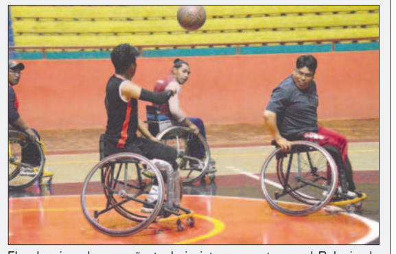
El seleccionado orureño trabaja intensamente en el Palacio de los Deportes

Señaló que una de las dificultades principales es el tema del escenario, ya que en la sede que tienen los componentes del deporte integrado, el piso de la cancha es de cemento. El cambio a jugar en parquet, representa una dificultad, por lo que necesitan entrenar más para adaptarse a los cambios.