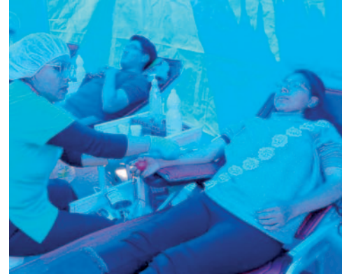
Calificaron de exitosa las campañas de donación de sangre a nivel departamental

De acuerdo con el director, existen los equipos necesarios para la recolección de sangre. "Tenemos el equipo de quimioluminiscencia funcionando al 100%. Nuestro personal está altamente capacitado en este nuevo equipo que hemos adquirido. Somos uno de los cuatro departamentos a nivel nacional que manejamos la CLIA, y creo que hoy en día los