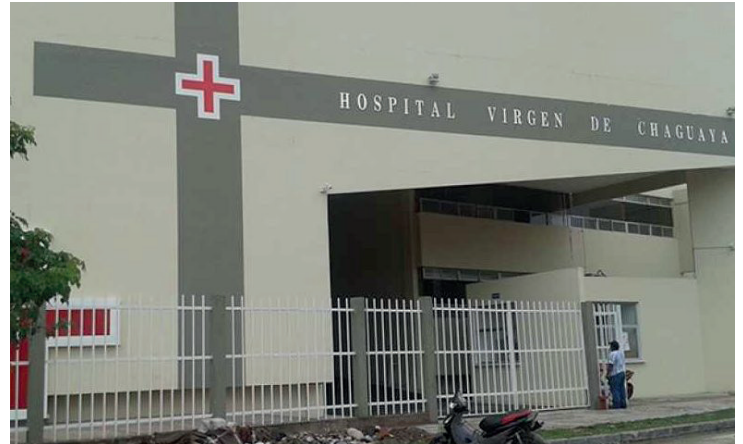
Hospital de tercer nivel Virgen de Chaguaya

El Servicio Departamental de Salud (Sedes) de Tarija reportó que el paciente había sido ingresado con la enfermedad ya avanzada y padecía otras enfermedades que influyeron en su deceso. Se indicó que el Hantavirus es de alto riesgo y