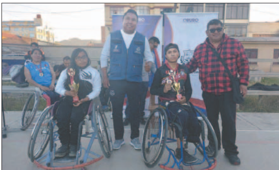
El certamen finalizó con la premiación a los campeones y los más destacados

La Unidad de Promoción de la Actividad Física y Deportiva del Gobierno Autónomo Municipal de Oruro, se encargó de entregar los premios a los ganadores del certamen.