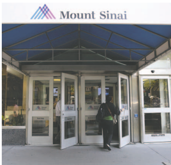
Vista general del hospital Monte Sinaí en Nueva York

Hasta ahora, la mayor parte de la investigación se ha centrado en un receptor de serotonina