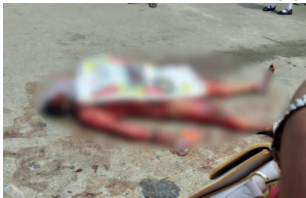
Uno de los sujetos linchados por la gente

Hasta el momento, las autoridades policiales no han emitido informes oficiales sobre el caso, aunque se espera que proporcionen detalles adicionales en las próximas horas.