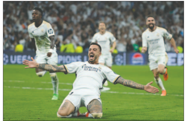
El delantero del Real Madrid, Joselu, fue autor de los dos goles del Real Madrid

ra dejará el registro en seis. Deja atrás a Miguel Muñoz, que estuvo sentado en el banquillo de cuatro partidos por el título. Como Marcello Lippi, Ferguson, Jurgen Klopp y Pep Guardiola.