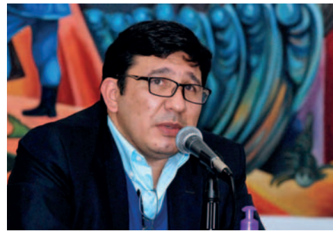
El ministro de Hidrocarburos y Energías, Franklin Molina

Según Molina el esfuerzo de YPF no ha logrado