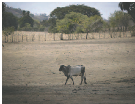
Una vaca sobre un pastizal seco en la Península de Azuero (Panamá)

“Lamentablemente, 2023 fue un año de peligros climáticos sin precedentes en América Latina y el Caribe. Las condiciones durante la segunda mitad de 2023 contribuyeron a un año récord en cuanto a temperatura y exacerbaron muchos fenómenos extremos, combinándose con el aumento de