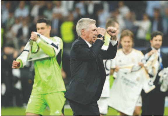
El entrenador del Real Madrid, Carlo Ancelotti rompió su propio record

Pero eso no es todo. Ancelotti se convirtió este miércoles en el único entrenador que habrá dirigido seis finales. Sólo él dirigió cinco, aho-