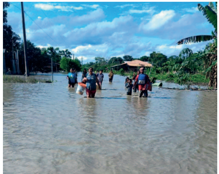
Inundaciones en el Trópico

El municipio de Villa Tunari quedó inundado debido al desborde del río 24, mientras que Puerto Villarroel resultó más