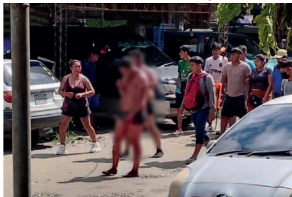
Los presuntos secuestradores fueron llevados semidesnudos antes de darles muerte