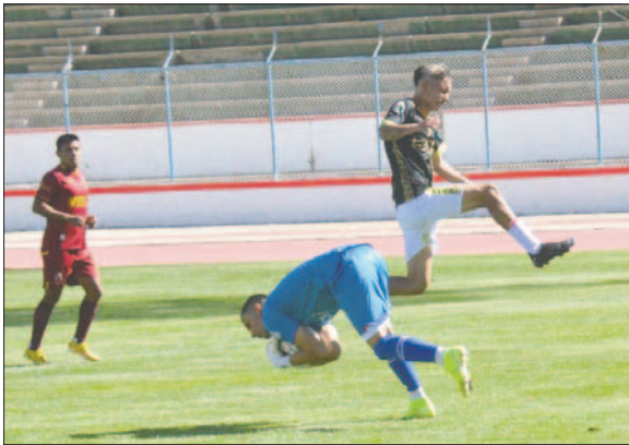
Sur-Car no pudo capitalizar sus opciones por la buena labor del portero Serra

CDT Real Oruro, también quedó con 10 hombres, ya que Luca Ba-