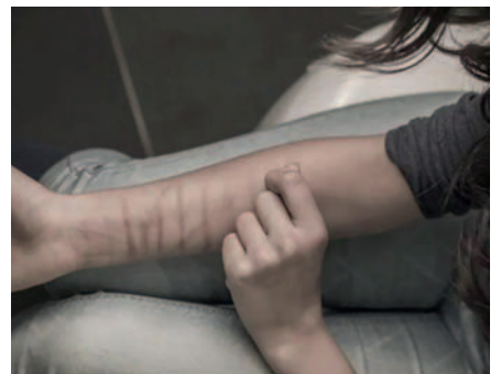
Este caso salió a la luz luego de que la madre de las víctimas descubriera en una de ellas cortes en las muñecas /REFERENCIAL

Tras una audiencia de medidas cautelares, la Justicia determinó enviar al acusado de presunta violación al penal de El Abra con detención preventiva mientras el caso continúa en investigación.