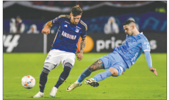
El partido se jugó con bastante intensidad, al final quedaron empatados