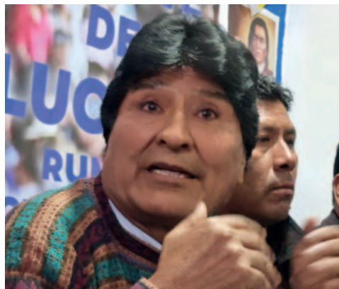
El TSE ha decidido imponer al MAS-IPSP su primera amonestación grave a la dirigencia encabezada por Evo Morales

El TSE comunicó este miércoles 8 de mayo que el MAS incumplió la resolución 122/2024, mediante la cual se les instruyó convocar a un congreso nacional para renovar su directiva, con previo consenso acreditado con las organizaciones sociales.