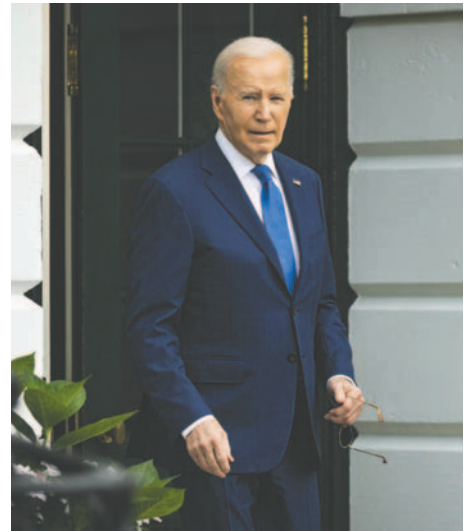
Foto del presidente de EE.UU., Joe Biden

Estados Unidos es el principal proveedor de armas a Israel y uno de sus más firmes aliados en el mundo. Entre 2016 y