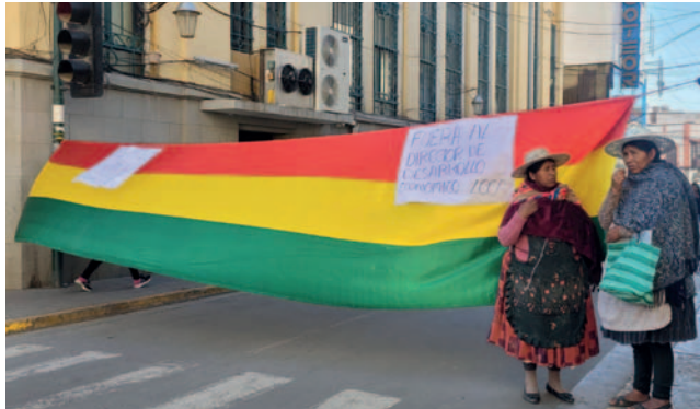
Comerciantes de la Asociación 26 de abril del mercado Kantuta bloquearon la Alcaldía