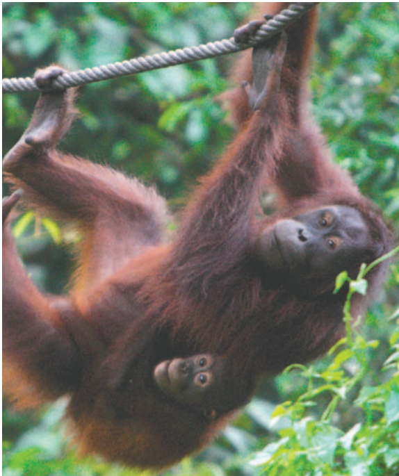
Centro de rehabilitación de orangutanes de Sepilok, Malasia

Malasia planea seguir el ejemplo de China con su "diplomacia del panda", prestando oranguta-