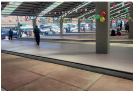
El proyecto consistió en mejoramiento de aceras, pasillos y una plataforma de más de 7 mil m 2

Después de la entrega del proyecto y la respectiva ch'alla, el alcalde recorrió las diferentes secciones junto a los comerciantes. Sin embargo, surgió un impasse entre algunos comerciantes, lo cual llevó al alcalde a retirarse del lugar.