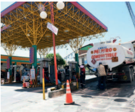
La ANH aseguró que el combustible está garantizado en el país

En detalle, incautaron 26 vehículos y arrestaron a sus conductores por realizar una carga total de 60.000 litros en dos semanas. En otros operativos detuvieron a 14 personas que realizaron cargas de 40.000 litros.