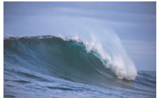
Desde marzo de 2023, la temperatura media del mar no dejó de subir

Y en un total de 47 ocasiones, la temperatura de un día determinado superó por más de 0,3 grados centígrados el récord anterior para ese mismo momento del año, según el análisis de la institución con sede en Bonn (Alemania).