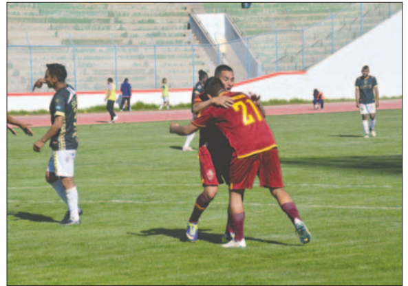
Moreira y Sánchez, artífices de la victoria de CDT Real Oruro