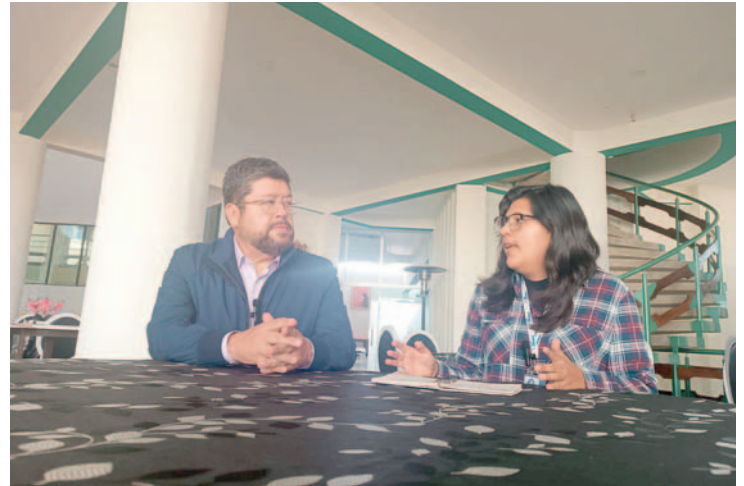
Samuel Doria Medina expone las causas de la crisis económica en Bolivia

Por tanto, el empresario recomendó a la pobla-