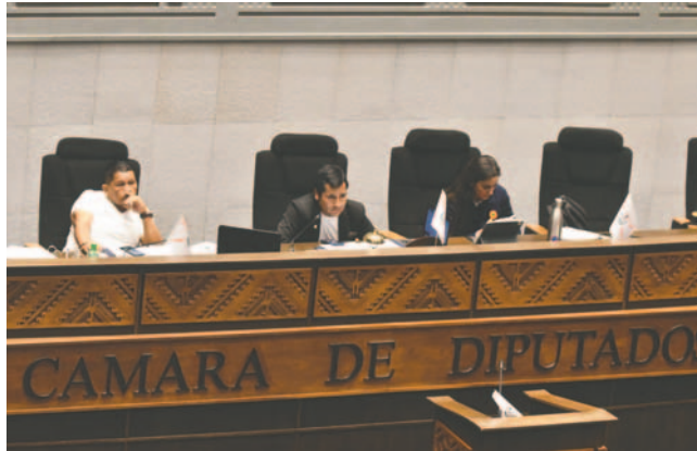
El presidente de Diputados no pudo hacer aprobar el orden del día