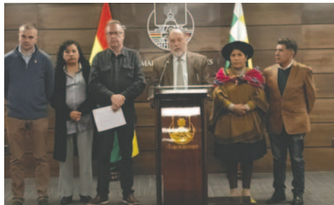
La bancada de Comunidad Ciudadana (CC) presentó un proyecto de ley

Además, enfatizaron que la jerarquía normativa