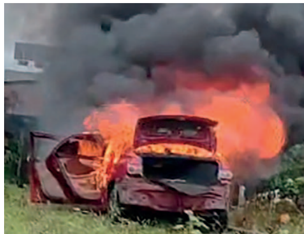
El vehículo usado por los acusados fue quemado por los pobladores

La Policía hace un llamado a la calma y reafirma su compromiso de llevar a cabo una investigación exhaustiva y transparente para garantizar el debido proceso y la justicia en este caso.