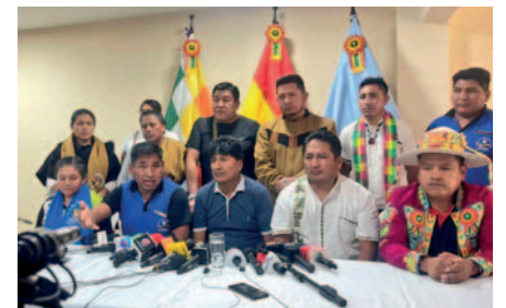
Dirección Nacional del MAS-IPSP se declaró en estado de emergencia, tras una reunión el martes 7 de mayo

Aseguró que después del evento se dio un nuevo horizonte político con las nuevas generaciones, ya que el país necesita renovación de líderes. Por tanto, defendió el cambio de directorio y rechazó que se intente desconocer al congreso de los renovadores.