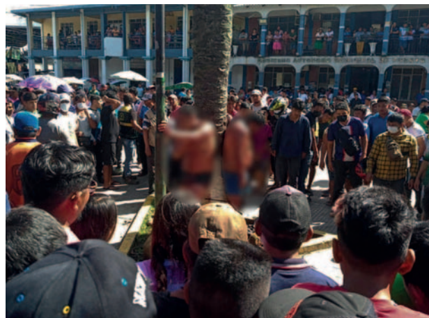
Los acusados fueron amarrados en el tronco de un árbol a la vista del público

Se espera el informe forense que arrojará más detalles sobre las circuns-