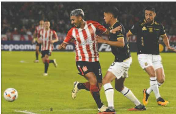
En la ida ganó Estudiantes 2-1 en Argentina el reciente 9 de abril

ESTUDIANTES: Matías Mansilla; Eros Mancuso, Federico Fernández, Zaid Romero, Eric Meza, Santiago Ascaibar, Enzo Pérez, José Sosa, Tiago Palacios, Mauro Méndez y Javier Correa; D.T. Eduardo Domínguez.