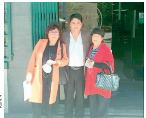
CNS Oruro garantiza atención adecuada y oportuna a sus asegurados / CNS