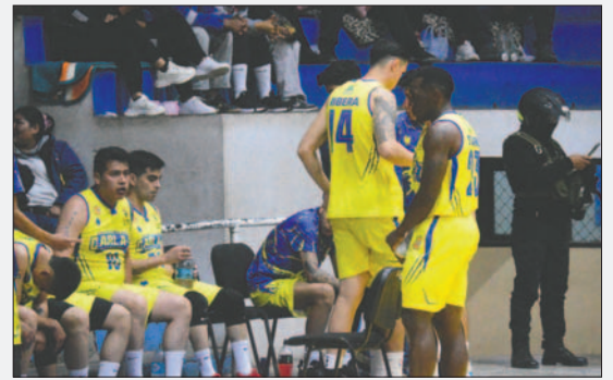
Carl A-Z volvió a perder de visita a pesar de jugar un buen partido

Carl A-Z se mantiene en el sexto puesto de la tabla con 11 puntos, mientras que Saracho continúa en el penúltimo lugar con 10 unidades.