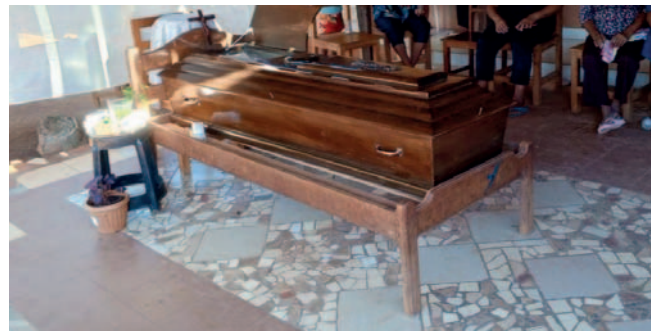
Responsable del delito de feminicidio contra su pareja, recibe 30 años de sentencia

El hombre había intentado dar una versión para encubrir el hecho, argumentando que la mujer murió a consecuencia de una caída en moto-