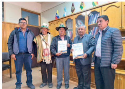
Autoridades de Caracollo y la UTO firmaron un convenio

"Para la UTO, siempre es importante tener esta vinculación con los municipios, con algunas otras instituciones públicas y privadas, porque así,