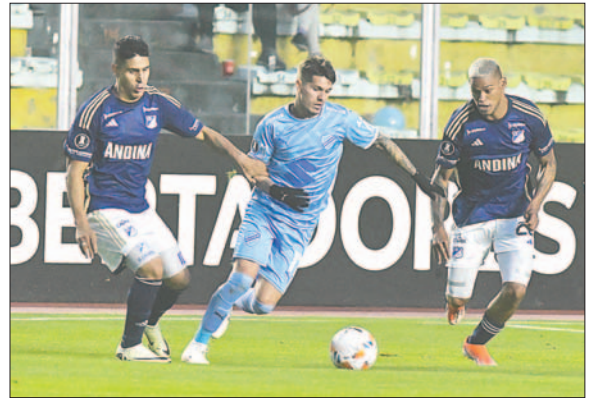
En la ida ganó Bolívar 3-2 en La Paz el 11 de abril de este año