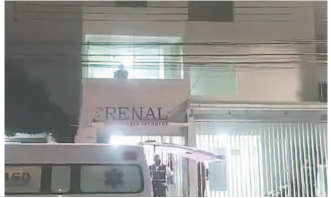
La clínica donde estaba internado el "falso médico" chileno

"Aparentemente se habría quitado la vida, es la información preliminar. La esposa se encuentra en el Hospital San Juan de Dios con un custodia, por el tema del arma de fuego. Se descarta que sea un arma