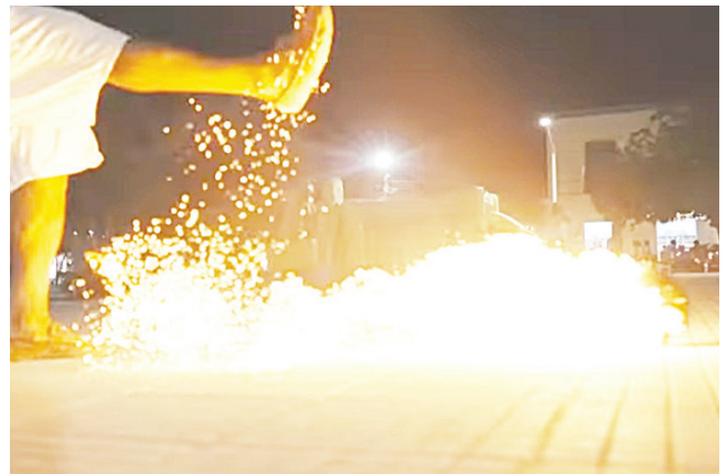
Los niños jugaron con una pelota encendida con fuego

Tras el incidente, el niño afectado fue trasladado a un centro