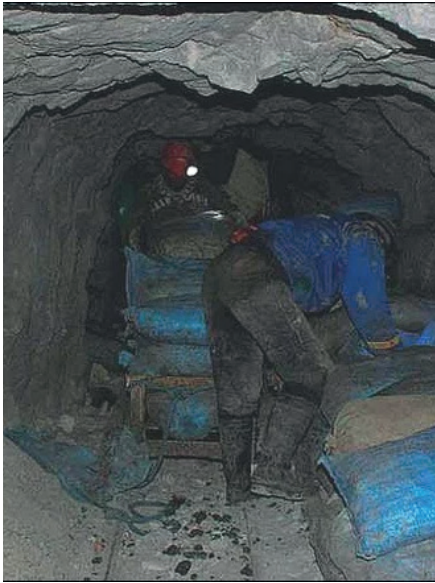
El hecho ocurrió al interior de una mina