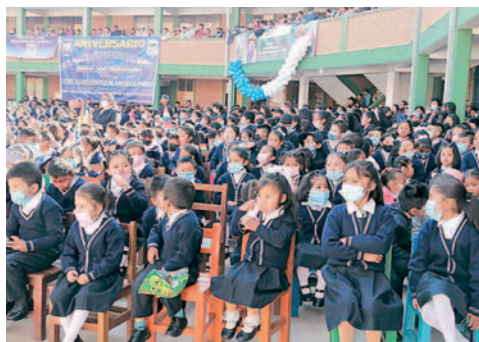
Niños son los más vulnerables a los resfríos

Ayer por la tarde, autoridades de educación y salud, junto con representantes de padres y madres de familia y el Servicio Nacional de Meteorología e Hidrología (Senamhi), se reunieron para abordar el tema de las bajas temperaturas, las consecuencias en la población estudiantil en cuanto a