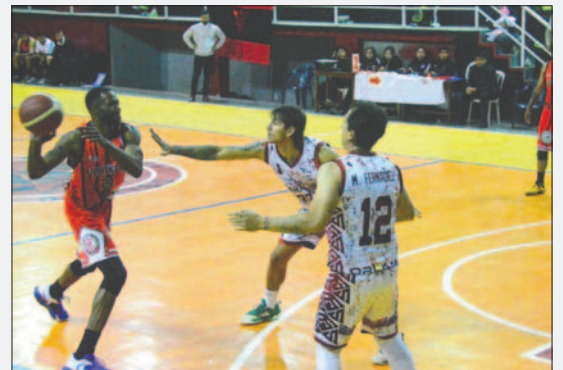
Saracho buscará hacerse fuerte en su visita a Básquetbol La Paz

Sin embargo, Básquetbol La Paz tiene la misma mentalidad y busca dejar atrás las derrotas consecutivas. Aprovecharán el mal momento del equipo orureño para sumar victorias y salir de la incómoda posición en la que se encuentran. Por esta razón, buscarán lo mejor de su plantilla para enfrentar el desafío y obtener los puntos en disputa.