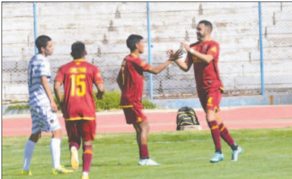
CDT Real Oruro en procura recuperar el liderato / LA PATRIA

En caso de lograr una victoria, CDT Real Oruro volverá a tomar el liderato de la tabla con 6 puntos y una mejor diferencia de gol que Unión Huayllamarca, que hasta el momento está en primer lugar. Si Sur-Car logra vencer, ocupará el tercer puesto del campeonato.