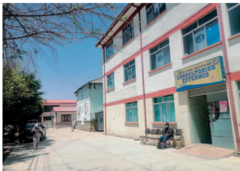
Trabajadores sindicalizados del Hospital General denuncian irregularidades

"Ahora dicen que se han vendido medicamentos. Si alguien ha vendido medicamentos, que los acusen a ellos. Esto es realmente una persecución sindical. Me entristece mucho la actitud que están tomando", señaló.