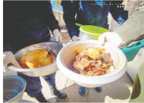
Identifican falta de higiene y limpieza en venta de comida