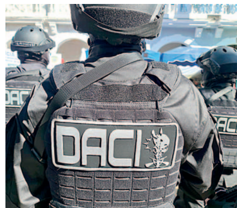
Los agentes del DACI ejecutaron satisfactoriamente la orden de aprehensión en contra del exfuncionario oculto en Oruro

Entre los investigados se encuentra el exministro de Minería, Luis Alberto Echazú, quien fue beneficiado con detención domiciliaria al igual que otros dos acusados. Mientras tanto, un cuarto acusado fue enviado a la cárcel de San Pedro.