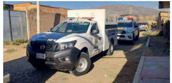
Vecinos denuncian presunto abandono de mujer fallecida en incendio

“El dueño de la casa nos indica que han hecho todas las denuncias a las unidades del Adulto Mayor, sin embargo, no ha habido una atención oportuna y eso es lo que nos preocupa”, expresó un vecino.