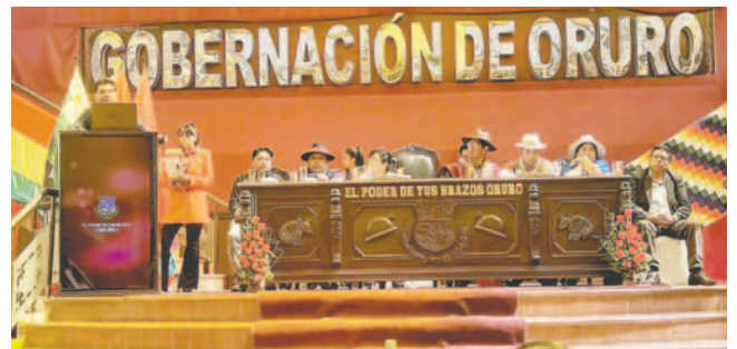
El gobernador Johnny Vedia destacó la mejora de la ejecución presupuestaria en 2023

En la jornada de informe se detalló todos los trabajos, proyectos y ejecuciones realizadas en cada dependencia de la Gobernación de Oruro, pero en-