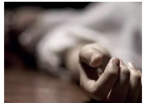
El hombre cayó al pozo y murió /REFERENCIAL

El director de la Fuerza Especial de Lucha Contra el Crimen (Felcc) de Cochabamba, Freddy Medinacelli, informó que el cuerpo rescatado presentaba varias fracturas, incluyendo ambos omóplatos, y un politraumatismo según el examen físico externo, lo cual es compatible con una muerte accidental.