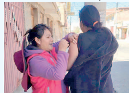
Se lleva adelante la Semana de Vacunación de las Américas / SEDES

Cabe resaltar que la gripe de la influenza se contagia de una persona a otra a través de gotitas de saliva que quedan suspendidas en el aire al hablar, toser o estornudar. Estas gotitas contienen virus que, al ser inhalados por una persona, pueden causar infección al ingresar a las vías respiratorias.