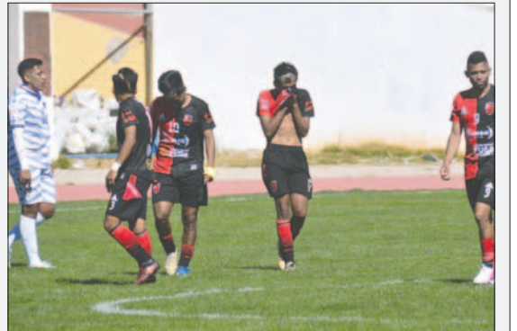
A pesar de tener las pruebas Ingenieros no impugnará el partido

El lunes se reunieron para analizar el rendimiento del equipo y evaluar la posibilidad de impugnar el partido. Pero, debían desembolsar 35 mil bolivianos para presentar la observación, en caso de ganar la demanda, solo se les devolvería el 70% del monto. Por ello, descartaron la opción de impugnar.