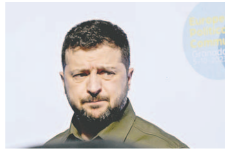
El presidente de ucrania, Volodímir Zelenski

“El enemigo planeaba eliminar también al jefe del SBU, Vasil Maliuk, al jefe del GUR, Kirilo Budánov, y a otros funcionarios de alto rango, agrega el comunicado del servicio secreto