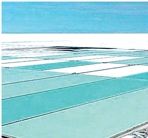
Las piscinas de evaporación de la planta de litio en Uyuni