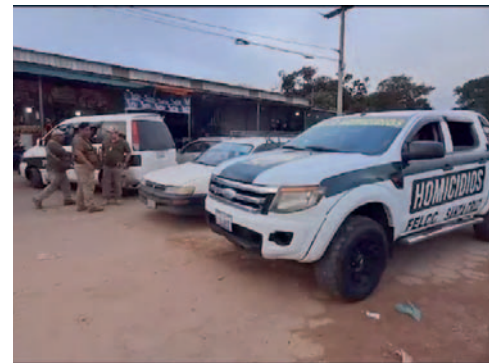
Las autoridades detuvieron a tres personas en el nuevo mercado Abasto para ser interrogadas en relación con el presunto asesinato

La víctima, presuntamente un carretillero que trabajaba en la zona del mercado Abasto, fue encontrada con cortaduras y signos de violencia, generando conmoción entre los habitantes locales. Las autoridades continúan trabajando en esclarecer este crimen.