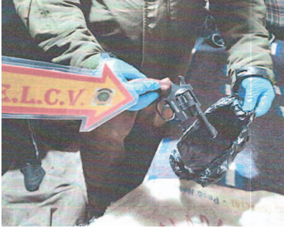
El revolver utilizado para amenazar a la víctima

La víctima agregó en su evaluación psicológica que, tras el