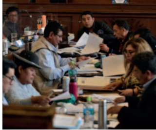
La Sala Constitucional de Pando notificó a Comisiones que deja sin efecto la preselección de autoridades judiciales

“Nosotros vamos a esperar la decisión que tome la Asamblea, ya que hemos remitido el informe al presidente nato del Legislativo para que podamos definir el camino acorde a las propuestas que había”, dijo.