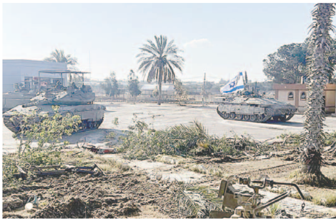
El Ejército de Israel confirmó este martes haber tomado el control del lado gazatí del cruce de Rafah con tanques, tras una noche de bombardeos intensos contra el este de esta localidad sureña fronteriza con Egipto

ahora las dos principales vías para ingresar ayuda a Gaza están selladas, lo que convierte esta mañana en una de las más sombrías en los siete largos meses que dura esta pesadilla”, lamentó Laerke.