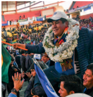
García admitió haber renunciado el día de la inauguración del congreso “arcista”

“Siempre hubo corrupción cuando estaba el hermano Evo, actualmente también hay corrupción. Por eso, este nuevo instrumento