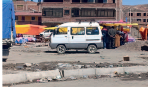
Comerciantes se asentaron en predios no autorizados

En aquella ocasión, la Dirección de Desarrollo Económico Local informó