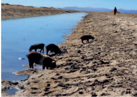
Inspección conjunta cuantificara daño ambiental del impacto minero en la Cuenca Huanuni y las comunidades

“A partir de mañana (hoy), vamos a ingresar a la Cuenca Huanuni, toda la subcuenca, está ingresando una comisión a la cabeza de los ministerios de Medio Ambiente, Minería, Gobernación y los municipios para hacer una inspección ambiental desde Huanuni, pasando por Machacamarca, llegando a sus distintos lugares”, detalló el secretario departa-