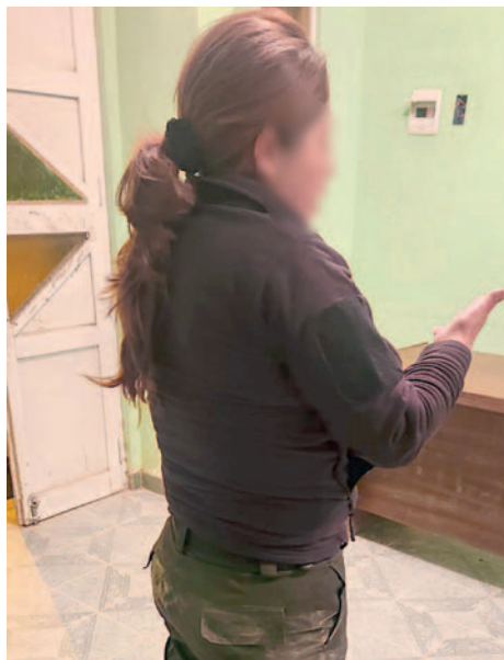
La mujer policía fue atacada cuando estaba en su puesto de trabajo