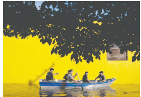
Equipos de rescate trabajan entre las calles inundadas en el barrio Sarandí de Porto Alegre (Brasil)

Las fuertes lluvias en el Sur de Brasil han dejado al menos 91 muertos y 1,4 millones de damnificados, con la posibilidad de nuevos temporales que podrían agravar la situación. El estado de Rio Grande do Sul es el más afectado por las inundaciones, con pronósticos de lluvias intensas que podrían superar los 100 milímetros este martes y alcanzar los 150 milímetros el miércoles. Según el Instituto Nacional de Meteorología (Inmet), se esperan fuertes lluvias y tormentas en la región más austral del estado de Rio Grande do Sul, así como en toda la zona fronteriza con Uruguay. Las precipitaciones podrían superar los 100 milímetros