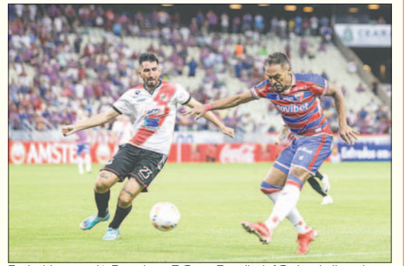
En la ida, venció Fortaleza 5-0 en Brasil el 10 de abril reciente