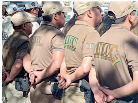
Varios funcionarios destacados en la resolución de casos fueron reconocidos

destacaron los trabajos de investigación y resolución de casos hasta la fecha.