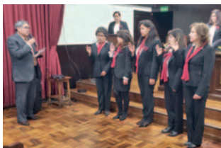
Momento de la posesión del nuevo directorio del Club del Libro

“Tuvimos buenos retos y nuevos desafíos y el trabajo del fomento a la lectura, en ese sentido nos ha tocado un camino de retos y aprendizaje, se ha dejado el informe completo. Con esos objetivos trazados se ha logrado