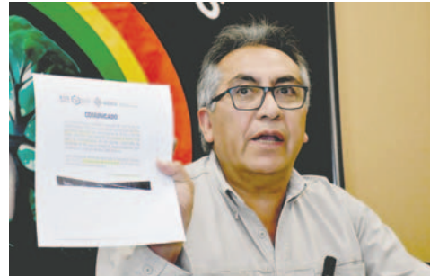
Viceministro de Coordinación Gubernamental, Gustavo Torrico

“El decreto sobre derechos reales es un decreto de modernización y garantizará plenamente la propiedad privada, tal como está garantizada en la Constitución Política del Estado. Lo que se busca es que yo pueda ir donde el notario, llevar mi folio y