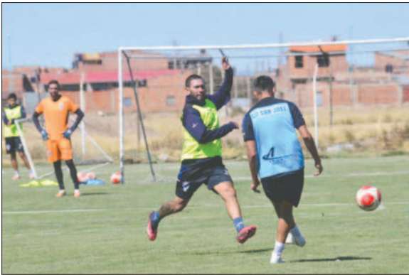
El cuadro orureño ya conoce a sus rivales y se alista para enfrentarlos

Ayer por la mañana, el plantel continuó con sus entrenamientos a la espera de conocer a los rivales de las primeras fechas, luego de que la FBF confirmara el inicio del campeonato para este fin de semana.