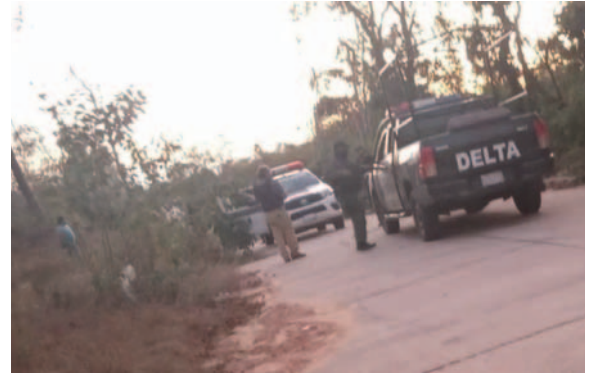
Efectivos policiales en Porongo tras el asesinato de tres policías