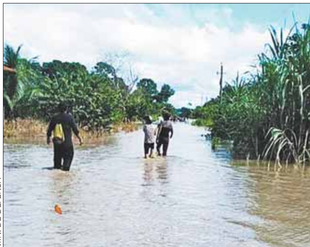
MIN. DE DEFENSA

122 municipios en los departamentos de La Paz, Santa Cruz, Cochabamba, Beni y Pando que deben estar alertas.