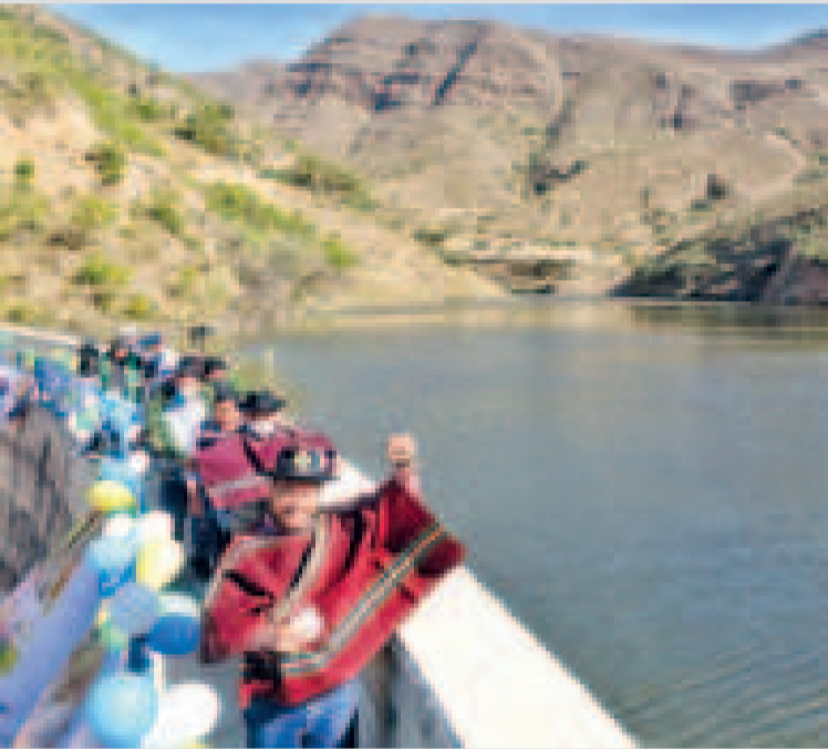
Luis Arce en la inauguración de una obra de riego en 2022 en Mojcocoya, Chuquisaca.

El Ejecutivo tiene una agenda de inversiones que impulsa la industrialización, el desarrollo integral y la calidad de vida en el departamento del sur del país.