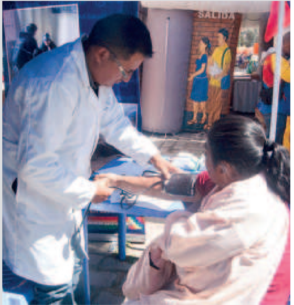
El sector salud aglutina a médicos, enfermeros y otro tipo de personal vinculado al área.