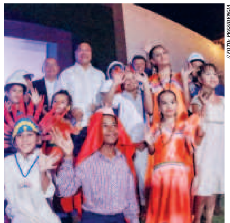
El Presidente con niños en la celebración de Entel.

POR CIENTO de las localidades del país tiene cobertura de Entel, y la meta es llegar al 100% en el Bicentenario.