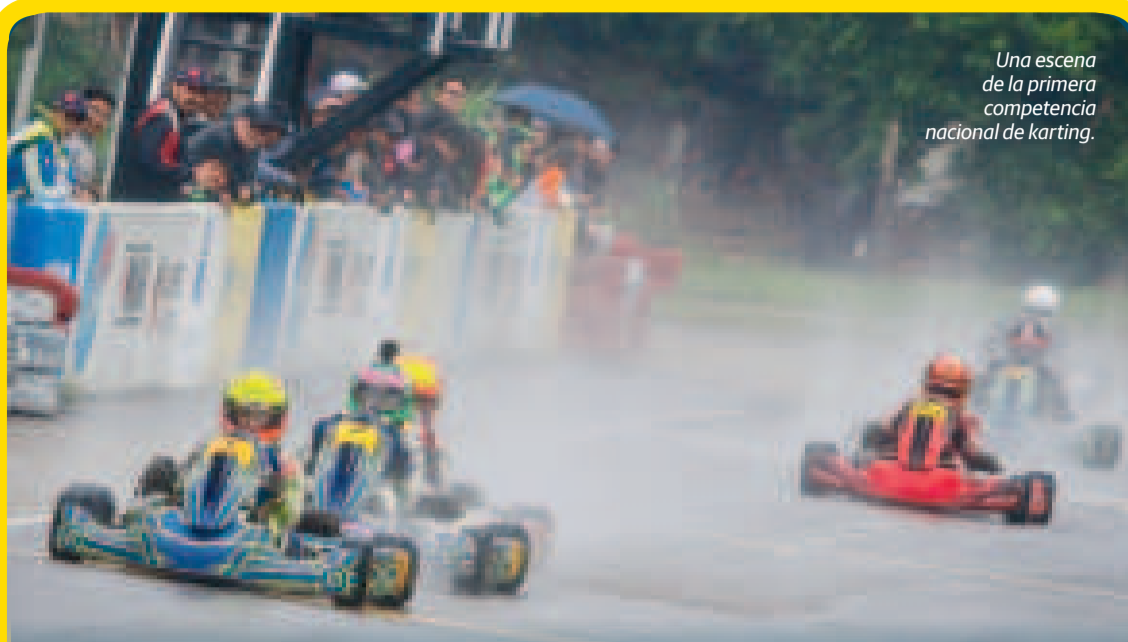
Una escena de la primera competencia nacional de karting.