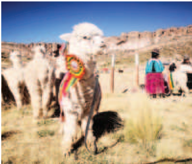
Los mejores ejemplares de los camélidos serán expuestos en el lanzamiento.