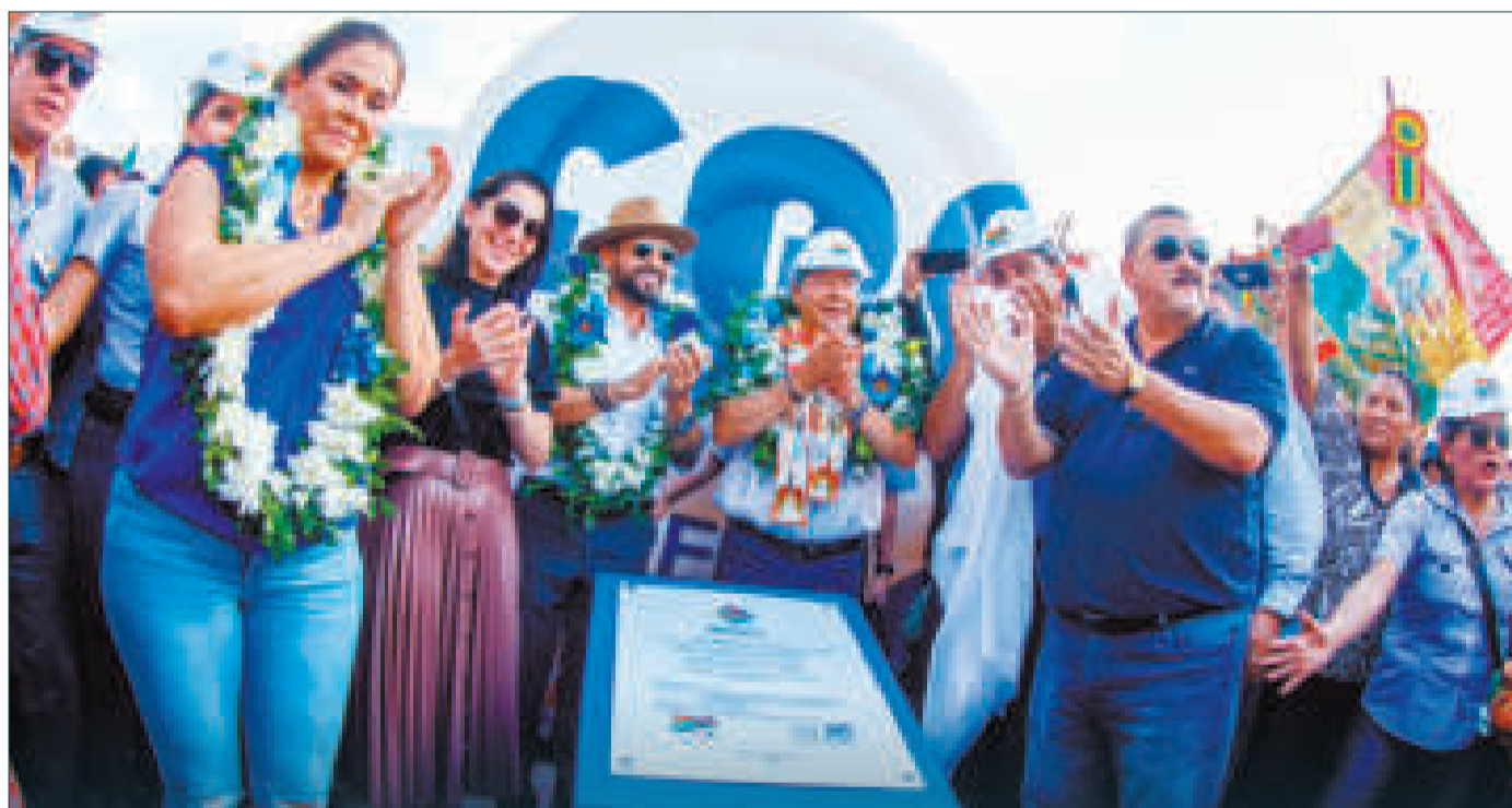
INAUGURÓ UN ENLOSETADO EN LA URBANIZACIÓN VILLA CORINA