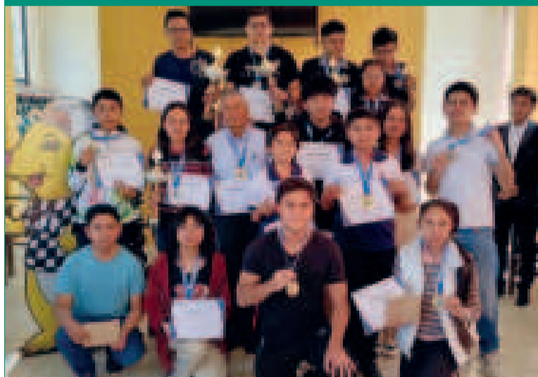
Los ajedrecistas ganadores del segundo Gran Prix.

La ganadora se impuso en cuatro partidas, empató una vez y cayó en las restantes dos.