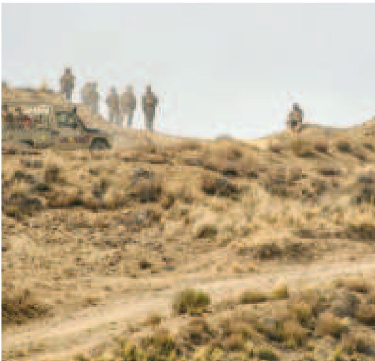
Militares del Comando Estratégico Operacional de Lucha Contra el Contrabando.