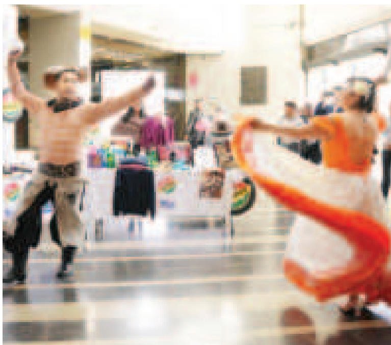
El lanzamiento de la feria multisectorial con presencia de autoridades.