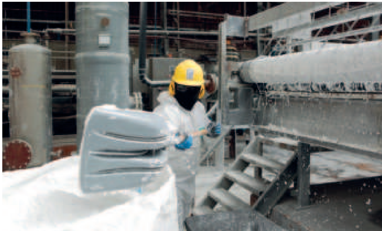
Proceso para la obtención de carbonato de litio.