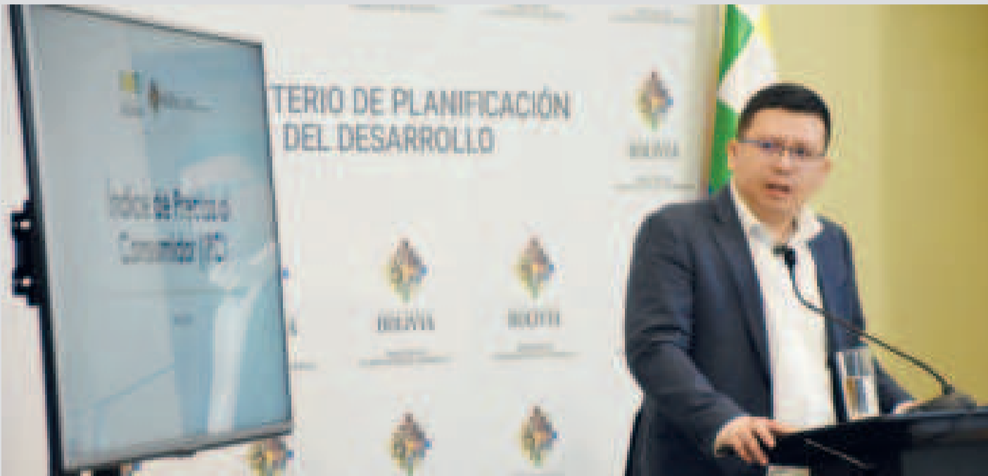
El ministro de Planificación, Sergio Cusicanqui, en conferencia de prensa.