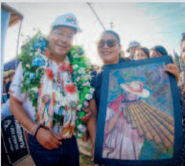
El presidente Luis Arce recibe el cariño de la gente de la urbanización Villa Corina D-3