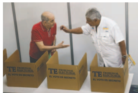
El candidato a la presidencia de Panamá José Raúl Mulino emitió su voto este domingo, en el Centro de Convenciones Atlapa en Ciudad de Panamá

Más de tres millones de electores fueron convocados a las urnas para elegir, de entre 885 candidatos, a un presidente y un vicepresidente, 71 diputados a la Asamblea Nacional (AN, Parlamento), 20 al Parlamento Centroamericano, 81 alcaldes, 701 representantes de corregimiento y 11 concejales, todos con sus