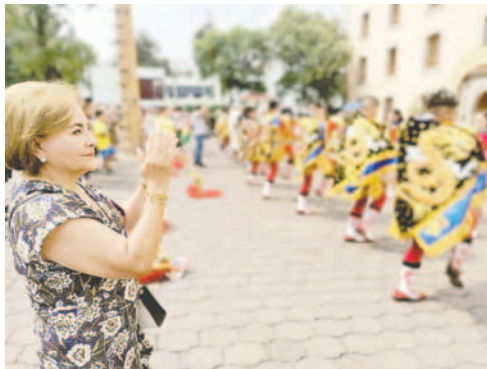
Una mujer aplaude a la Diablada Ferroviaria durante la demostración en México

El sábado 4 de mayo, las calles de ese país se vistieron del colorido del conjunto folklórico Morenada Zona Norte y de la Diablada Ferroviaria, cuyos integrantes compartie-