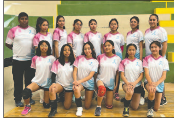
El equipo orureño listo para el torneo a realizarse en Santa Cruz