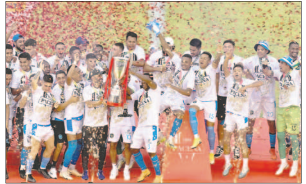
Alegria en los jugadores de San Antonio en la celebración del título