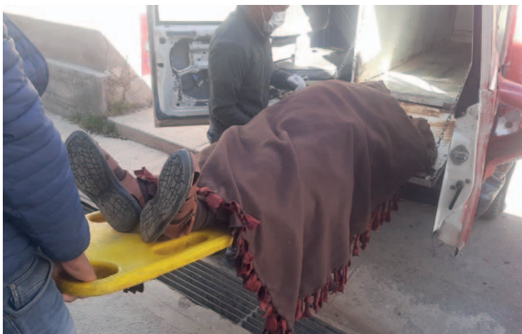
El hombre fue hallado muerto dentro del baño de su domicilio