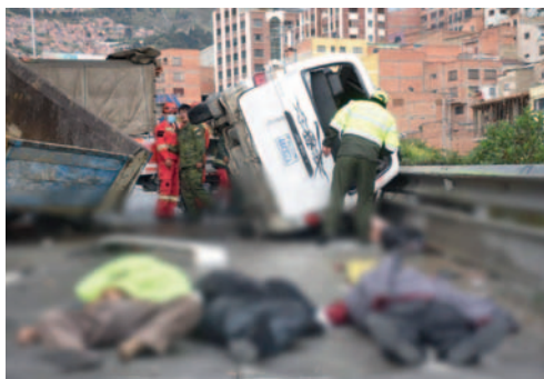
Se reportó un incremento en personas fallecidas por accidentes viales

En enero de 2024 hubo un aumento en la cantidad de accidentes de tránsito en comparación con 2023, mientras que en febrero se registró una disminución. La mayoría de estos incidentes ocurrieron en áreas urbanas, principalmente en los departamentos de La Paz, Santa Cruz y Cochabamba, además, los choques y atropellos