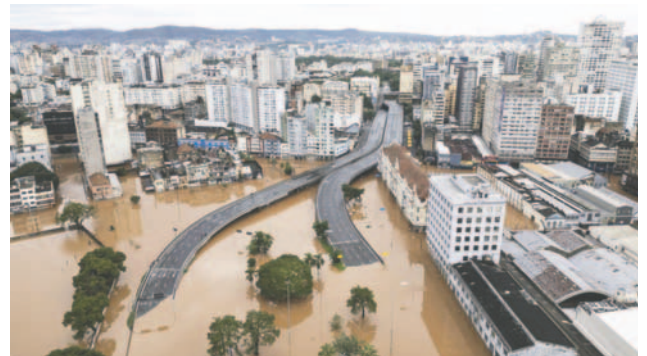
Fotografía aérea que muestra una zona inundada tras la crecida del lago Guaíba en la ciudad de Porto Alegre Brasil

"Es lo mínimo que podemos hacer... Estamos encontrando a gente