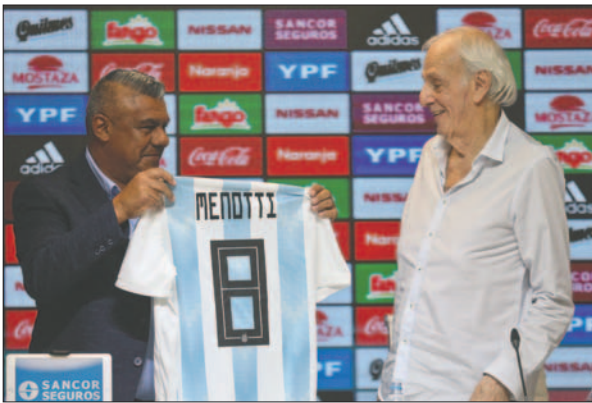
Cumplía las funciones de Director de Selecciones Nacionales de la AFA

que se distinguió por la circulación del balón constante, el juego ofensivo y la prevalencia de la técnica.