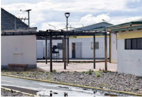
Centro de Aislamiento se encuentra en la zona Sur de la ciudad

Durante la inspección, la concejala verificó que la construcción presenta humedad, goteras en el techo y equipos de alto valor en riesgo. Por esta