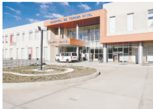
Hospital Oruro- Corea fue ejecutado con el apoyo de Koica

“En la reunión también se vio la necesidad de consolidar en donde está emplazado el Oruro-Corea, todo el tercer nivel de atención en lo que es el tema de salud. También estamos trabajando a partir de esta gestión en un nuevo proyecto que es el Centro Coordinador de