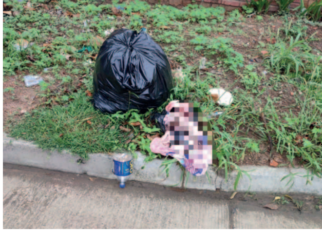
El cadáver de la bebé fue encontrado en la vía pública

Una vez conocido el hecho, se desplegó al Equipo Multidisciplinario de la Fiscalía Especializada en Delitos Contra la Vida para iniciar los primeros actos investigativos y recolectar las evidencias. En ese marco, se realizó el registro del lugar del hecho, se tomó declaración de testigos, se trasladó el cuerpo a la morgue de la Pampa de la Isla donde se realizó la autopsia por el Instituto de Investigaciones Forenses (IDIF), que determinó como causa de muerte asfixia por sofocación, entre otros elementos que ayudarán a dar con el o los autores, indicó el fiscal departamental de Santa Cruz, Roger Mariaca.