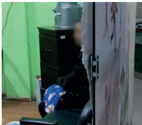
La hija cuando daba su declaración en la Felcv

El caso del adolescente, fue atendido por la Dirección de Igualdad de Oportunidades (DIO) y la Felcv, ya que la mujer, tenía lesiones considerables provocadas por los golpes. En ambos casos, los hijos usaron palos para cometer la agresión.