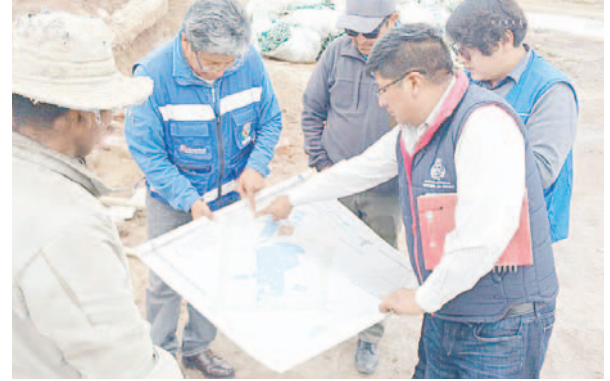
El GAMO cuenta con aproximadamente 17 hectáreas destinadas de manera exclusiva para proyectos /GAMO

el principio de autoridad, según Cepeda, también se vela futuros proyectos, como la Planta de Evaporación de Lixiviados que provienen del Relleno Sanitario que se pretende emplazar en la parte Oeste del área municipal.