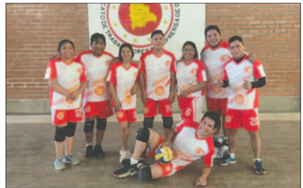
El título en voleibol mixto lo obtuvo el equipo de Directorio