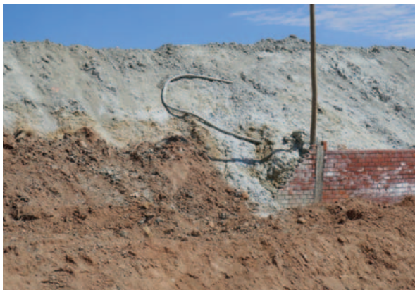
Colapso del muro del dique de colas de EMSA

Recordó que el 24 de abril se realizó una inspección con-