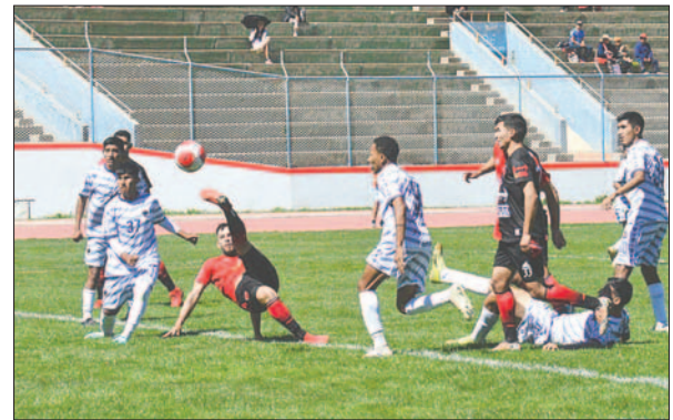
Unión Huayllamarca no desaprovechó la oportunidad para marcar