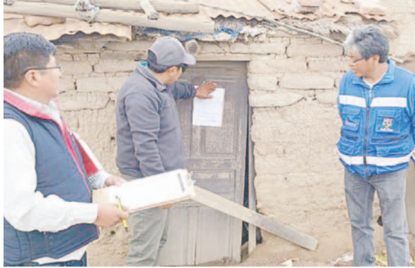
Notifican asentamientos ilegales en Parque Industrial Huajara

“Parcialmente, en el sector se está implementando la Planta de Selección y Compostaje que se viene desarrollando desde gestiones anteriores y en este último tiempo, hemos visto personas inescrupulosas, realizar