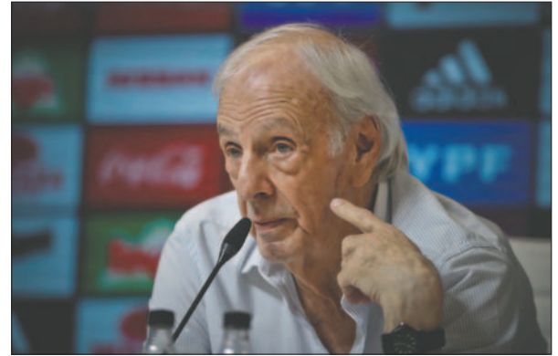
César Luis Menotti condujo a Argentina a la conquista de su primer Mundial

Fue en el Mundial en el que su país fue anfitrión, en 1978, en plena dictadura militar (1976-1983). En la final, los locales vencieron a Holanda: tras igualar 1-1 al final del tiempo reglamentario, Mario Kempes convirtió el 2-1 y Daniel Bertoni aseguró el 3-1 final.