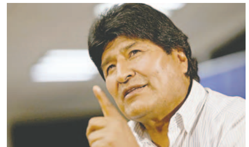
Expresidente de Bolivia, Evo Morales

situación peor que con el (supuesto) golpe de Estado de la (expresidente Jeanine) Añez, económicamente, democráticamente. Por lo menos Añez ha garantizado las elecciones, Lu-