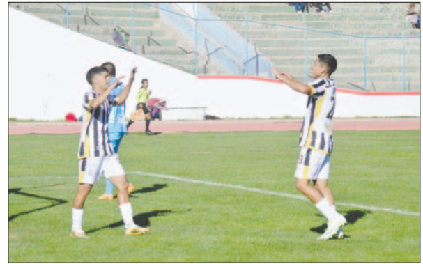
Festival de goles en la goleada de Oruro Royal a Bolívar Antequera

En el segundo tiempo, Bolívar Antequera salió decidido a buscar el gol del honor y tuvo seis minutos de buen fútbol, con claras oportunidades de marcar y exigiendo al portero Ricardo Soletto. Sin embargo, el cuerpo técnico no pudo encontrar soluciones para un equipo desorga-