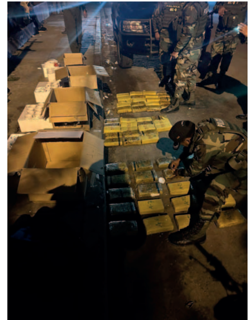
La fuerza antidroga incautó 68 kilos con 120 gramos de marihuana

Desde la Felcn se detalló que los 58 paquetes incautados tenían un peso total de 68 kilos con 120 gramos de marihuana. Además, mediante labores