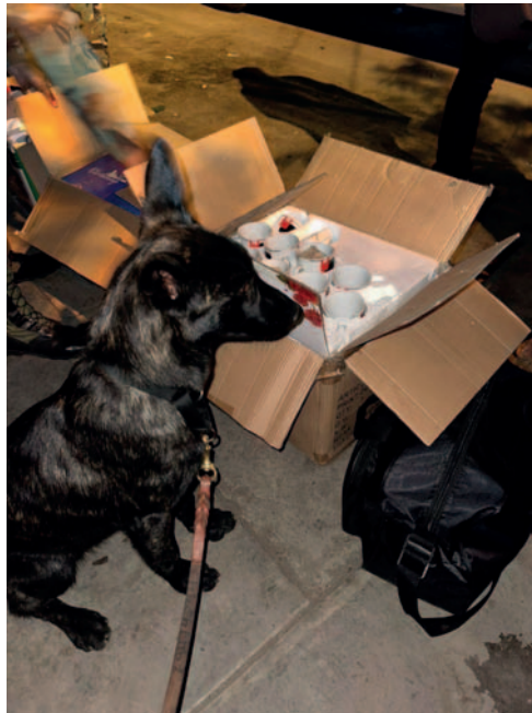
La can Queila halló las sustancias controladas en cuatro cajas de cartón