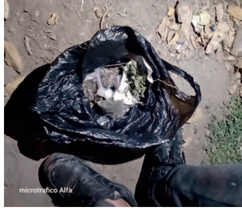
Incautaron 2.225 dosis de droga

El sujeto guardaba las dosis de cocaína y marihuana en una bolsa negra, cada una debidamente dividida para su comercialización ilegal. Se espera que durante el proceso judicial se esclarezcan los detalles sobre la presunta red de distribución a la que pertenecía el detenido y se determinen las sanciones correspondientes.