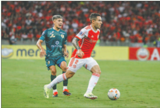
En laida jugado en Brasil, empataron 0-0