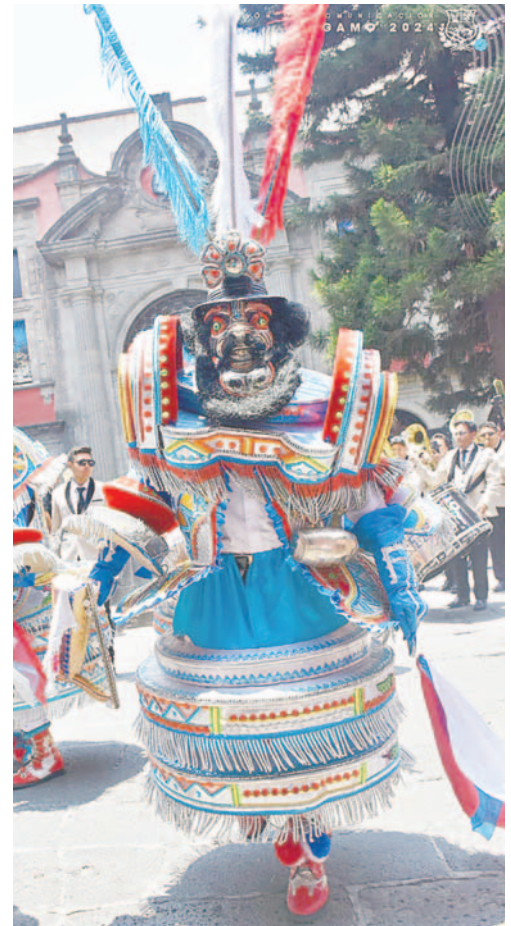
Entrada de los danzarines de la Morenada Zona Norte estuvo amenizada por la banda Decadentes

"Muy felices y privilegiados de ver a los conjuntos y la banda, de ser sus anfitriones y de que se haya hecho esta demostración y recorrido, pero además, de que nos hayan