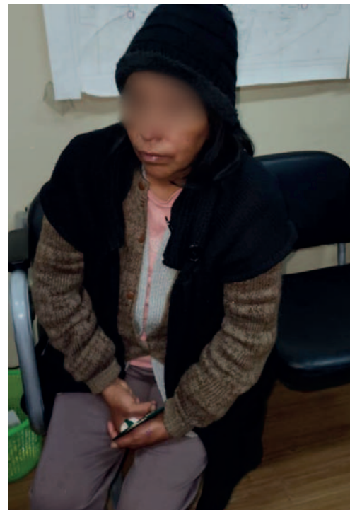
En la imagen se ve una herida en la nariz y en la mano