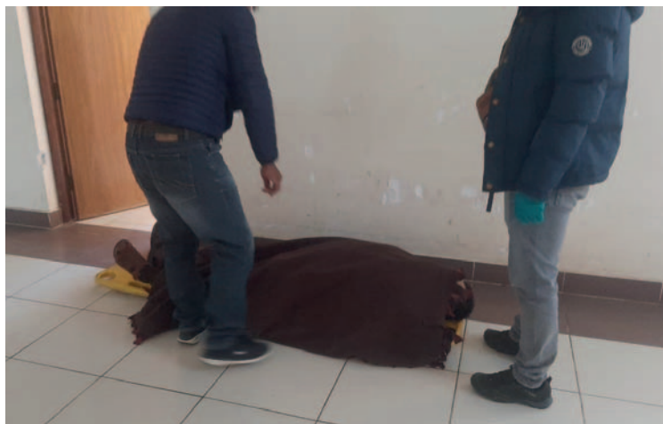
El cuerpo fue llevado a la morgue del Cementerio General para la autopsia

La autopsia está a cargo del Instituto de Investigaciones Forenses (IDIF) y el caso pasó ante el Ministerio Público para las investigaciones posteriores sobre el deceso.