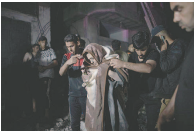
Una mujer es rescatada de los escombros de un edificio derruido tras un bombardeo israelí en Gaza

"No estamos dispuestos a aceptar una situación en la que los batallones