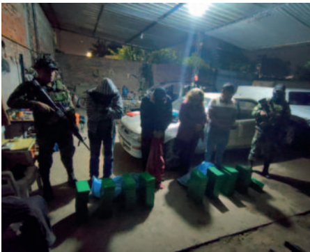
Cinco personas fueron aprehendidas