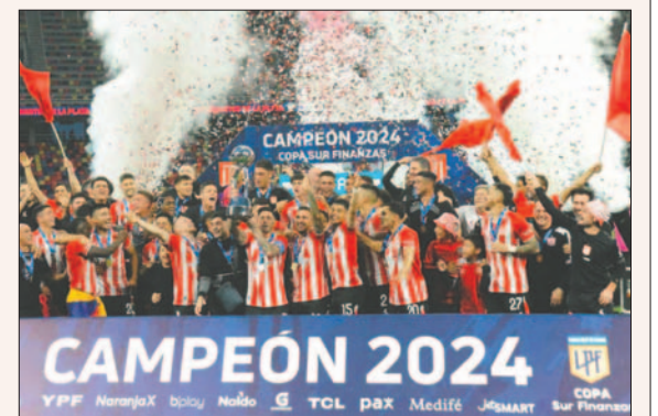
Celebran los jugadores de Estudiantes el título obtenido en Argentina