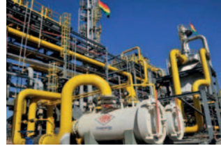
Consumo interno de gas en Bolivia superará producción desde 2030

Sin embargo, si la producción declina más rápido de lo esperado, la demanda interna podría superar la