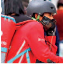
Cedla afirma que un gran porcentaje de trabajadores de “delivery” en Bolivia son jóvenes / LIBRE EMPRESA

Entre las motivaciones para trabajar como repartidor se destaca la búsqueda de mejores oportunidades económicas según los pedidos (40%), la libertad de ho-