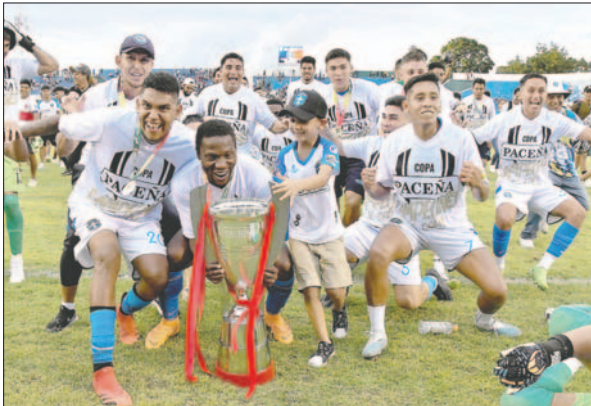
Jugadores de San Antonio con el trofeo de campeón

Mientras, la "U" quedó con el premio consuelo de Bolivia 1 para la Copa Sudamericana 2025, volviendo a jugar este torneo desde la primera fase.