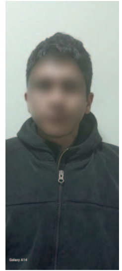
El dueño de los estupefacientes será investigado por microtráfico de droga