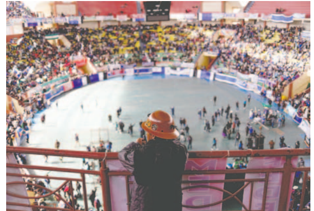
Militantes participan del cierre del décimo congreso del MAS este domingo, en el Alto

Asimismo, asistieron más de 6 mil militantes del MAS al polideportivo "Héroes de Octubre" en El Alto, ciudad contigua a La Paz, en donde después de tres días de reuniones el parti-