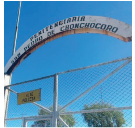
Luis F.C. deberá cumplir la condena en Chonchocoro /REFERENCIAL