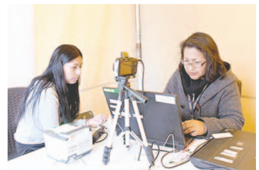
Jornada de empadronamiento /TED ORURO

Hasta la fecha, el refuerzo al empadronamiento permanente se llevó a cabo en las facultades de la Universidad Técnica de Oruro, la Universidad de Aquino Bolivia, la Universidad Privada Abierta Latinoamericana y la Universidad Privada Domingo Savio, además de institutos como el "Instituto Técnico Superior de Comercio", el Instituto Técnico "Jesús María" y el Instituto Tecnológico Simón Bolívar.