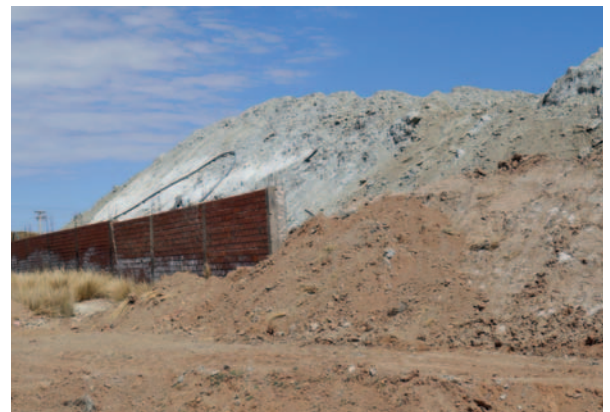
Este es el panorama a más de un mes del colapso del dique de colas de EMSA

“No estamos en contra de la minería, sabemos que es la principal actividad que sostiene a Oruro, pero se deben tomar acciones y compromisos para mitigar o evitar en la medida de lo posible la contaminación. En