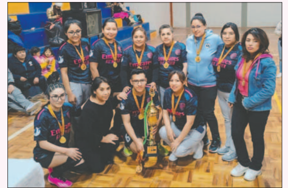
Materno Infantil se quedó con el título en el voleibol mixto