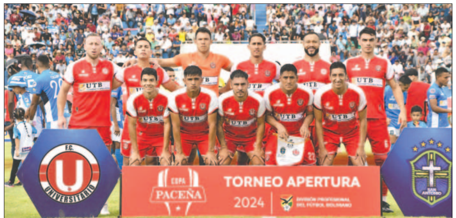
FC Universitario no deja de ser equipo revelación, que tiene la clasificación a Copa Sudamericana