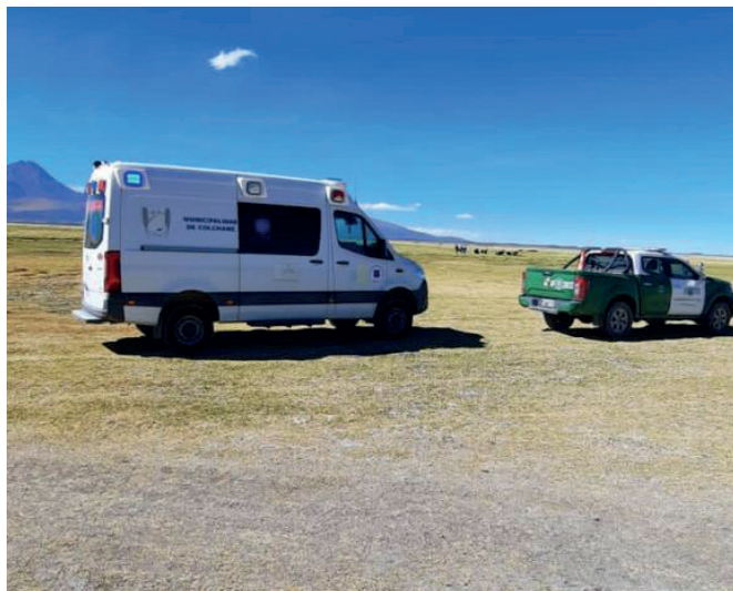
Trasladan el cadáver a una morgue para proceder con la autopsia de ley

si existen antecedentes sobre posibles problemas de salud previos que pudieran haber contribuido a este trágico desenlace.