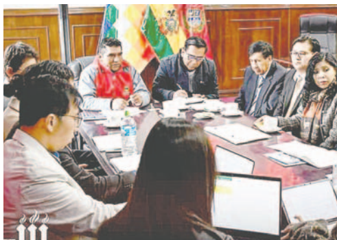
Reunión entre autoridades departamentales y Koica /GADOR

En la oportunidad, se planificó la evaluación de los proyectos en salud