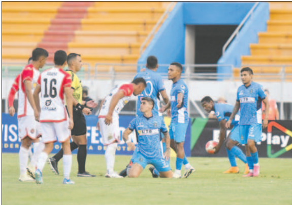
El "manzanero" quiere revertir el panorama ante el "Benjamín"

La segunda final se cumplirá esta tarde desde las 15:00 horas en el estadio "Carlos Villegas" de Entre Ríos