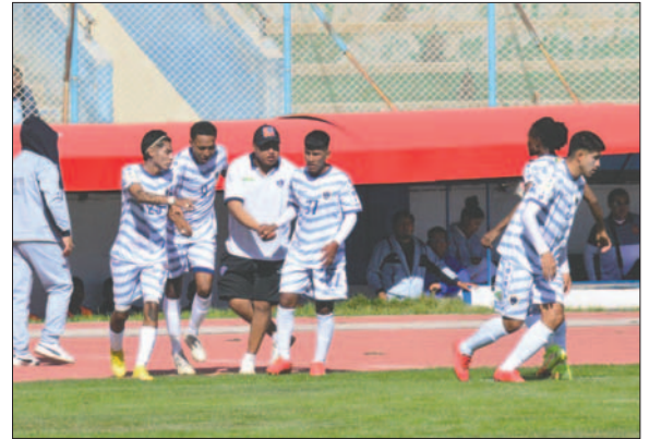
Ingenieros con la urgencia de sumar puntos