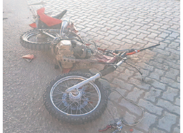
La motocicleta de la víctima fatal

Detalles adicionales señalan que tanto el conductor del camión como otros testigos están siendo entrevistados para recabar más información sobre lo ocurrido. Se espera que en los próximos días se puedan obtener más detalles sobre este trágico suceso.