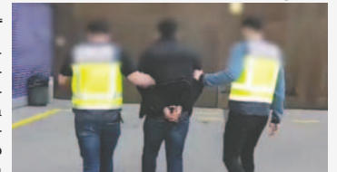
Autoridades venezolanas solicitan la extradición de Gerso Guerrero, hermano del líder del Tren de Aragua

En septiembre de 2023, Perú ofreció una recompensa por información sobre el paradero de Héctor Guerrero Flores. Asimismo, Chile solicitó su arresto. El Tren de