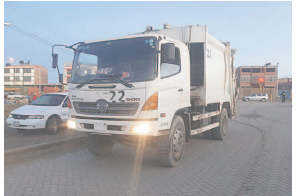
El vehículo es de EMAO