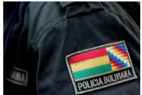
El testimonio de la mujer señala que recibió una llamada telefónica en su celular en la cual un supuesto policía le dijo que su hijo enfrentaba problemas / REFERENCIAL

En palabras del subdirector de la Felcc, Jorge Sologuren, “todo depende de nosotros. Nosotros somos los que damos datos, nosotros contestamos las llamadas que no corresponden al radio de Bolivia. Estas personas también piden el llenado de algunos enlaces”.