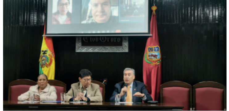
Parlamentarios del CC cuestionan gestión de la BPO

En el manifiesto político del CC en Oruro, cuestiona las gestiones de la BPO dirigidas por el MAS. Según el documento, las tareas enca-