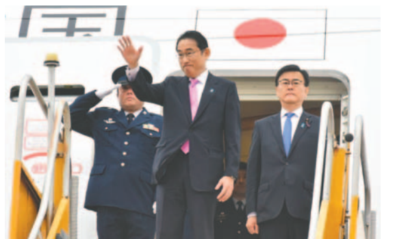
El primer ministro de Japón, Fumio Kishida, despidiéndose luego de su visita oficial a Paraguay, en el aeropuerto Silvio Pettitrossi en Luque (Paraguay)

Posteriormente, el funcionario se reunió con la colonia de japoneses en el país, donde residen alrededor de 10.000 personas de la comunidad nikkei. Finalmente, fue condecorado por Peña con el Orden Nacional del Mérito, en el grado Gran Cruz Extraordinaria.