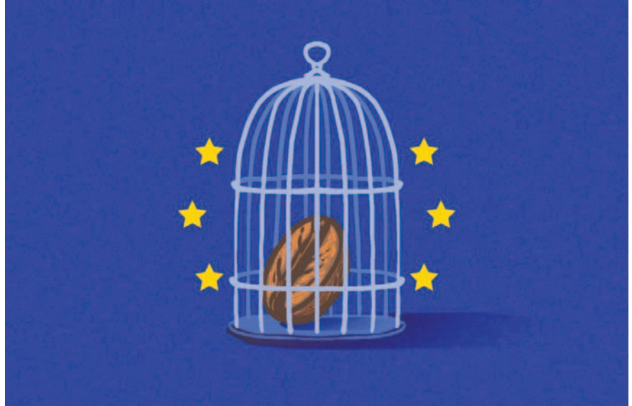
Existen inhibiciones y obstáculos impuestos a países que exportan alimentos

Semejantes pretensiones de aplicar extraterritorialmente la normativa comunitaria, dieron lugar a un cuestionamiento a través de la carta que en septiembre de 2023 dirigieron once países de América Latina y el Caribe, tres países asiáticos y