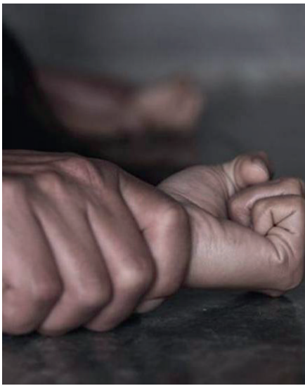
Agentes de la Felcc rescataron a la mujer de 54 años de edad del interior de un taxi/REFERENCIAL