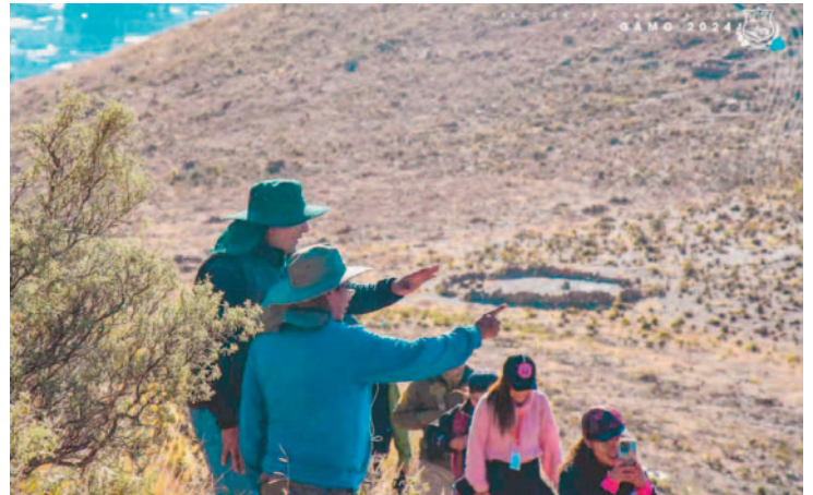
Buscan promocionar una nueva ruta turística en el municipio