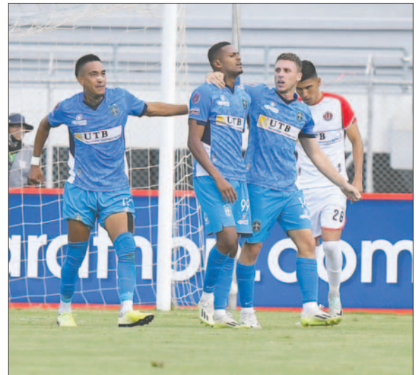
San Antonio está a un paso de su primer título profesional