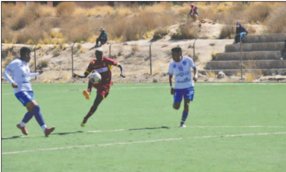
Menos de un mes para el arranque de la Primera "A"

Con todo ello se determinó comenzar el campeonato el próximo 25 de mayo con la presencia de 13 clubes, los cuales serán: Oruro Royal, Ingenieros, Deportivo Escara, CDT Real Oruro, Sur Car, Deportivo Shalon, AFIZ, Aurora, Rosario Central, Deportivo Sevaruyo, Strongest de Saucari, Sportivo Euqueño y Corque FC.