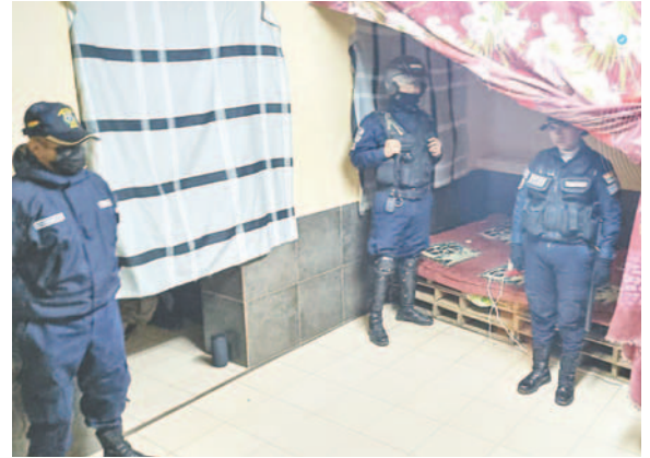
Defensa al Consumidor intervino actividad ilegal

Según Canqui, durante la intervención se identificó la presencia de señoritas en el interior,