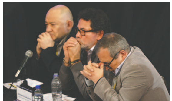
Foto de archivo de los integrantes del antiguo Secretariado de las Farc, (i-d) Julián Gallo, Pastor Alape y Rodrigo Londoño

La UNP, entidad encargada de la protección de los firmantes de paz y también de líderes sociales, ha sido cuestionada por su eficacia y se ha visto salpicada por escándalos de corrupción.