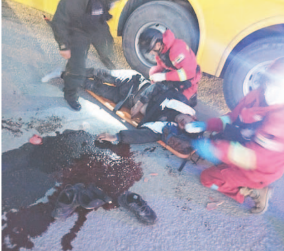
El motociclista sangró tras el impacto

indicaron que se hizo cargo del caso el personal de Tránsito de la División Accidentes para llevar a cabo las investigaciones correspondientes y determinar las circunstancias exactas que llevaron a esta tragedia.