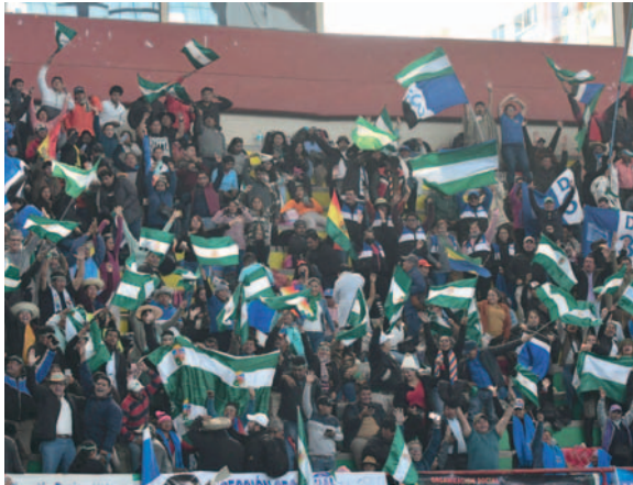
Llegaron militantes de diferentes partes del país

En el marco del congreso del bloque de los renovadores del Movimiento Al Socialismo (MAS), se llevarán a cabo ajustes al estatuto orgánico del partido para modernizarlo, según informó el ministro de Obras Públicas, Édgar Montaña. El evento se desarrolla en un contexto de disputas internas dentro del partido gobernante, donde se busca eliminar caudillismos y abrir espacio a nuevas generaciones.