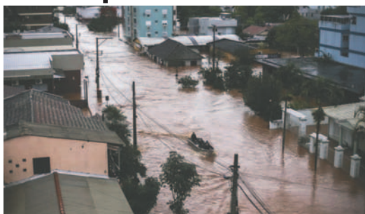
La crisis climática global está generando eventos climáticos más intensos y frecuentes en todo el mundo

"Esta inundación que enfrentamos superará con creces lo ocurrido en nuestro estado en 1941", expresó Paulo Pimenta, secretario de Comunicación Social de la Presidencia de Brasil. El gobernador Eduardo Leite advirtió sobre el riesgo