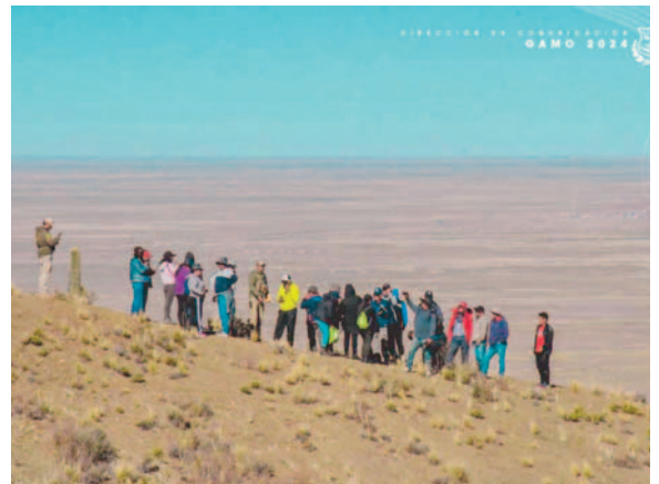
Instan a preservar el área protegida de Chusaqueri /GAMO

“Agradecemos al alcalde por su apoyo y seguramente tendremos reuniones para discutir nuestras proyecciones a futuro. También es importante consolidar el tema del mirador, son cosas que queremos promover y, como dijo el alcalde, queremos fortalecer la zona turística de la ciudad”, enfatizó.