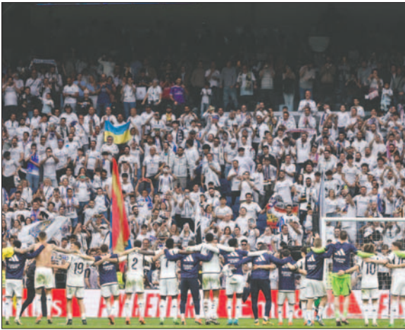
Una celebración especial en el Santiago Bernabéu

Una celebración contenida con la afición, con la mente en un partido que marcará la nota final de la temporada, la vuelta de semifinales de Champions ante el Bayern, cuya cercanía rebajó la euforia. Un resultado que, en la otra cara de la moneda, deja al Cádiz teniendo que recuperar, al menos, cinco puntos con 12 en juego para evitar el descenso y mirando los resultados de Celta de Vigo y Mallorca en sus respectivos partidos para echar cuentas.