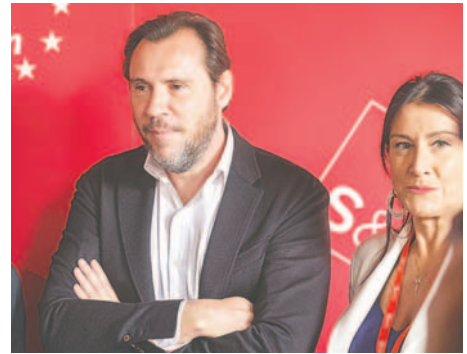
El ministro español de Transportes y Movilidad, Óscar Puente, durante su participación en la III Escuela de Gobierno que se celebró el viernes en la ciudad de Salamanca

En respuesta a las acusaciones vertidas por el ministro Puente, el Gobierno argentino emitió un comunicado enérgico repudiando sus dichos y aprovechando para lanzar críticas hacia Pedro Sánchez. En este contexto, se destaca la preocupación expresada por Argentina sobre la es-