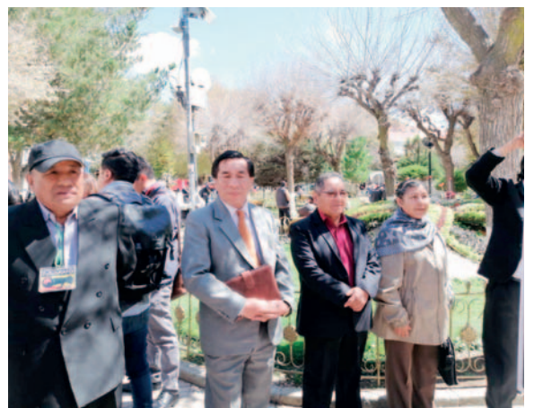
Asociación de Fotógrafos celebró aniversario

En las reuniones entre los asociados, se imparten cursos de ética y relaciones públicas, así como se comparte experiencia y conocimientos en fotografía con aquellos que se inician en esta noble labor, que también es un arte.