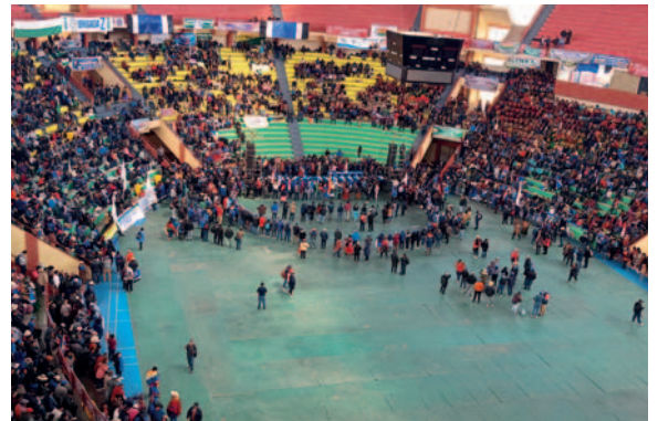
El congreso culminará este domingo 5 de mayo