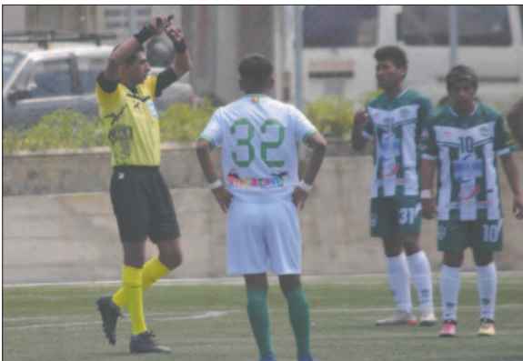
Flores vuelve al arbitraje luego de seis meses de ausencia