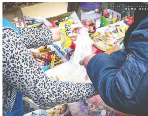
Productos que no contaban con registro sanitario fueron decomisados

En esta oportunidad, Defensa Al Consumidor decomisó los productos que no contaban con el registro sanitario correspondiente. A través de inspección, se