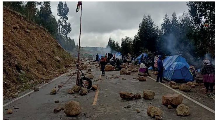
En enero se realizó bloqueos en diferentes partes del país, manifestantes pedían elecciones judiciales

La propuesta presentada busca evitar futuras pérdidas económicas y garantizar la estabilidad del país ante posibles bloqueos carreteros.