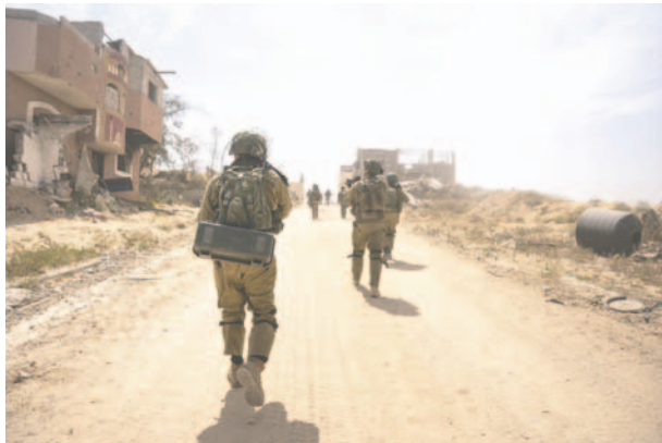
Soldados israelíes en la Franja de Gaza

El viernes, Hamas dijo en Telegram que enviaría una delegación a El Cairo el sábado con un “espíritu positivo” para continuar las discusiones sobre la reciente propuesta de alto al fuego y liberación de rehenes, “decididos a finalizar el acuerdo para satisfacer las demandas de nuestro pueblo”.