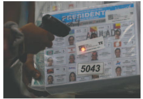
Una empleada del Tribunal Electoral registra bolsas con papeletas electorales este 4 de mayo de 2024, en una bodega en Ciudad de Panamá (Panamá)

"La campaña electoral es un proceso plagado de pasiones, controversias y debates. Por supuesto, Panamá no escapa a estas características fundamentales con las peculiaridades que presenta este proceso", dijo el jefe de la Misión de Observadores Electorales de la Unión Interamericana de Organismos Electorales (Uniore), Wilfredo Penco.