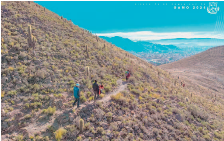
Invitan a visitar la nueva ruta turística en Chusaqueri / GAMO