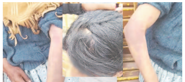
La denuncia fue reflejada por la Dirección de Igualdad de Oportunidades del GAMO /DIO

Mientras se llevan a cabo las investigaciones, el adolescente fue trasladado a un centro de