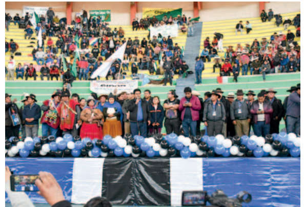
Representantes de organizaciones sociales estuvieron al frente del congreso en el segundo día

En el proceso de refundación del MAS, se busca eliminar las hegemonías y caudillismos eternos como el liderazgo de Evo Morales. Se pretende dar oportunidad a nuevas generaciones para dirigir el Instrumento Político por la Soberanía de los Pueblos, rompiendo con la tradición de un solo líder al mando del partido.