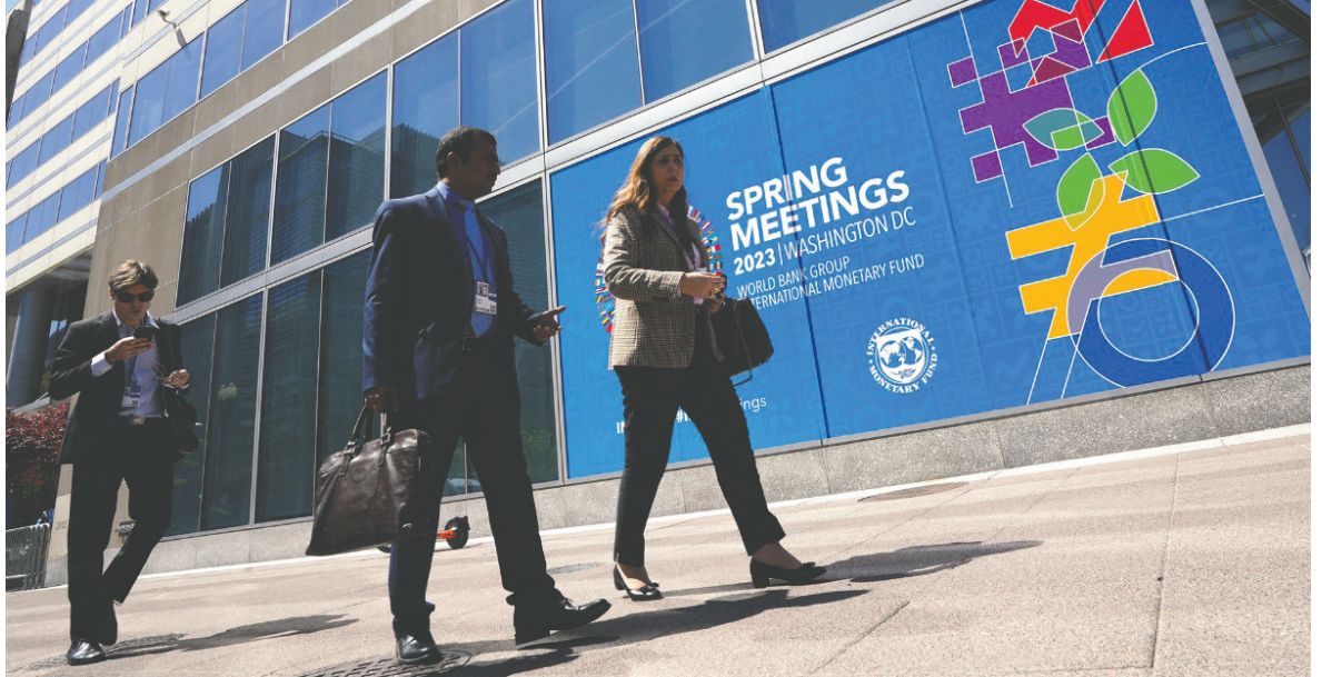
El FMI y el Banco Mundial siguen priorizando las necesidades inmediatas, en lugar de considerar los desequilibrios que genera el modelo petrolero en el mediano y largo plazo / LATINOAMÉRICA21

La mayoría de los PEED sufren por la deuda soberana, un problema que se vio agravado tanto por la irrupción del Covid-19 como por las múltiples crisis que subsiguieron. Esto significa que los gobiernos terminan asignando más fondos a servicios de deuda que a salud o edu-