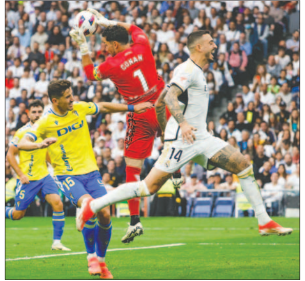
Victoria inobjetable del "merengue" para alzar un nuevo título

Y solo un minuto después, Brahim, en otra acción individual girándose en la frontal y disparando con la pierna derecha a la escuadra, hizo el 1-0. Un guiño de partido que,