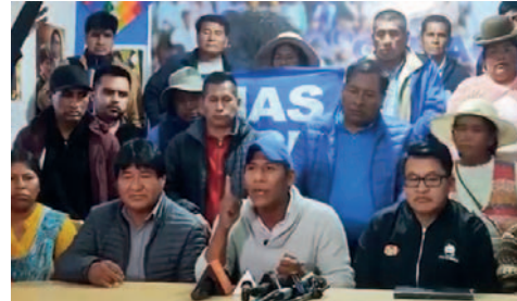
Bases del MAS en vigilia en La Paz

"Cualquier enfrentamiento en puertas de nuestra dirección nacional del MAS tiene como responsable directo a Luis Arce