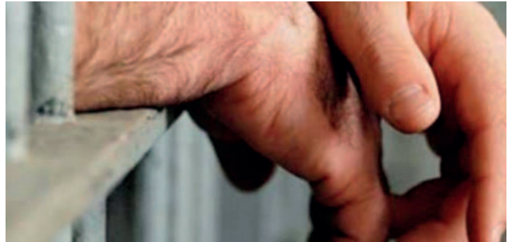
El hombre deberá cumplir presidio en el Centro Penitenciario San Pablo/REFERENCIAL

“Se han presentado diversos elementos probatorios, incluyendo la pericia psicológica, la declaración de la víctima, el reconocimiento del agresor y otros elementos que han demostrado la existencia del hecho”, aseguró Tejerina.