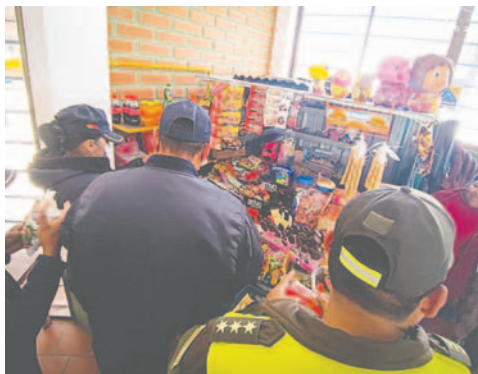
Operativo en quioscos escolares /GAMO

Durante el operativo, también se verificó la ca-