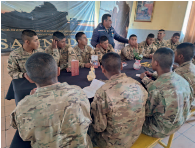
Visita al Regimiento Satinadores Germán Busch

Posteriormente, la institución defensorial sostuvo reuniones con los soldados de esta unidad militar para explicarles sobre los derechos humanos y el Mecanismo de Prevención