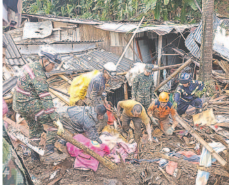
Integrantes del Ejército mientras trabajan en la remoción de escombros y búsqueda de personas atrapadas tras un derrumbe en el barrio la Esneda, en Dosquebradas (Colombia)

“Desde la madrugada de hoy (sábado), un equipo especializado en respuesta de emergencias ha acompañado las labores de rescate de personas en la emergencia presentada en Dosquebradas, Risaralda”, indicó el Ejército en un comunicado.