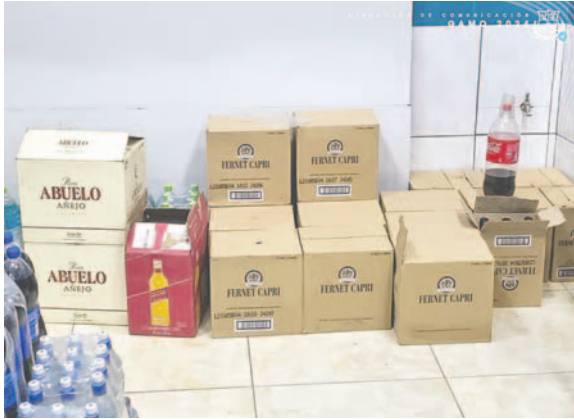
En operativo, decomisan bebidas alcohólicas sin registro sanitario

En un local de la zona Sur de la ciudad donde se tenía prevista una fiesta, la Unidad de Defensa al Consumidor procedió a verificar la documentación de la cancelación por concepto de espectáculos públicos en las arcas del municipio, ya que en el local se anunciaba la participación de diferentes grupos musicales.