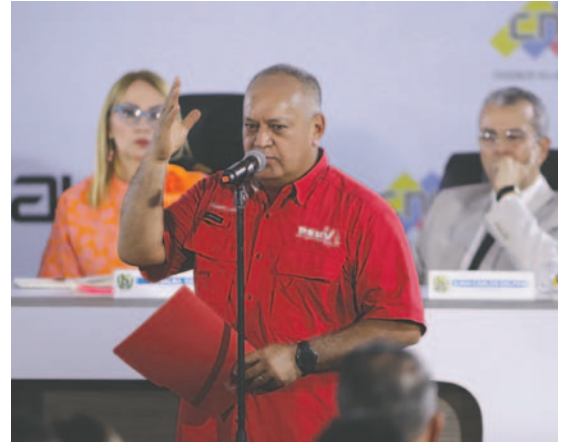
Fotografía de archivo del primer vicepresidente del Partido Socialista Unido de Venezuela (PSUV), Diosdado Cabello, en la sede del Consejo Nacional Electoral (CNE) en Caracas (Venezuela)

Asimismo, llamó a la organización y a seguir conformando las UPAZ (Unidades Populares para la Paz) y así garantizar que cada comunidad pueda "defender el territorio".