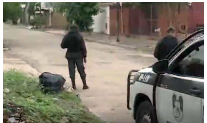
Los oficiales comenzaron con la investigación de oficio para dar con los responsables

Las autoridades policiales han iniciado una investigación de oficio