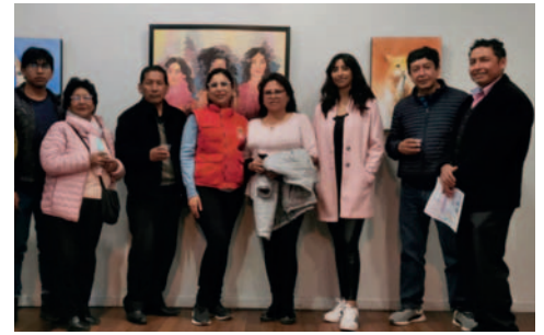
Dos de las expositoras y algunos invitados luego de la inauguración

"Oruro es mi tierra desde hace mucho, estoy volviendo porque ahora radico el Cochabamba y también estuve en Europa. Mi especialidad es escultura y compartir esta muestra con otras mujeres me hace sentir muy agradecida. La