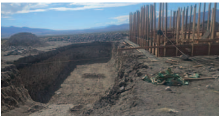
Impiden inspección para construcción ilegal dentro del Parque Nacional Sajama

Asimismo, se informó que la construcción no está siendo financiada por la Gobernación del Departamento de Oruro ni por el municipio de Turco, sino que está siendo ejecutada con fondos propios de los habitantes de Tambo Quemado, quienes contrataron a la empresa constructora.