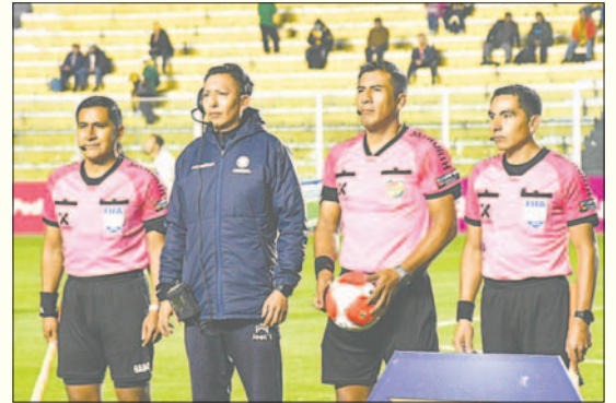
Los árbitros del país esperan ser escuchados por la dirigencia de la FBF

En caso de que este pedido sea ignorado, la agremiación podría ingresar en un paro de actividades afectando la agenda de la segunda mitad del año del fútbol profesional.