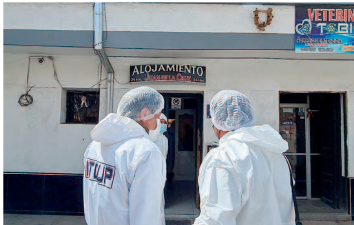
El cuerpo de la mujer fue encontrado al interior de una habitación de un alojamiento