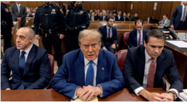
El expresidente estadounidense Donald Trump (c) en el tribunal con los abogados Emil Bove (i) y Todd Blanche (d) durante su juicio