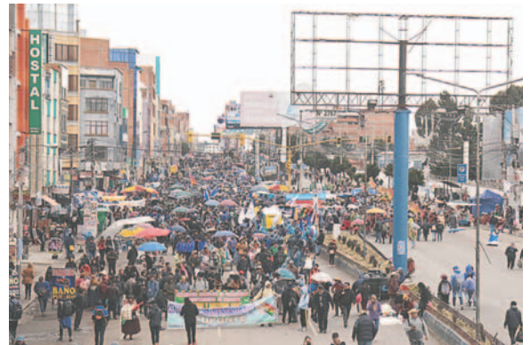
Las organizaciones sociales fueron llegando desde tempranas horas de ayer

Durante el congreso, se espera que se discutan estrategias para consolidar la participación activa de las organizaciones sociales en la toma de decisiones políticas y fortalecer la representatividad del MAS.