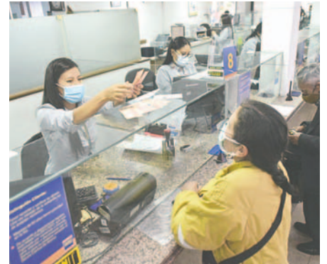
Más de 700.000 clientes reciben beneficios por el cumplimiento con sus pagos