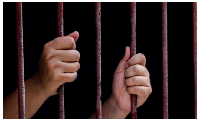
El padrastro vejó sexualmente a la víctima por más de 8 años /REFERENCIAL

“Este hecho fue denunciado por la profesora de la víctima y de forma inmediata la Fiscalía realizó las diligencias investigativas, entre ellas el informe psicológico de la afectada que corroboró el mal estado emocional y el relato de los hechos suscitados, declaración de la adolescente en Cámara Gesell y otras que fueron contundentes para que el padrastro