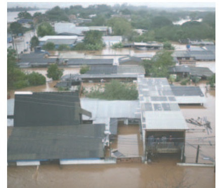
Fotografía aérea de una vasta zona inundada por las lluvias en Porto Alegre (Brasil)

Rio Grande do Sul, con una población de 11 millones de personas, ha sufrido en el último año una serie de eventos climáticos extremos asociados al fenómeno de El Niño, que ha provocado un aumento en las precipitaciones en el Sur del país.