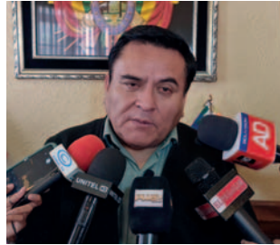
El fiscal departamental confirmó a los periodistas la denuncia e inicio de las investigaciones

Morales explicó, según la denuncia presentada, que supuestamente el asesor habría extorsionado con 50 mil dólares al representante de la empresa minera para retirar la denuncia en el Ministerio Público por el delito de contaminación, comercialización ilegal de minerales y uso de sustancias controladas.