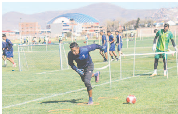
Los jugadores continuarán trabajando, quedaron las ganas de jugar el amistoso

Sin duda el más perjudicado tras esta distracción, es el equipo de GV San José, lo que pasa es que el cuerpo técnico tenía planificado jugar este amistoso, para soltar las cargas del duro trabajo físico que se estuvo realizando en este tiempo. Ahora solo les queda continuar con los entrenamientos a la espera de la concreción de algún partido amistoso, antes del inicio del campeonato Clausura.