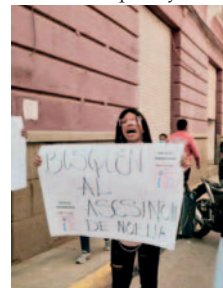
Mujeres trans y trabajadoras sexuales exigen justicia por su compañera fallecida

“Ayudamos a nuestras familias. A veces venimos de familias humildes y no es posible que nos quiten la vida, que quede impune cada feminicidio que hay en el