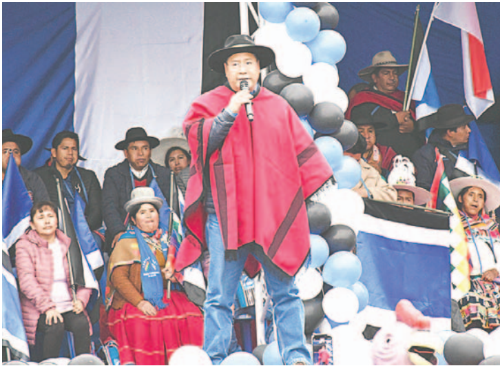
Luis Arce inauguró el congreso de una de las facciones del MAS