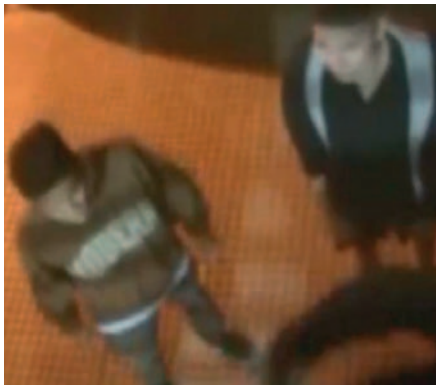
Una pareja fue víctima de un violento atraco en la puerta del domicilio en Cochabamba /CAPTURADA