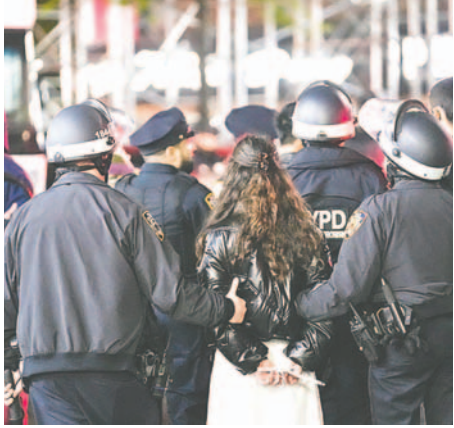
Agentes de policía de la ciudad de Nueva York realizan un arresto después de ingresar al Hamilton Hall de la Universidad de Columbia

La Universidad de Chicago había sido más permisiva con la protesta que muchas otras en el país, ya que forma parte de una tradición de favorecer la libertad de expresión en su recinto. Según medios locales, cientos de estudiantes seguían acampados pese a la advertencia de su presidente, mientras aumentaba la presencia policial. Esta situación se vive el día después de que el presidente de EE.UU., Joe Biden, acogiera el discurso que tacha de violentas y antisemitas unas protestas que han sido abrumadoramente pacíficas. Muchos de los campamentos propalestinos en decenas de universidades públicas y privadas han sido desalojados por la policía en los últimos días bajo esta misma justificación, en operativos que han dejado más de 2.500 estudiantes detenidos, según un recuento del The New York Times. En uno de los operativos con más detenidos, el de la Universidad de Columbia a principios de semana, un agente disparó accidentalmente su arma, según reconoció este viernes la Policía neoyorquina. Según la versión oficial, el agente rompió el cristal de una ventana del edificio al que intentaban entrar y cambió su arma reglamentaria de mano cuando se