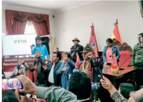
Posesionan al directorio 2024-2025 de la ALDO

La Sesión Extraordinaria número diez tenía como único objetivo la