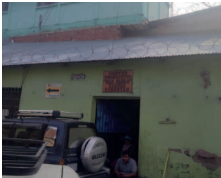
Un hombre de 61 años confesó el crimen y fue condenado a 10 años de cárcel /FGE