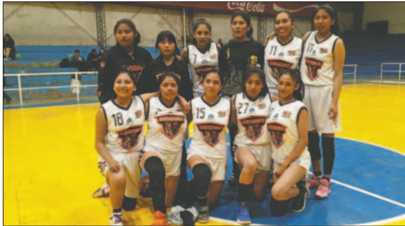
Uriona tiene un gran elenco para afrontar la Libomenor

Oruro tendrá dos representantes en este campeonato: Saavedra, que el pasado 21 de abril se consagró campeón del torneo local en la división Pasarela, junto al equipo de Uriona, que terminó en segundo lugar, pero cuenta con un gran plantel.