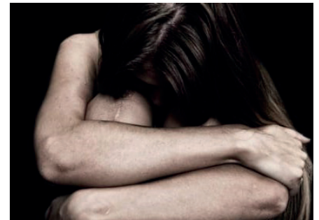
El esposo de la mujer la obligó a quitarse la ropa para luego abandonarla en la calle/REFERENCIAL