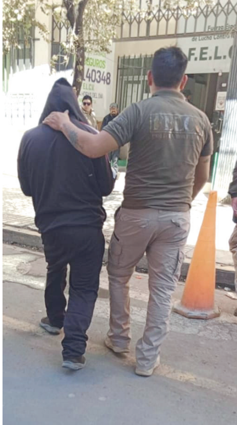
El sujeto fue aprehendido por agentes de la Felcv/DINA

En coordinación con la Fuerza Especial de Lucha Contra la Violencia (Felcv) y el Ministerio Público, el agresor es investigado por el delito de violación.