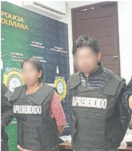
La pareja fue aprehendida por agentes de la policía