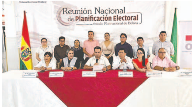
La OEP ha ratificado su compromiso con los valores constitucionales y los principios de la democracia /ÓRGANO ELECTORAL

Señalaron que la demora en el proceso de preselección de candidatas a las magistraturas del Órgano Judicial y del Tribunal Constitucional Plurinacional, en los plazos establecidos por la Ley 1549, representa un riesgo para la democracia y la seguridad jurídica del país. Además que afecta a la elección y posesión de las autoridades judiciales este 2024, pues podría coincidir con la realización de procesos electorales que se avecinan.