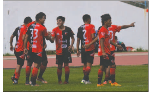
Unión Huayllamarca pretenden mantenerse en la punta a costa de Ingenieros