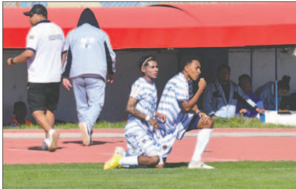
Ingenieros en busca de recuperarse en el partido de este domingo