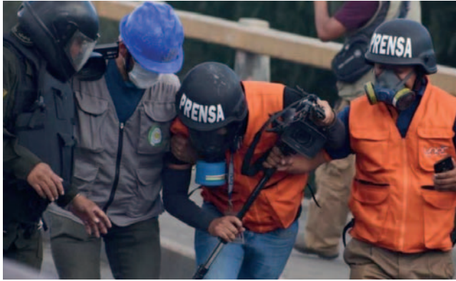
Bolivia ocupa el puesto 124 de 180, lo que indica un panorama preocupante para los comunicadores en el país

El informe anual de la RELE, perteneciente a la Comisión Interamericana de Derechos Humanos (CIDH), destacó que el año pasado se realizó una visita in situ para constatar las denuncias sobre la situación de la libertad de prensa y expresión en