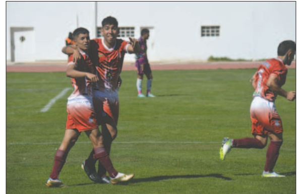
Oruro Royal necesita recuperarse para no quedar relegado