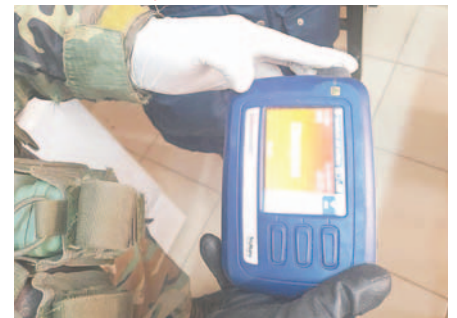
La privada de libertad cumplía detención preventiva por un caso de narcotráfico/FELCN