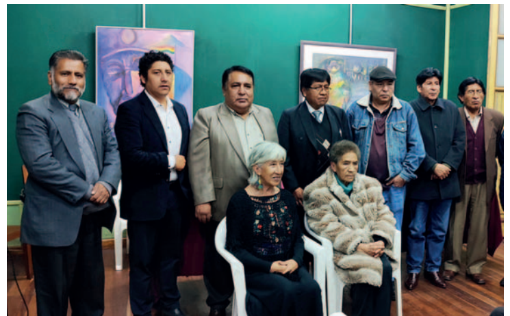
Algunos de los invitados y expositores luego de la inauguración / JAVIER TARGUI

"Esta exposición ya es tradicional, hasta este momento se han hecho 15 exposiciones por el 1 de mayo y junto con el artista Grover Padilla hemos invitado a otros de diferentes lugares, con la temática social, porque queremos dedicar esta muestra a los