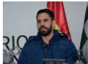
El ministro Del Castillo se dirigió a los medios

Estos tres individuos, dos mujeres y un hombre, presuntamente habrían agredido física y verbalmente a una mujer de pollera. La víctima presentó una denuncia, lo que llevó a la intervención policial y posterior