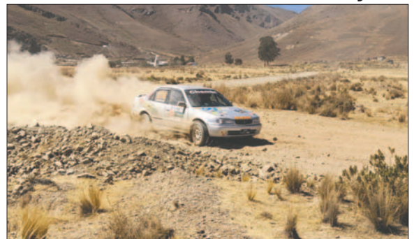
La prueba está prevista para el 18 y 19 de mayo

La prueba estará reservada para las categorías R2B, R1B, Promocional y RC5. Las inscripciones de los binomios se cumplirán desde el 6 de