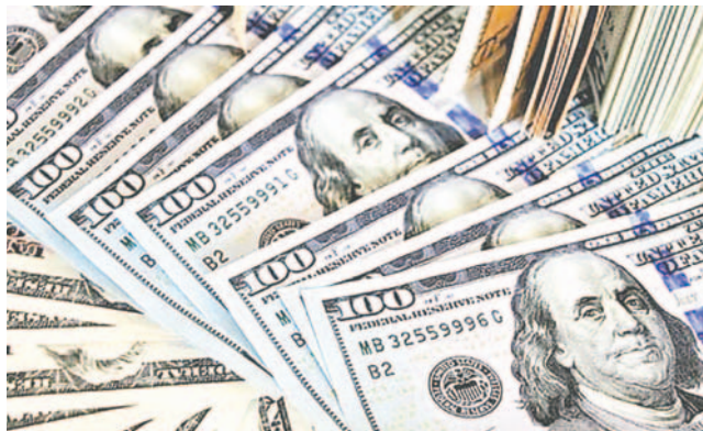
Se desconoce la procedencia y destino final del dinero/REFERENCIAL

El comandante Claire informó que durante la requisita realizada en inmediaciones de Pisiga, se descubrió que uno de los sujetos llevaba adheridos a su cuerpo cerca de 39.985 dólares, mientras que en