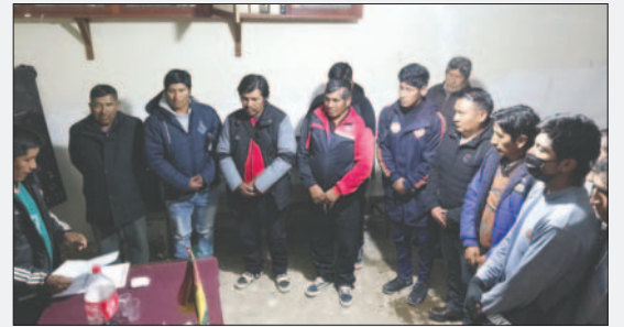
Dirigentes y delegados de la Liga Provincial de Fútbol Oruro

La inauguración del certamen 2024, se realizará en un acto especial con la participación de todos los equipos inscritos, el domingo 2 de junio. Una vez finalizado el campeonato, se otorgarán premios a los tres primeros de cada categoría, consistentes en trofeos y medallas.