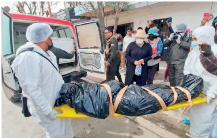
La víctima ayudaba económicamente a sus padres y familia

En medio de este escenario desgarrador, las autoridades continúan trabajando arduamente para llevar ante la justicia al responsable detrás del asesinato de la mujer trans.