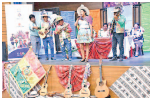
El IV Festival Nacional Rotativo del Charango "Ch'ajwaku" llega a Sucre en próximas semanas