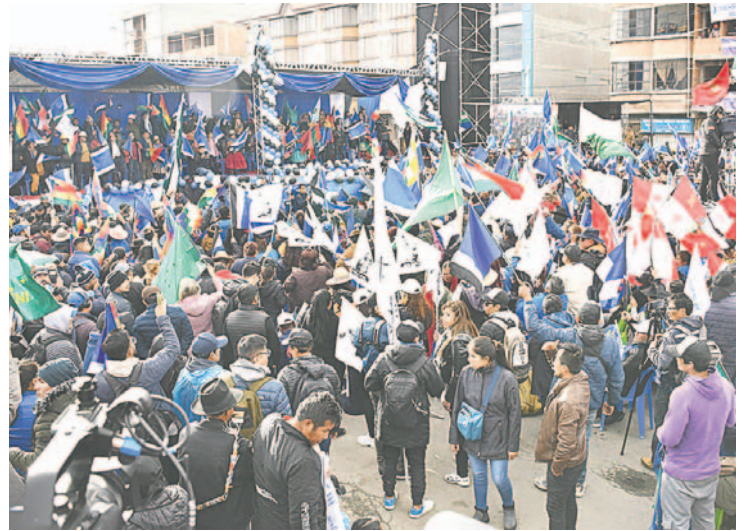
Muchos militantes se dieron cita en El Alto