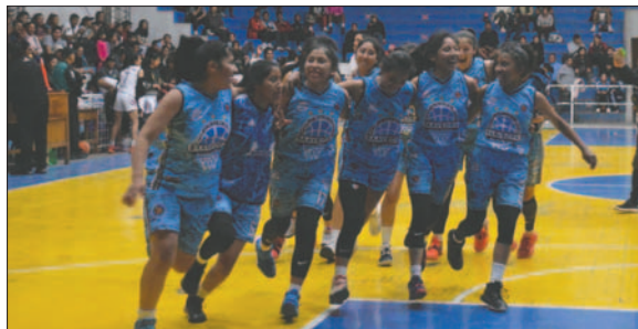
Saavedra llegará a la Libomenor en calidad de campeón orureño

El grupo "D" será el primero en comenzar el torneo, con sede en Cochabamba, y se desarrollará entre el 9 y 12 de mayo. Los clubes involucrados en esta serie son: San Simón (Cochabamba), Golden (Tarija), Bulls (Santa Cruz), Kinwa (La Paz), Cubabol (Cochabamba) y Academia Mamba (Beni).