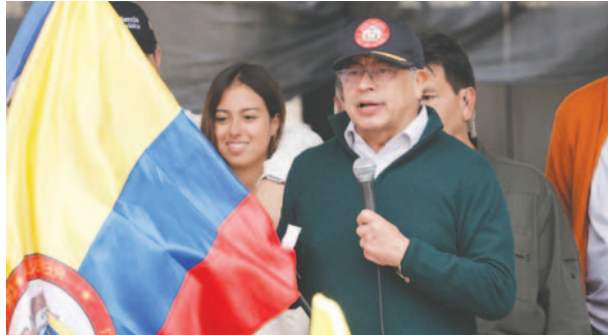
Foto del presidente de Colombia, Gustavo Petro

La Cancillería colombiana también comunicó este viernes que se le informó al embajador que a través de la Dirección de Protocolo de la Cancillería se coordinará el procedimiento y los tiempos para la salida del personal diplomático, también se ratificó la intención de mantener la actividad de las respectivas Secciones Consulares