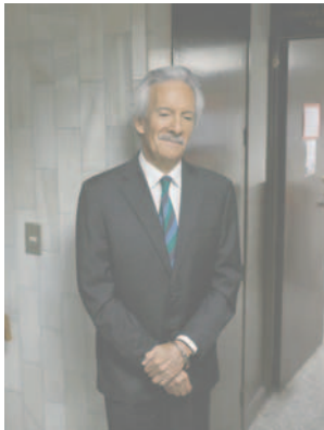
Fotografía de archivo en la que se muestra al periodista José Rubén Zamora Marroquín en la Torre de Tribunales para una audiencia por un caso en su contra, en Ciudad de Guatemala (Guatemala)

El periodista guatemalteco José Rubén Zamora Marroquín cumplió este viernes 644 días en prisión preventiva en el país centroamericano,