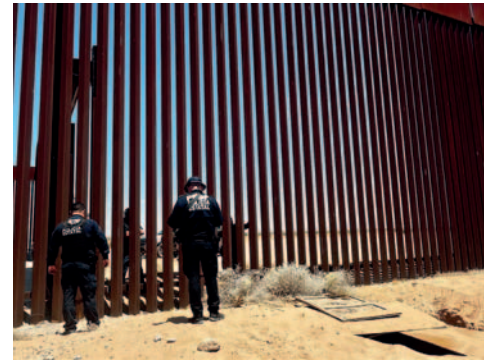
Policías resguardando la zona donde descubrieron una excavación en el municipio de San Luis Río Colorado, Sonora (México)

El narcotúnel más grande descubierto fue en enero de 2020, entre Tijuana (México) y San Diego (EE.UU.), contaba con iluminación, aire acondicionado, suministro eléctrico de alto voltaje, un elevador y un sistema de rieles por los que se desplazaba un carrito similar a los utilizados en minería para transportar la droga por debajo de la línea Internacional.