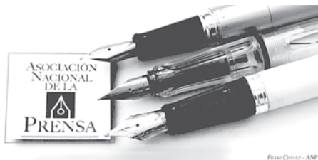
Imagen referencial / ANP

En adhesión al Día Mundial de la Libertad de Prensa proclamado por la Asamblea General de las Naciones Unidas, en 1993, a raíz de una recomendación adoptada por la Conferencia General de la Unesco en 1991, la Asociación Nacional de la Prensa (ANP) reivindica la Libertad de Expresión como requisito para defender el medioambiente, tema elegido en 2024, para reflexionar sobre el trabajo periodístico y las campañas de desinformación.