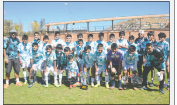
ADR con el reto de hacer un buen papel en las Ligas de Desarrollo

En la categoría Sub-8: 1. Morales Moralitos "B" y 2. Chusito. Categoría Sub-9: 1. Quiroziños y 2. Morales Moralitos "B".