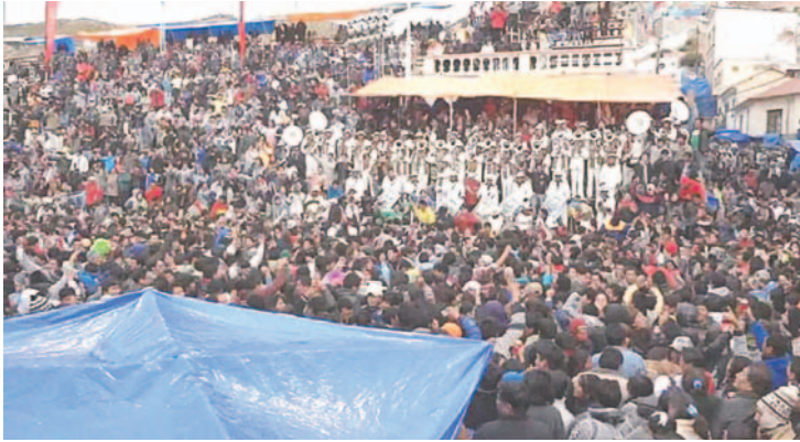
Rechazan propuesta de trasladar el lugar del saludo al Alba

“Estamos plenamente de acuerdo en que se hagan leyes para proteger el Carnaval, pero no estaremos de acuerdo en cambiar los lugares, como algunos concejales pretenden que se cambie el lugar del Alba. El saludo que se le da en el Alba a la Virgen es en su casa, de ninguna manera, como danzarines, aceptaríamos y creo que la población misma no aceptaría estos cambios. No puede haber caprichos de algunos concejales de querer cambiar”, refirió.