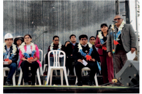
Acto de inicio de obras en la Facultad Técnica

“La UPRE está ejecutando 900 proyectos en todo el país y de ellos, el 62,8% es para educación, quiere decir un total de 565 proyectos en educación de los cuales, este que se ha iniciado este lunes, es uno de ellos”, destacó.