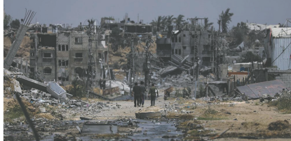
Palestinos pasan junto a casas destruidas en el norte del campo de refugiados de Al Nusairat, en el sur de la Franja de Gaza

LA PATRIA / EFE Estados Unidos concluyó que cinco batallones del Ejército de Israel cometieron violaciones a los derechos humanos en operativos ocurridos antes del 7 de octubre en la Cisjordania ocupada, según informó el