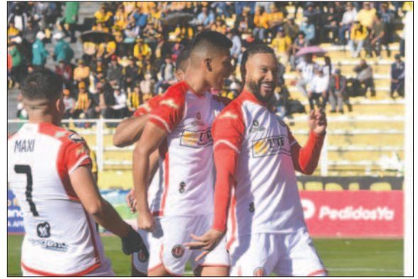
Jugadores del cuadro de FC Universitario celebran la clasificación a la final

Godoy mencionó que llegar a la final será una luz para que la gen-