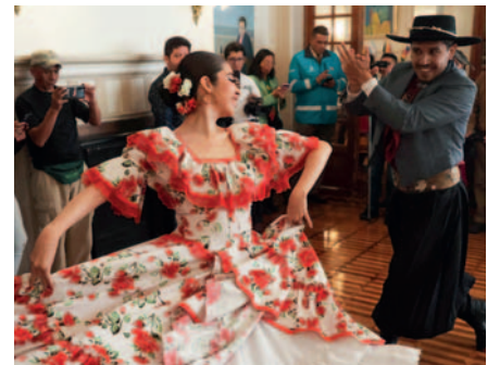
Una pareja de bailarines argentinos durante una muestra cultural en instalaciones de la embajada de Argentina en Bolivia