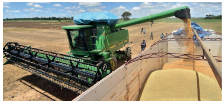
Sector agrícola demanda medidas para impulsar crecimiento económico y divisas

El sector agropecuario destaca la importancia de garantizar la seguridad