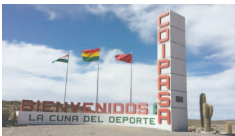
El legislador apunta que se deben encarar otras acciones en Coipasa

"Muchos países como Australia y Chile están tomando la delantera. El problema creo que es en la gestión que se ha equivocado; en la designación política de técnicos y ello habría ocasionado algunos errores que nos han llevado a esta realidad. YLB, sobre todo el Ministerio de Hidrocarburos tienen ahora la responsabilidad", enfatizó.