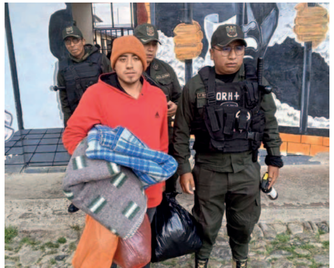
El principal implicado es reubicado en el penal de Chonchocoro

El joven de 25 años de edad fue la última persona en tener contacto