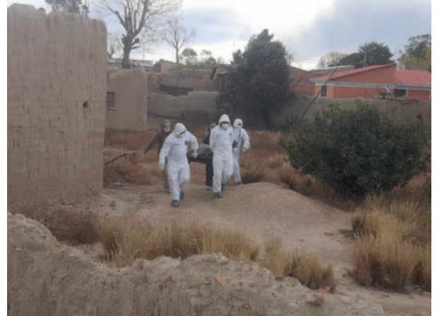
El cuerpo estaba en descomposición y era devorado por canes hambrientos

diante una autopsia que permitirá esclarecer las circunstancias en las que ocurrió el fallecimiento de la víctima, argumentó la autoridad.