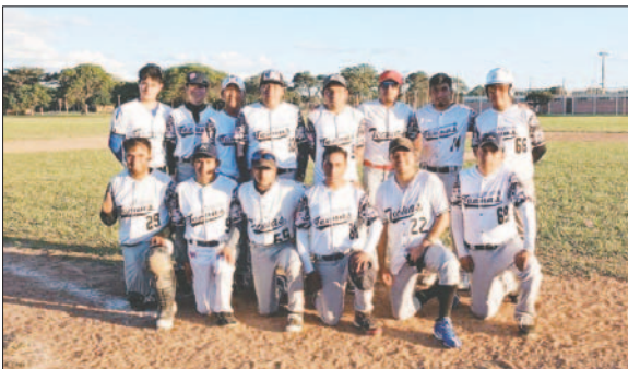
Tecuas dio dura batalla en el torneo nacional de béisbol

Para Oruro, queda esperar los próximos eventos nacionales para conseguir mejores resultados.