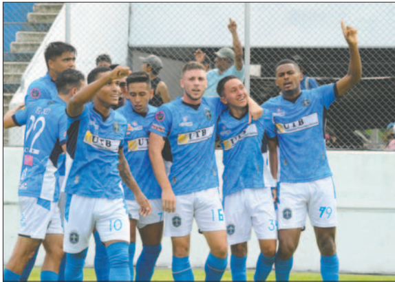
Los integrantes de San Antonio apuntan al título del torneo Apertura