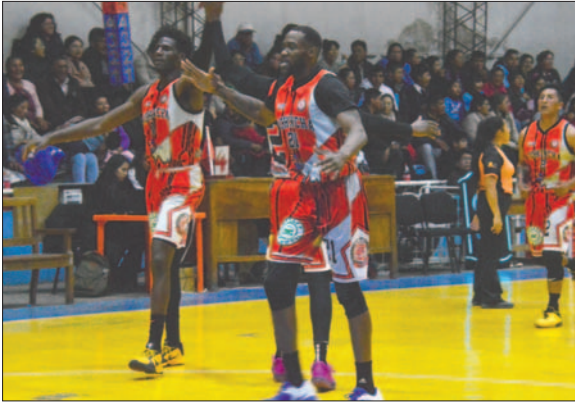
Pichincha viene con todo, quiere su segundo triunfo en Oruro /DANIELA MIRANDA