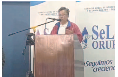
Rendición pública de cuentas inicial de SeLA / CAPTURA DE VIDEO