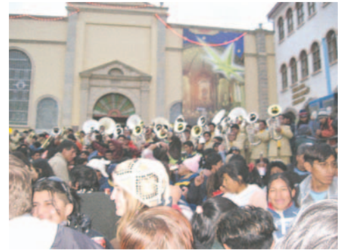
La costumbre del saludo al Alba se perdió con los años

En ese sentido, la concejal justificó que en la exposición de motivos de la iniciativa legislativa se tiene la interpretación intelectual del historiador