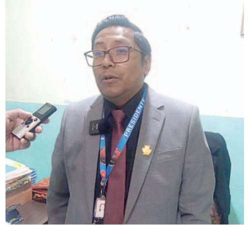
El presidente de la Asamblea Departamental dejará su cargo hasta el viernes

Finalizó mencionando que en esta gestión que le ha correspondido empen-