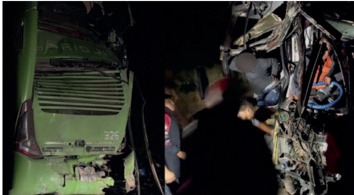
A falta de equipos de rescate integrantes del grupo auxiliaron a los heridos

A pesar de la gravedad del accidente, todos los miembros del grupo musical resultaron ilesos y expresaron su agrade-