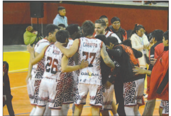
Saracho quiere hacer respetar su casa en el partido de esta noche