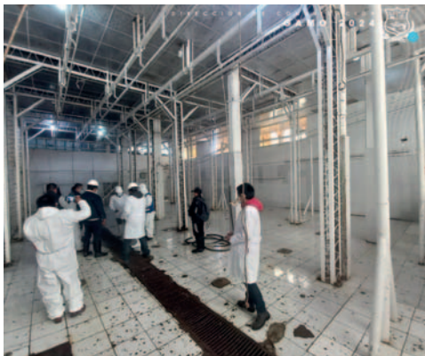
Inspección al matadero de la Unión Gremial de Matarifes y Ramas Anexas /GAMO

La inspección comenzó en el área de desinfección, conti-