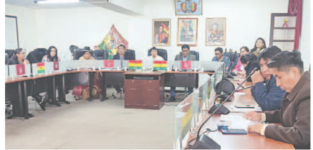
Varios puestos estuvieron vacíos en la sesión efectuada este lunes

aprobado ningún proyecto y así, tampoco se puede hacer política. Pero si hace acuerdos por debajo de la mesa para tener un vicepresidente en la Cámara de Diputados o algún interés de por medio, pero cuando se trata de proyectos que van a beneficiar a la población, no apoyan y eso no es correcto. Así me cuestionen, este diputado siempre va a apoyar proyectos que beneficien a las mayorías nacionales", enfatizó.