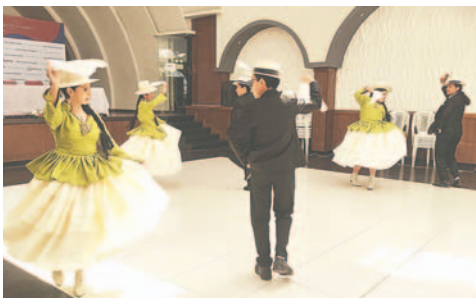
En Oruro existen varias instituciones o grupos dedicados a enaltecer este tipo de arte

Finalmente, también se mencionó que la labor que realizan los danzarines de las distintas instituciones de baile en nuestro departamento y país realiza un aporte para que la cultura de las danzas típicas no se desvanezca con el tiempo, sino que persista como es tradicionalmente hasta alcanzar nuevas generaciones.