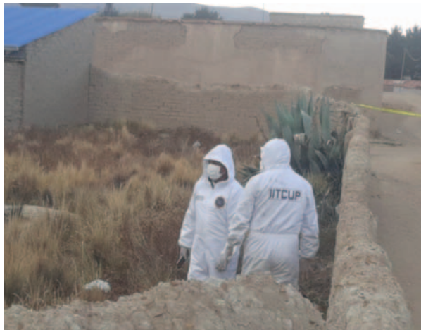
El cuerpo fue hallado en el patio de la vivienda

la casa y consumían objetos que encontraban en ese lugar. Al inspeccionar, descubrió parte de una cabeza y cabello enterrado, lo que lo llevó a informar a