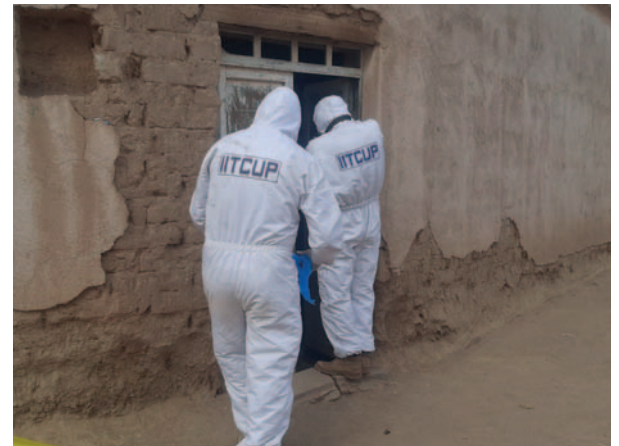
Los agentes del Iitcup ingresaron al lugar para rescatar el cuerpo sin vida