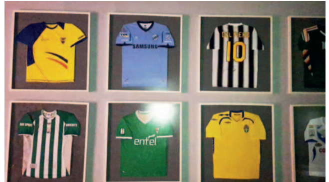
Poleras de fútbol que forman parte de la colección del Museo

El diputado recaló que, en caso de reabrir aquel espacio, se deberán desechar todos los objetos personales del exmandatario, como su ropa, sus trofeos y aquel cuadro del Che Gue-