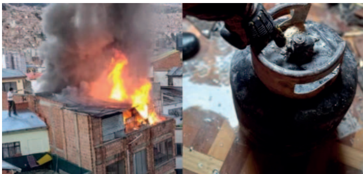
Tres incendios reportados en La Paz

El primer incidente ocurrió en un restaurante temático en la zona Sur de La Paz, la tarde del domingo. Cuatro personas resultaron heridas con quemaduras, todas ellas empleadas del restaurante. Según informes de Bomberos, el incendio se desencadenó debido a una fuga de gas en un horno industrial, que saturó el ambiente y provocó la ignición. Las llamas consumieron la estructura de la cocina y varios enseres, exten-