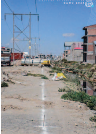
Torre de alta tensión afecta continuidad de la construcción del embovedado

“Entendemos el retraso de la empresa porque no se está liberando el lugar. Por eso, el GAMO, de manera conjunta con la fiscalización, estamos trabajando en este aspecto. En estas épocas en las que no está