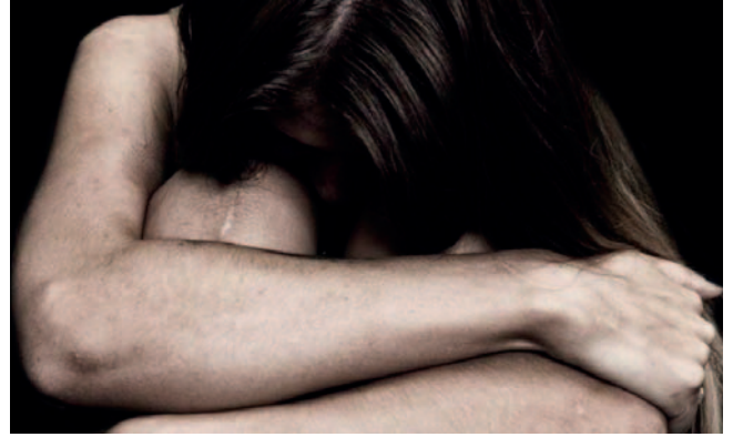
El hecho consternó a los lugareños, quienes preocupados le compraron ropa para cubrirla /REFERENCIAL

La testigo también informó que la mujer estaba en compañía de dos mujeres más, quienes hu-