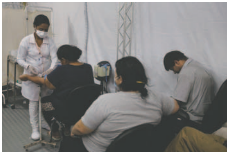
Brasil bate su récord histórico de casos de dengue con más de 1,88 millones de contagios

Según el nuevo boletín epidemiológico del Ministerio, en las diecisiete primeras semanas de 2024, es decir, hasta este domingo, Brasil registró 4,1 millones de casos probables de dengue. Esta cifra duplica los datos de 2015 (1,6 millones), que hasta ahora era el año