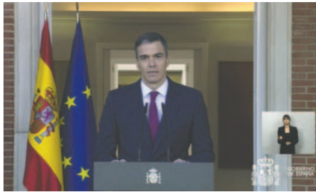
El presidente del Gobierno español, Pedro Sánchez

El anuncio del jefe del Ejecutivo se produce cinco días después de haber comunicado a través de una carta que iniciará un periodo de reflexión para decidir sobre su continuidad al frente del Gobierno, esto después de que su esposa fuera denunciada por supuestos hechos de corrupción.