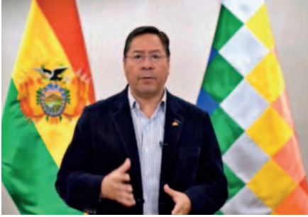
Presidente de Bolivia, Luis Arce