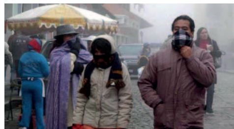
Bajas temperaturas se agravan en La Paz, Oruro y Potosí /URGENTE.BO

En detalle, según el Senamhi, en La Paz, las temperaturas llegarán entre 6 y 8 grados mínimos y entre 20 y