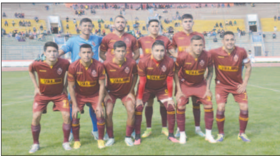
CDT Real Oruro será un rival exigente para el equipo de GV San José