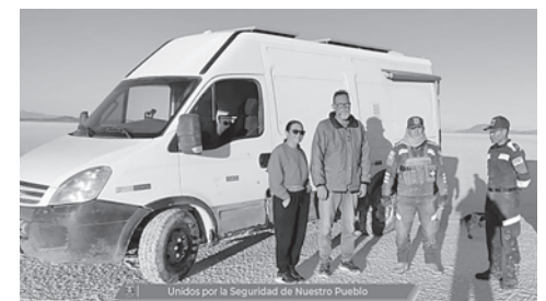
Uniformados rescatan a turistas en el Salar de Uyuni

Los servidores policiales acudieron al llamado de emergencia, logrando