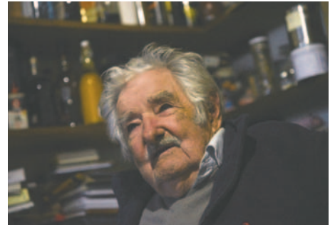
El expresidente de Uruguay José Mujica habla durante una entrevista, en Montevideo. El expresidente anunció este lunes que tiene un tumor en el esófago

José Mujica es conocido por su estilo de vida sencillo y su filosofía humanista, lo que le ha valido reconocimiento a nivel internacional. Su lucha política y social ha dejado una huella significativa en Uruguay y más allá, convirtiéndolo en una figura emblemática en América Latina.