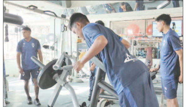
El trabajo en gimnasio en estos días es exigente para los integrantes de GV San José

El CDT Real Oruro está participando en la Copa "Simón Bolívar" y comenzó bastante bien, con una victoria holgada ante Ingenieros (6-1). Esto hace suponer que será un importante sparring para el conjunto de GV San José, recordando los duelos que se han dado entre estas dos instituciones deportivas durante los últimos dos años, tanto en el torneo local como en la Copa "Simón Bolívar". Ambos equipos estaban enfocados en llegar a la División Profesional. Hasta el momento, GV San José ha cumplido el objetivo, mientras que