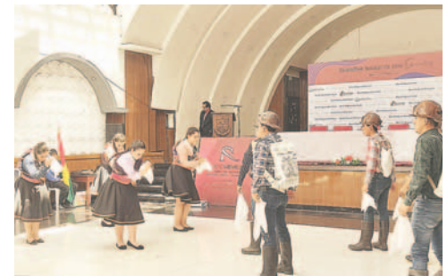
Celebraron este día danzando

En este día, el estudio de danza Rojo Carmesí y el ballet Folklórico de Oruro Mi Patria organizaron un encuentro de baile en homenaje al Día Internacional de la Danza, con diversas presentaciones y demostraciones de la riqueza cultural de Bolivia. Ambos grupos