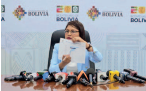
El viernes 26 de abril, Moody's rebajó la calificación de Bolivia de "Caa1" a "Caa3"