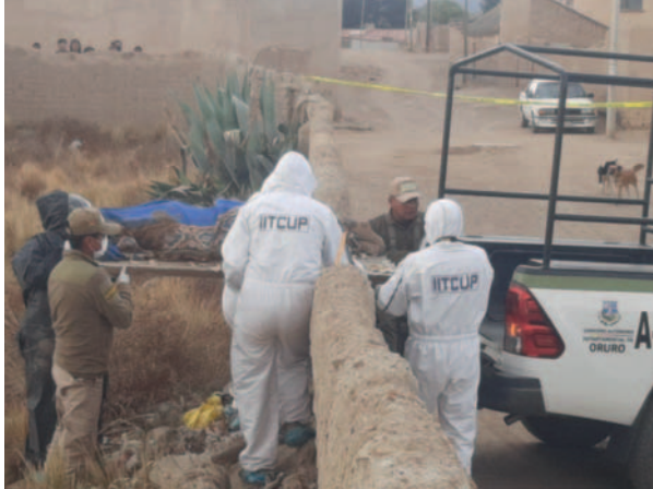
El cadáver fue trasladado hasta la morgue del Cementerio General de Oruro

El descubrimiento del cadáver fue reportado por un vecino encargado de cuidar una vivienda deshabitada, quien notó que sus perros se dirigían constantemente hacia un cuarto sin techo dentro de