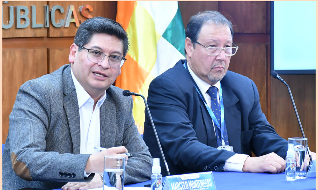
El Ministro de Economía, Marcelo Montenegro, en conferencia de prensa con el Presidente de Cifabol, Javier Lupo.

Hay que optimizar la entrega de estos recursos a los sectores productivos, esa es la razón por la que hemos solicitado a los bancos la entrega de esa trazabilidad”