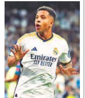
Rodrigo, delantero de Real Madrid.