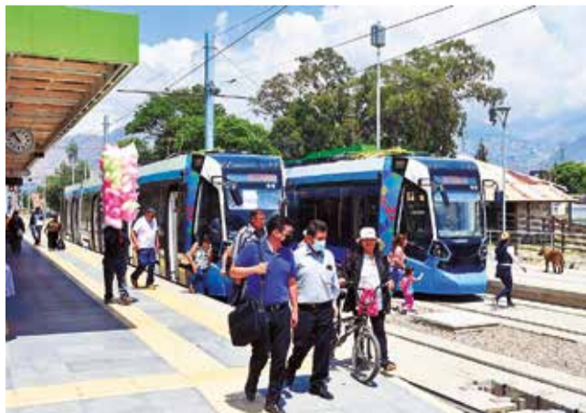
La línea verde ofrece ruta panorámica del valle bajo.