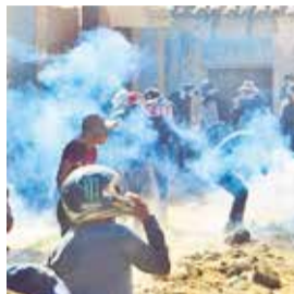
La pelea por límites en Chulla Jayata. D. JAMES