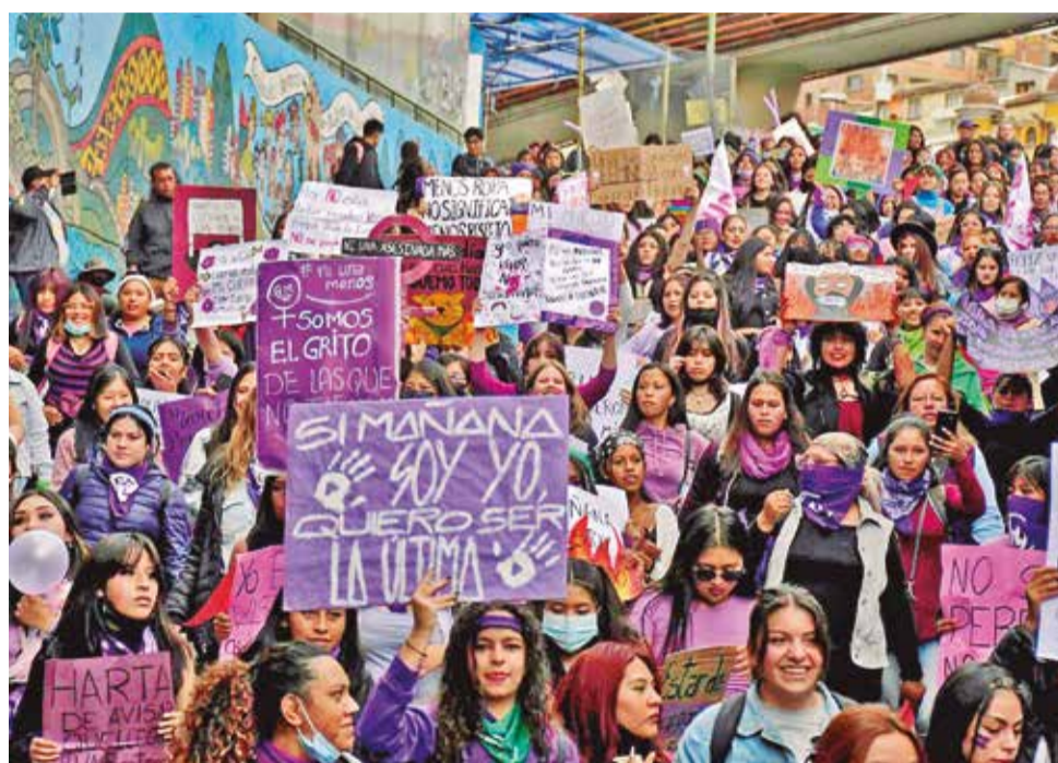
Ante la cantidad de feminicidios, en pasados meses se realizaron una serie de movilizaciones de protesta, bajo la consigna de “ni una menos”.