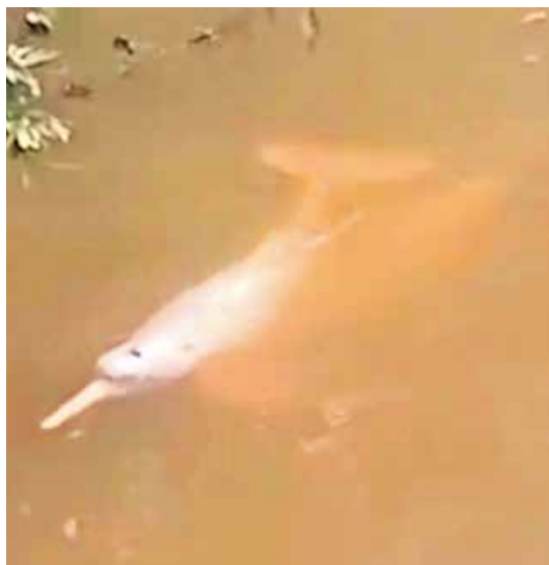
La imagen de los bufeos en un río del trópico.

dores se trasladaron hasta el afluyente para presenciar a los delfines. Sin embargo, la directora ejecutiva de Faunagua mencionó que el intenso movimiento en el sector po-