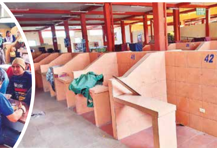
Sitios vacíos en el mercado modelo del Norte, en Ticti.