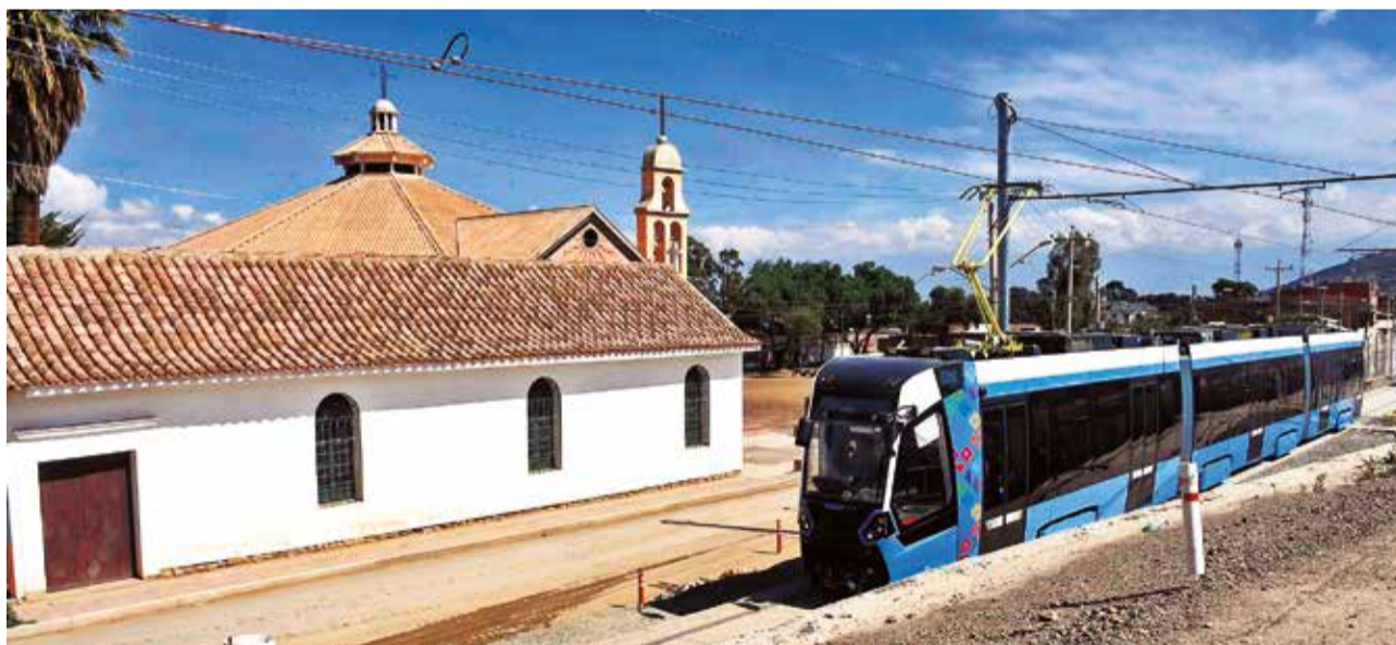
Las pruebas de calibración en la ampliación de la línea roja del tren eléctrico al sur de la ciudad.