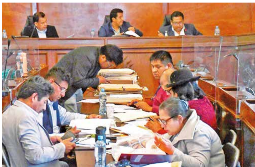
Legisladores seleccionan a candidatos para las Elecciones Judiciales. APG

“Hemos sido claros en la Comisión Mixta, hemos indicado que vamos a continuar el trabajo en día martes, ya que si no lo hacemos vamos a tener problemas con los pla-