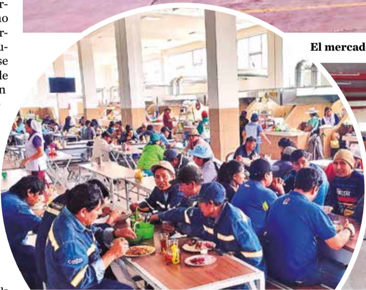
El mercado Coraca por la "autoventa".