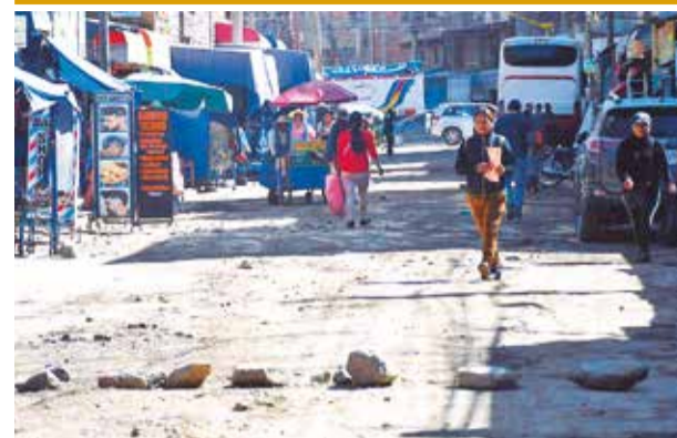
La avenida Santa Cruz en Quillacollo ayer. DANIEL JAMES

dría generar un estrés fuerte en los bufeos, razón por la que una comisión trabajará en una estrategia para que puedan retornar a su hábitat pronto.