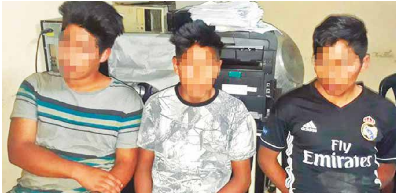
Los pandilleros de Vinto son llevados a su audiencia, en Quillacollo, 2019.

Basto subraya que los padres son capacitados para identificar a estos grupos delincuen-