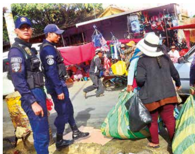
Los operativos de la Intendencia, en días de feria.