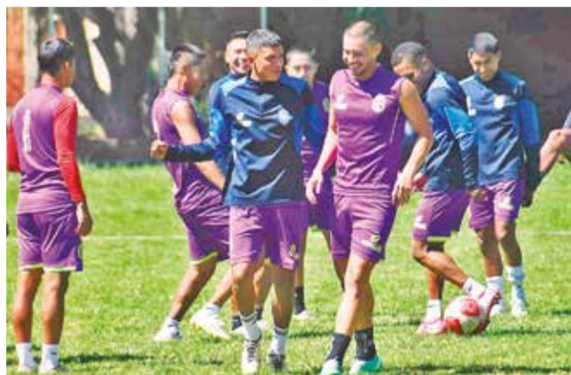
Un ensayo del club San Antonio de Bulobulo. CARLOS LÓPEZ

De acuerdo al trabajo táctico que desarrolló ayer el cuadro santo en el CAR de Villa Tunari, la inclusión de Velasco sería la única variante obligada que en el once titular para hacer frente al equipo chuquisaqueño, que