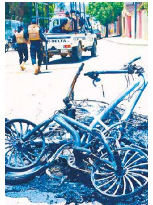
Pelea de pandillas en la zona sur de Cochabamba, en marzo pasado. DANIEL JAMES