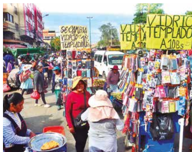
Los ambulantes que toman las calles de la ciudad.