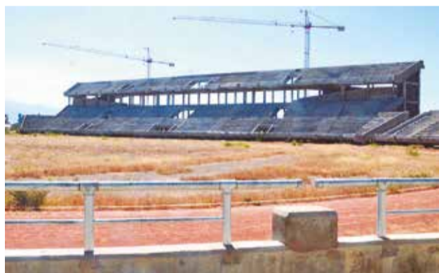
El estadio regional inconcluso del valle alto.