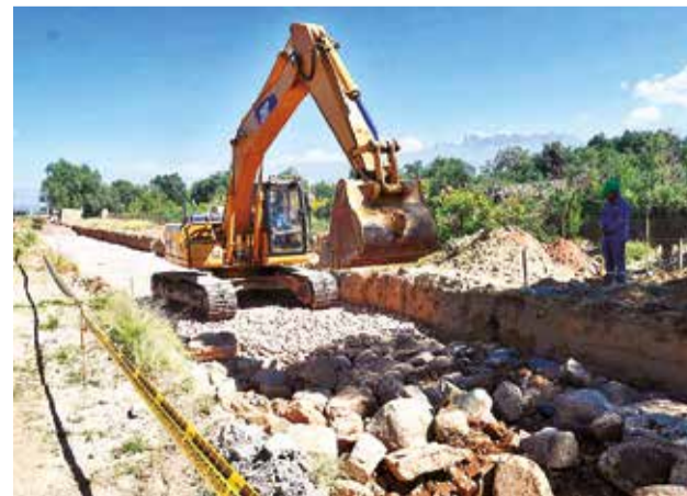
Los trabajos de la línea amarilla en el aeropuerto.