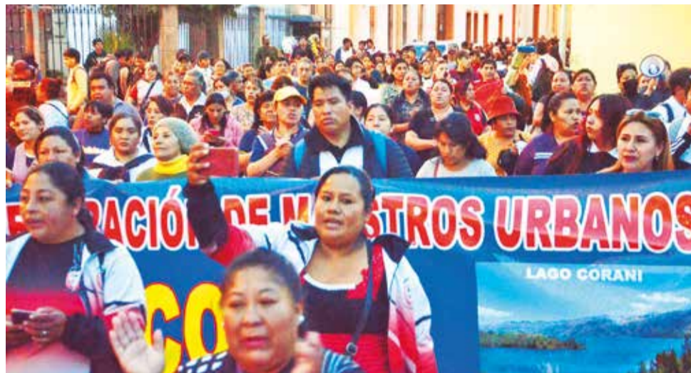
Maestros urbanos marchan en Cochabamba. HERNAN ANDIA

Los médicos señalaron que correspondía un paro de 96 horas porque ya cumplieron paros de 24, 48 y 72 horas. Aclararon que se encuentran abiertos a la Comisión de Diputados para avanzar con el tema en conflicto; y levantarían la medida de presión en cualquier momento.