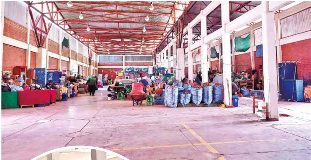
El mercado Belén Tokio, con sitios abandonados.