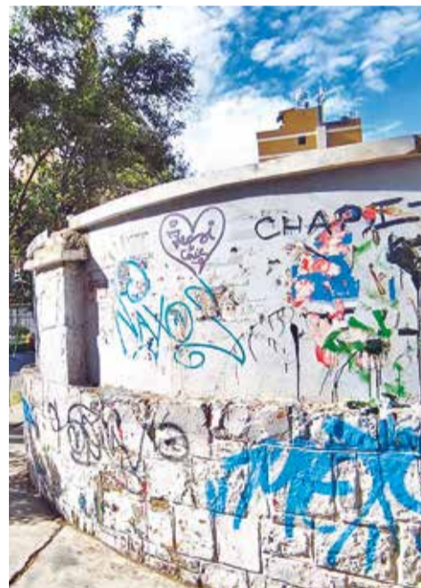
Algunos grafitis de los pandilleros en Cochabamba. DANIEL JAMES

La víctima era pareja del líder de esta pandilla. Ella, al tener más protección de otro pandillero, decidió irse al otro grupo, lo que provocó que su expareja realizara un ritual con ella para demostrar su poder.