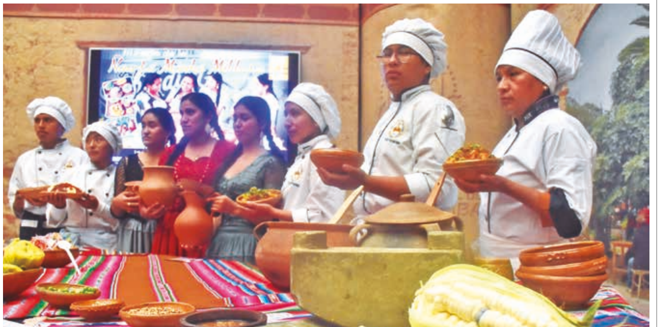
LA COMIDA DE LOS ABUELOS. Residentes de Sacaba invitaron ayer a la población cochabambina a la Feria de la Ñawpa Manka Mikhuna (o “comida de los abuelos”), consistente en recrear los manjares de anteriores generaciones. La cita es este domingo en el distrito 4 de este municipio.

ENVÍE SU FOTO PARA PUBLICARLA EN ESTA SECCIÓN A: fotografia@lostiempos-bolivia.com