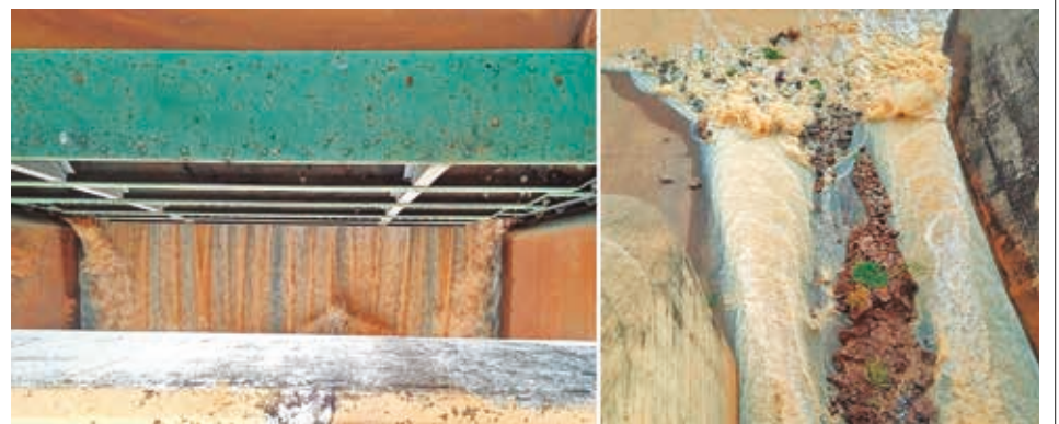
Apertura de las compuertas de La Angostura para riego del maíz. RRSS

Rojas lamentó que diariamente conductores estacionen sus motorizados haciendo caso omiso de las normas municipales.