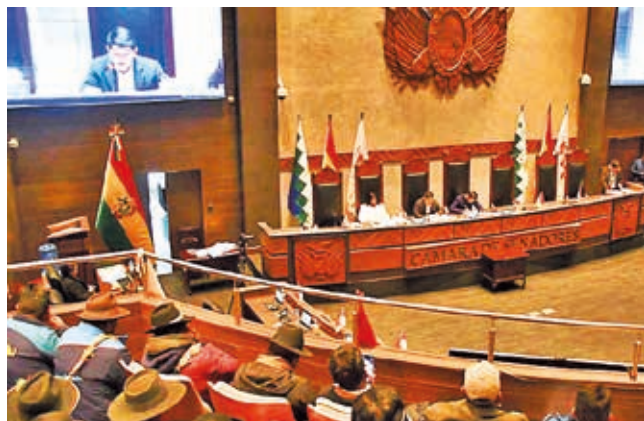
Sesión de plenaria de la Cámara de Senadores.

Pulseta. La aprobación se dio luego de que Evo Morales pidiera a su bancada en el Legislativo dar luz verde a los préstamos