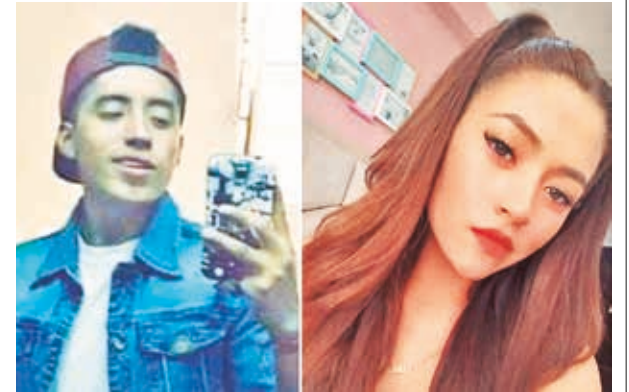
El exnovio y la joven desaparecida.