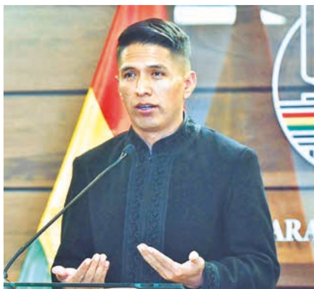
Senador Andrónico Rodríguez.