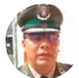
Carlos Ponce, director nacional de Tránsito