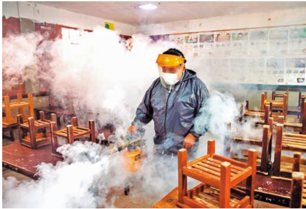
La fumigación en una escuela de Valle Hermoso contra el mosquito del dengue. GAMC

Aseveró que las acciones de promoción y prevención planteadas en la Sala Situacional