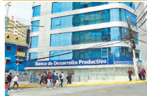
Oficinas del BDP en el centro de La Paz. BDP