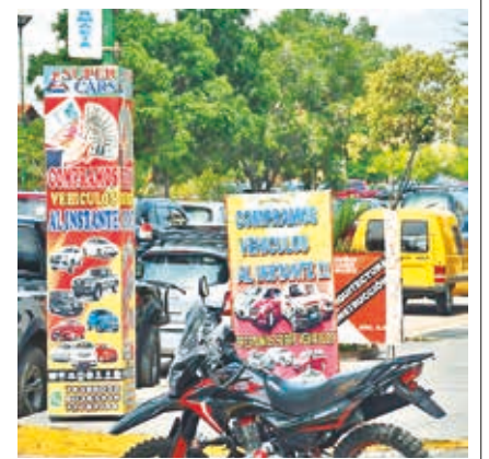
Una variedad de anuncios de la venta de automóviles.