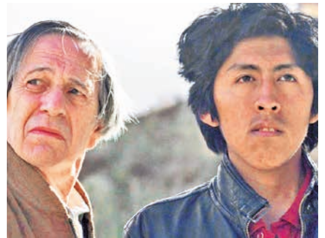
Exhibición. Imagen de la película “El ladrón de perros”.

Y, volviendo al tesoro musical de Sacaca, localidad situada en Potosí, este incluye obras de Pedro Ximénez con maestros locales anónimos que en el siglo XIX buscaban, a través de sus composiciones, encontrar una identidad, la bolivianidad.