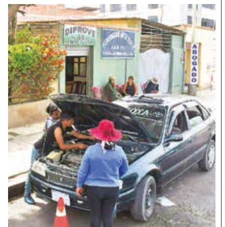
La revisión que realiza Diprove en la autoventa.