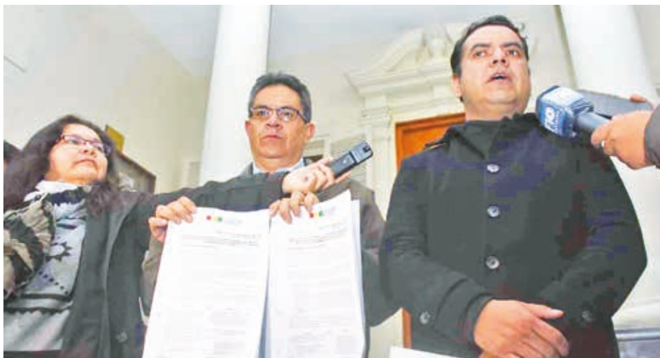
El presidente del TSE, Francisco Vargas, en conferencia de prensa, anoche.

En la oportunidad, proclamaron a Evo Morales como candidato presidencial del partido y como presidente de la dirección nacional del MAS. Pero el TSE rechazó las determinaciones asumidas en el cónclave por algunas irregularidades.