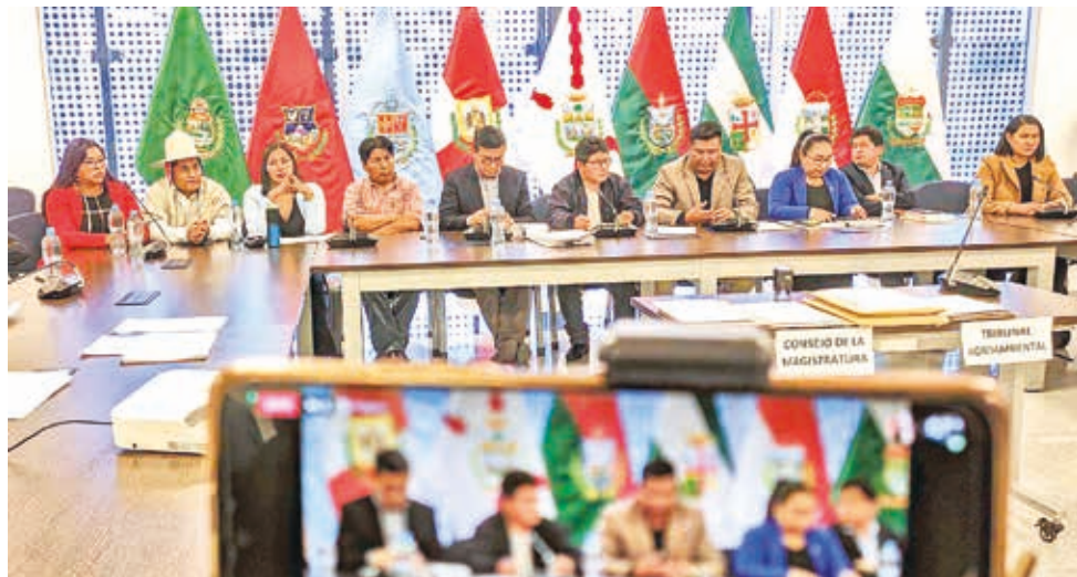
La Comisión Mixta de Justicia Plural en proceso de evaluación de judiciales. APG

“La suscrita Juez Público Civil (...) en mérito a las consideraciones expuestas (...) concede la tutela solicitada (...) dispone: Dejar sin efecto la Resolución N° 41/2023-2024 (...) instruyéndose su habilitación ante la Comisión Mixta de Justicia Plural”, refiere parte de la resolución.