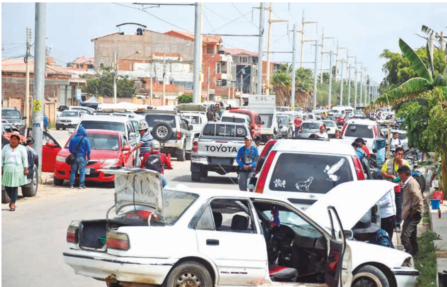
La feria de vehículos en la avenida Beijing, donde hay 5 mil comercializadores.