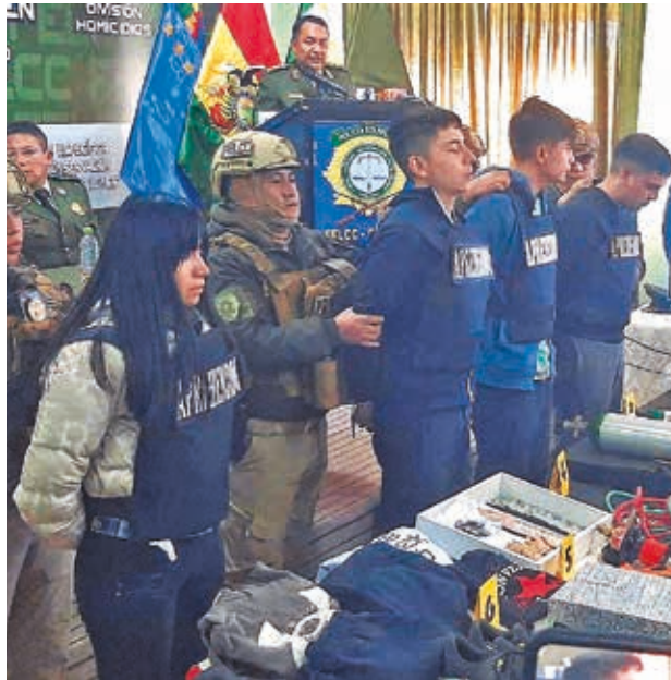
Los acusados presentados en el Comando de La Paz.