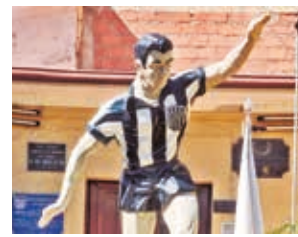
Estatua de la AFC, en la sede de la calle Ecuador.