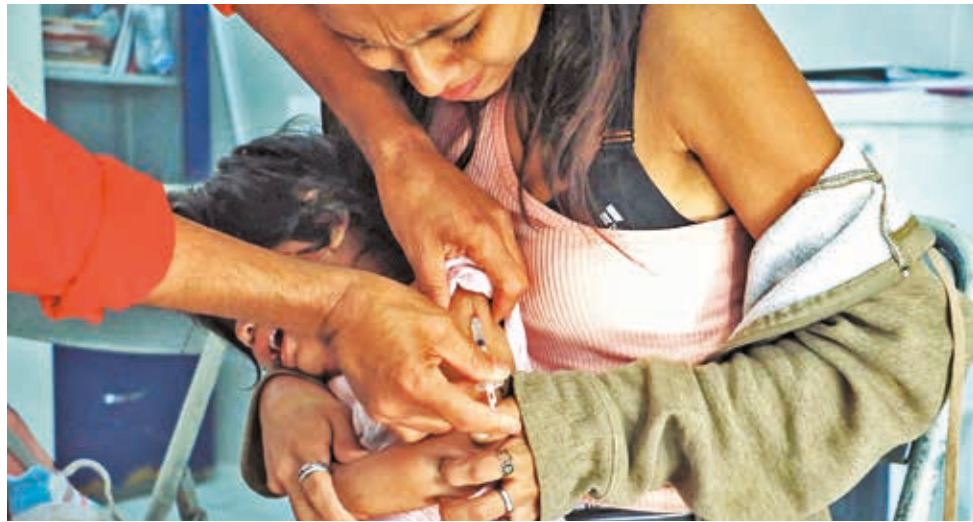
Vacunan a un menor contra la influenza.