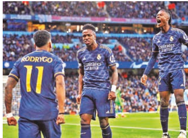
Jugadores de Real Madrid festejan la clasificación, ayer.

Bayern respiró al saberse en semifinales al final de una eliminatoria a la que no había llegado como favorito.