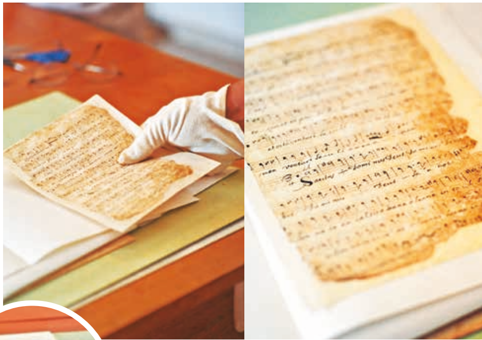
Investigación. Algunos manuscritos de las partituras de la época colonial. APAC

La confluencia de investigadores y académicos se inspirará en la figura del compositor peruano-boliviano Pedro Ximénez Abrill Tirado (1784-1856) y su trascendental redescubrimiento en la última década. En ese contexto, se centrará en las prácticas teatrales, materialidades, repertorios de música religiosa, cancioneros y modos de ser músicos que de las colonias tuvieron persistencia en las