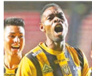
Festejo de los jugadores de The Strongest, ayer.

Pese al balde de agua fría, el cuadro orureño no bajó los brazos y se acercó