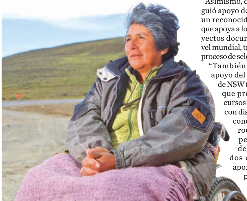
Producción nacional. Escenas del documental “La lucha” de Violeta Ayala.

“La génesis del documental ‘La Lucha’ proviene de un evento histórico significati-