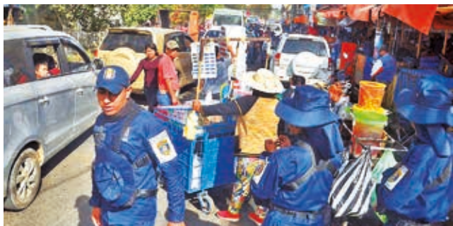
El operativo de la Intendencia en la Barrientos. DANIEL JAMES

Dato. Después de retirarse a los vendedores, el transporte público ocupa los espacios recuperados para mejorar la fluidez