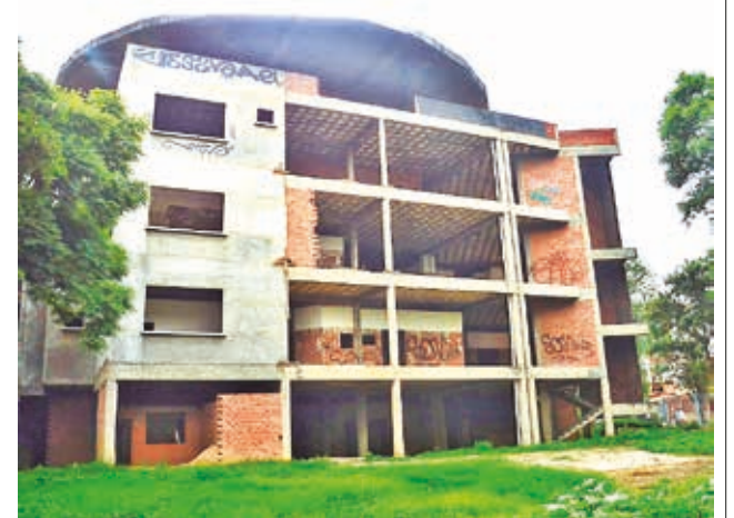
El edificio a medias del hospital del niño. CARLOS LÓPEZ

ideal hubiese sido que la Alcaldía facilite el proyecto a diseño final y los planos estructurales, pero ante la falta de los documentos se hizo la reconstrucción de los “planos as built” para evaluar la capacidad de soporte de la estructura. Añadió que el informe se remitirá a la Asamblea Legislativa Departamental (ALD).