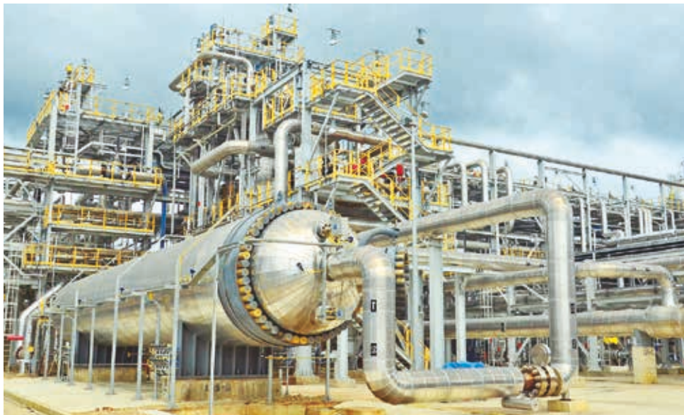
Planta de urea y amoníaco en Bulu Bulu, Cochabamba. JOSÉ ROCHA

En su comunicado YPF señaló que en 2022 se lograron ingresos por 240 millones de dólares; pero no se mencio-