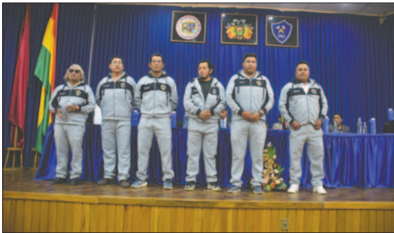
El cuerpo técnico confía en el trabajo realizado hasta el momento

grupo. La plantilla de Ingenieros var" y el campeonato local está compuesta por 35 jugadores.