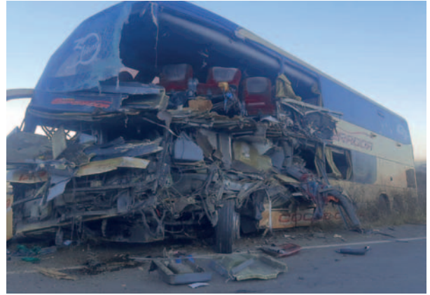
El bus quedó muy dañado tras el impacto

Se espera que las autoridades implementen medidas preventivas para evitar futuros accidentes en esta transitada vía.