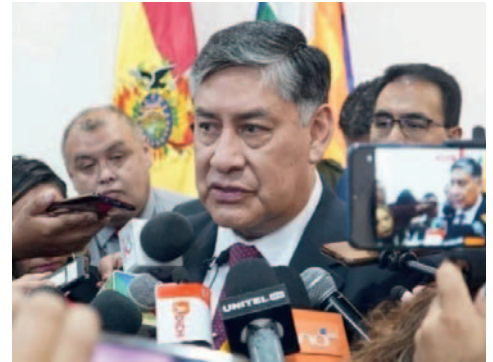
El fiscal general del Estado, Juan Lanchipa, expresó su preocupación a los medios porque estos hechos de violencia extrema

Entre los casos que más consternaron al país se encuentra el de Aurelia, una mujer de 34 años que perdió la vida a manos de su pareja, luego de que este llegara a su casa "borracho" y le apuñalara 20 veces. Su hijo menor de seis años intentó defenderla, pero su padre lo hirió en la cabeza.