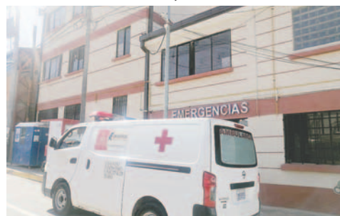
Personal de salud a contrato reforzará atención en centros /LA PATRIA

modalidad Apoyo Nacional a la Producción y Empleo (ANPE), 19 procesos han sido finalizados y concluidos, y solo un proceso ha sido observado.