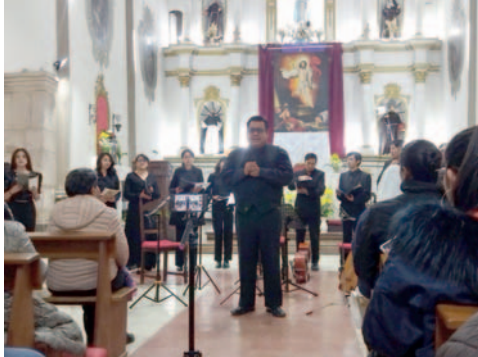
Gran expectativa por el concierto en el templo de San Francisco / LA PATRIA

El concierto inició con Música Antigua de Europa y como segunda obra musical prosiguió con Música Antigua de Oruro, La Plata y Misiones Jesuitas de Chi-