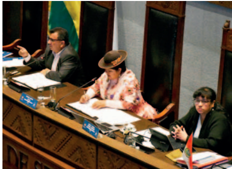
Los senadores rechazaron el préstamo

La senadora forma parte de la Comisión de Planificación, Política Económica y Finanzas y estuvo presente en la sesión de comisión cuando los parlamentarios aprobaron la norma para que sea derivada al pleno de la Cámara Alta. Además, explicó que