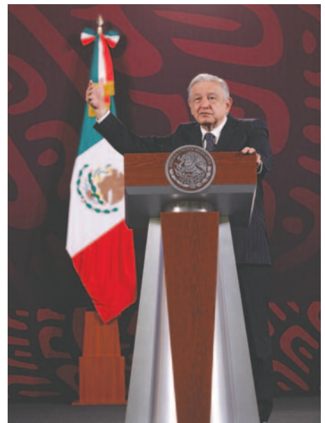
El Presidente de México, Andrés Manuel López Obrador, participa durante una rueda de prensa este jueves en el Palacio Nacional, en la Ciudad de México (México)

"No coincidido con ella, con todo respeto. Las autoridades electorales están haciendo su trabajo. Siempre que hay una elección se utiliza el tema de la violencia o el miedo", añadió.