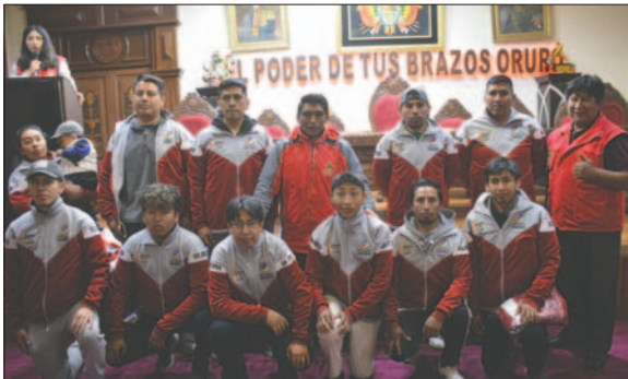
La Gobernación de Oruro entregó indumentaria a la representación orureña