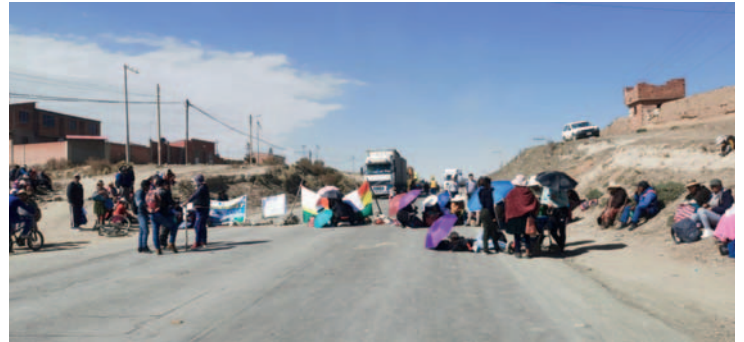
Por dos jornadas estuvo bloqueada la carretera Oruro-Potosí por demandas ambientales