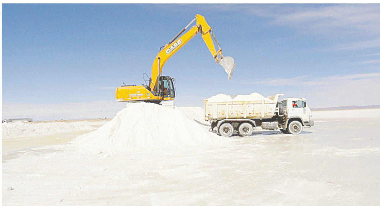
Piden que el proyecto en el Salar de Coipasa avance

“El año pasado, en enero, se presentó un proyecto totalmente unificado entre ambos departamentos. Esto ha llegado al Parlamento, se ha revisado y retornó con varias observaciones para corregir, lo cual fue aceptado en Oruro, pero no en Potosí”,