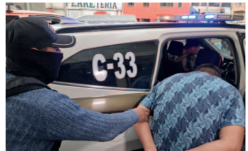
Ambos sujetos fueron trasladados desde la Felcv hasta la carcelita de la Fiscalía Especializada en Delitos Sexuales

Los agentes de la Felcv tomaron contacto con los familiares quienes inmediatamente viajaron hasta esta ciudad para auxiliar a la menor. Una vez confirmada la denuncia se iniciaron los primeros actuados investigativos. Con los datos