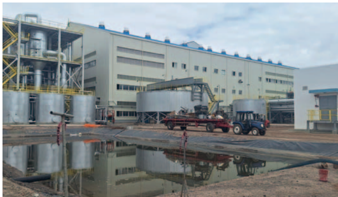
Instalación de la Planta Industrial de Carbonato de Litio en Uyuni