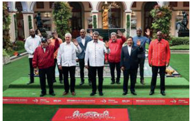
Los mandatarios asistentes a la Cumbre ALBA posan para una foto grupal en el Palacio de Miraflores en Caracas (Venezuela)

Arce, quien propuso además el ofrecimiento de becas de estudio a estudiantes palestinos, condenó el “inaceptable genocidio” en la Franja de Gaza.