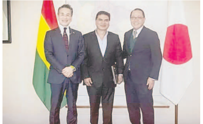
Autoridades departamentales se reunieron con Embajada de Japón

Tras esta propuesta, desde la embajada se informó que cuentan con un financiamiento para el Estado boliviano, consistente en apoyar a través de créditos con un monto de 100 millones de dólares.