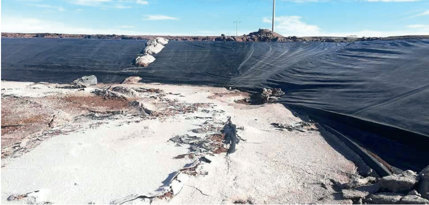
18 piscinas de evaporación en la Planta Industrial de Carbonato de Litio están inoperables