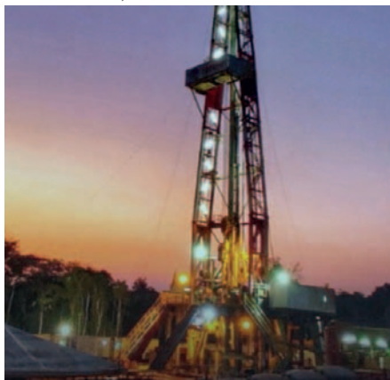
Se busca incrementar las reservas de hidrocarburos con los trabajos de exploración /YPFB

Durante 2023, YPFB invirtió $us 539,74 millones en diversas actividades de la cadena de hidrocarburos, como exploración, explotación, distribución, transporte, plantas e industrialización, refinación, almacenamiento y comercialización.