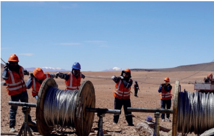
ENDE ampliará las líneas eléctricas en el área rural del país