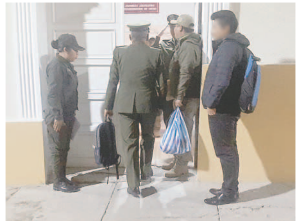
Intervención de la Policía en instalaciones de la ALDO /LA PATRIA

Asimismo, el asesor legal explicó que la Gobernación en su