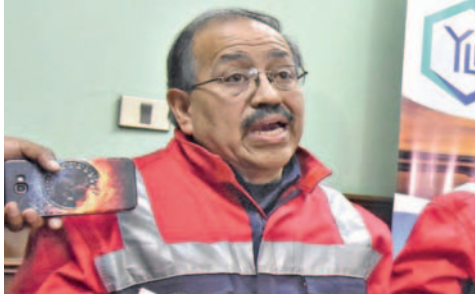
El exgerente ejecutivo de Yacimientos de Litio Boliviano (YLB), Carlos Montenegro falleció el miércoles 24 de abril

“El Ministerio Público, a requerimiento fiscal, ha llevado a cabo la autopsia legal del cuerpo del señor Montenegro y el resultado del protocolo de autopsia indica que la causa de la muerte fue un infarto cardiaco. Además, dentro del protocolo de autopsia se han tomado muestras que han sido remitidas al laboratorio de toxicología. Estamos a la espera de