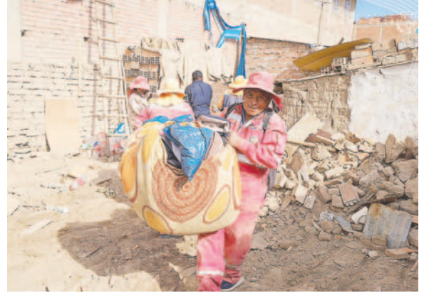
Mediante demolición, GAMO recuperó vía pública

En ese sentido, el GAMO llevó a cabo ayer la demolición de la construcción clandestina, en cumplimiento al Decreto Municipal 005/12 Procedimiento Sancionador de Construcciones Clandestinas y su Decreto Modificatorio 019/14.