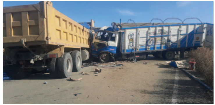
Los motorizados pesados colisionaron violentamente