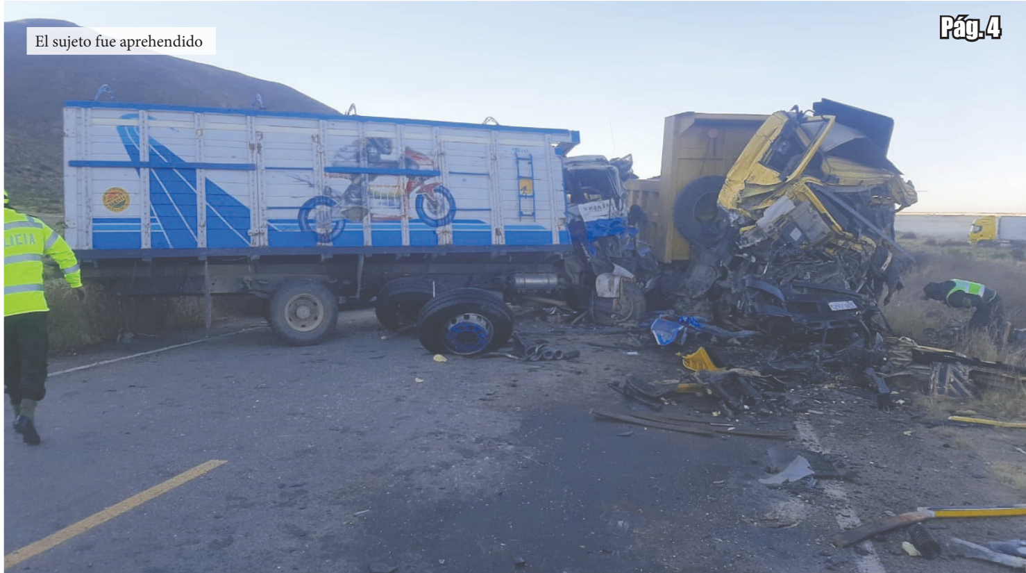
El sujeto fue aprehendido