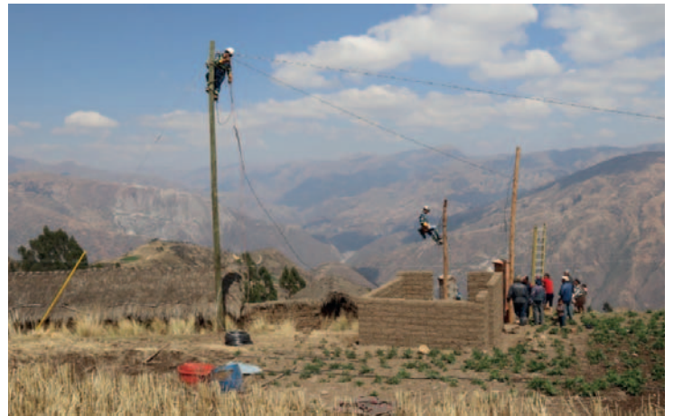
Este proyecto tiene una inversión bastante alta /ENDE

Con el inicio del PER III en esta gestión, el Gobierno busca cumplir uno de los objetivos del Plan de Desarrollo Económico y Social: aumentar la cobertura del servicio eléctrico tanto en áreas urbanas como rurales, mejorando así la calidad de vida de miles de familias en Bolivia.