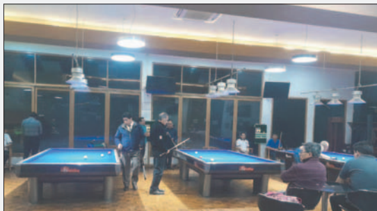
El Club Oruro será el epicentro del certamen nacional

El campeonato se extenderá hasta el domingo por la tarde, cuando se llevará a cabo la correspondiente premiación de este certamen deportivo.