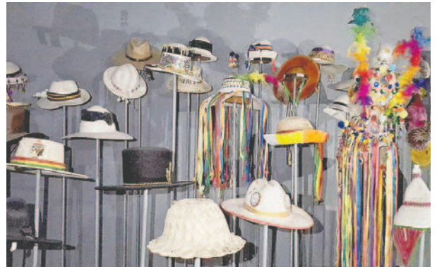
Hallaron objetos irrelevantes dentro el museo

nes y Pueblos Indígena Originario Campesinos y está trabajando para restituir su valor patrimonial e histórico, así como para dinamizar la economía local.