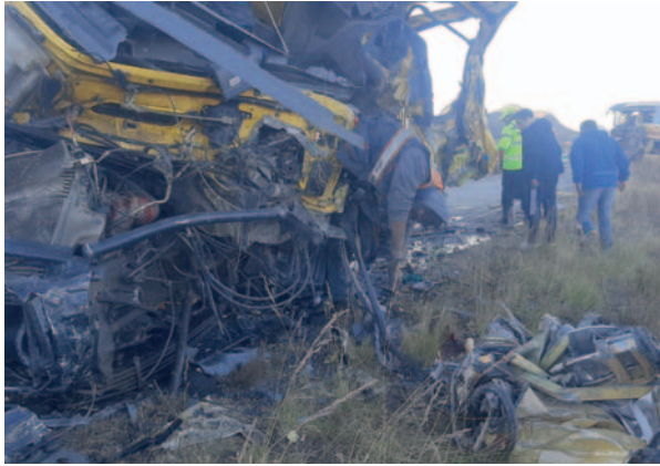
Uno de los conductores fallecidos