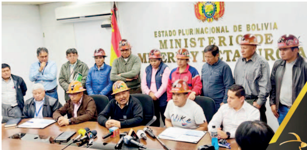
Momento de la firma del acuerdo con 20 puntos relacionados a la minería