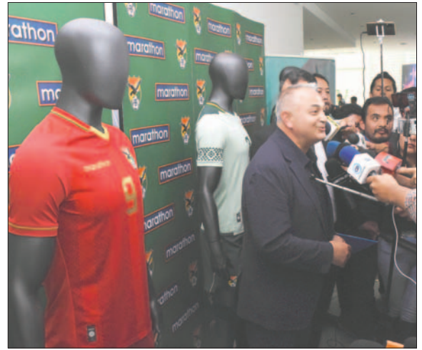
Durante la presentación de las casacas de Bolivia para la Copa América

En la ocasión también se mostró el uniforme prematch, que lucirá el elenco antes de los partidos, en la etapa precompetitiva. Se trata de tres diseños: un verde y negro con rayas diagonales, un azul