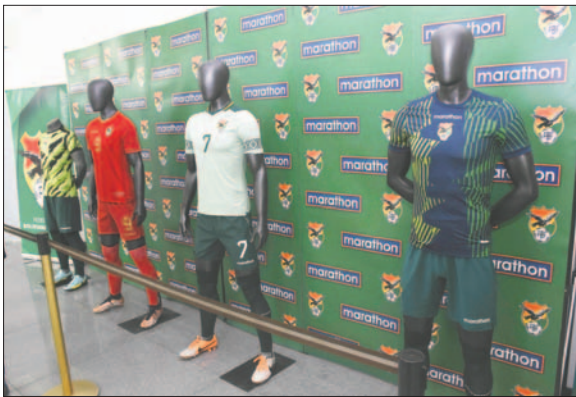
Las dos del centro para la Copa América, las de los costados para los amistosos

que se usa en las presentaciones de protocolo, que cuenta con detalles en verde y blanco.