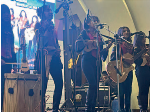
Interpretación musical en el salón Luis Ramiro Beltrán