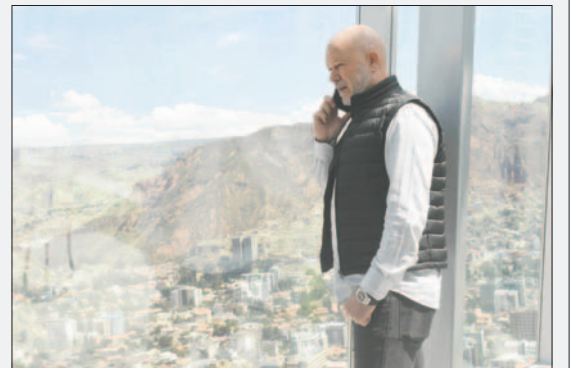
Antonio Carlos Zago, seleccionador de la Verde

La Verde, abrirá el grupo "C" enfrentando a Estados Unidos el 23 de junio (18:00, horario boliviano) en Arlington, el siguiente rival será Uruguay el 27 de junio (21:00) en Rutherford y en la tercera fecha estará jugando contra Panamá el 1 de julio (21:00) en Orlando. Los dos primeros avanzarán a los cuartos de final.