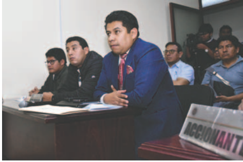
Audiencia de uno de los amparos interpuestos por postulantes inhabilitados

“Queremos informar que todos los amparos que nos han presentado hasta el día de hoy (jueves) han sido tutelados