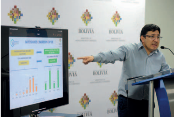
El ministro defendió el trabajo realizado en el tema del litio, en la actual gestión de gobierno