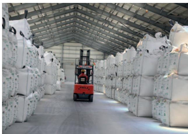
La presidente de YLB asegura que se tendrán buenos ingresos este año

El cloruro de potasio es un agrofertilizante que se aplica en los cultivos de papa, caña de azúcar, remolacha