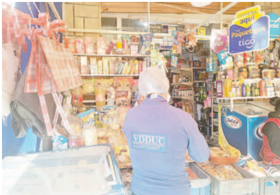
Controles en la venta de productos cerca de la terminal Hernando Siles /VDDUC

Asimismo, se constató la falta de limpieza en los mostradores donde se exhibían los