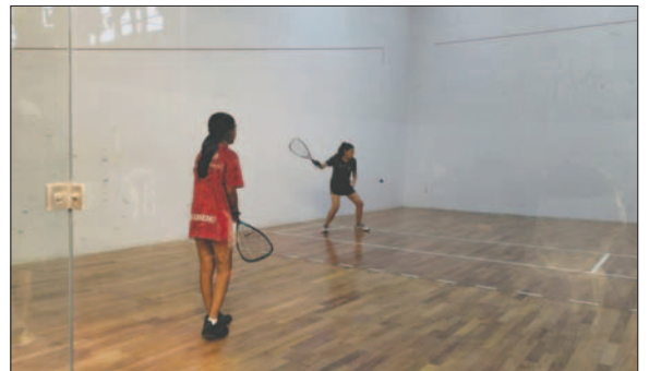
Los partidos se disputan en el sector de las 12 Canchas

Agregó que como Gobernación se está prestando la ayuda correspondiente con el escenario deporti-