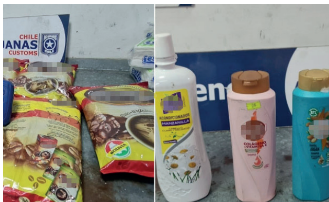
En las bolsas de café se encontraron un total de 6.819 gramos de pasta base de cocaína

sión preventiva durante los 120 días que durará la investigación, según lo determinado por el Juzgado de Garantía de Iquique.