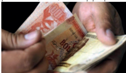
Con el incremento salarial, sube a Bs 500 el monto mínimo de la asistencia familiar

El Gobierno, junto a la Central Obrera Boliviana (COB), anunciaron el pasado martes los nuevos incrementos en los salarios tras varias negociaciones y reuniones. De esta negociación no participó el sector empresarial. Asimismo, aún no se decretó oficialmente esta subida.