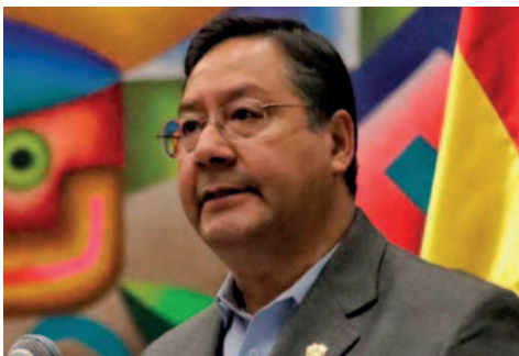
El Presidente Luis Arce pidió no politizar la muerte de exautoridad /OPINIÓN