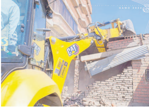
Construcción ilegal fue demolida