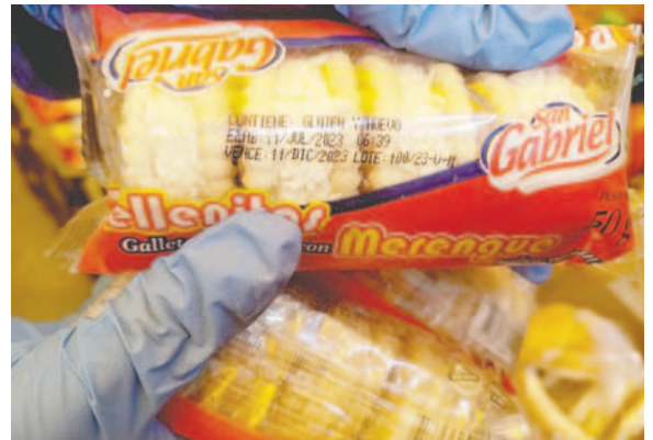
Productos vencidos eran comercializados /VDDUC

“Es importante destacar que está establecido en la Ley 453, en su artículo nueve, la protección a los consumidores, donde los proveedores están obligados a suministrar productos y servicios en condiciones de inocuidad, calidad y seguridad, siendo