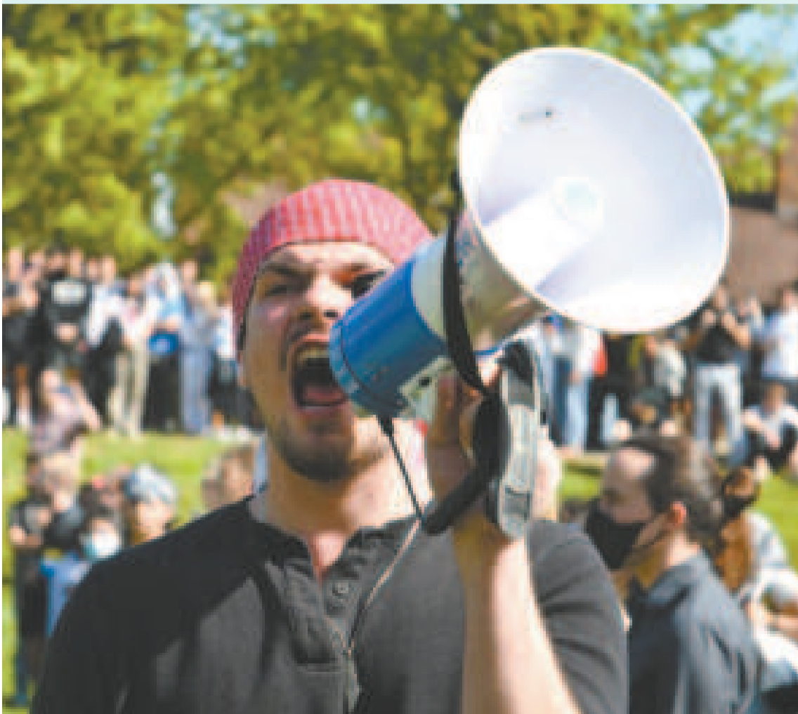
La protesta se propagó a varias universidades estadounidenses.