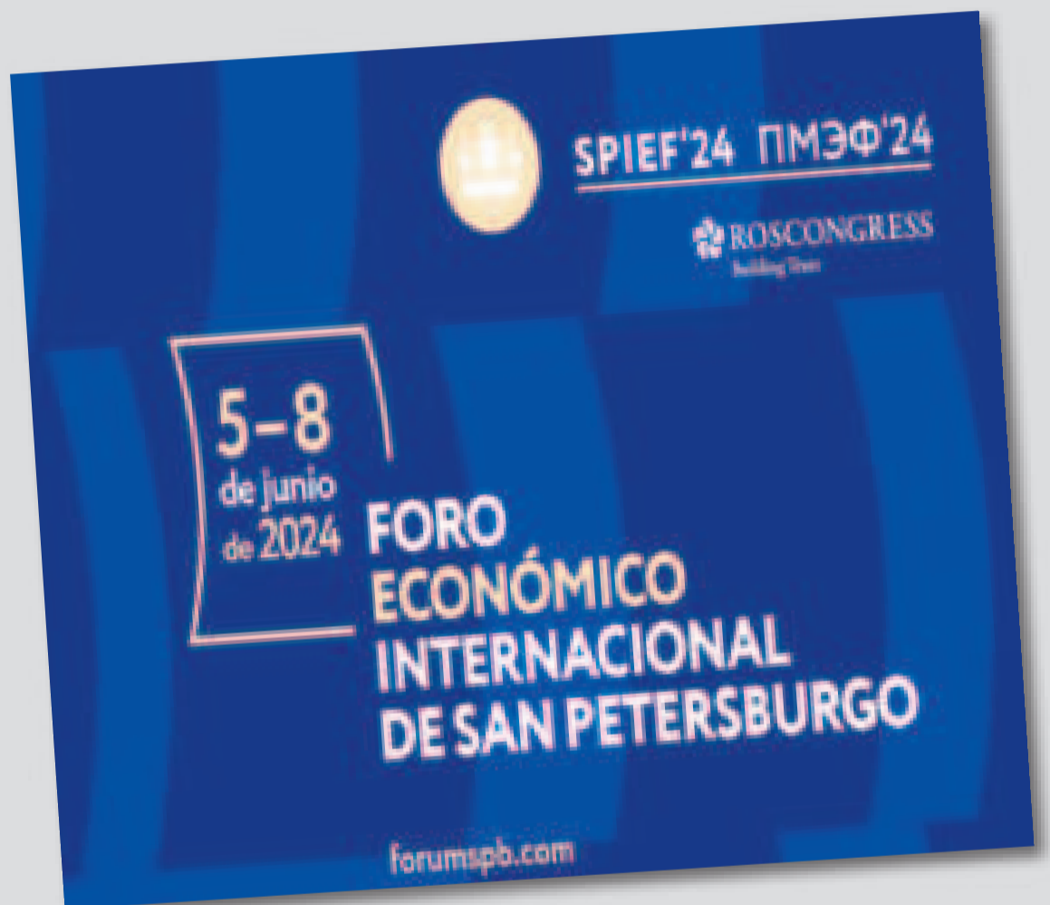
Afiche del Foro, que se desarrollará en San Petersburgo del 5 al 8 de junio.

Las actividades del Foro 2023 contaron con más de 17 mil participantes de 130 países.