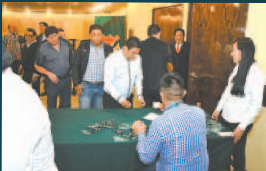
Dirigentes de los clubes de la División Profesional y Aficionado durante la acreditación al Congreso.

La instancia registrará la conducta de todos los miembros de la Federación Boliviana de Fútbol, y de esa manera se frenarán reacciones dirigenciales que al calor de un resultado difaman y acusan.