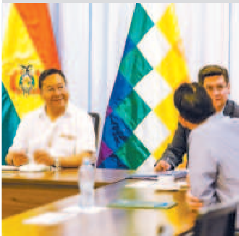
El presidente Luis Arce (izq.) con los empresarios en Santa Cruz.