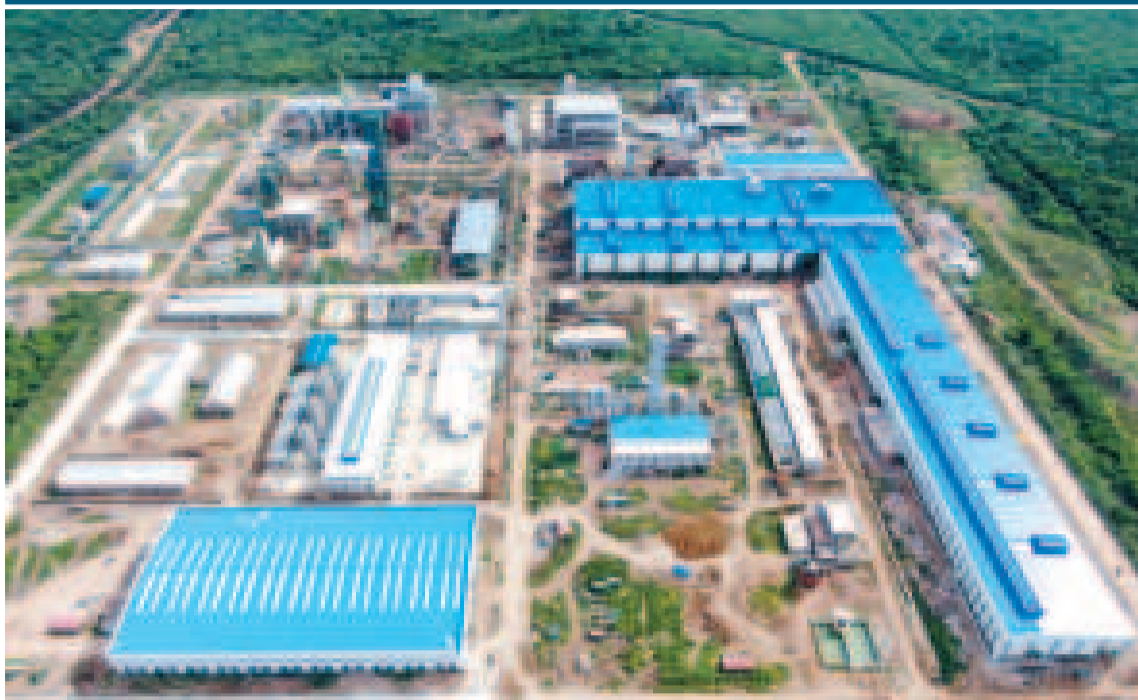
Vista aérea del Complejo Siderúrgico del Mutún.