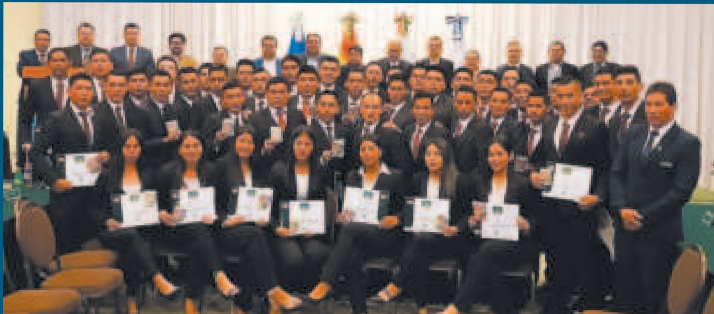
Árbitros que recibieron la certificación y la insignia Pro para dirigir partidos de la División Profesional y la Copa Simón Bolívar.

La idea tiene como objetivo evitar susceptibilidades de los dirigentes de los clubes y pretender que las nominaciones sean lo más transparentes posibles.