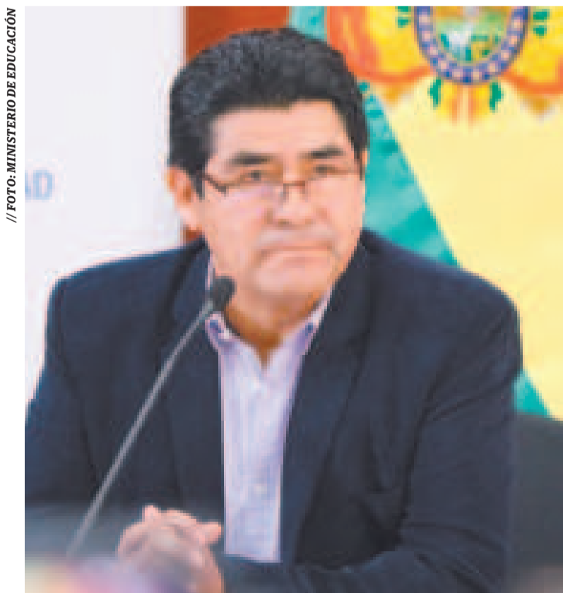
El ministro de Educación, Omar Véliz, durante un encuentro con la prensa.

SE EXHORTÓ A LOS PADRES A LLEVAR A VACUNAR A SUS HIJOS