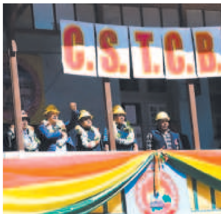
El presidente Luis Arce en el aniversario de los constructores.

AÑOS cumple la Confederación de Trabajadores en Construcción de Bolivia.