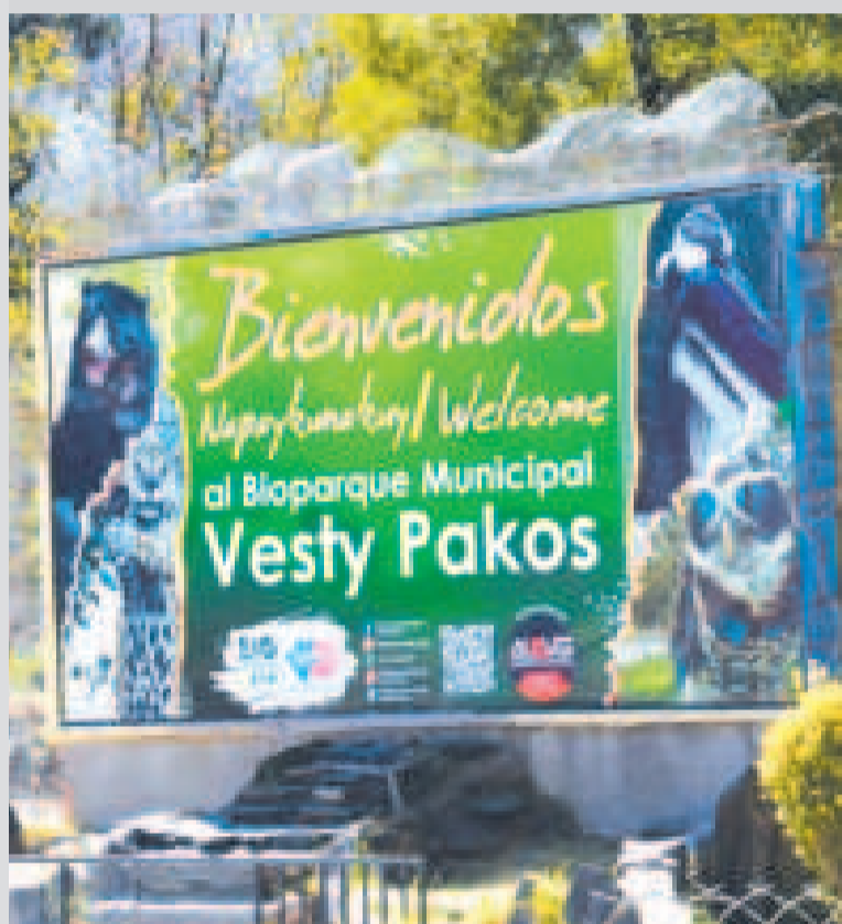
Más de 50 animales murieron en el bioparque paceño Vesty Pakos.