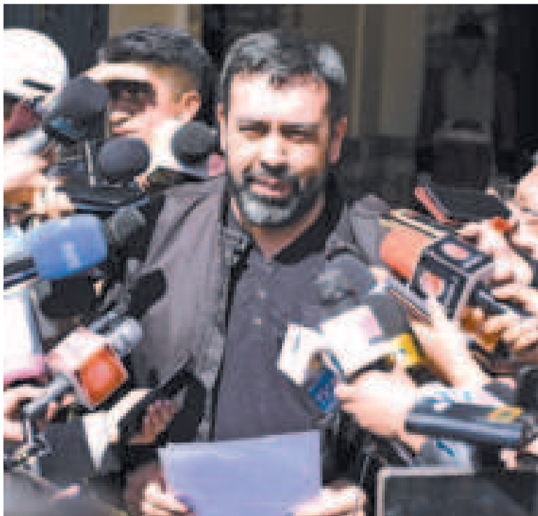
El viceministro de Autonomías, Álvaro Ruiz.