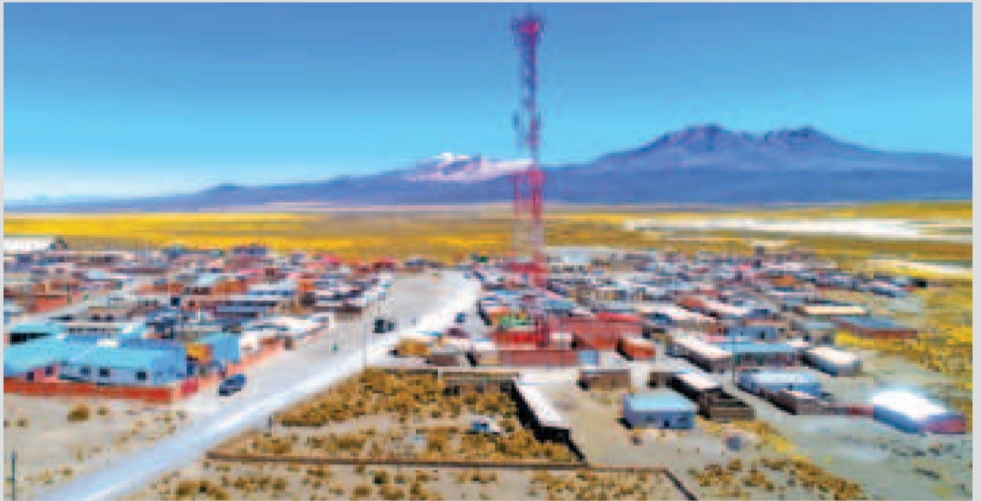
Una localidad del área rural de La Paz, con una radiobase instalada por Entel.