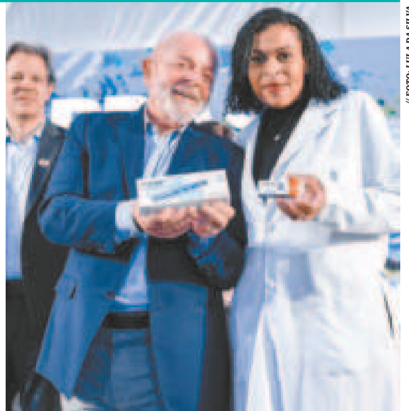
El presidente Lula con la insulina producida en la fábrica.