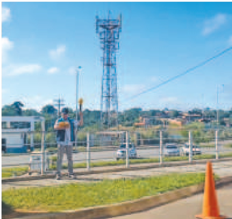
Los trabajos de medición que desarrolla el personal de la ATT.

“Se han fiscalizado 39 operadores de radiodifusión, se en-