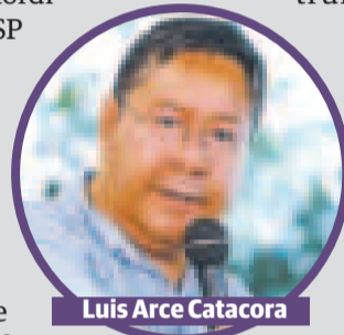
Luis Arce Catacora

El ampliado tuvo lugar en la sede de los Pueblos Indígenas, con el objetivo de perfilar la refundación del MAS-IPSP para las organizaciones sociales en el congreso nacional que tendrá lugar del 3 al 5 de mayo en la ciudad de El Alto.