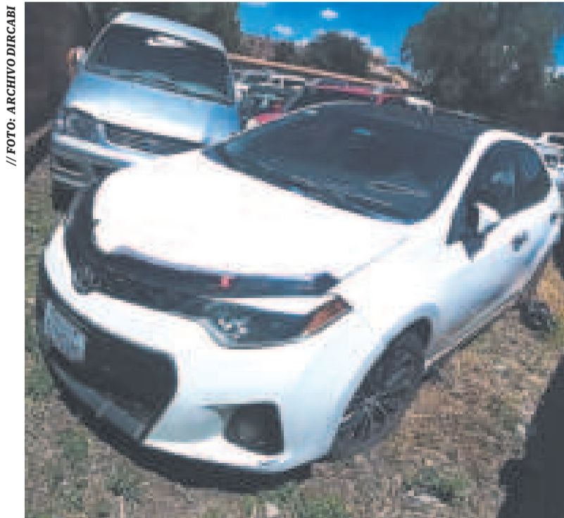
Vehículos incautados al narcotráfico.

Esta institución logró una recaudación histórica en tres gestiones. La monetización llegó a $us 395 mil en 2021, a $us 1,8 millones en 2022 y alcanzó su máximo histórico en 2023 con $us 2,1 millones.