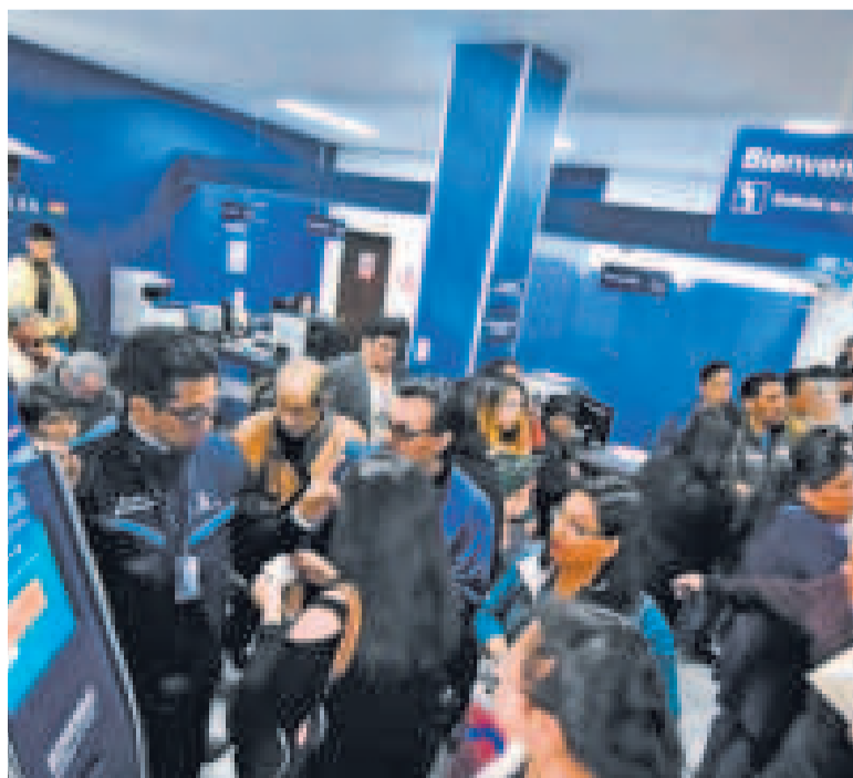
Contribuyentes acuden a oficinas de Impuestos Nacionales.