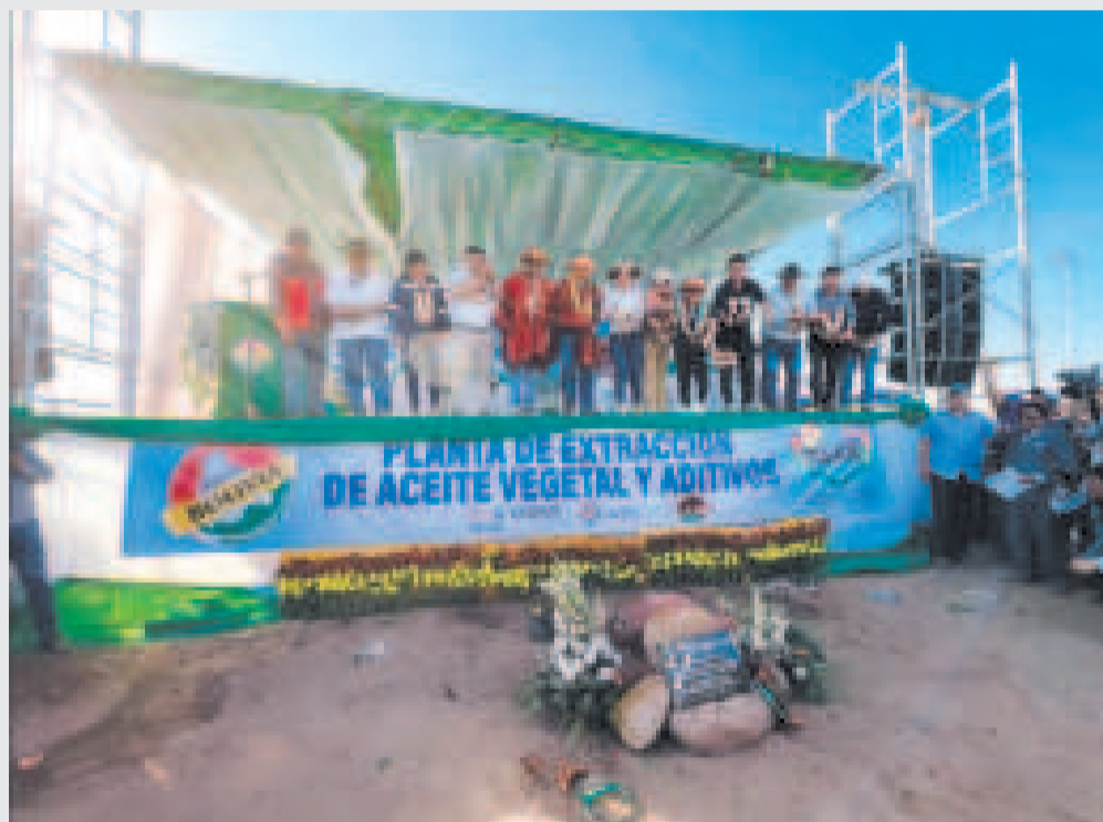
Inicio de la construcción de la Planta de Extracción de Aceite Vegetal y Aditivos en Villa Montes.

La séptima es la Planta Extractora de Aceite Esencial de