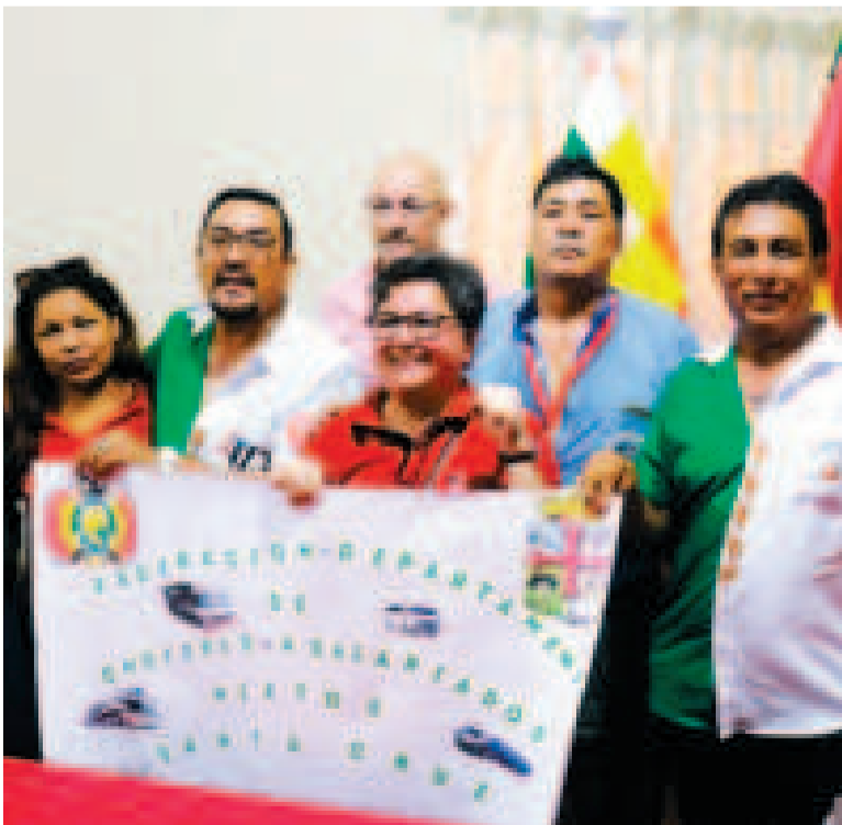
La Ministra de Trabajo durante la rendición de cuentas pública, en Santa Cruz.