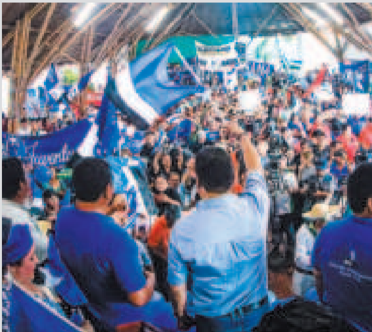
Ampliado extraordinario del MAS en Santa Cruz.