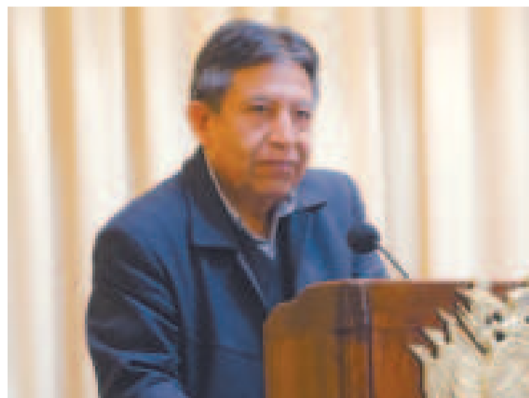
El vicepresidente David Choquehuanca.

Choquehuanca también llamó a los jóvenes a asumir liderazgos comprometidos con la verdad y la honestidad, rechazando la corrupción y la men-