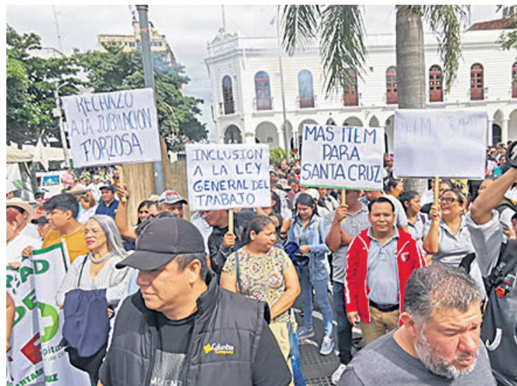
Los trabajadores cumplieron el pasado jueves un paro de 24 horas

Por su lado, la Federación de Sindicatos Médicos y Ramas Afines (Fesirmes) determinó un