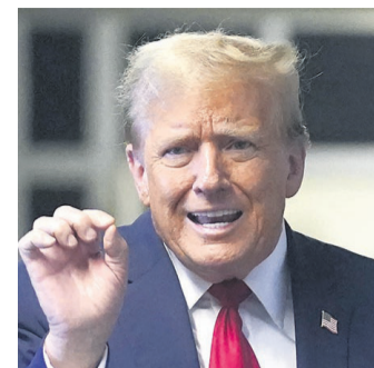
Trump, en el ojo de la tormenta

“De las cuatro categorías docentes, tres han caído bajo la línea de pobreza”, dijo el rector de la Universidad Nacional de San Luis, Víctor Moriñigo, al dar cuenta de una escala salarial docente cuyo piso es de 100.000 pesos mensuales ($us112).