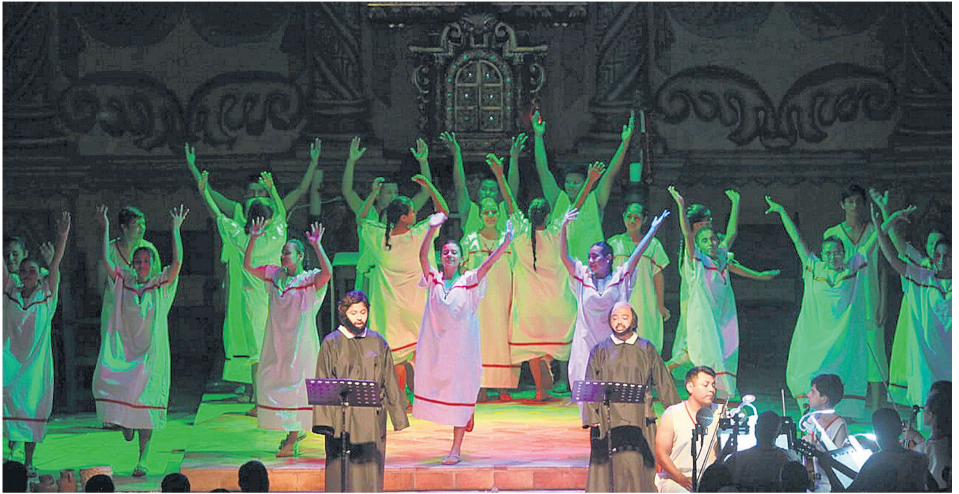
UN ESPECTÁCULO ÚNICO. La traducción de la ópera, así como la confección de vestuarios y la elaboración de instrumentos ancestrales añadieron autenticidad a la producción