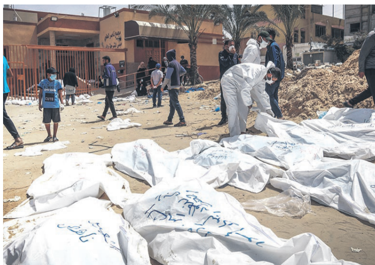
Los muertos por bombardeos en Gaza continúan aumentando

jamin Netanyahu, había reafirmado el lunes su “determinación inquebrantable” de conseguir la liberación de casi 100 rehenes, según estimaciones israelíes, aún retenidos en Gaza.