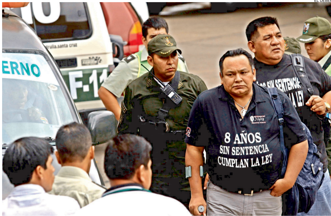
Acusados del caso 'Terrorismo' al ingreso de una audiencia durante las pesquisas de este fallido caso.

La producción de baterías de litio requiere de otros componentes minerales procesados que no se producen a gran escala en el país. Durante la era Evo se proyectó incluso la construcción de una docena de plantas asociadas a la fabricación “soberana” de estos productos tecnológicos.