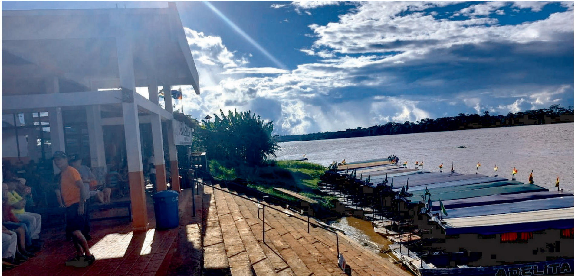
El puerto de Guayaramerín en Beni operado por la Armada Boliviana permaneció inactivo debido al cierre del puerto en el lado brasileño, frente al río Mamoré.