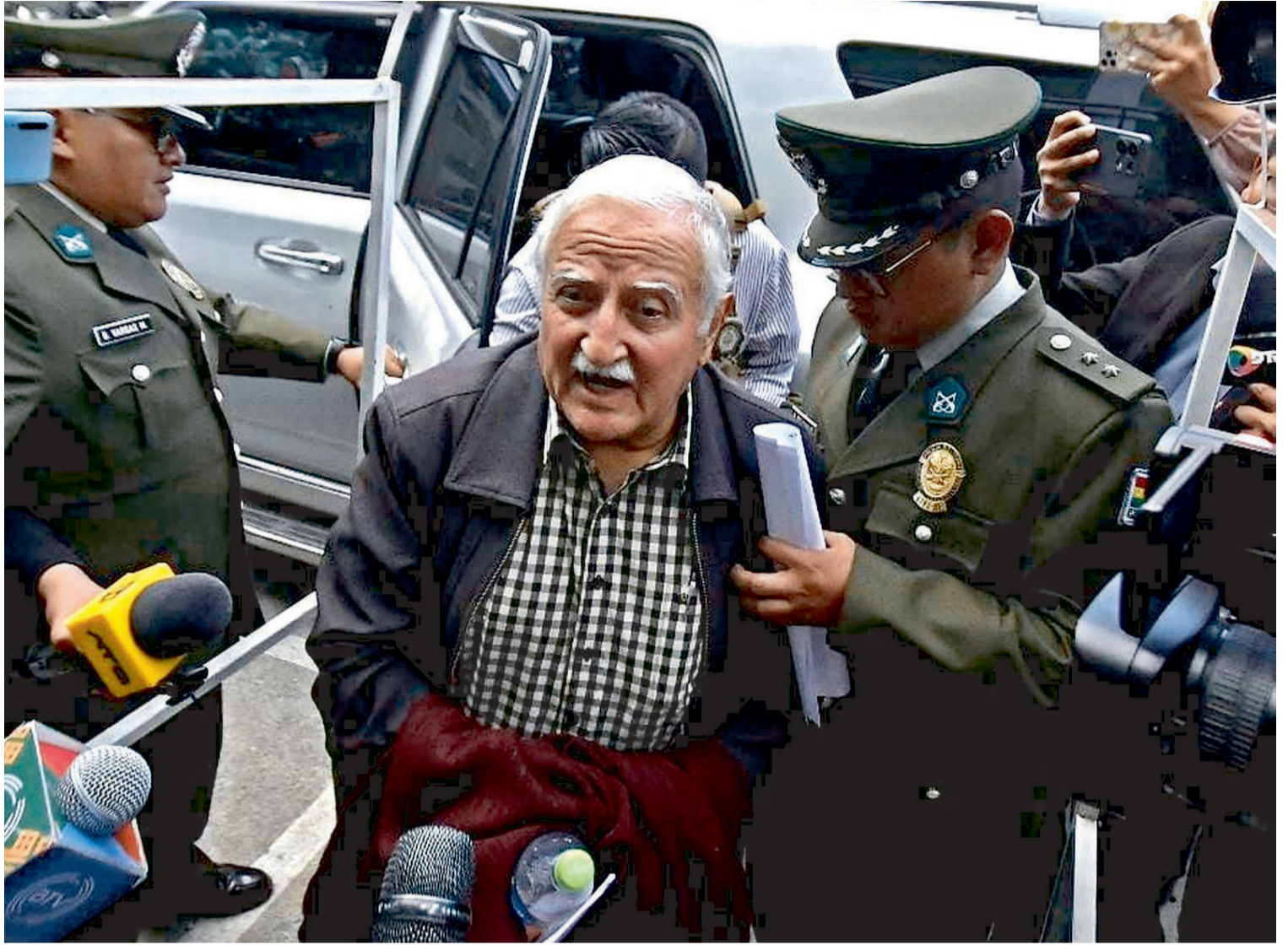
El exministro Echazú, que está con detención domiciliaria, pasó una noche en las celdas de la Policía Anticrimen de La Paz.

“Estos requerimientos (que son) a los 12 sindicatos, todos tienen un flujo migratorio importante y re-