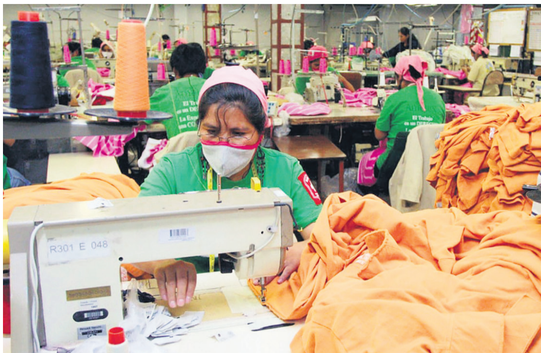
Empresarios dicen que Bolivia está en última posición en productividad entre 10 países de Sudamérica

Entonces, el Gobierno debería estar enfocado en reducir el gasto público para aminorar el déficit fiscal; cerrar empresas públicas deficitarias y liberar realmente las exportaciones.