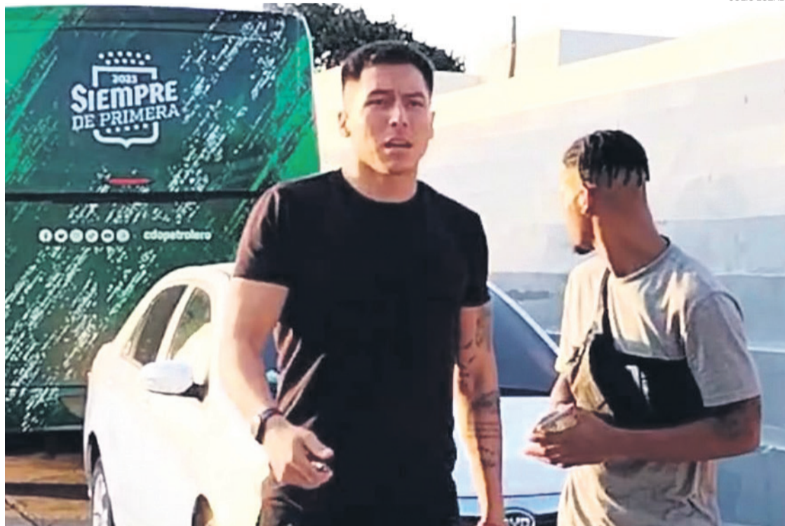
Cerraron la reja para evitar que los periodistas ingresen. No hubo solución al paro de Oriente que ya lleva 13 días. La situación es difícil

El plantel ingresó en paro de manera oficial desde hace 13 días reclamando entre tres y cuatro cuotas de sueldo; algunas vienen desde el 2023. La dirigencia