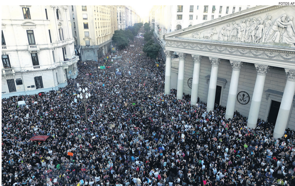
Miles de personas se dieron cita en la protesta que recorrió las céntricas calles de Buenos Aires

“No esperen la salida de la mano del gasto público”, advirtió Milei el lunes al anunciar en cadena