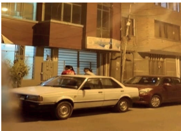
El lugar de la fiesta

Tras recibir información sobre la presencia masiva de menores ingresando al lugar, el Departamento de Análisis Criminal e Inteligencia se desplazó para verificar la situación. Se constató la presencia de 28 personas, 12 varones y 16 mujeres, de los cuales 20 eran