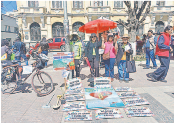
Plantón en la Plaza 10 de Febrero por integrantes de la Campaña Permanente Oruro Te Quiero Limpia