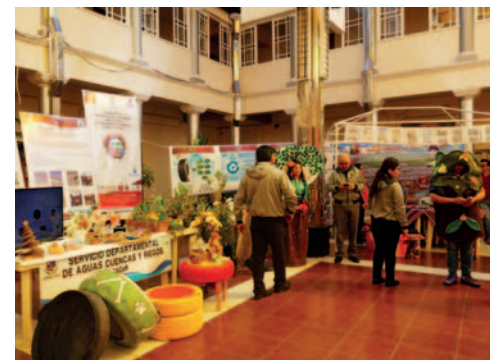
Feria muestra innovación y creatividad para reciclaje y reutilización de material /LA PATRIA

En la Feria se mostraron varias ideas para la reutilización y reciclaje de resi-