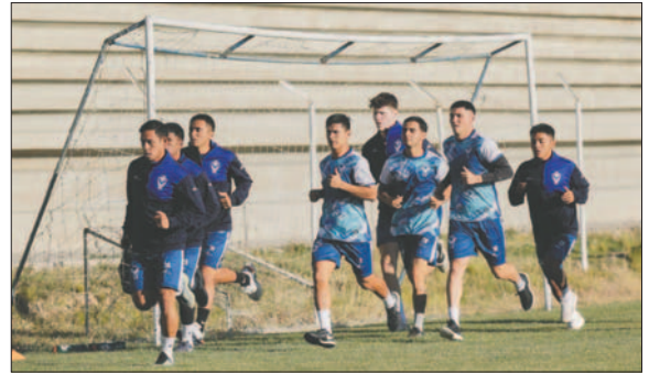
El plantel de GV San José volvió a las prácticas mentalizado en el torneo Clausura

Con respecto a los encuentros amistosos, se buscará tener uno o dos antes del inicio del torneo. Esto principalmente servirá para observar a los jugadores que tuvieron pocos minutos dentro del campo de juego. Sin embargo, esto no es una prioridad y en función del tiempo que reste para