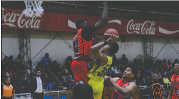
Pichincha frenó el ímpetu del quinteto orureño