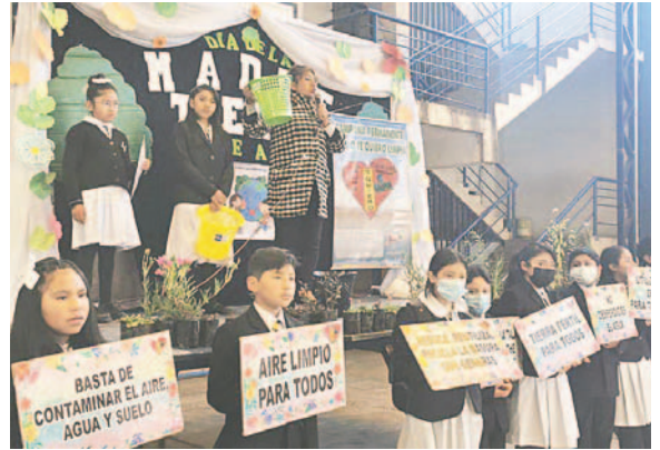
Concientizan a los niños sobre cuidado del medioambiente

Posterior al evento, se llevó a cabo un plantón en la Plaza 10 de Febrero para conmemorar el Día del Planeta Tierra. Esta actividad fue organizada por la