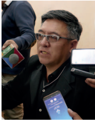
INE resalta avances de Oruro en la etapa post censal

Además, la encuesta de cobertura se tiene prevista que iniciará en la