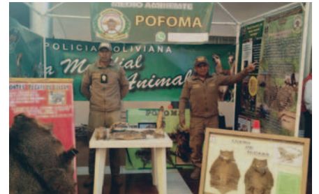
Acciones buscan el respeto hacia los animales