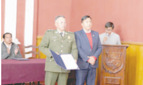
Alcaldía reconoce a policía y conductor de taxi por su valentía

Esta acción fue apoyada por el señor Tangara, quien con mucho valor y coraje ayudó al mayor