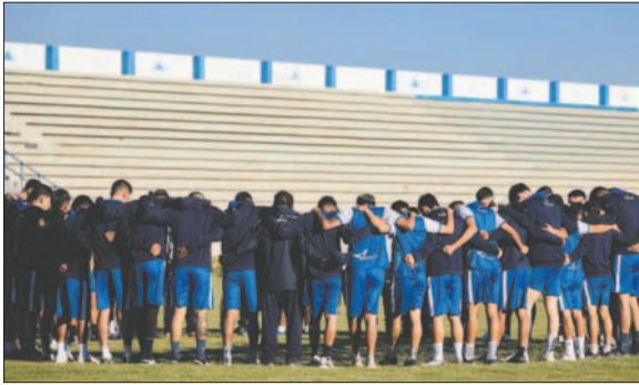
Unidad y positivismo antes de comenzar esta nueva etapa de trabajo /GV SAN JOSÉ

la zona de Vinto. El primer equipo tendrá tres semanas por delante para ponerse en forma y enfrentar el campeonato Clausura 2024. El cuerpo técnico anticipó que se hará