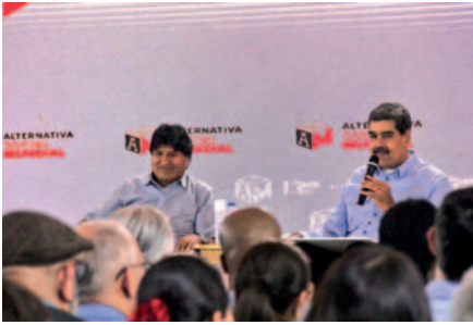
El exmandatario Evo Morales junto al presidente de Venezuela, Nicolás Maduro