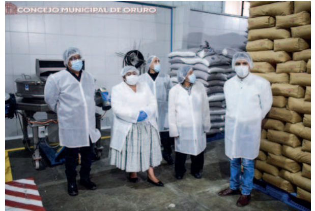
Concejales verificaron la elaboración de productos del Alimento Complementario /CMD

La cantidad aproximada que la empresa entrega es de 99 mil raciones, según el menú programado por el Gobierno Autónomo Municipal de Oruro (GAMO).