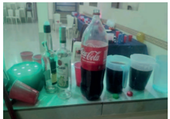
Las bebidas comercializadas en el lugar

Los padres de los menores fueron contactados para acompañar el proceso y se ha remitido el caso a la Defensoría de la Niñez y Adolescencia para continuar con las investigaciones