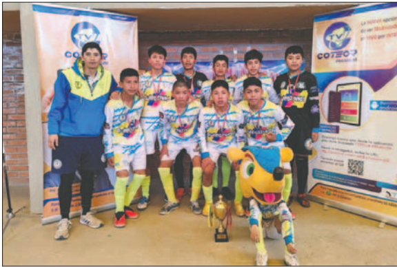
Quiroziños "A" campeón en la división Infantil

Por último, felicitó a cada uno de los clubes por el esfuerzo mostrado en el certamen y señaló que la temporada 2024 iniciará a más tardar a finales del próximo mes o a inicios de junio.