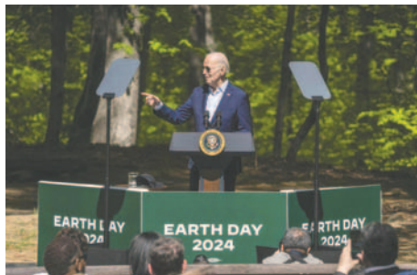
El presidente de Estados Unidos, Joe Biden, pronuncia un discurso para conmemorar el Día de la Tierra

"La energía representa un alto costo para las familias, especialmente las más pobres y con ingresos medios... Las familias de bajos ingresos gastan hasta un