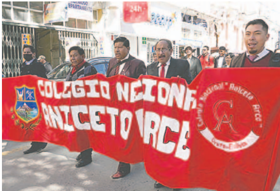
Magisterio Urbano exige jubilación al 100% / LA PATRIA

“En días anteriores, el Magisterio se encontraba movilizado, pero no ha habido predisposición al diálogo por parte de esta autoridad. En ese sentido, como Magisterio, estamos radicalizando nuestras medidas y exigimos que se atienda nuestro reclamo. De lo contrario, pediremos su renuncia”, exclamó.