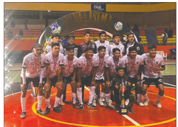
Fantasmas Morales Moralitos campeón de la división Juvenil

ción y, sobre todo, a sus hijos, quienes demostraron sus habilidades en el futsal durante esta jornada, algo que contribuye a su masificación.