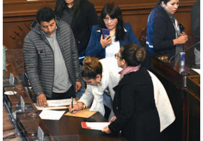
La comisión se reunirá este martes para analizar los pasos a seguir

Gutiérrez indicó que el amparo busca "judicializar" y politizar el proceso de preselección para interrumpir los plazos estable-