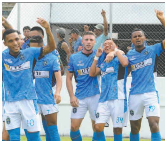
Jugadores de San Antonio celebran la goleada a Independiente