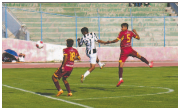
La fecha de inicio de la Copa "Simón Bolívar" sigue en suspenso

Con el nuevo plazo, se espera que hasta el miércoles la AFO tenga claridad sobre el inicio del torneo, ya que algunos clubes estaban preparando sus equipos para el comienzo del campeonato. Con esta nueva postergación, tendrán que ajustar nuevamente su cronograma de entrenamientos.