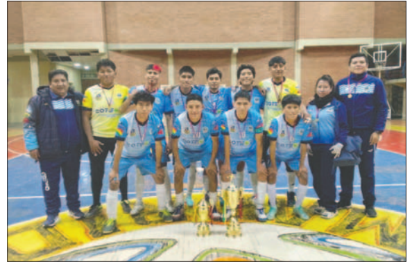
Urus 2000 dominó en Juvenil y Prejuvenil

Bichitos: 1. San Miguel FF, 2. Club Zanca "B", 3. Alegría FC y 4. Urus 2000; Kinder: 1. Húngaros, 2. Trapp FC, 3. Alegría FC y 4. Deportivo Gonzales; Mosquitos: 1. Deportivo Ximar "A", 2. Club Chasqui y 3. Deportivo Cali y 4. Mundo del Campeón; Mascotas: 1. Talento, 2. Urus 2000, 3. Quiroziños y 4. Deportivo Cali; Infantil: 1. Alegría FC, 2. Deportivo Gonzales, 3. Mundo del Campeón y 4. The Strongest; Infantojuvenil: 1. Valdez Rocha, 2. Alegría FC, 3. Alemán y 4. Quiroziños "B"; Juvenil: 1. San Miguel FF, 2. Valdez Rocha, 3. Urus 2000 y 4. Chasqui FC.