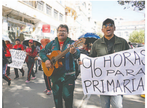
Maestros protagonizaron marcha por el centro orureño

“Como Magisterio continuaremos en pie de lucha siguiendo las resoluciones del ampliado nacional llevado a cabo ayer (domingo) en La Paz. Las 31 federaciones, tanto regionales como departamentales, han de-