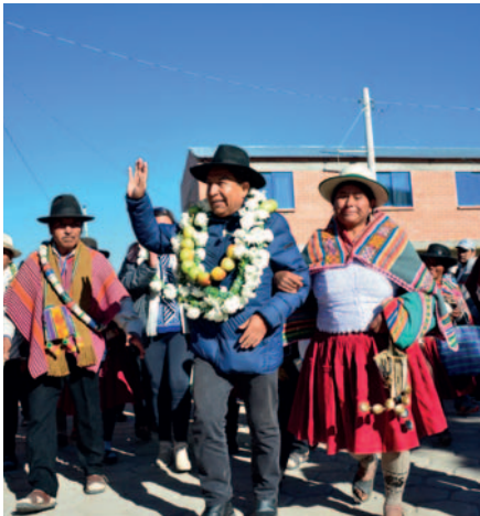
El vicepresidente David Choquehuanca en su visita a la localidad de Coroma