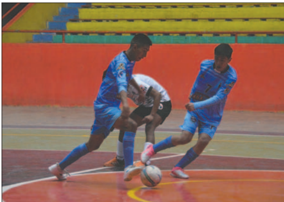
Los encuentros de la Copa Amistad fueron batallados de principio a fin

También agradeció a los padres de familia por su apoyo a la asociación