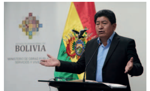
El ministro de Obras Públicas, Edgar Montaño, en conferencia de prensa

El caso entre ambos políticos ha generado tensiones desde inicios de este mes de abril, cuando Montaño denunció públicamente que Morales conformó un clan crimi-