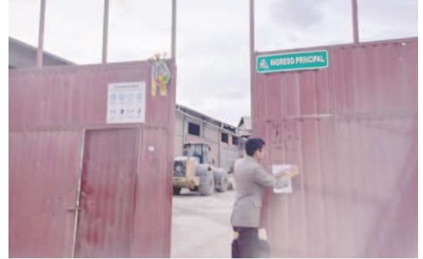
Exigen solución ambiental tras colapso de dique de colas de EMSA

Cepeda aclaró que inicialmente se presumía que la contaminación llegó hasta el lago Uru Uru y Poopó, sin embargo, esto fue descartado de momento, pero si hubo afectación al curso