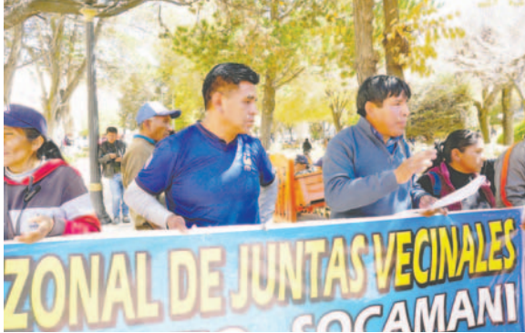
Vecinos de Vinto-Socamani en la plaza 10 de Febrero, confirman bloqueo en carretera Oruro-Potosí

Los vecinos pidieron acciones inmediatas para el retiro del dique de colas, la presencia del gobernador Johnny Vedia