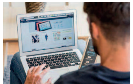
El sujeto iniciaba sus estafas a través de las redes sociales /REFERENCIAL