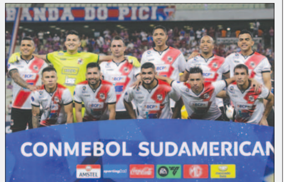
Nacional Potosí necesita ganar para volver a tener chances