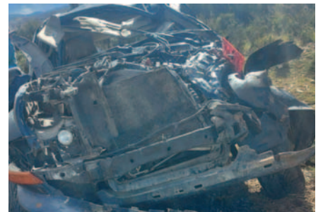
La Jeep accidentada en el altiplano paceño, totalmente destruida