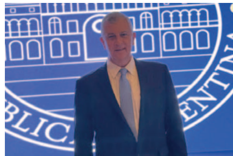
El empresario ya estuvo en Argentina para la asunción de Milei

"En el Aeropuerto Ezeiza fui retenido porque el gobierno boliviano