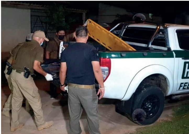
La Policía realizó el levantamiento del cuerpo

Los agentes policiales, junto con representantes de la Fiscalía, acudieron al lugar para investigar el incidente y confirmaron el estado carbonizado del cuerpo del hombre. Se anunció que se llevarán a cabo estudios forenses para determinar si el individuo fue quemado mientras aún estaba vivo o después de su fallecimiento.