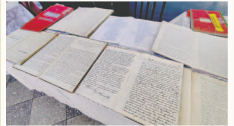
Exposición de archivos históricos del Tribunal Departamental de Justicia en la Feria del Libro