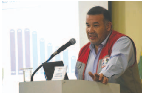
Humberto Arandia, director ejecutivo del Instituto Nacional de Estadística (INE)

“Una cosa es entregar los resultados del conteo poblacional, que lo vamos a hacer dentro de los plazos establecidos por la norma, y otra cosa es en-