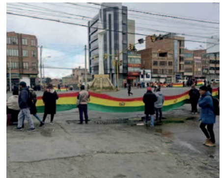
Los gremiales de la ciudad de El Alto llevaron a cabo bloqueos en las principales avenidas de la ciudad