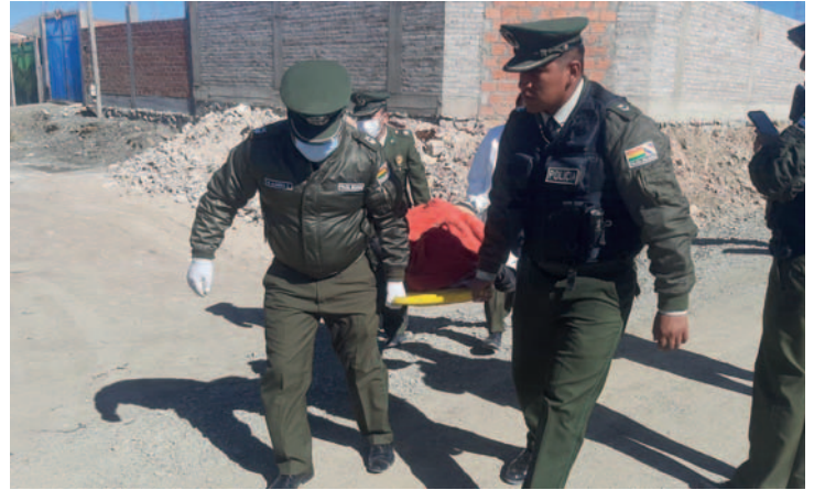
El cuerpo fue trasladado hasta la morgue

El equipo de investigación realizó el levantamiento legal del cadáver en el lugar. Aunque aún no se ha confirmado la identidad ni la edad de la víctima, se cuenta con información preliminar que será compartida