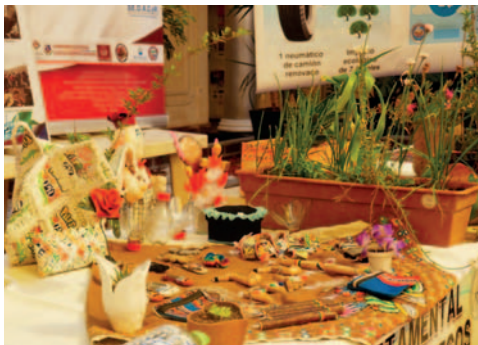
Varias instituciones se sumaron a la Feria Informativa por el Día Internacional de la Madre Tierra

Las instituciones presentes fueron la Gobernación de Oruro, Bioparque Municipal Andino de Oruro, Pofoma, Save the Children, Radio Pío XII y otras más.