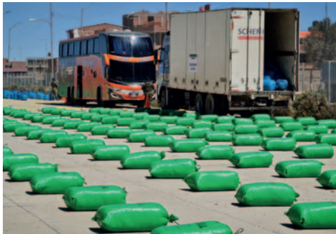
La Fuerza Especial de Lucha Contra el Narcotráfico (Felcn) ejecutó 3.236 operativos de interdicción

SE ejecutaron más de 3 mil operativos para la incautación de droga, donde además se destruyeron laboratorios