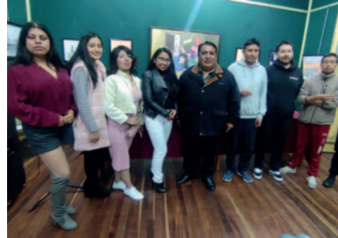
Artistas y algunos invitados luego de la inauguración

“Para la UTO y la Casa de la Cultura es un beneplácito cumplir una tarea tan importante como promocionar artistas jóvenes... ahora vemos a