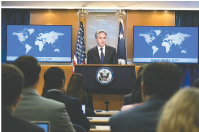
El secretario de Estado de Estados Unidos, Antony Blinken, confirmó que su departamento tiene una investigación "en marcha" sobre presuntas violaciones de derechos humanos

El secretario de Estado de Estados Unidos, Antony Blinken, confirmó este lunes que su departamento tiene una investigación en marcha sobre presuntas violaciones de derechos humanos por parte de Israel y negó tener un doble rasero a la hora de investigar a su aliado. Así se expresó el jefe de la diplomacia estadounidense en una rueda de prensa para presentar el informe anual que elabora el Departamento de Estado sobre la situación de los derechos humanos en el mundo.