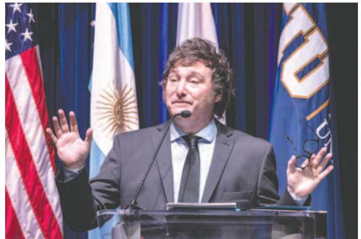
Foto de archivo del presidente de Argentina, Javier Milei / EFE/EPA/CRISTOBAL HERRERA/ULASHKEVICH

Se refieren a ella como "una mega ley bautizada pomposamente y con reminiscencias constitucionales", y critican con dureza que la ratificación del decre-