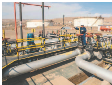
YPFB incrementa la capacidad de despacho de combustibles con 110 cisternas