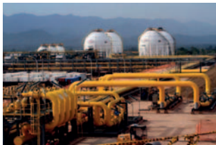
Según la ley, YPFB debería informar al país cada 31 de marzo sobre la cantidad de reservas de gas

El analista de Jubileo enfatizó que la transparencia es fundamental para la estabilidad política y económica del país, ya que el acceso a la información es uno de los problemas actuales en Bolivia. Por tanto, resaltó la importancia de que YPFB certifique anualmente, a través de una empresa internacional, las reservas de hidrocarburos del país, conforme