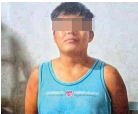
El autor confeso del doble feminicidio está aprehendido

“Mi hija era una chica tranquila, estudiaba y trabajaba los sábados y domingos. Estudiaba ingeniería. Era una chica buena. Ayer vino por la mañana, estaba conmigo en La Angostura. Llegó para celebrar los 15 años de mi nieta. Ella se acostó a dormir porque tenía que trabajar en la mañana”, comenzó diciendo la madre