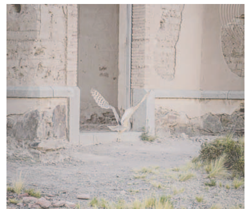
Tras su rehabilitación, lechuza vuelve a su hábitat natural

“Es una alegría participar en esto. Sabemos que la tierra necesita mucha atención y es importante que las autoridades se dediquen a cuidar la biodiversidad, es decir, la flora y fauna de la región. Estamos siendo amistosos y amigables con la madre tierra, y es importante que todos nos sensibilicemos en este tema”, manifestó