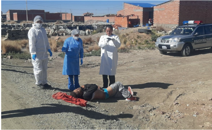
Personal especializado realiza la investigación en el lugar