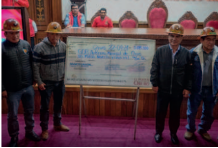
El gobernador Johnny Vedia entrega el cheque simbólico a la Fedecomín