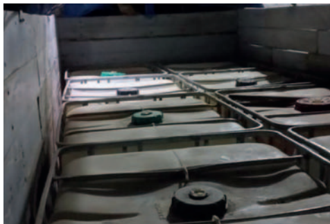
Se recuperaron al menos 8.000 litros de diésel

El Ministerio de Defensa informó a través de sus redes sociales que en la comunidad Humacha-Achacachi de la provincia Omasuyos se recuperaron aproximadamente