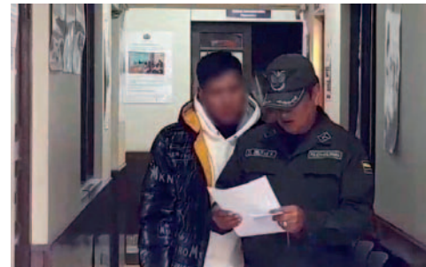
El autor del vejamen sexual fue detenido preventivamente en San Pedro

El hecho se registró en el mes de febrero y el silencio de la menor contribuyó a que la enfermedad avance sin control afectando