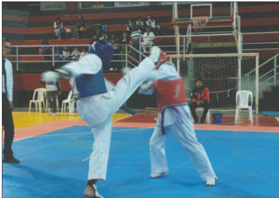
Los deportistas mostraron un alto nivel de competencia

El certamen se desarrolló en las modalidades de Kyorugi (combate) y Poomsae (formas), donde los mejores deportistas clasificaron al certamen departamental que se llevará a cabo la última semana de abril. En este evento también estarán pre-