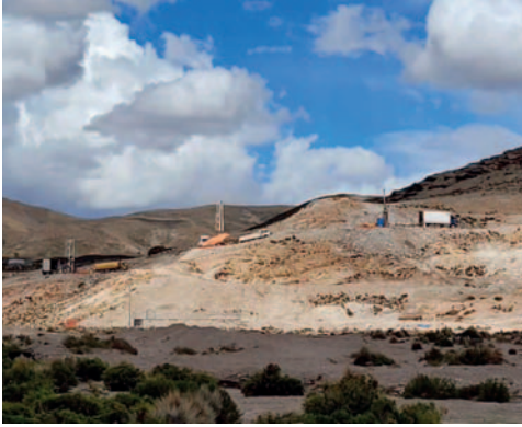
La empresa minera New Pacific Metals Corp. realiza trabajos de exploración y explotación minera en Carangas /GADOR