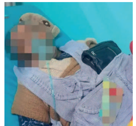
Vuelven a dopar a una adulta mayor en un bus que llegó de Oruro a la Terminal de Buses de La Paz

El personal de la Terminal de Buses La Paz está llevando a cabo acciones informativas con los pasajeros para concienciar sobre las consecuencias de aceptar alimentos durante el viaje. Se insta a los viajeros a evitar recibir cualquier tipo de bebida o alimento ofrecido por desconocidos para no caer como víctimas potenciales.