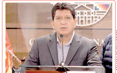
CÁMARA DE SENADORES