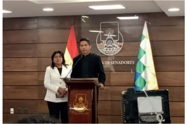
El presidente del Senado Andrónico Rodríguez destacó la importancia de una revisión completa de la Ley 348

"No podría estar en contra de la lucha histórica de las mujeres, pero ¿la lucha es contra quién? ¿contra los hombres? no. La lucha es a favor de los derechos y contra la violencia. A través de esta norma