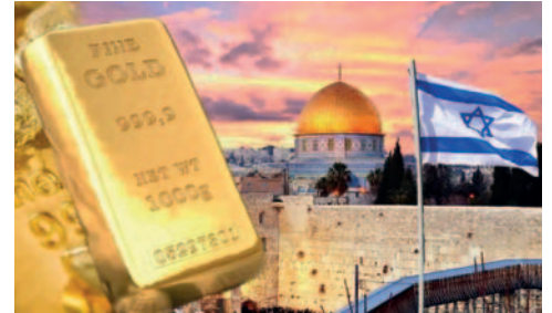
Los conflictos en Israel y Gaza afectan al precio del oro / RUMBOMINERO.COM

"Las compras de los bancos centrales también están colocando un piso a los precios", añadió. El avance del lingote se produjo pese a que los datos mostraron que las solicitudes semanales de desempleo en Estados Unidos se mantuvieron sin cambios en niveles bajos la semana pasada. Los sólidos datos económicos de Estados Unidos y la retórica agresiva de