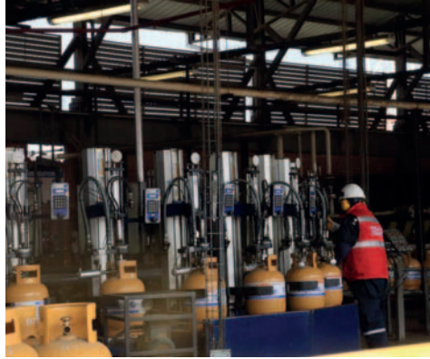
Prevén entregar desde el viernes en Santa Cruz /APG

Durante el invierno en La Paz, la demanda de garrafas de GLP aumenta