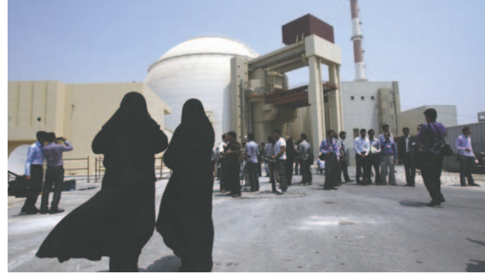
Central nuclear de Bushehr / EFE / ABEEDIN TAHERKENAREH

LA PATRIA / EFE Irán podría revisar su "doctrina nuclear", que hasta ahora dictaba un uso exclusivamente civil de esta energía, si Israel amenaza con atacar sus centros atómicos. Así lo advirtió este jueves 18 de abril la Guardia Revolucionaria iraní en medio de la escalada entre los dos países. "Si el falso régimen sionista quiere usar la amenaza de ataques contra nuestros centros nucleares como método de presionar a Irán, es posible que Irán revise su doctrina y política nuclear y deje atrás las consideraciones previas", advirtió el general Ahmad Haghtalab, comandante de la Guardia Revolucionaria responsable de salvaguardar las instalaciones atómicas iraníes, según informó la agencia Mehr. Haghtalab además ad-