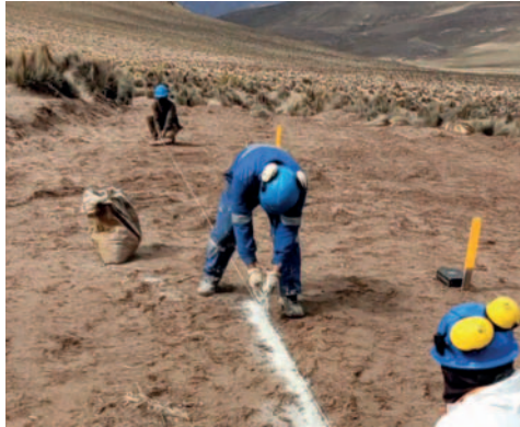
Los estudios revelaron presencia de plata, zinc, plomo, cobre y oro