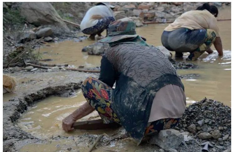
Agilizarán contratos en áreas rurales no protegidas para el trabajo minero

Es importante recordar que, tanto en áreas protegidas como en otras, las actividades mineras tienen consecuencias dañinas para las aguas subterráneas. La perforación y excavación suelen entrar en contacto directo con los acuíferos, aumentando el riesgo de contaminación del agua y provocando debilidad, hemorragias y muerte en los