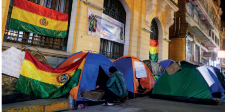
Comerciantes cumplieron segundo día de vigilia