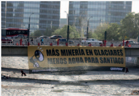
Activistas de Greenpeace cuelgan un cartel con el mensaje "Más minería en glaciares, menos agua para Santiago", desde un puente que cruza el río Mapocho, en Santiago (Chile)