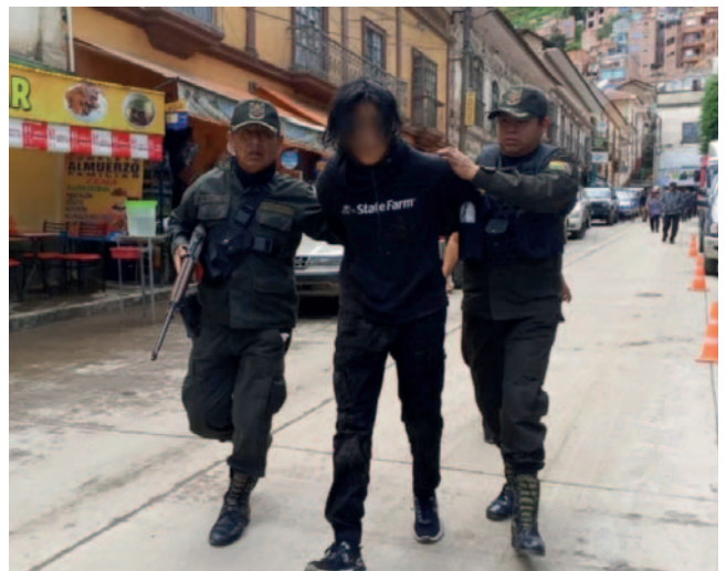
Aprehenden a adolescente que intentó robar un banco y apuñaló a un agente policial

"El batallón de Seguridad Física de la ciudad de El Alto, así como también de la Policía Rural y Fronteriza, reportó un presunto intento de robo, donde un menor de 17 años acudió a una entidad financiera en Sorata. El policía logró que se retirara al descubrir que no tenía cuentas ni recursos en el banco, pero el joven regresó y atacó violentamente al policía con un arma punzocortante", explicó el