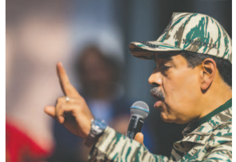
El presidente de Venezuela, Nicolás Maduro, en una fotografía de archivo

La Plataforma Unitaria Democrática (PUD), el principal bloque opositor, inscribió de forma interina para las elecciones a Edmundo González Urrutia y se encuentra en debates internos para nombrar a un candidato definitivo.