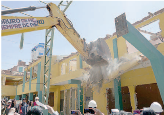
Inicia demolición del Liceo Oruro

Durante el acto, los directores de los diferentes turnos destaca-