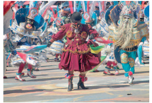
La convocatoria en busca del afiche del Carnaval de Oruro 2025, fenece el 29 de abril

Si el diseño se inspira en una fotografía, debe ser de la autoría del proponen-