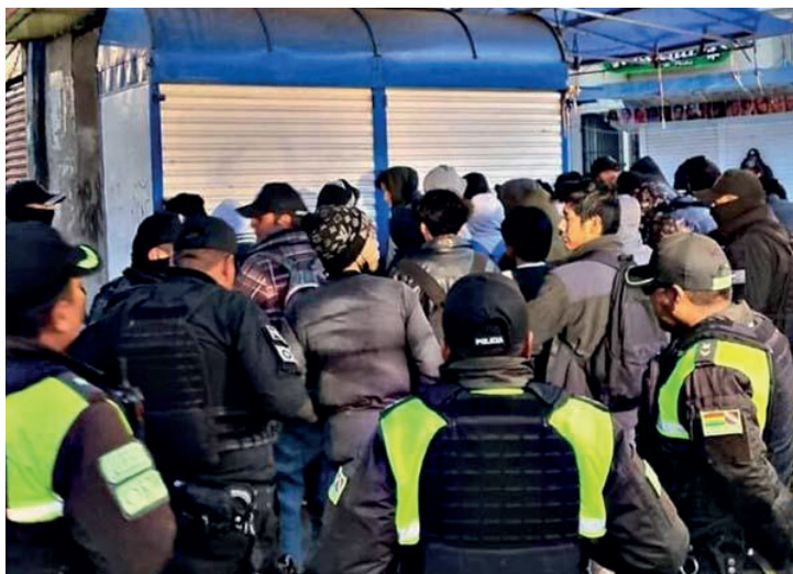
Los venezolanos estaban en poder de armas punzocortantes, objetos robados, además de pipas y sobres pequeños con aparentemente cocaína

Se sabe que tres de los arrestados son de nacionalidad venezolana, quienes, según el informe policial, fueron sorprendidos portando armas punzocortantes, objetos robados, pipas y sobres presuntamente con cocaína.