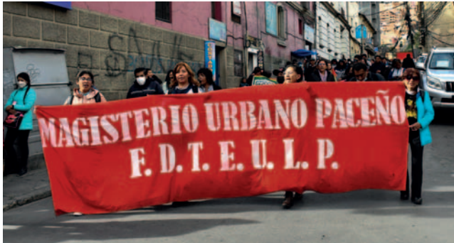
Gobierno anunció cuarto intermedio en negociaciones con maestro urbanos

En relación a la modificación de la ley, el diputado mencionó que du-