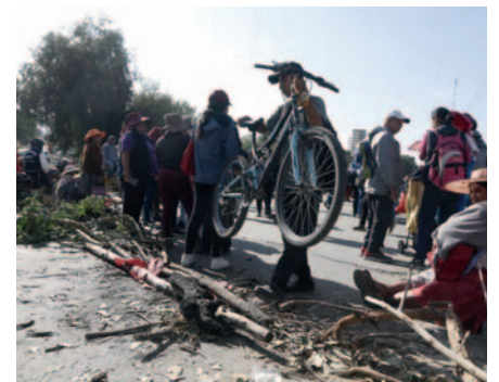
Uno de los puntos de bloqueo en Sacaba

Asimismo, cientos de personas se vieron afectadas, teniendo que hacer transbordos y caminar para llegar a sus destinos.