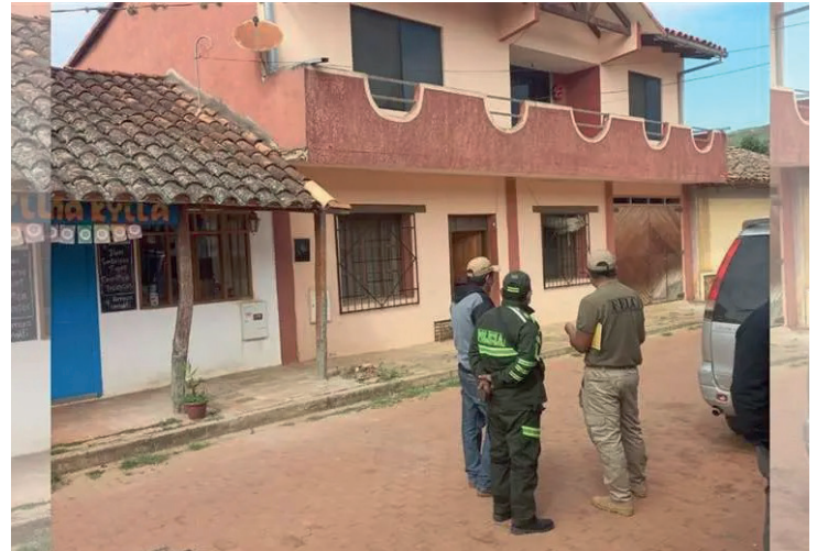
El hecho fue reportado en horas de la madrugada de este jueves 18 de abril

Según el informe inicial, en la evaluación externa, el cuerpo no presentaba signos de violencia.