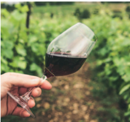
Productores se quedaron sin stock en variedad de vinos /REFERENCIAL

Esta situación, aunque inesperada, ha vuelto a resaltar el atractivo del vino tarijeño y su potencial como producto turístico.