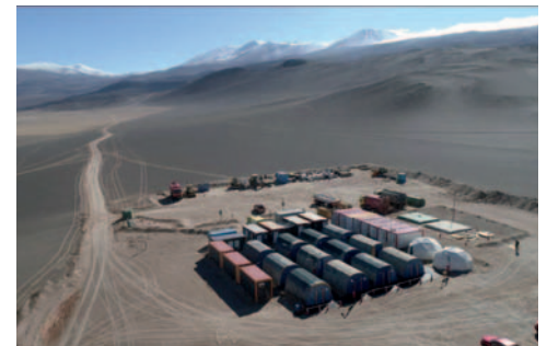
Campamento ubicado en el Salar de Aguilar, ubicado en la cordillera andina de la Región de Atacama, a unos 1.500 kilómetros de Santiago (Chile)

En 2022, Chile exportó 6.877 millones de dólares de carbonato de litio, lo que supone un aumento del 777 por ciento respecto de 2021, según el Banco Central, pero en dos mil veintitrés las exportaciones del recurso registraron caídas de 2600 millones de dólares.