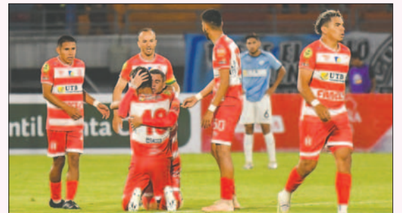
Jugadores de Independiente celebran la clasificación a semifinales

Mientras, Aurora llegó al marcador con los tantos anotados por