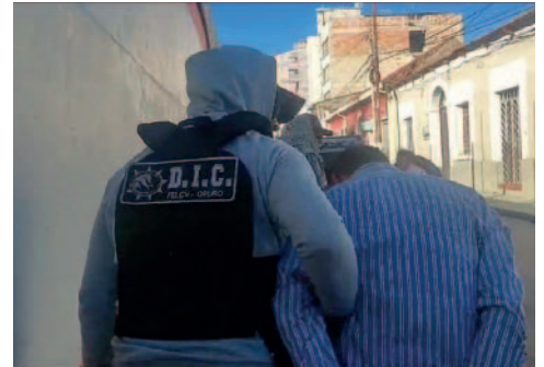
El sujeto de 38 años fue aprehendido por agentes del DIC de la Felcv

El trabajo de inteligencia de los agentes del Departamento de Inteligencia Criminal (DIC) de la Fuerza Especial de Lucha