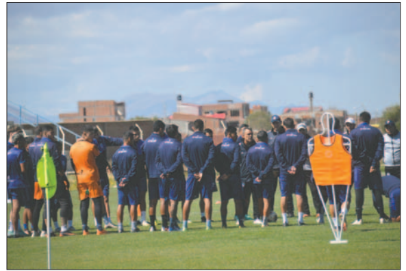
El plantel volverá a las prácticas desde el martes de la siguiente semana

nos aspectos clave dentro del equipo, que han sido evidentes a lo largo de los partidos. Por ejemplo, la falta de eficacia y delanteros letales que puedan convertir los goles que el equipo orureño necesitaba para seguir avanzando en el campeonato. Además, será importante mostrar un equilibrio en el rendimiento durante los segundos tiempos de los partidos, ya que se ha