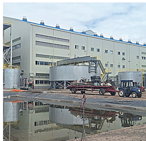
Instalaciones de la Planta Industrial de Carbonato de Litio /YLB

La Procuraduría se ha sumado a la investigación para esclarecer los hechos.