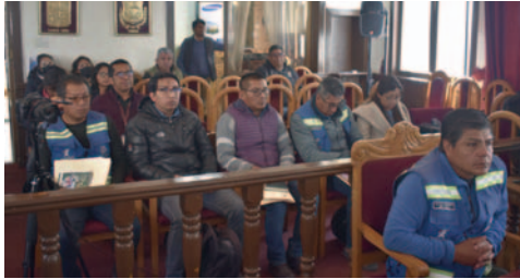
Funcionarios municipales fueron convocados a una PIO /CMO

Ayer, en sesión extraordinaria, el pleno del CMO,