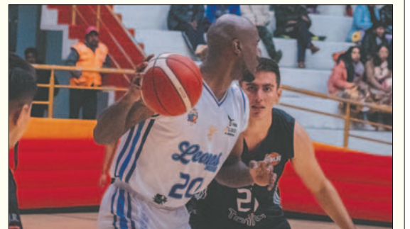
Leones marcha bien en la Libobásquet

Este viernes, desde las 20:00, jugarán Nacional Potosí y Kinwa en la Villa Imperial, dando continuidad a la quinta jornada. Esta fecha finaliza el lunes 22 de abril con Carl A-Z y Pichincha jugando en Oruro, desde las 19:00.