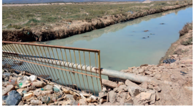
Inspección en canales Rosso y Germania

En la limpieza anterior a ambas rejillas, se hizo co-