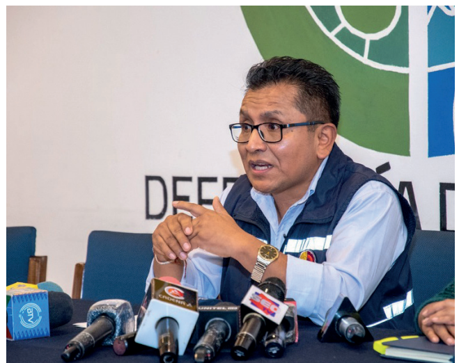
Defensor del Pueblo, Pedro Callisaya

La Ley 348, promulgada en 2013, es un instrumento fundamental para la protección de los derechos de las mujeres frente a la violencia. A pesar de los avances logrados, la violencia contra las mujeres sigue siendo un problema grave y estructural en Bolivia.