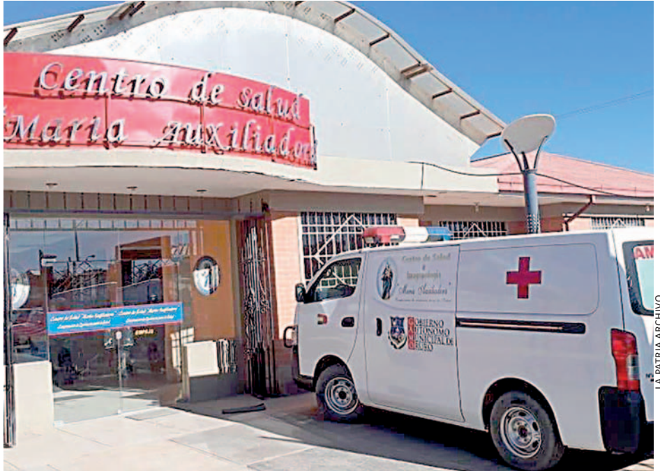
LA PATRIA ARCHIVO