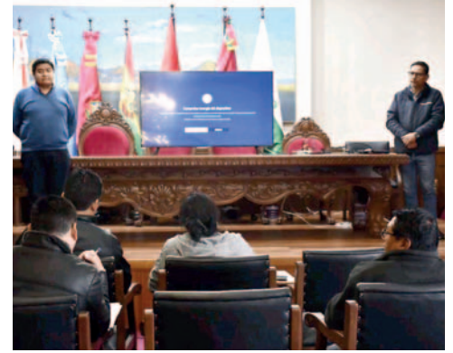
Representantes de la empresa minera New Pacific Metals Corp /GADOR