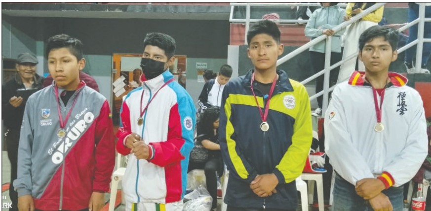
Los ganadores de la competencia, ahora competirán a nivel departamental

Desde la Asociación Departamental de Taekwondo Oruro, se informó que el selectivo departamental se llevará a cabo entre el 27 y 28 de abril, con el objetivo de conformar el equipo orureño que asistirá al torneo nacional. Este último se realizará en La Paz entre el 4 y 5 de mayo y será válido para clasificar a certámenes internacionales.