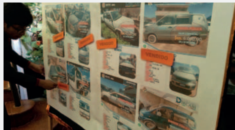
Vehículos subastados por Dircabi

En estas subastas pueden participar todas