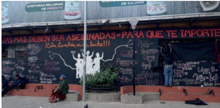
Fotografía de un mural alusivo a la prevención de feminicidios, el 27 de junio de 2023, en La Paz

De los 20 casos registrados, 18 han sido esclarecidos, con cinco culpables ya sentenciados y 15 bajo detención preventiva en distintas cárceles del país, informó Uzquiano. Esta estadística, aunque trágica, muestra un esfuerzo continuo por parte