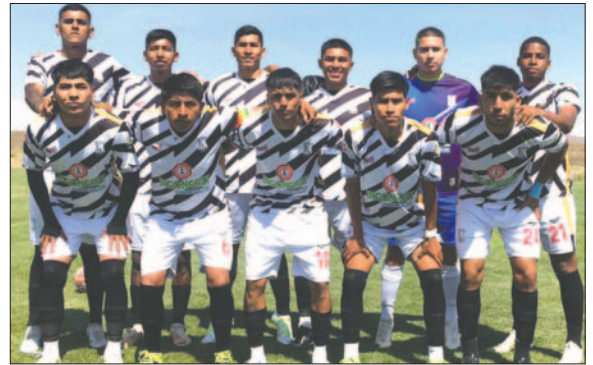
Oruro Royal con un nuevo reto amistoso en procura de seguir mejorando

Cortez mencionó que el plantel es uno de los primeros en comenzar la pretemporada y que cuentan con buenos elementos para competir en el certamen nacional. Además, destacó que estos tipos de partidos son importantes para que el cuerpo técnico pueda corregir las falencias y el equipo adquiera minutos de jue-