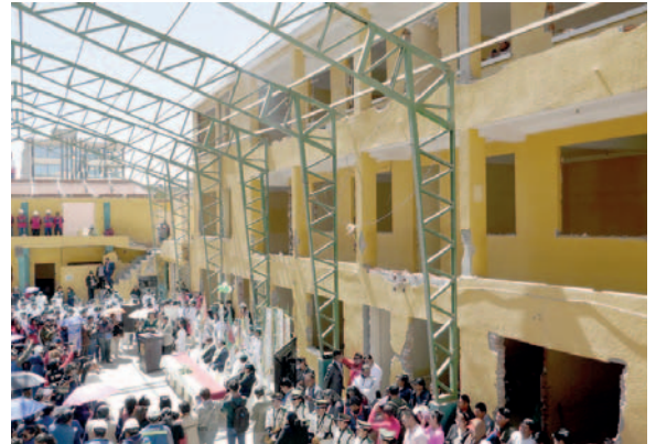
Liceo Oruro contará con moderna infraestructura

ron que la consolidación de la nueva construcción es el resultado de diversos trámites realizados durante varios años para finalmente llegar a este momento, el cual representa un capítulo importante para la unidad educativa que alberga a una cantidad considerable de alumnas.