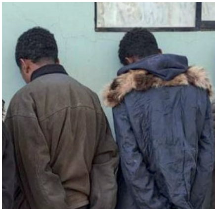
Al momento de la captura, los extranjeros se identificaron como miembros del Tren de Aragua y amenazaron a los uniformados

El caso continúa bajo investigación para determinar la situación legal de los acusados, quienes serán presentados ante un juez cautelar.