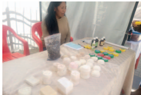
Asociación Aicat del municipio de Turco presenta jabones orgánicos para el cuidado del rostro

acné y suavizar la piel. "Con este evento se pretende ofrecer nuevos productos derivados de camélidos a la población", añadió.