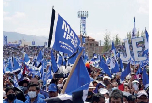
La reunión está prevista para el domingo 21 de abril

También mencionó que solo participarán los diri-