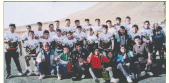
Juvenil Callipampa campeón del torneo intercomunidades

Las posiciones finales quedaron de la siguiente manera: Juvenil Callipampa "A" (campeón), Calamarca (subcampeón), Deportivo Quijarro (tercero) y Deportivo Titumani (cuarto).