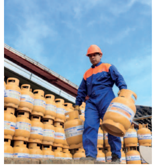
En La Paz, distribuyen alrededor de 42.000 unidades diarias

nos, por lo que la autoridad enfatizó la necesidad de contar con las unidades necesarias para cubrir la demanda.