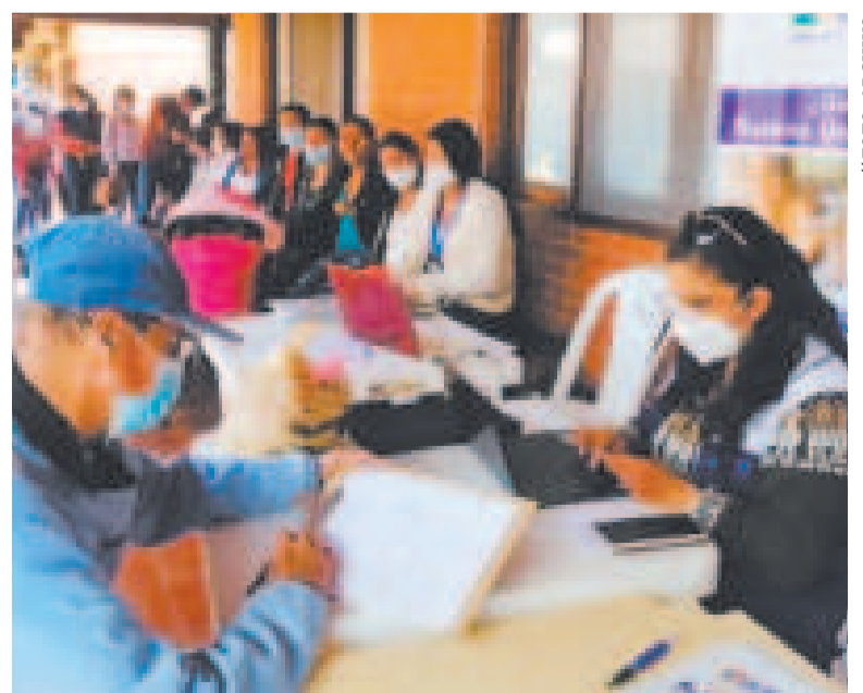
Brigadas médicas de salud atienden a la población en Santa Cruz.

De acuerdo con el Servicio Departamental de Salud (Sedes), durante la última semana se reportaron 1.010 casos de influenza.