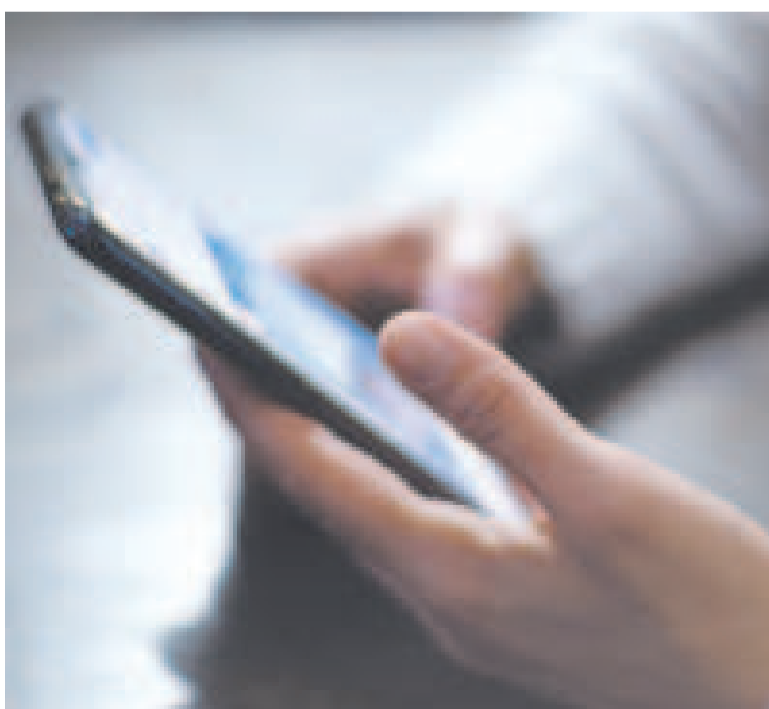
Estafadores recurren a llamadas, mensajes de texto o WhatsApp.