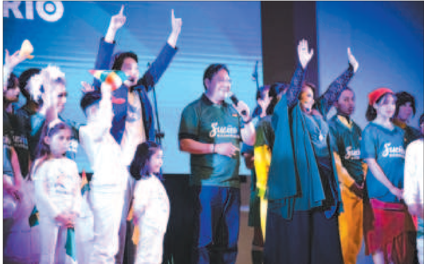
El presidente Luis Arce en el lanzamiento del Sueño Bicentenario, en el campo ferial Chuquiago Marka, en la zona Sur de La Paz.

La iniciativa estará a cargo del Ministerio de Planificación del Desarrollo, institución que se ocupará de la ejecución, seguimiento, verificación de objetivos, metas, actividades