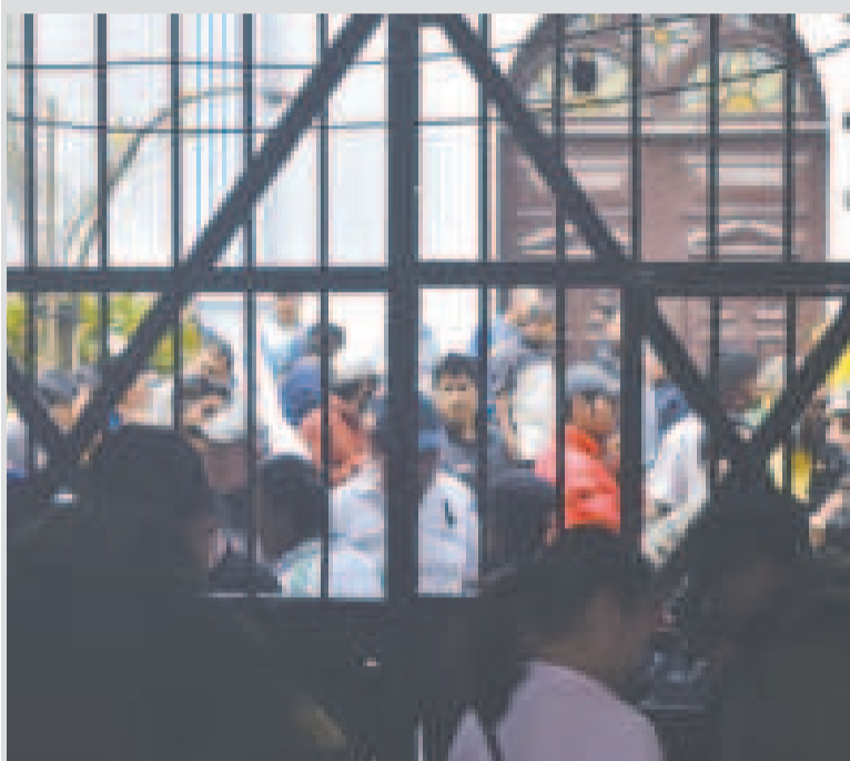
Puerta principal de acceso al penal de San Pedro, en el centro de la ciudad de La Paz.