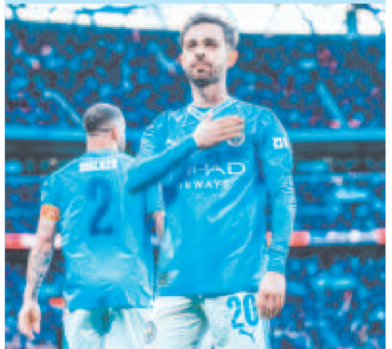
La celebración de Bernardo Silva, autor del gol de la victoria del Manchester City.

La final se jugará el 25 de mayo entre el Manchester City y el ganador de la otra llave de semifinales entre el Coventry City y el United.