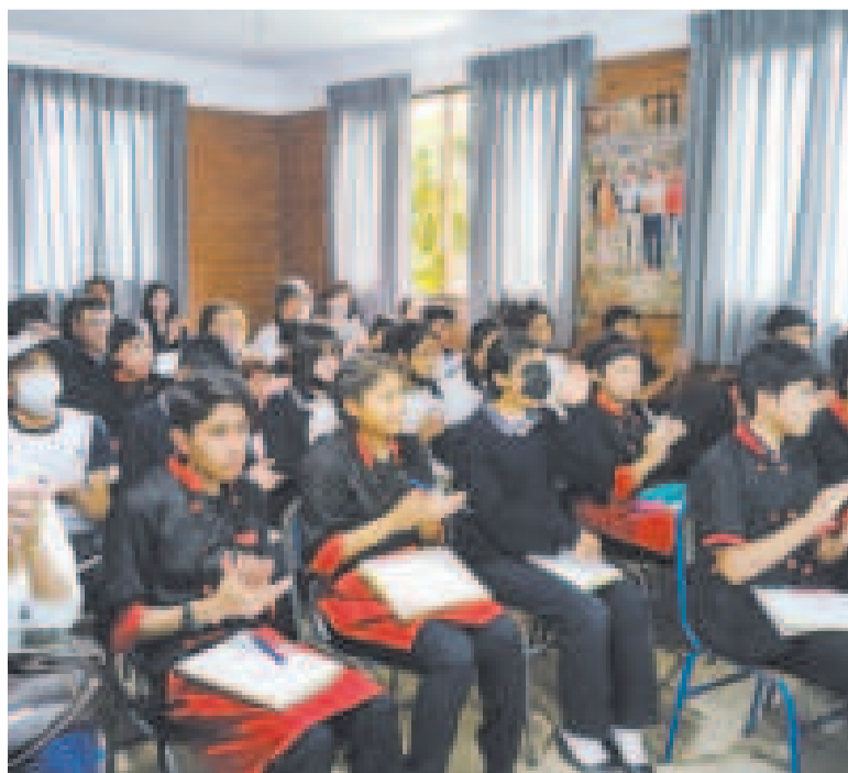
Los jóvenes cochabambinos que recibieron la capacitación.