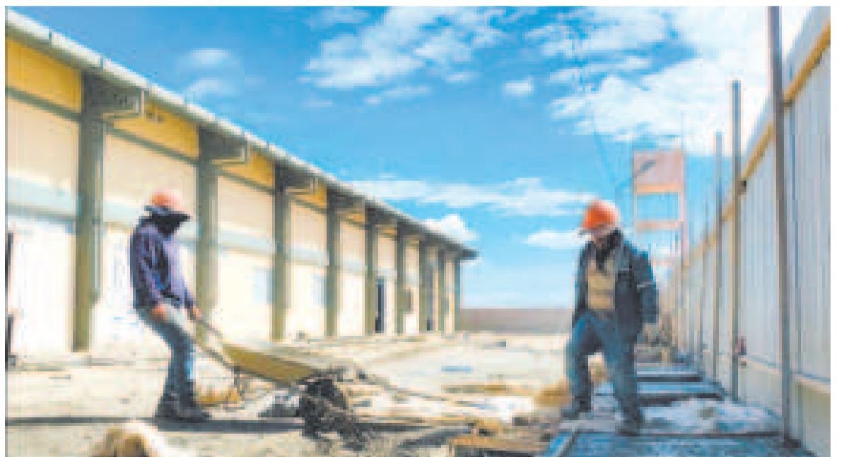
Los obreros aceleran el trabajo para concluir la construcción.

De acuerdo con datos del gobierno del presiden-