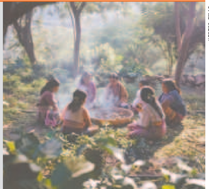
Las costumbres de los pueblos indígenas.

Además brindará apoyo a las organizaciones regionales Central Indígena de Pueblos Originarios de la Amazonia