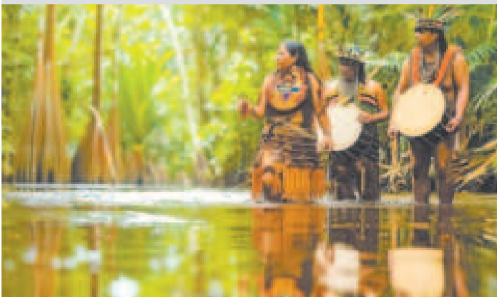
Pueblos indígenas de la Amazonia.

Se establecieron tres ámbitos de ejecución en el proyecto: formación para la gobernanza y la incidencia indígena, la comunicación y diálogo para el Vivir Bien, y el fortalecimiento del conocimiento de las comunidades indígenas, de la sociedad boliviana y de los medios de comunicación sobre los pueblos indígenas y sus derechos individuales y colectivos.