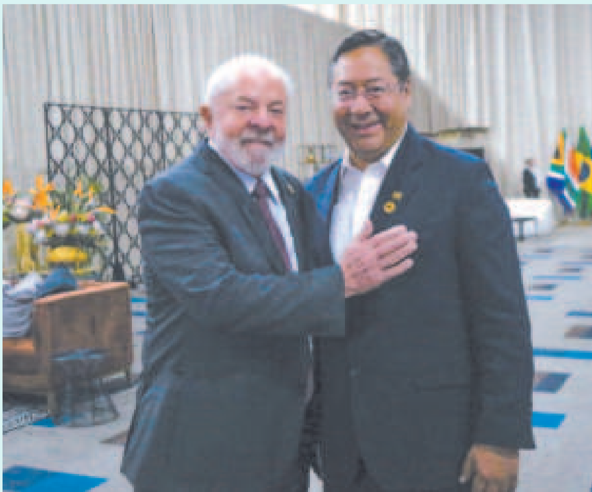
Los presidentes de Brasil, Lula da Silva, y de Bolivia, Luis Arce.

Ahora, otro aspecto es que en este nuevo contexto externo el Mercosur busca dar un giro adecuándose a los tiempos.