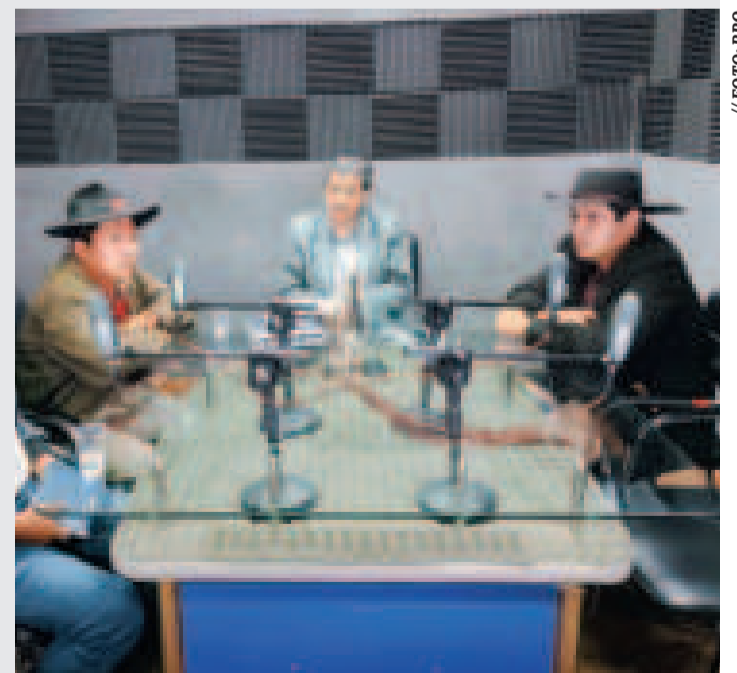
Dirigentes de la CSUTCB en 'Dialogando con el pueblo'.