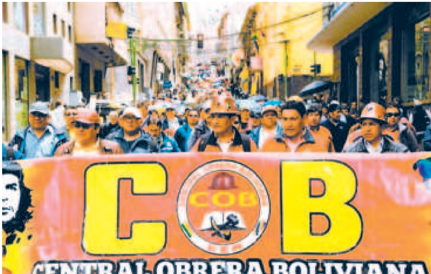
La COB en una marcha en La Paz.