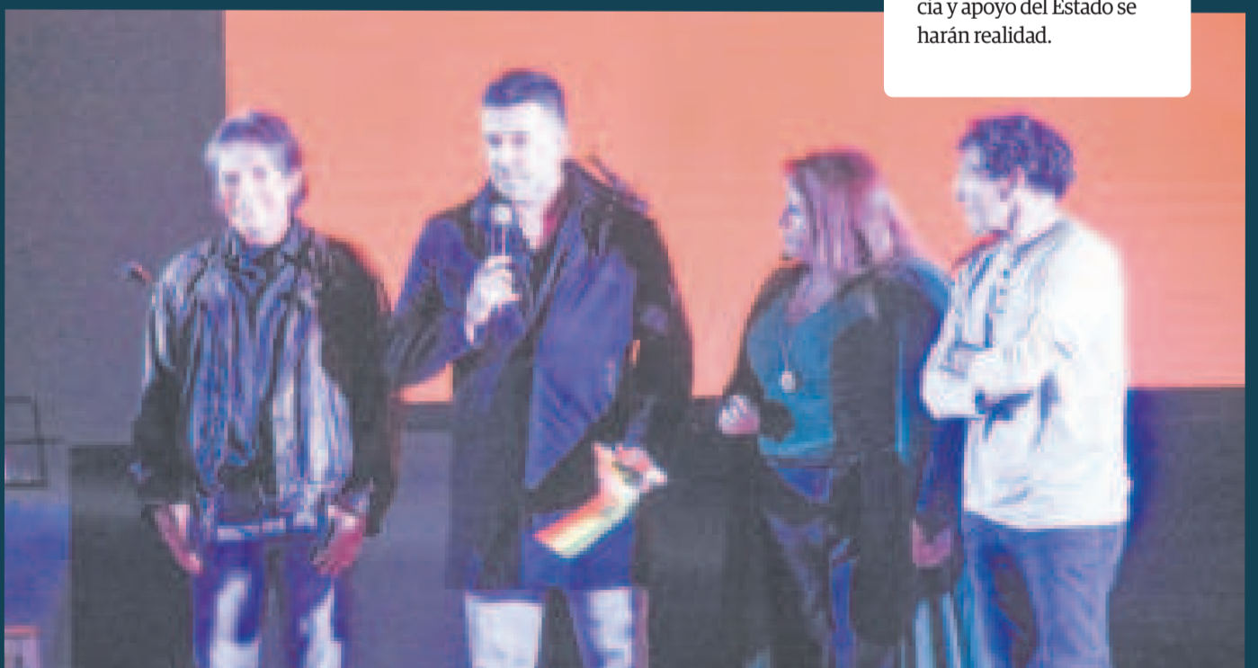
El apoyo de los exmundialistas al programa que beneficiará a los deportistas nacionales.

El Sueño Bicentenario tiene que ser de todos, y todos deben aportar, contribuir para que se hagan realidad, solo con disciplina, perseverancia y apoyo del Estado se harán realidad.