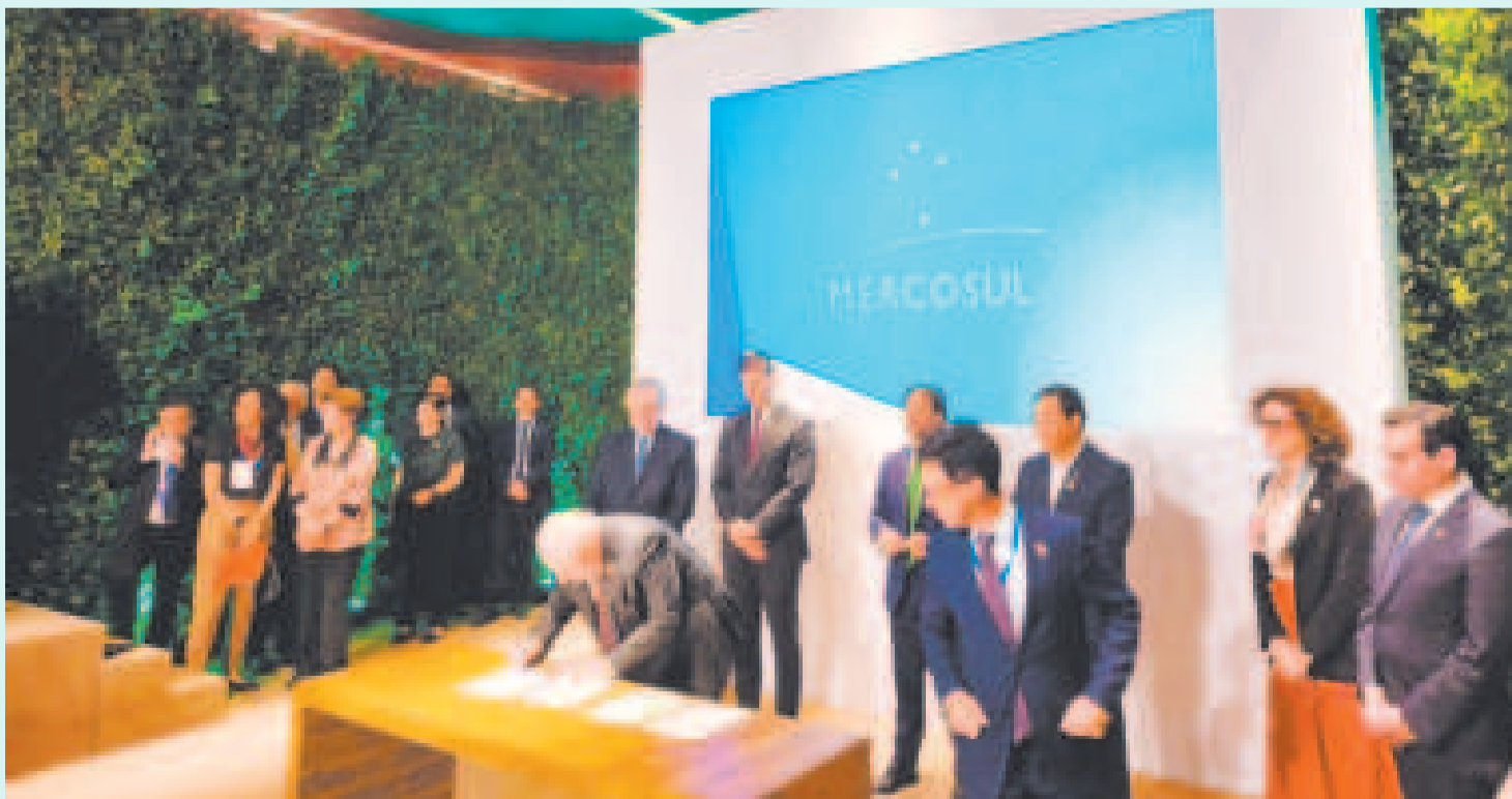
Firma del protocolo de adhesión de Bolivia al Mercosur por el Primer Mandatario de Brasil en la Cumbre de Presidentes.

También dice que se aprobará con el 35% de los representantes de la Asamblea Legislativa. El 35% es un tercio y más entre senadores y diputados. Esto podría ser muy fácil, porque no creo que nadie se niegue a aprobar el ingreso al Mercosur.