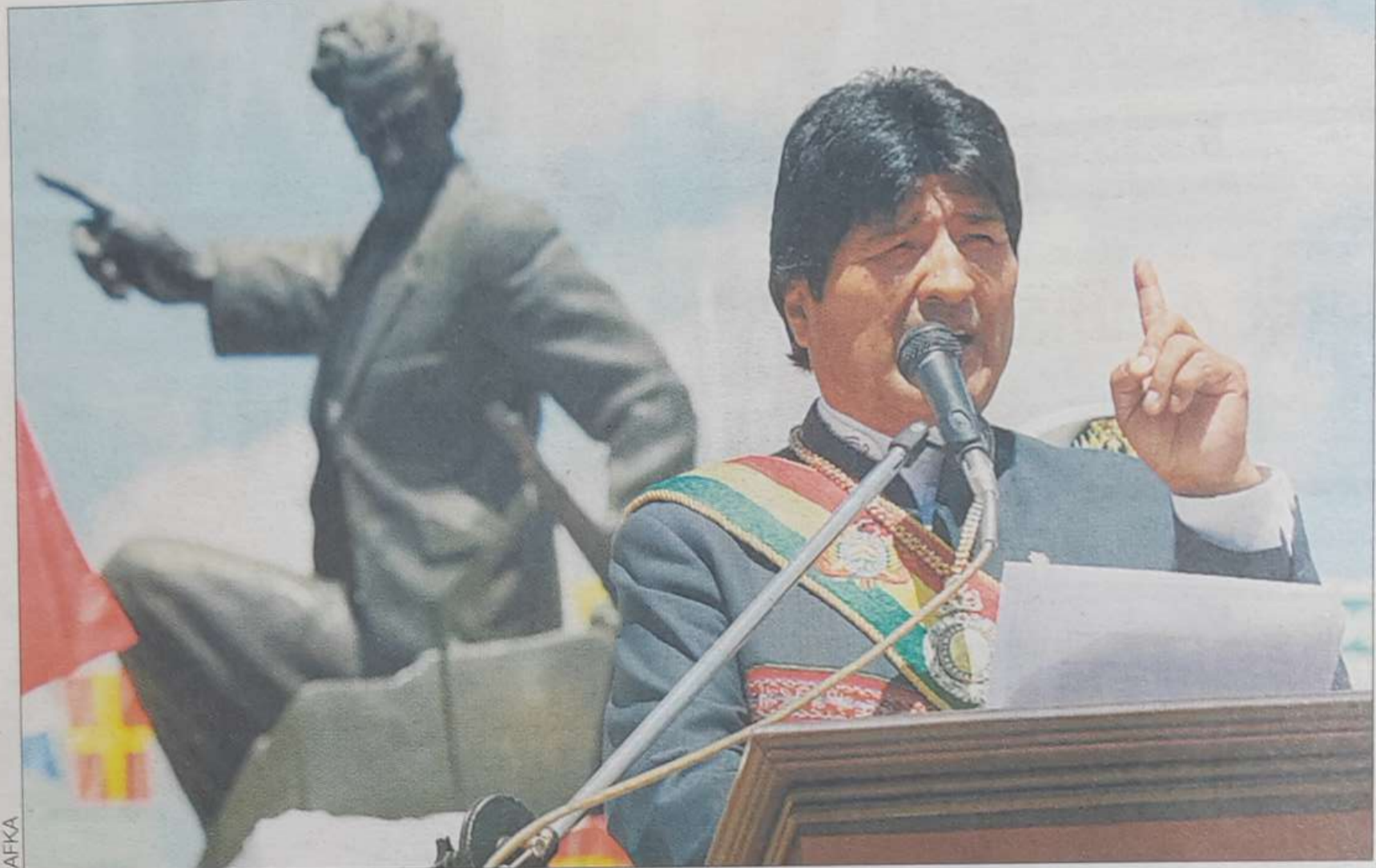
CAUSA. El presidente Evo Morales en su discurso en plaza Abaroa en el acto de homenaje al Día del Mar.