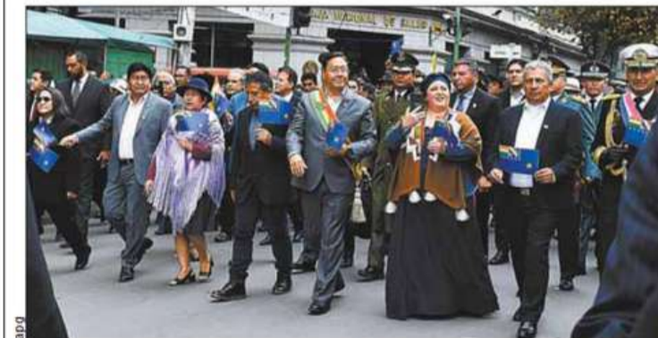
PRESENCIA. El presidente Luis Arce encabezó el traslado de restos de Abaroa.