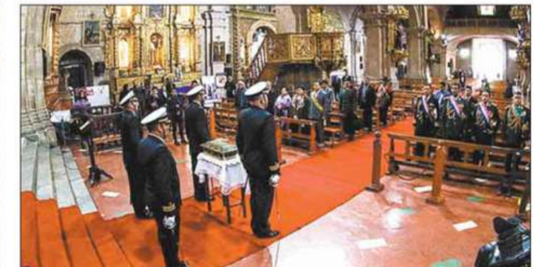
CEREMONIA. Los actos de traslado empezaron en la iglesia de San Francisco.

Sociedad. El centro de La Paz es escenario de los actos protocolares