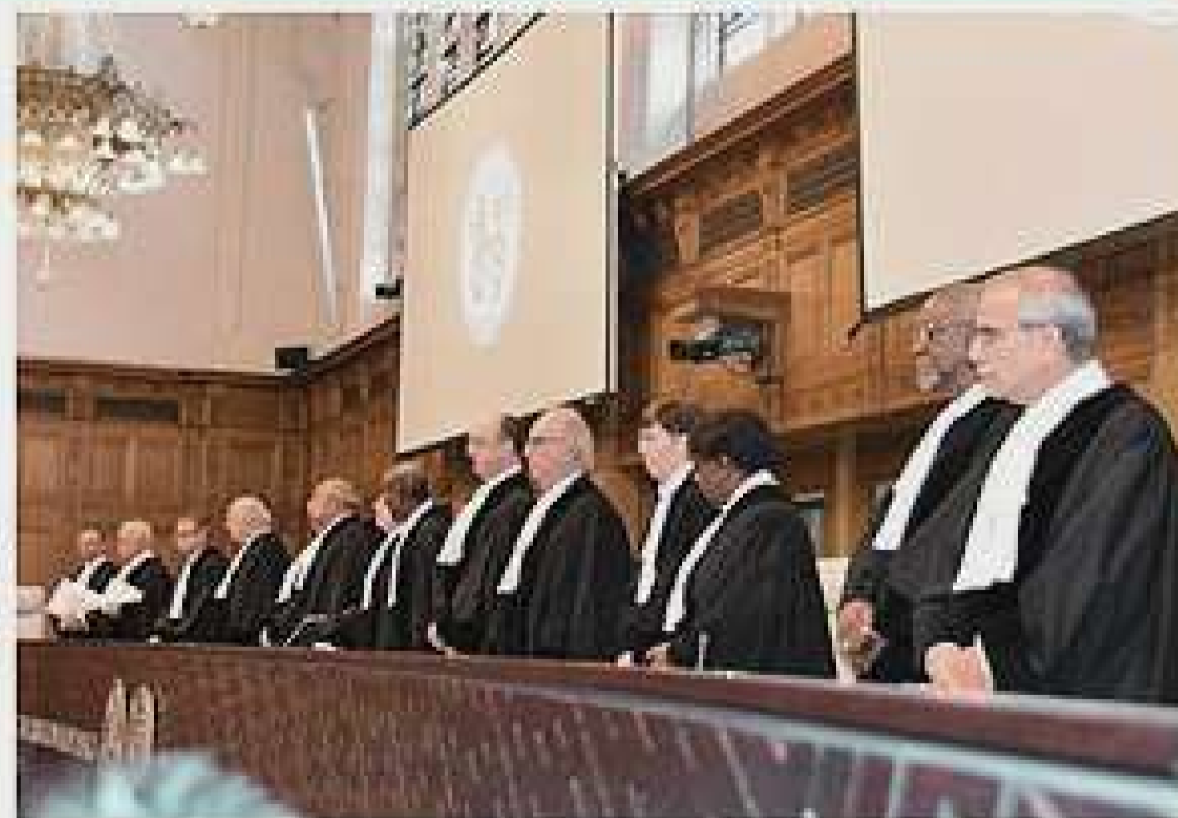
Los jueces de la Corte Internacional de Justicia (CIJ) en la instalación de la sesión por el fallo de la demanda marítima.

+ Bolivia amanece esperanzada en que la CIJ abrirá la puerta para el retorno al mar