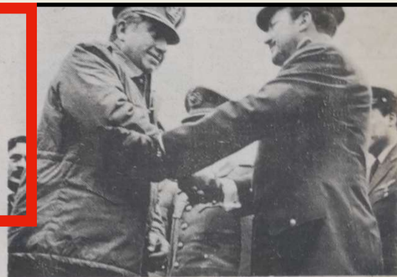
“El presidente chileno se saluda con el Gral. Oscar Adriázoza.”

Según despachos procedentes de Arica, el general Pinochet declaró en Arica, después de su entrevista con Banzer, que su país está interesado en los aspectos económicos, como ser la provisión boliviana de petróleo y productos alimenticios, así como en la colocación, en el mercado nacional, de la producción industrial de su país.