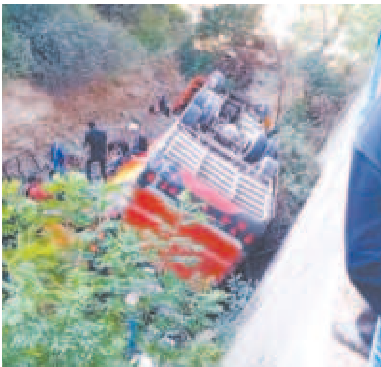
El ómnibus interdepartamental accidentado tiene el SOAT 2024.