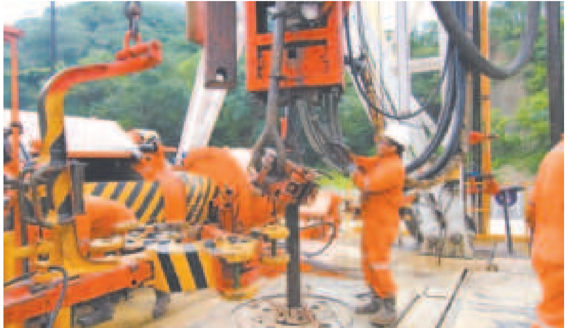
Los trabajos preparatorios de la estatal petrolera en el pozo Bermejo-X46D.

En febrero de este año recibió del Instituto Boliviano de Normalización y Calidad (Ibnormca) la certificación del Sistema Integrado de Gestión. Cumplió los requisitos de las normas ISO 9001:2015 Sistema de Gestión de la Calidad; requisitos ISO 14001:2015 Sistemas de Gestión Ambiental; requisitos con orientación para su uso e ISO 45001:2018 Sistema de Gestión de la Seguridad y Salud en el Trabajo.