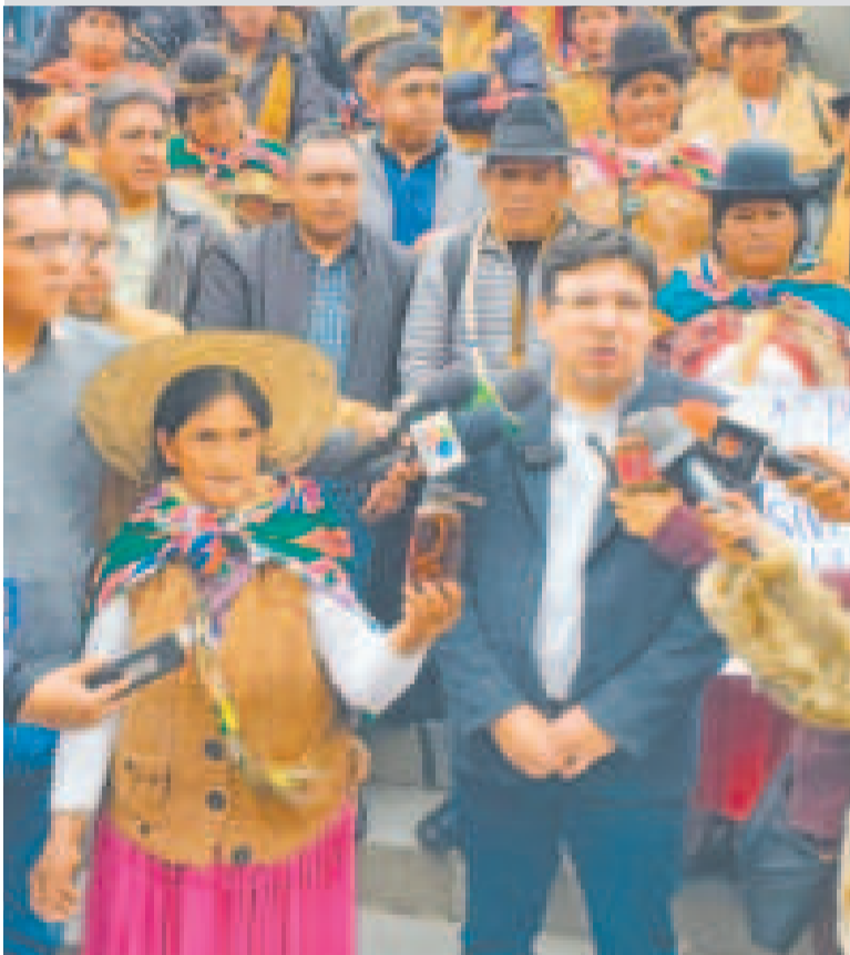
El ministro de Hidrocarburos, Franklin Molina (der.), y representantes de comunidades rurales.