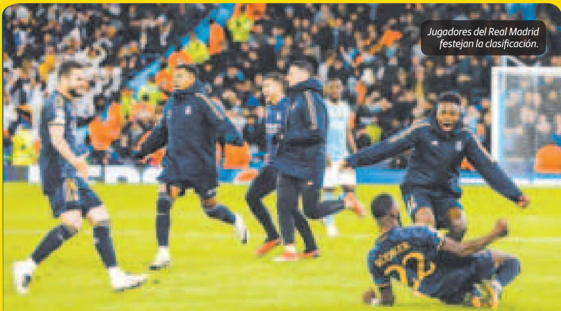
Jugadores del Real Madrid festejan la clasificación.