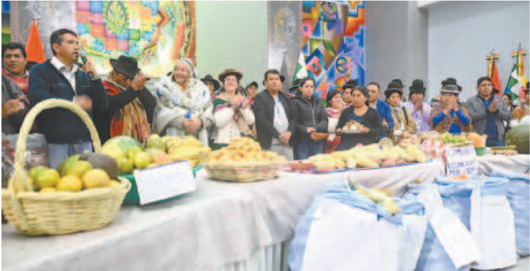
El presidente Luis Arce con agricultores de las provincias Inquisivi de La Paz y Ayopaya de Cochabamba.