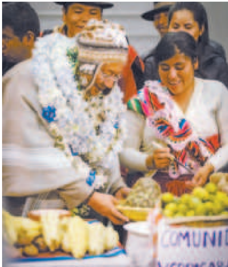
El mandatario observa productos de la frontera interdepartamental.

Según datos del Ministerio de Obras Públicas, la colosal obra tendrá una longitud de dos kilómetros, un ancho de 14 metros y aceras peatonales, tanto en el carril de subida como en el de bajada.