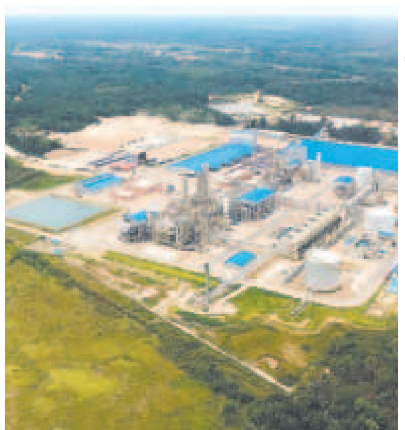
La Planta de Amoniaco y Urea, ubicada en Bullo Bullo, Cochabamba.

La información la dio a conocer ayer Yacimientos Petrolíferos Fiscales Bolivianos (YPFB) en un comunicado, en el que rechaza versiones erróneas de