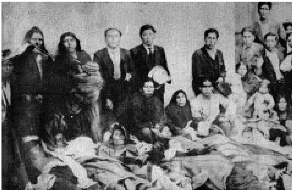
La masacre de Todos Santos perpetrada por el gobierno de facto de Natusch Busch.