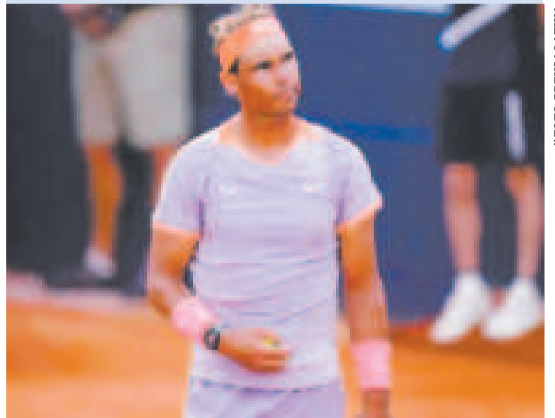
El tenista español Rafael Nadal luego de quedar eliminado del Open de Barcelona.

Finalista en el Roland Garros de 2022 y ganador de 10 torneos ATP en su carrera, 'Casper Ladiyud' arrasó a su contrario con parciales de 6-3 y 6-4 para pasar a la siguiente fase.