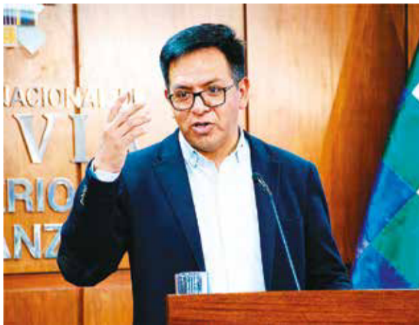
El viceministro Jhonny Morales ante la prensa.

Morales señaló que la devolución de los impuestos, que oscila entre un 13 a un 15 por ciento del valor de exportación, se realizará una vez se certifique que los dólares de los exportadores ingresaron al país.