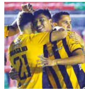
Festejo de jugadores de The Strongest, anoche.