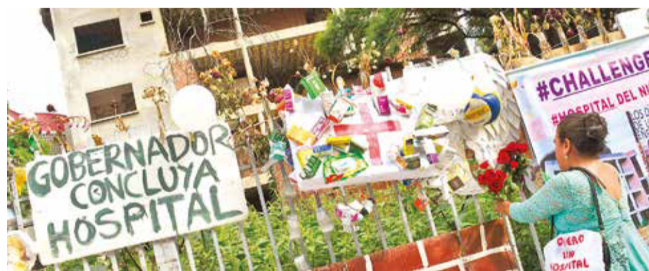
La limpieza que se realizó en el edificio abandonado del hospital del niño. DANIEL JAMES

Anunció que el siguiente mes nuevamente se comenzará con los trabajos de recarpetado en la avenida Simón López y otras avenidas en la zona sur.