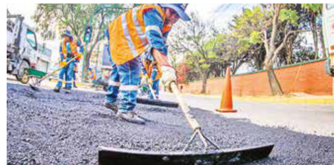
Trabajos de bacheo en la av. Ingavi, en el oeste.

Atención. La Dirección de Obras Públicas habilitó una línea de WhatsApp para recibir las solicitudes de los vecinos de los barrios