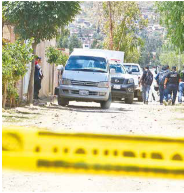
La Policía en la escena de la emboscada, 2021, El Alto. D.J.

El contrabando es un mal en crecimiento en Bolivia. Durante el año 2023, el personal de la Aduana Nacional