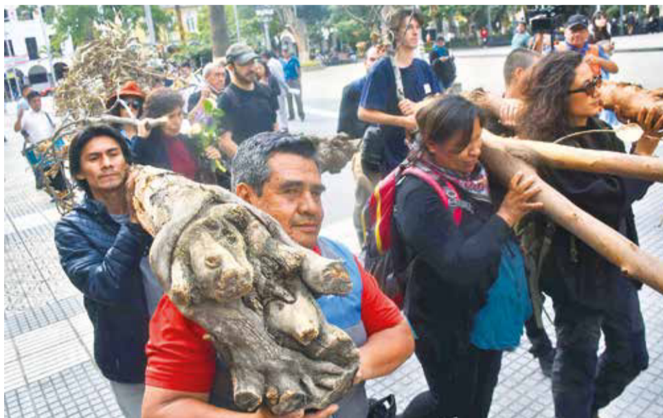
La marcha fúnebre que realizaron los ambientalistas en la plaza, ayer.

El director de Medio Ambiente de la Alcaldía, Elvis Gutiérrez, rechazó la denuncia y mencionó que el Ejecutivo municipal está