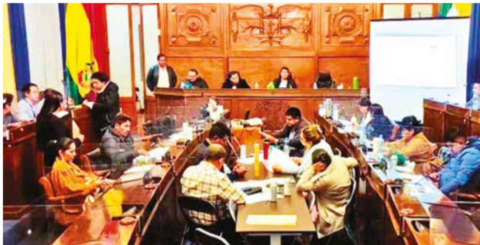
Este jueves, los miembros de la Comisión Mixta de Constitución evaluaron a los postulantes al TSJ y al TCP.