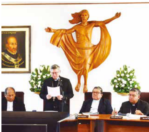
Obispos reunidos en la CXIV asamblea, ayer. HERNÁN ANDÍA

der la compasión y la sensibilidad en un contexto de crisis económica que está afectando a los más desprotegidos.