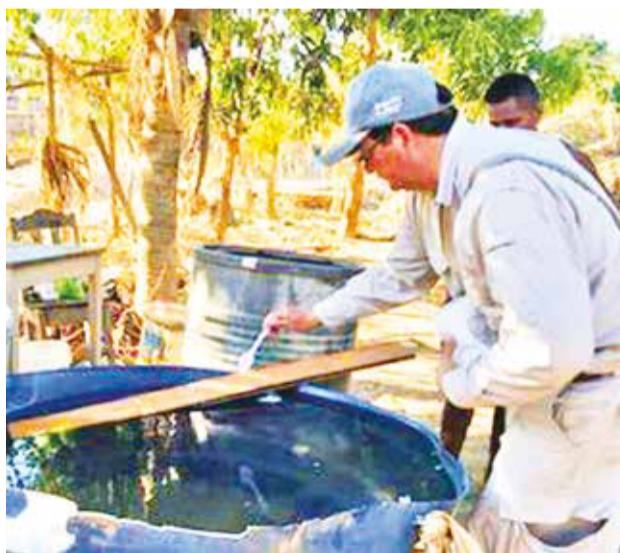
Inspección y purificación de aguas. UNITEL

En el caso de Pando, hay siete casos acumulados de oropuche en lo que va del año, de