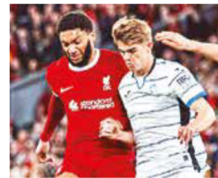
Duelo entre Liverpool y Atalanta, ayer.

Desastroso. No hay otra manera para definir el partido del Liverpool contra el Atalanta. El equipo italiano, aprovechando las tres ocasiones que tuvo, puso