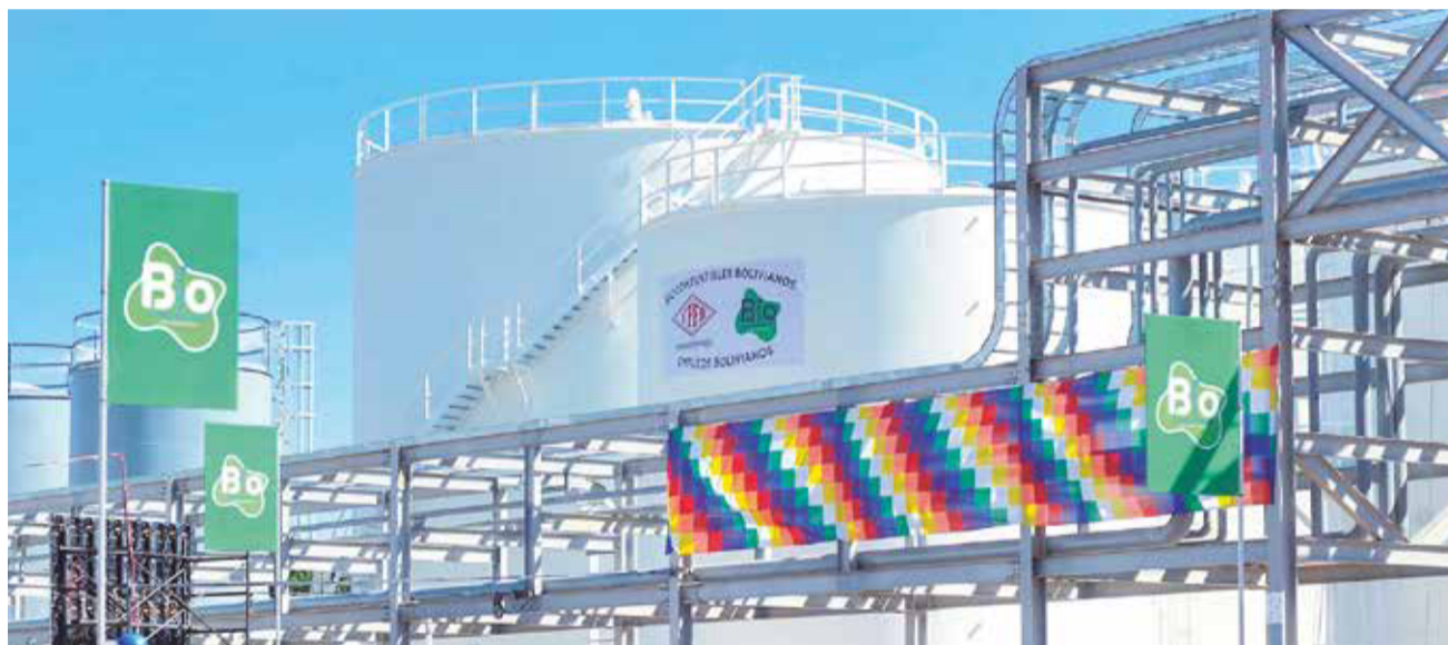
La planta de biodiésel, recién inaugurada, es una de las obras contempladas en el Plan de Desarrollo.

El indicador macroeconómico que posiblemente esté más cerca de ser alcanzado es el de la inflación, ya que en el plan se estimaba una inflación promedio de 4,7 por ciento en los cinco años. En los tres primeros años del Gobierno de Arce, la inflación se mantuvo