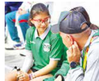
Jugadoras de Bolivia, en ráquetbol.

Con estos resultados, los bolivianos quedaron en mejores ubicaciones en la fase de eliminación, que arrancará hoy.