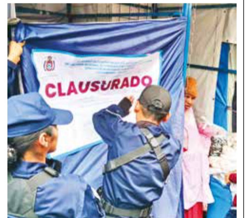
Clausuran un puesto sin patente durante el control “cero ambulantes”.