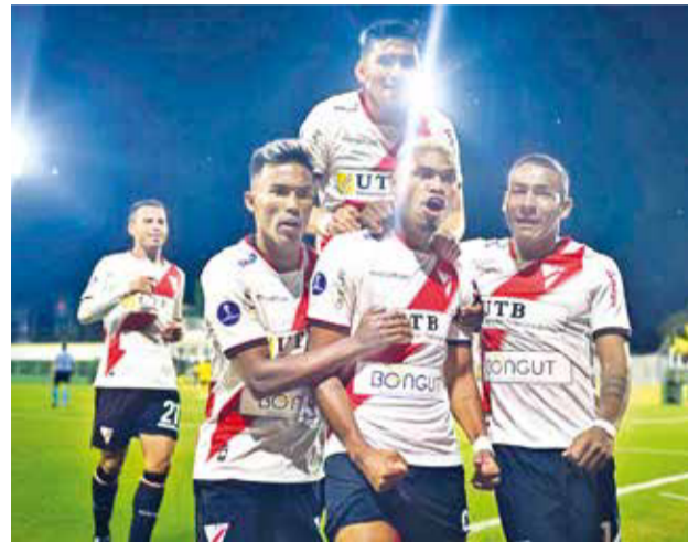
Celebración de los jugadores de Always Ready, anoche en Buenos Aires.

El Tricolor de Acero, actual subcampeón de la Copa Sudamericana, hizo vibrar a su afición gracias a los goles de