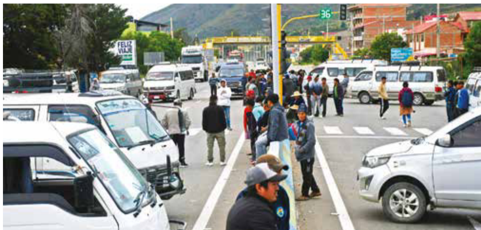
Uno de los puntos de bloqueo por la inseguridad que se instaló en Punata.

“Hay que ponderar sobre todo la voluntad de todas las instituciones participantes. Nosotros siempre tratamos