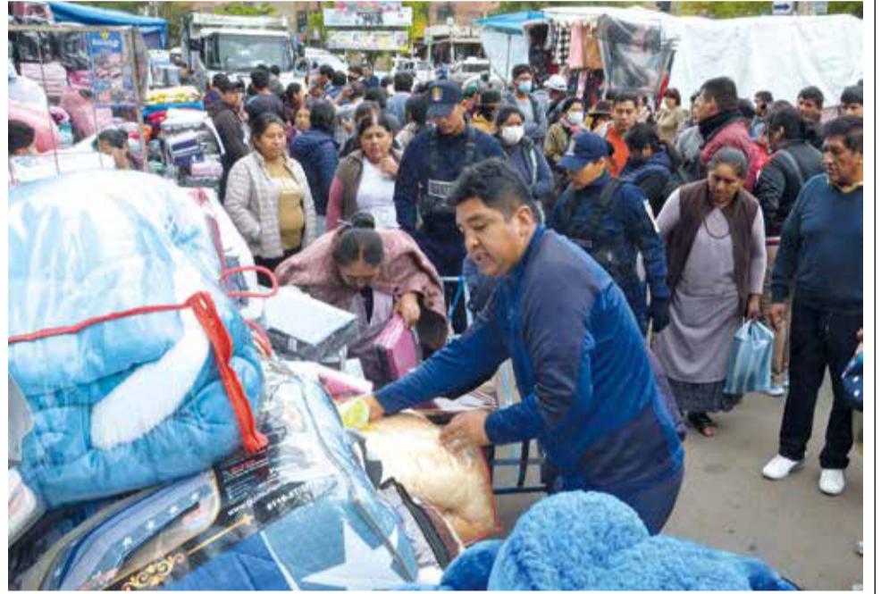
La Intendencia recorre un puesto con “desdoble” en la calle Esteban Arze.

MULTIMEDIA: Escanee este QR para ver el video del operativo. www.lostiempos.com