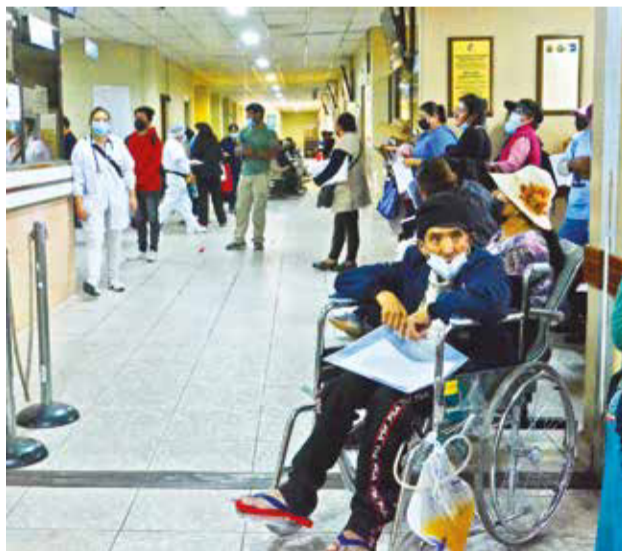
Enfermos esperan atención, el martes. HERNÁN ANDÍA

Mencionó la necesidad de una acción popular para frenar los paros del sector salud porque se atenta a la vida de