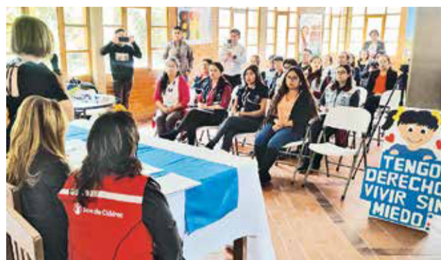
El centro para terapia de víctimas de violencia. DANIEL JAMES

“Tenemos índices alarmantes. Gran parte de nuestros niños están sufriendo agresión sexual dentro de