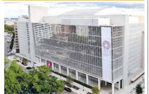
La sede del Banco Mundial en Washington.