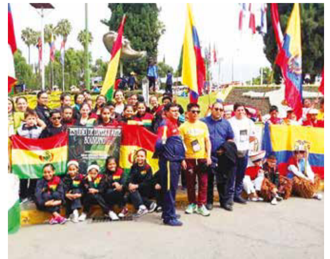
Grupo. Bailarines que participaron la temporada 2023.

Las sesiones, encuentros y residencias se realizarán en el Proyecto mARTadero (calle 27 de Agosto esquina Ollantay, Cochabamba, Bolivia).