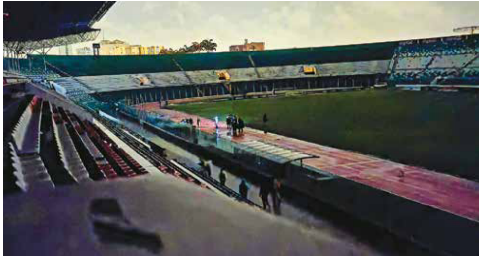
El estadio Ramón Aguilera Costas que recibirá la final única de la Sudamericana 2025. APG

“Ese evento va a demostrar la capacidad que tiene Santa Cruz, no sólo en el tema organizativo sino también de infraestructura. Agradezco a la Federación por la confianza al trabajo que tiene Santa Cruz para volver a ser un epicentro a nivel internacional”, dijo Dabdoub.