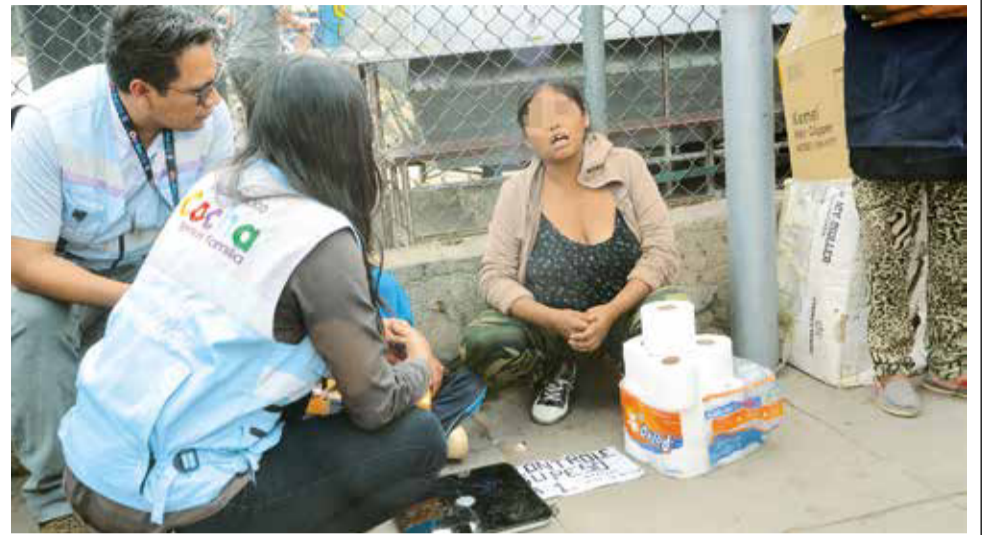
Instituciones hacen controles en Cochabamba, ayer. HERNAN ANDIA

“Hoy (ayer) se conoció el caso de un niño de nueve años que era obligado por sus progenitores a robar. Son situaciones penosas que queremos prevenir”, señaló Álvarez.