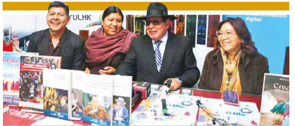
Presentación. Las autoridades de la Fundación Cultural Banco Central de Bolivia en conferencia de prensa, ayer.

“Así hacen todas”, estrenada en 1790, sólo un año antes de la muerte de Mozart, gira en torno a un hábito amoroso que data del siglo XIII, el intercambio de parejas. Las hermanas Fiordiligi y Dorabella quienes están comprometidas en matrimonio, como prueba de fidelidad son embaucadas por sus novios disfrazados, eventualmente ellas deciden divertirse con los extraños, cediendo a los nuevos pretendientes. Finalmente, los novios se presentan sin disfraz ante sus prometidas, revelando los engaños, las parejas se reencuentran.