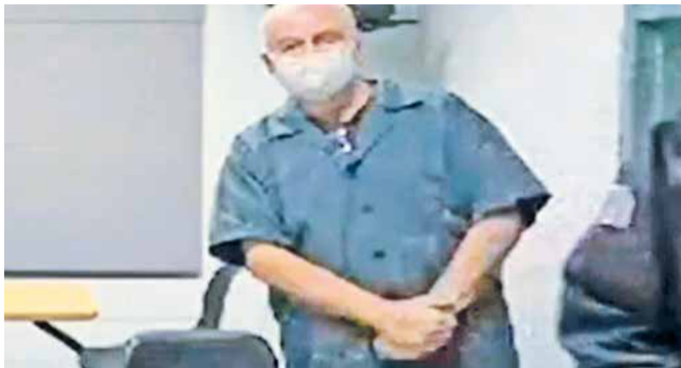
El exministro de Gobierno Arturo Murillo purga sentencia en EEUU.