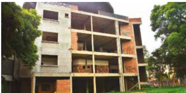
El edificio a medias del hospital del niño.

Comisiones. La Gobernación presentará un informe a fin de mes para determinar el futuro de la infraestructura abandonada