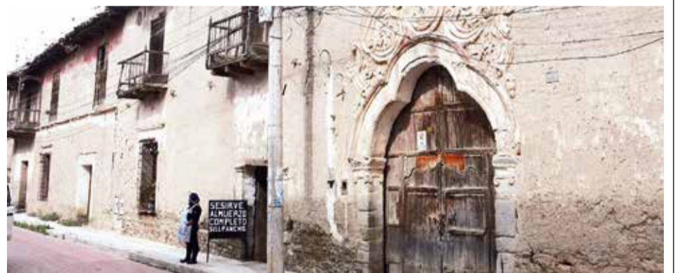
El cuartel de Melgarejo, una edificación patrimonial de Tarata. DANIEL JAMES

Asimismo, ratificó la decisión de demoler el helipuerto y, según los resultados del peritaje, proceder con la adaptación de espacios para consultorios. El pediátrico, que comparte ambientes con el materno, atiende a más de 50 mil niños en unas 30 especialidades, 3 mil internaciones y 300 admisiones en UTI durante el año.