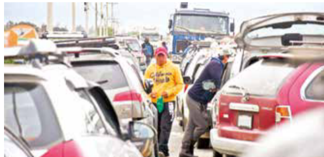
Vehículos usados en la protesta en Punata. DANIEL JAMES

Escanee este QR para ver el video del bloqueo. www.lostiempos.com