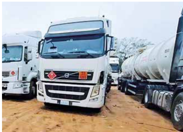
Cisternas aguardan su turno para cargar combustible.

Algunos medios de comunicación informaron sobre la muerte de cinco conductores de camión cisterna con matrícula boliviana en la localidad paraguaya de San Antonio, a 25 kilómetros de la ciudad de Asunción, uno de ellos fue identificado como César J., te-