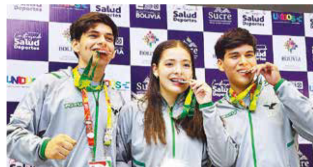
Los karatecas bolivianos posan con sus medallas.