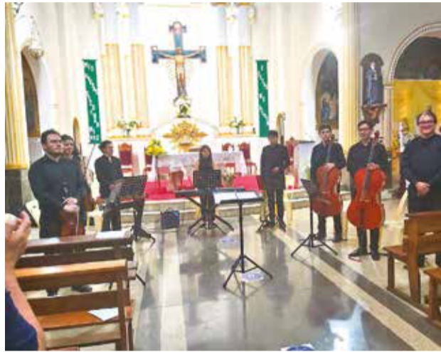
Presentación. Integrantes del Ensamble Khuska en una de sus últimas presentaciones.

Sobre las obras musicales, se representarán escenas de duetos de personajes como Cherubino y Suzanna, Marcellina y Suzanna, la Contessa y Suzzana de “Las bodas de