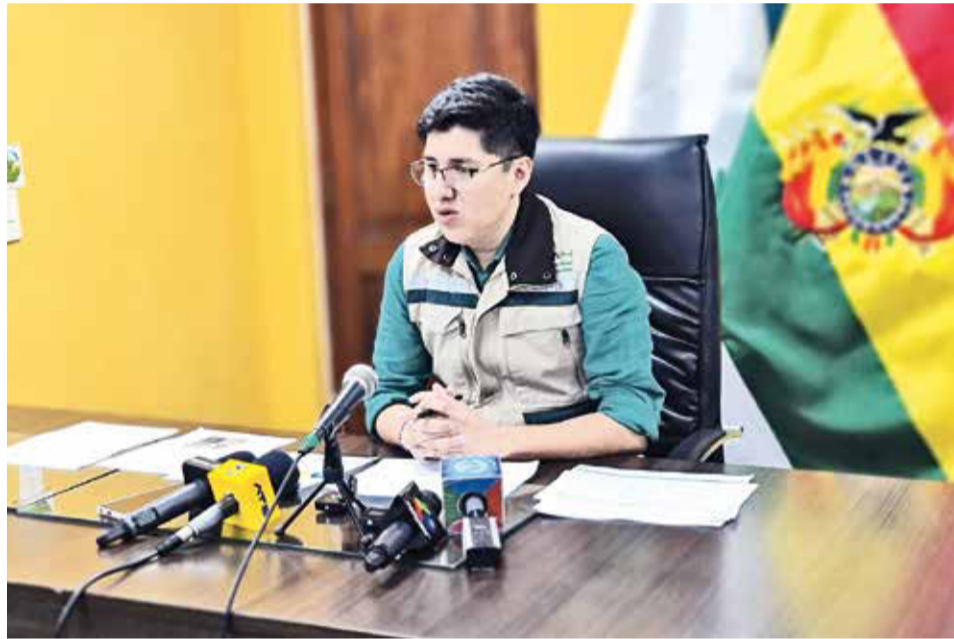
Germán Jiménez Terán, director ejecutivo de la ANH, en rueda de prensa. ANH

Explicó que cuando un camión cisterna ingresa al país con combustible importado se siguen dos procedimientos. El primero tiene que ver con la recepción del producto en la planta de almacenaje donde intervienen tres actores: el conductor del camión cisterna, el fiscal de planta y el operador de recepción, en este procedimiento se verifica el número y el buen estado de precinto, si existe o no ausencia de agua y la apariencia visual