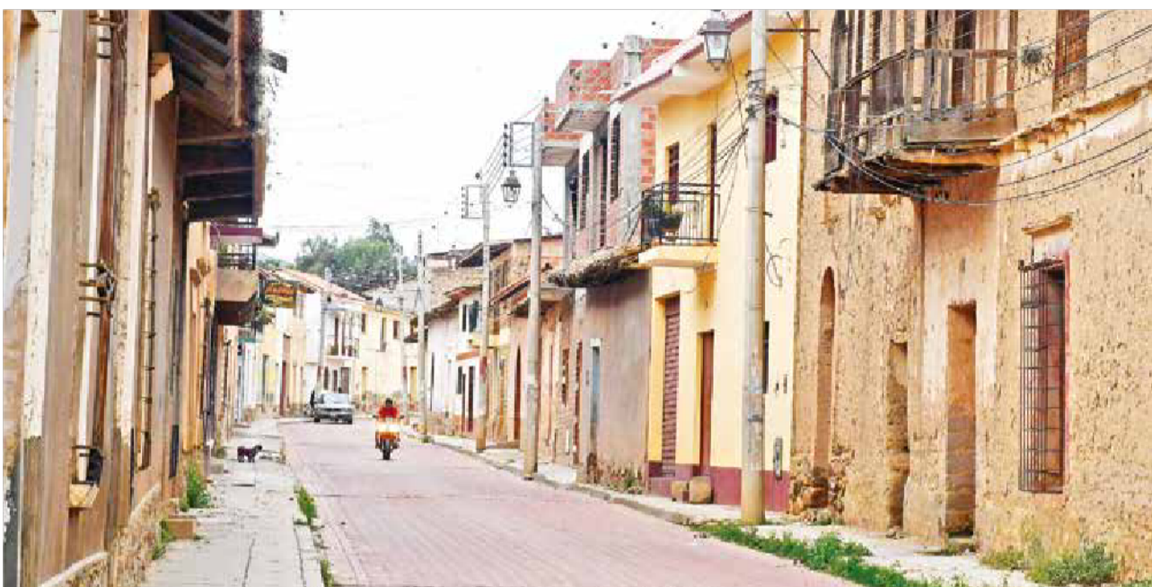
OTRA ÉPOCA. Una calle de Tarata que sobrevive a la modernidad. Sus vías con casas de arquitectura republicana son un atractivo para quienes quieren hacer turismo en el valle alto. Esta semana hubo polémica por la puesta en venta del cuartel de Melgarejo en esa población, un recinto que deberá ser preservado, así se consolide la transferencia.

ENVÍE SU FOTO PARA PUBLICARLA EN ESTA SECCIÓN: fotografia@lostiempos-bolivia.com