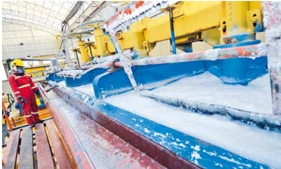
La planta industrial de carbonato de litio fue inaugurada en diciembre de 2023.

Al respecto, YLB indicó que “no existe afectación a los acuíferos”. La empresa informó que el uso sostenible de la cuenca San Gerónimo es de 216 litros de agua por segundo (l/s). Actualmente el uso es de 22 l/s y cuando las plantas del complejo industrial operen al 100 por ciento se requeriría 100 l/s, lo cual es menos del 50 por ciento del uso máximo.