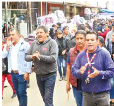
La marcha de comerciantes formales que acompañó el operativo.