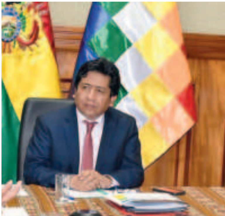
El viceministro de Relaciones Exteriores, Elmer Catarina.