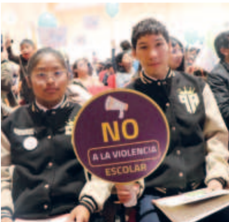
Estudiantes de La Paz durante el lanzamiento.