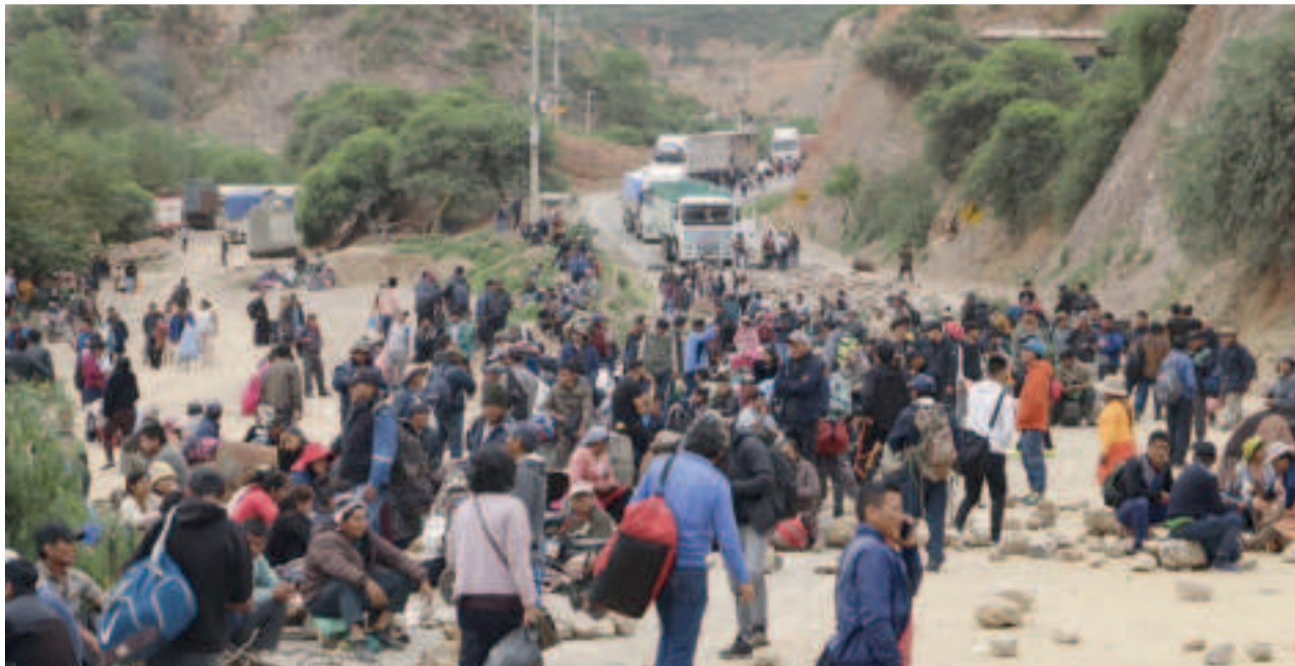
Bloqueo de carreteras por seguidores de Evo en febrero de este año.