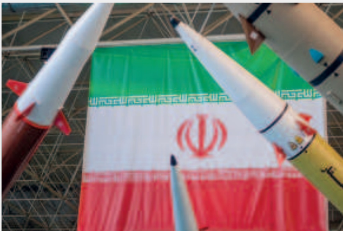
Misiles iraníes expuestos en el Parque Aeroespacial Nacional del Cuerpo de la Guardia Revolucionaria Islámica (CGRI), en Teherán.

El documento asegura que, "al recurrir al sistema multilateral, México reitera su firme compromiso con el derecho internacional y con los principios constitucionales, en especial con la solución pacífica de controversias".