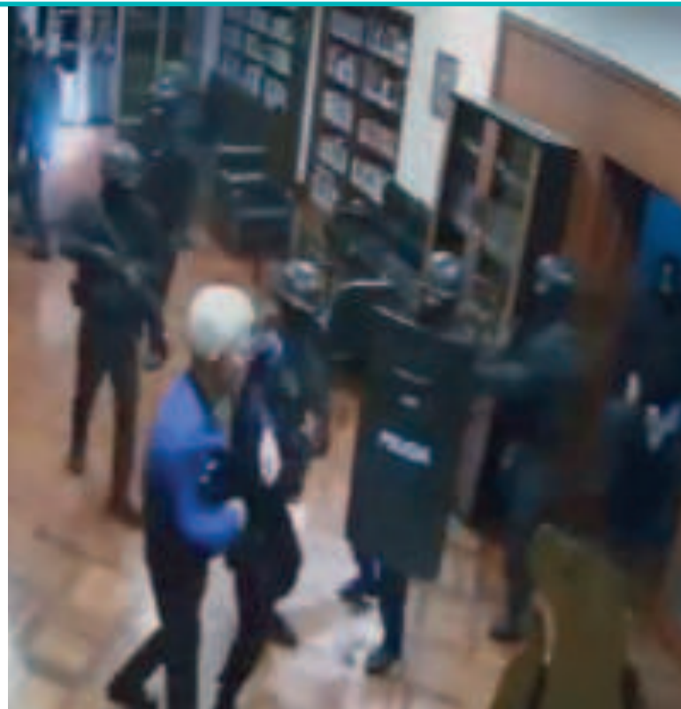
El viernes 5 de abril, la Policía de Ecuador entró por la fuerza a la embajada mexicana.