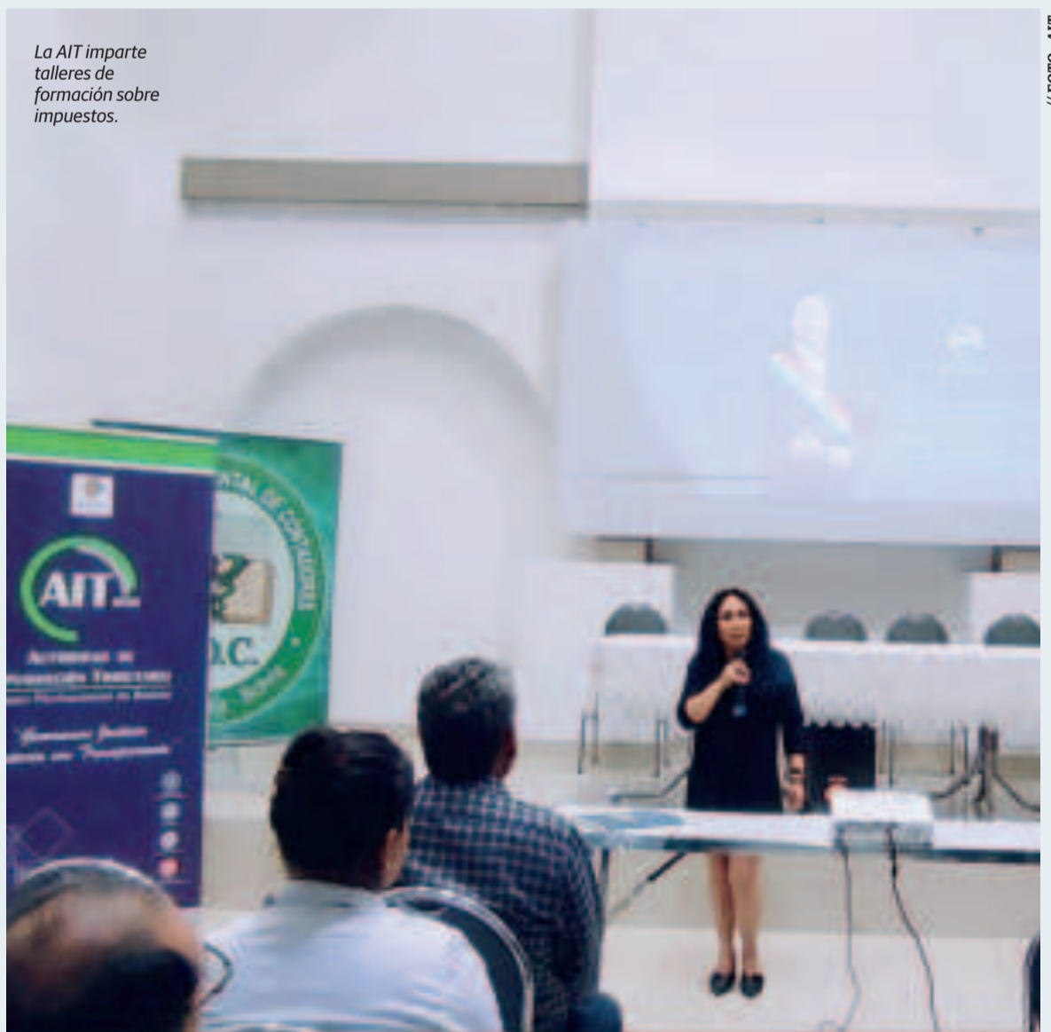
La AIT imparte talleres de formación sobre impuestos.

Queremos llegar a la gente para que nos conozca como institución, pero además que se informe acerca de todos los derechos tributarios y sus obligaciones también.