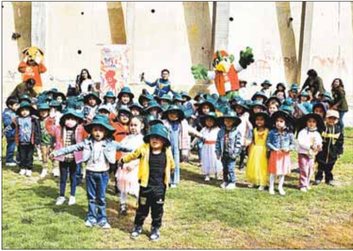
LA PAZ. Niñas y niños del Instituto de Educación Bancaria.