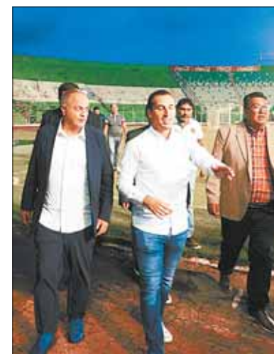
Costa visita el Tahuichi Aguilera.

La Conmebol dará dos millones de dólares para mejorar el Tahuichi.