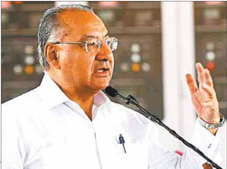
EXDIPLOMÁTICO. Foto de archivo del exembajador Manuel Rocha.