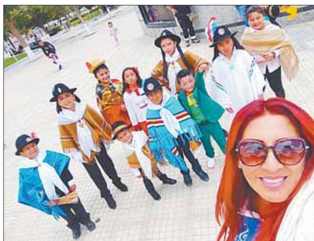
DANZA. Los niños en la grabación del videoclip.

Recientemente, Luzmila Carpio fue reconocida como ícono de la música folklórica por la revista Rolling Stone.