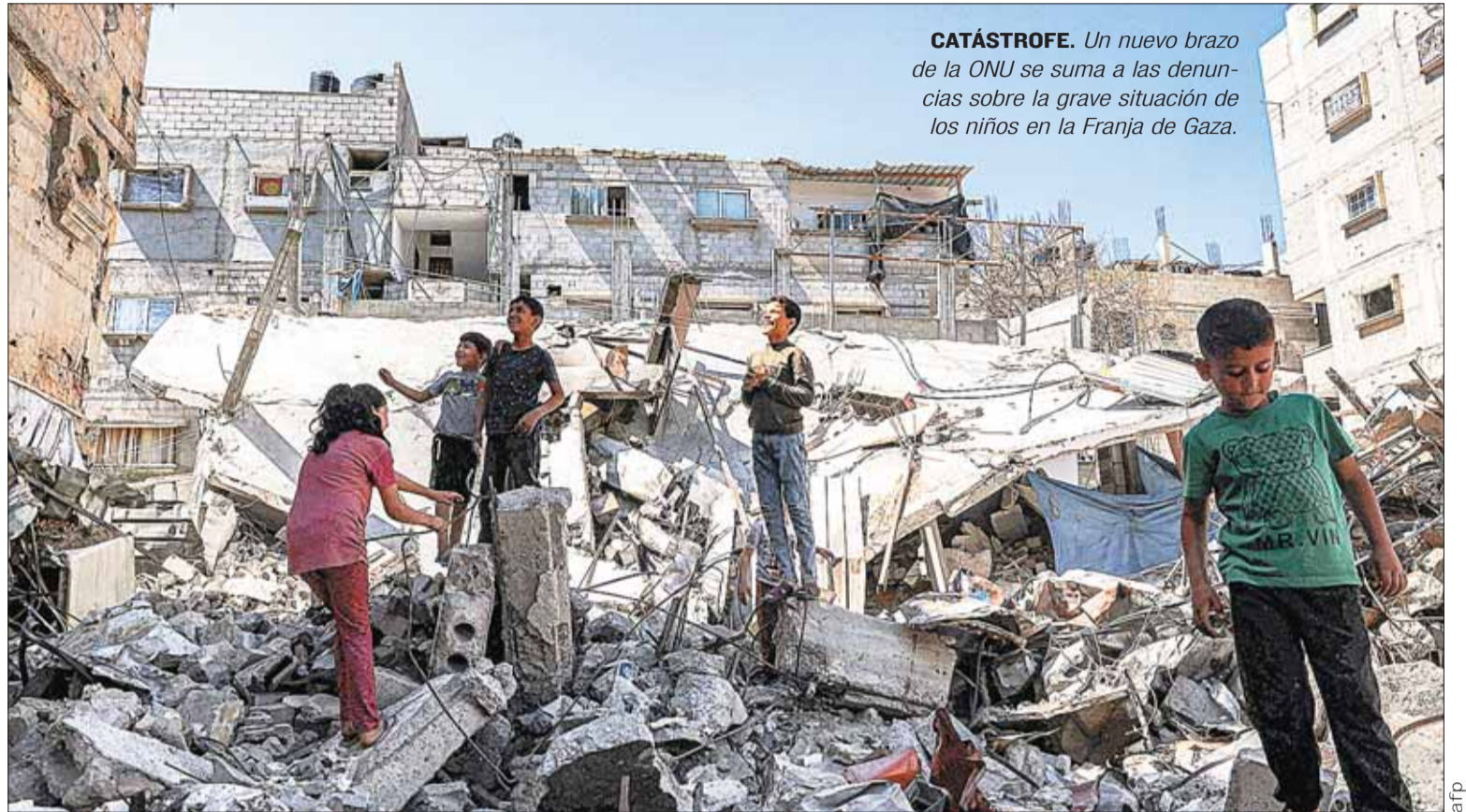
CATÁSTROFE. Un nuevo brazo de la ONU se suma a las denuncias sobre la grave situación de los niños en la Franja de Gaza.

"Creo que esto solo indica lo peligroso que sigue siendo Gaza, tanto para los trabajadores de ayuda humanitaria como para los civiles", añadió Ingram, que señala también que aparentemente dos