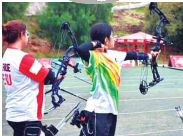
TIRO. Una de las deportistas dispara con tiro con arco.