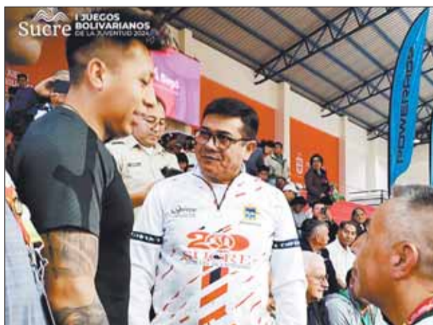
HOMOLOGACIÓN. Apertura del Conrado Moscoso.