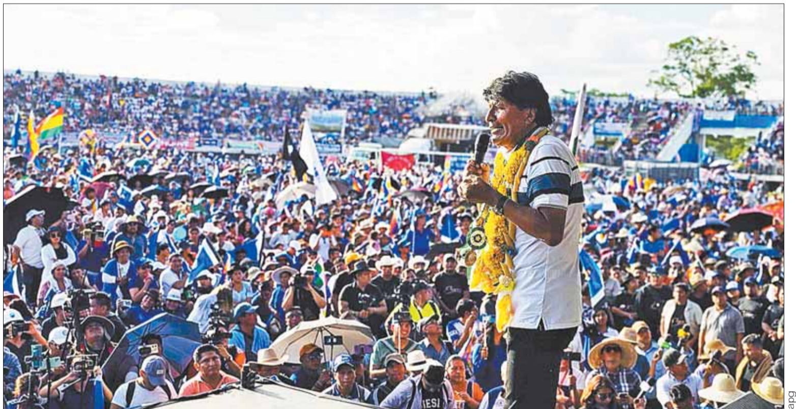
YAPACANÍ. Evo Morales Ayma fue proclamado nuevamente como candidato del MAS-IPSP a las elecciones generales de 2025.

Otro de los aspectos relevantes del informe, cuyos datos fueron recolectados entre el 15 de marzo al 7 de abril de este año, está vin-