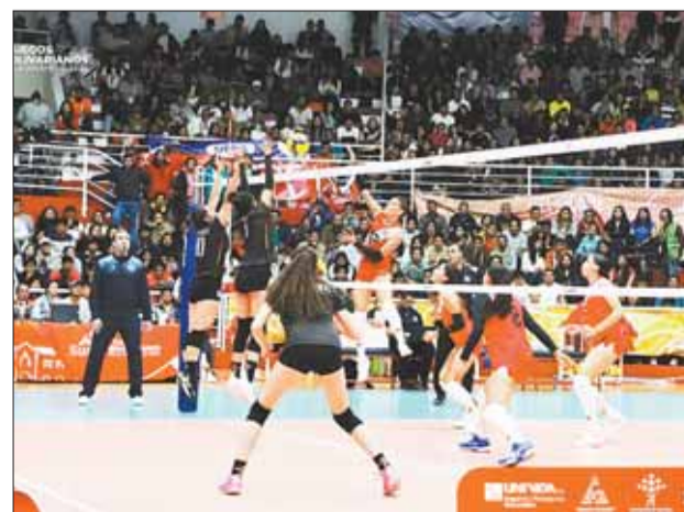
VOLEIBOL. La representación boliviana en Sucre.