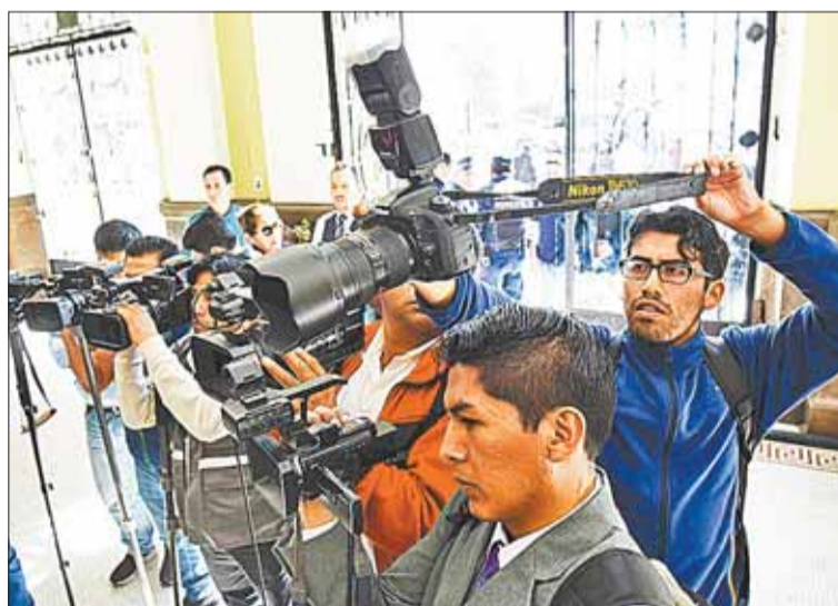
LA PAZ. Informe dice que medios informan en función de su agenda.

El documento, con datos obtenidos entre el 15 de marzo al 7 de abril de este año dedicó su quinta sección una serie de preguntas referidas a los medios.