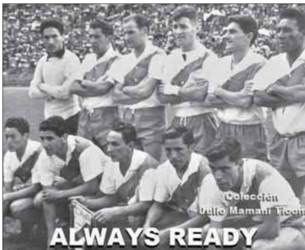
CAR BOLIVIA. Parte del plantel que fue a la gira de 1961.