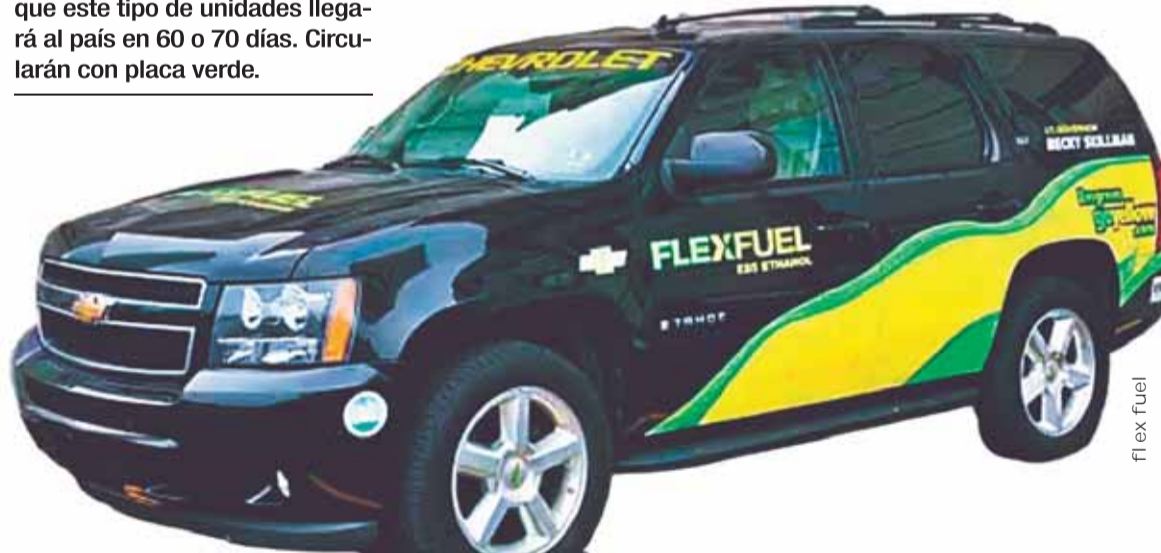
MUESTRA. Un motorizado que tiene la tecnología ‘flex fuel’.

El viceministro Morales señaló que Bolivia importa al mes unos 250.000 vehículos. Si se traen 10.000 flex fuel, el ahorro se traduce en casi Bs 10 millones y, si se deja de importar gasolina, en la venta interna significa un ahorro de Bs 100 millones; es decir, Bs 160 millones menos de gasto en la importación y la subvención.