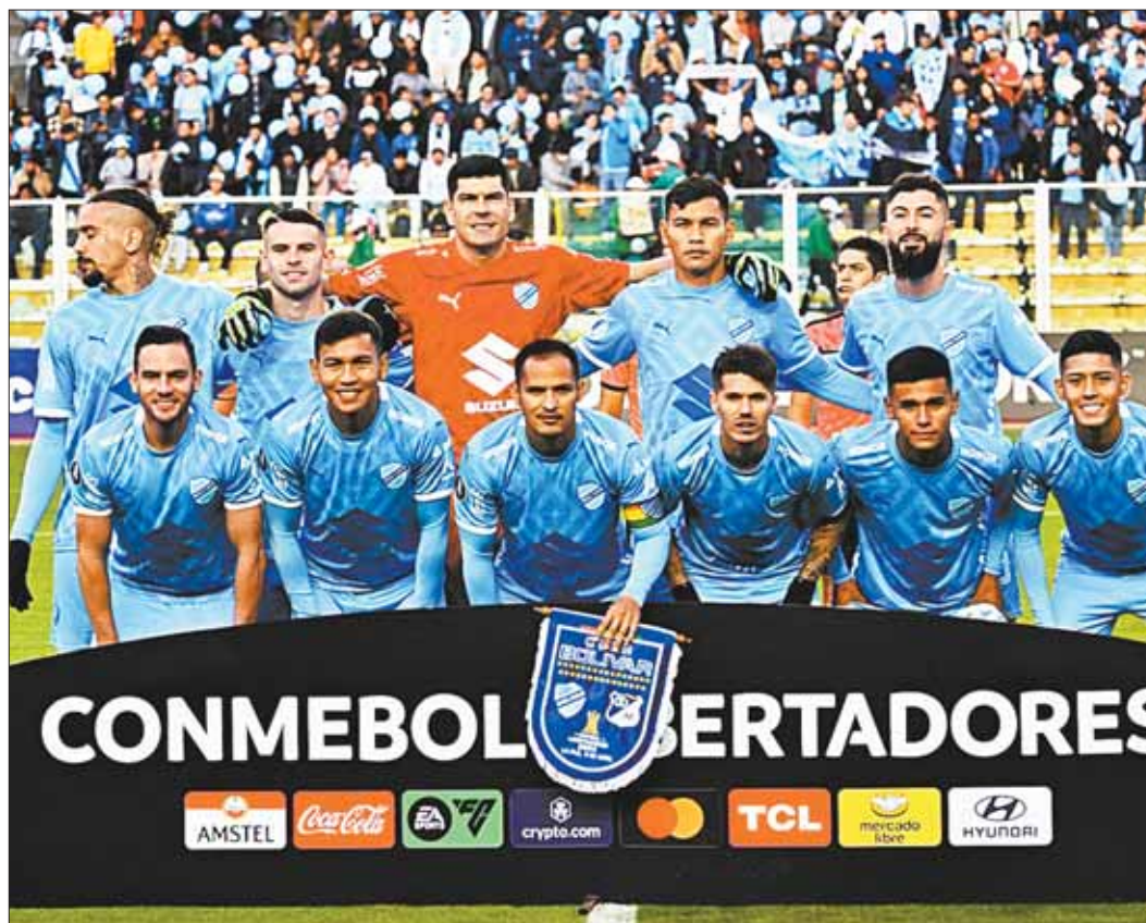
BOLIVIANO. El oncenio de Bolívar, que jugó el pasado jueves ante Millonarios en el Hernando Siles.