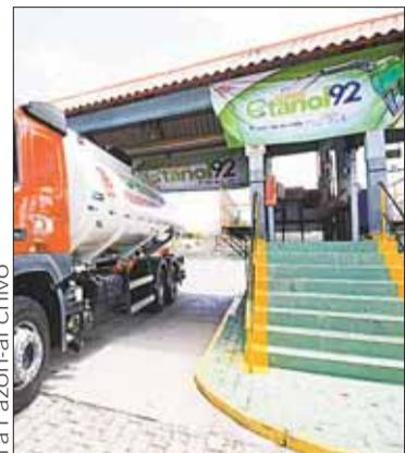
Venderán etanol para los Flex.

ECONOMÍA. El Gobierno instruyó a YPFB la ejecución en tres meses