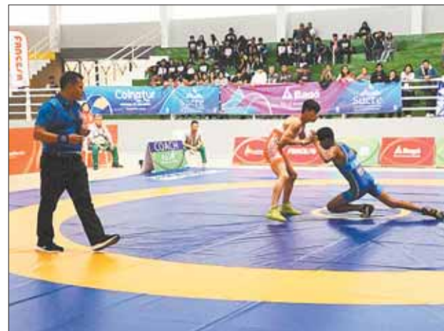
LUCHA. El combate de uno de los luchadores nacionales.