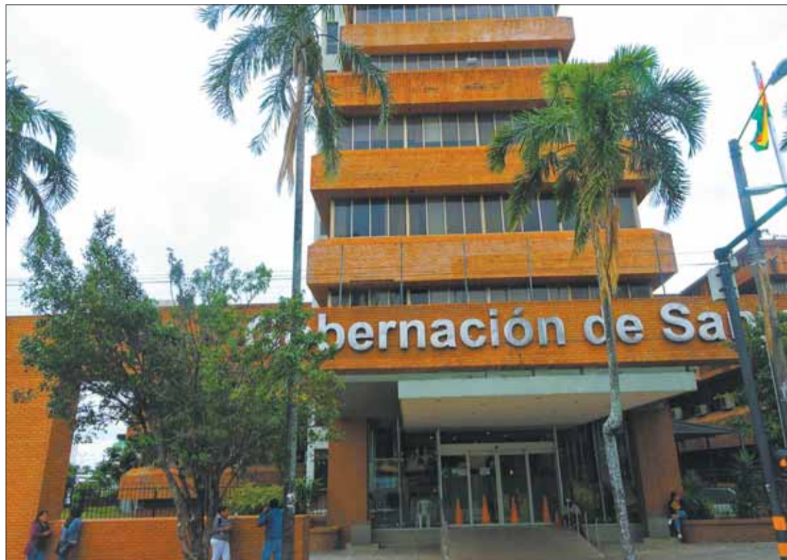
CRISIS. La Gobernación cruceña solo puede pagar Bs 0,33 por cada Bs 1 que tiene de deuda.

Aunque no quiso dar nombres, aseveró que el responsable de la crisis es el Ejecutivo de la