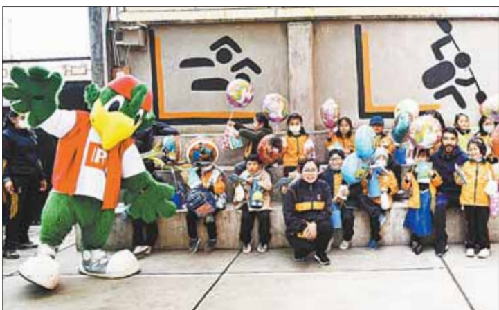
EL ALTO. Infantes de la Unidad Educativa Adolfo Kolping.

El 12 de abril de 1952 la OEA y UNICEF redactaron la Declaración de Principios Universales del Niño, para protegerlos de la desigualdad y el maltrato. En esta oportunidad se acordó que cada país debería fijar una fecha para festejar a sus niños. En Bolivia, en 1955, se fijó esa fecha para el 12 de abril de cada año.