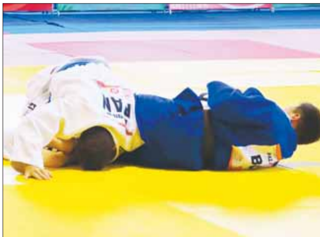
JUDO. La pelea de uno de los judocas bolivianos.