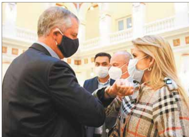
MEMORIA. Ministro Branko Marinkovic y Jeanine Añez, en 2020.

biendas de que la sentencia del TCP de 2019 reivindica la Constitución respecto del límite de 5.000 hectáreas. Además, los predios que se atribuyen los Marinkovic se encuentran en una reserva, los expedientes corresponden a áreas fuera del predio y la laguna es de acceso ancestral de los guarayos.