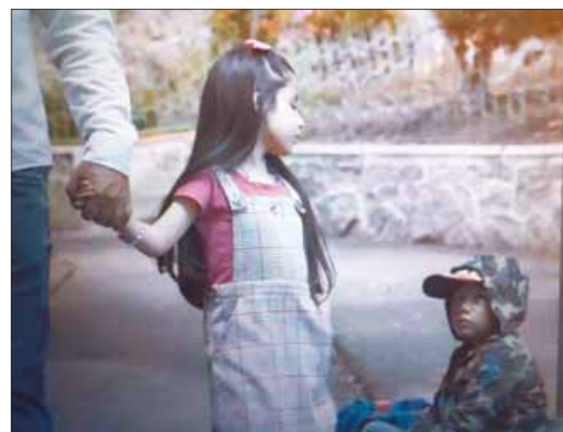
VIDEOCLIP. En el rodaje del material audiovisual.