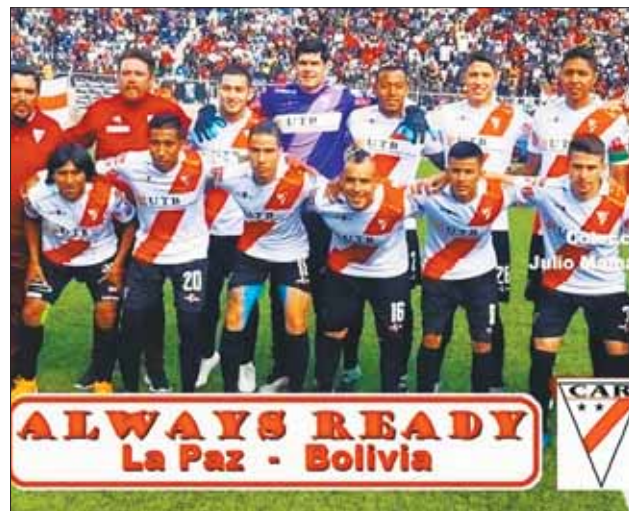
CAMPEÓN. El crédito de El Alto ganó la corona el 2020.