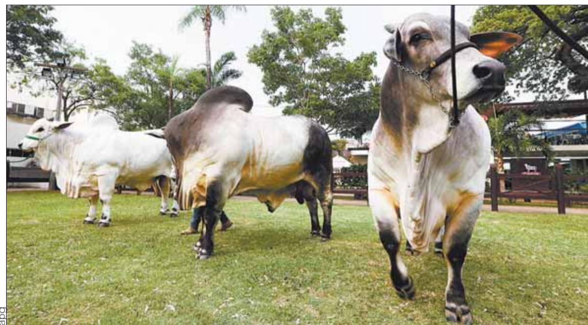
SANTA CRUZ. La genética de las razas cebuinas en Bolivia es apreciada en varios países del mundo.

Empresarios saludaron la norma y destacaron que además de cuidar el medio ambiente, se abre un abanico de oportunidades para la innovación y el desarrollo.