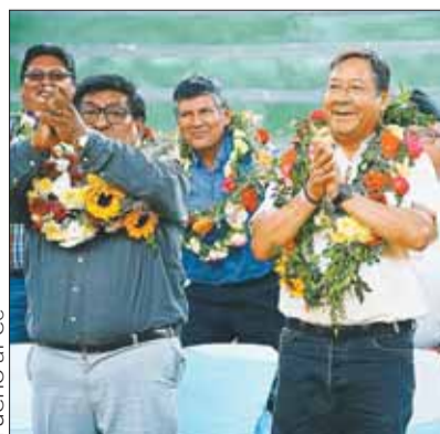
La entrega de la nueva norma.

El presidente Luis Arce entregó el Decreto 5146 a la dirigencia de choferes