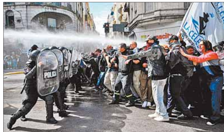
MARCHAS. Trabajadores volverán a las calles la siguiente semana.

Milei, un economista ultraliberal, gestiona una ambiciosa desregulación de la economía con el fin de reducir al mínimo el rol del Estado, controlar la inflación y alcanzar el "déficit cero" para fin de año. Pero, según expertos, la desaceleración del ritmo de aumento de los precios no debe ser leída como una mejoría para los argentinos; puesto que está vinculada a la caída del consumo.