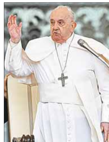
El papa Francisco.

Durante su ataque contra Israel, los milicianos de Hamás también secuestraron a unos 250 rehenes. Aún quedan 129 rehenes cautivos, incluidos 34 que se cree han muerto, según las autoridades israelíes.