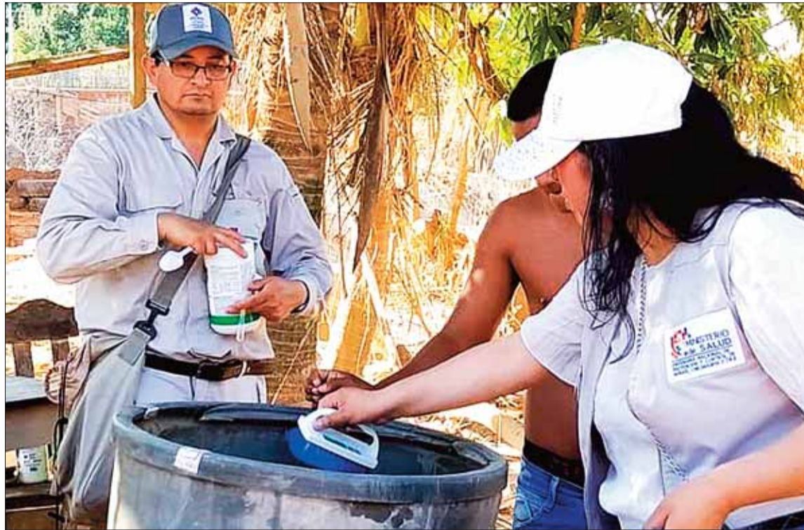
INTERVENCIÓN. Los gobiernos subnacionales y el Ministerio de Salud ejecutan limpiezas contra el vector.

También se conoce que en el municipio de Cobija de Pando, se ha reportado positivos.