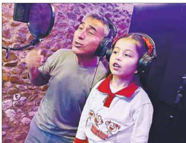
PRODUCCIÓN. Orlando Andía colaboró con la grabación.