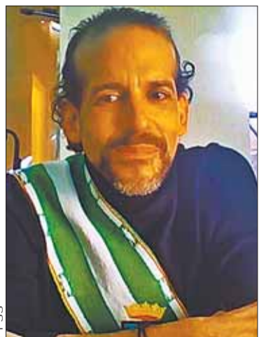
Luis Fernando Camacho.