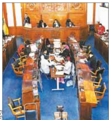
Comisión Mixta de Constitución.

NACIONAL. El martes inicia el examen oral para el proceso de preselección