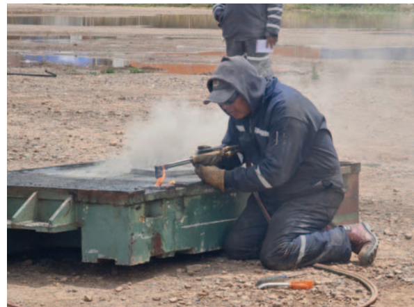
La droga iba oculta dentro de la chatarra

portante cargamento de droga oculto entre planchas de hierro dentro de contenedores de basura. Este suceso ha sido considerado como un duro golpe al tráfico de estupefacientes en la región, aunque persiste la ne-