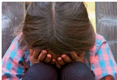
Una niña de solo cinco años fue víctima de violación /REFERENCIAL

Según el informe de la Defensoría de la Niñez, la niña sentía dolores en el cuerpo y que para revelar lo que había pasado hizo un dibujo en una pared de su casa, lo que derivó en