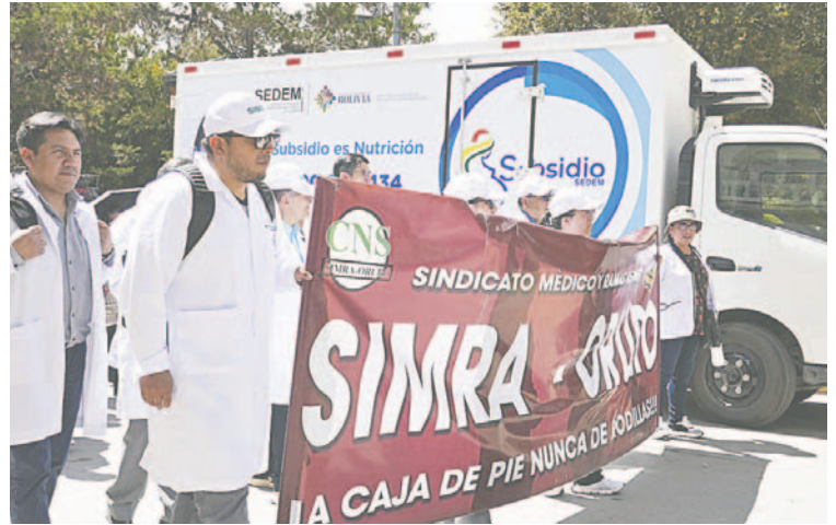
Profesionales en salud protagonizan marcha

“Según el Gobierno, en Bolivia la esperanza