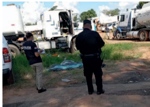
La Policía en el estacionamiento donde fue encontrado muerto el camionero boliviano