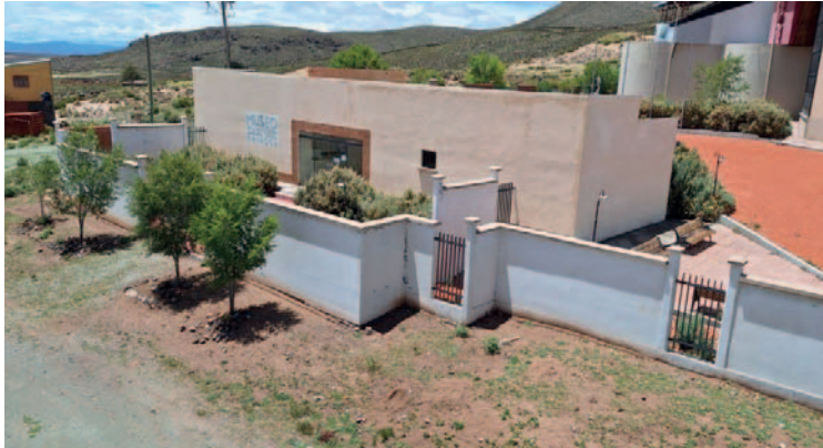
La infraestructura no funciona hace cuatro años

El legislador señaló que las responsables de la documentación fueron las