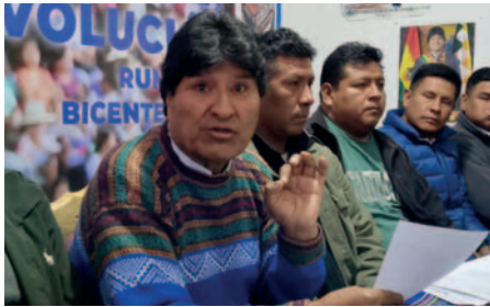
Enviaron invitación a Evo Morales para el congreso convocado por el ala “renovadora” del MAS