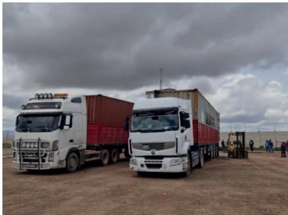
Los camiones que llevaban la chatarra con droga