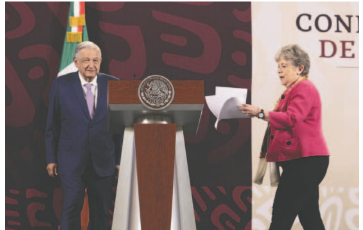
La secretaria de Exteriores de México, Alicia Bárcena, participa en la rueda de prensa matutina del presidente Andrés Manuel López Obrador, este jueves, en el Palacio Nacional de la Ciudad de México

ecuatoriano Jorge Glas había recibido asilo de México