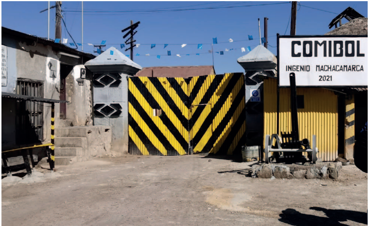
Comibol mediante Epcoro se hará cargo de la producción y comercialización de oro

La estatal minera ya cuenta con la unidad productiva Pico Sutu ubicada en