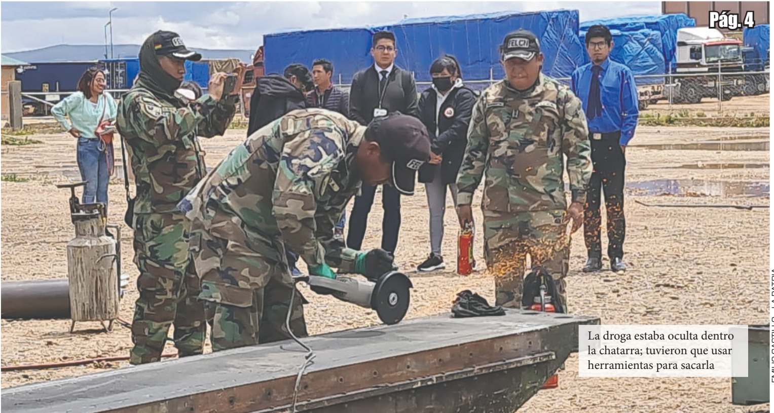
La droga estaba oculta dentro la chatarra; tuvieron que usar herramientas para sacarla