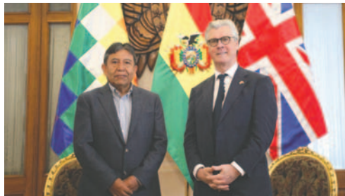
El Vicepresidente de Bolivia, David Choquehuanca Céspedes, sostuvo una reunión con el ministro de Negocios y Comercio del Reino Unido, Lord Offord de Garvel CVO

El ministro del Reino Unido destacó la importancia de fortalecer las relaciones bilaterales, especialmente en áreas como