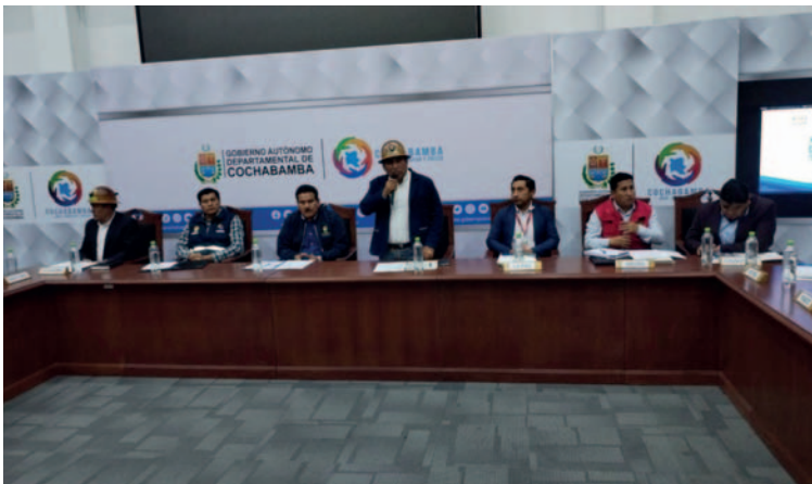
El Consejo debate sobre estrategias para el control minero y fiscalización de regalías mineras /MAURICIO GUZMÁN