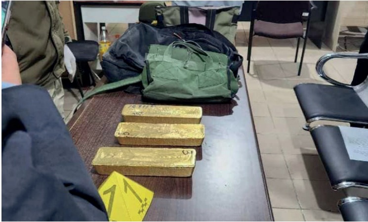
Tres personas son investigadas por la incautación de los cinco lingotes de oro