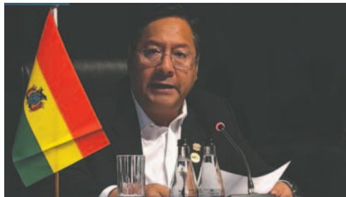
El presidente del Estado, Luis Arce, durante su intervención en la XV Cumbre de los BRICS

“Quiero dejar muy claro que siempre vamos a tener reconocimiento y hermandad con el pue-