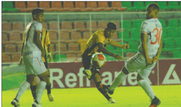
Al cuadro "atigrado" le costó ganar el partido para evitar a Bolívar en cuartos