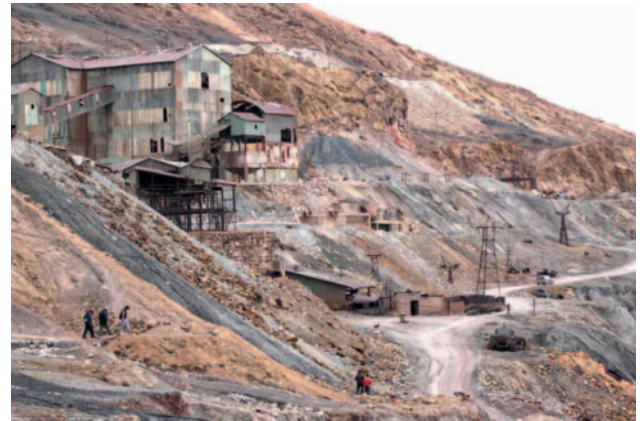
El analista afirma que es posible una minería más responsable

cuada presenta un desafío significativo. Las cooperativas mineras, con una fuerte presencia política, operan en un entorno donde la aplicación efectiva de la ley es inconsistente. Aunque algunas empresas cumplen con la normativa ambiental y laboral, el control diferenciado y la falta de supervisión gubernamental plantean interrogantes sobre la efectividad de estas medidas, aseguró el especialista.