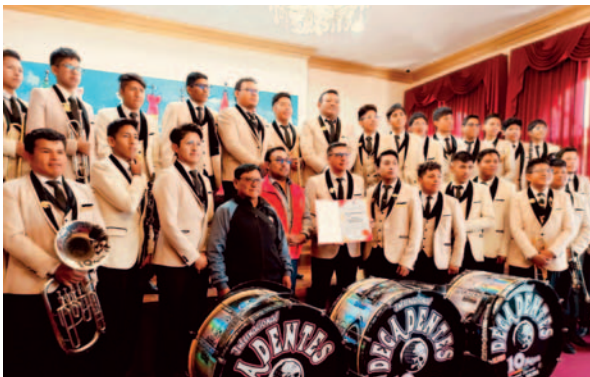
Entrega de la distinción a la Banda Internacional Decadentes / GADOR