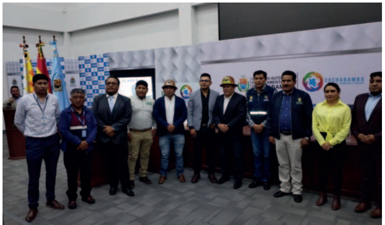
Cochabamba es sede del XII Encuentro del Consejo Minero de Gobernaciones

En este encuentro se busca fortalecer la coordinación entre entidades gubernamentales para garantizar un adecuado control en la actividad minera y una correcta fiscalización de las regalías generadas por esta industria clave para la economía boliviana.