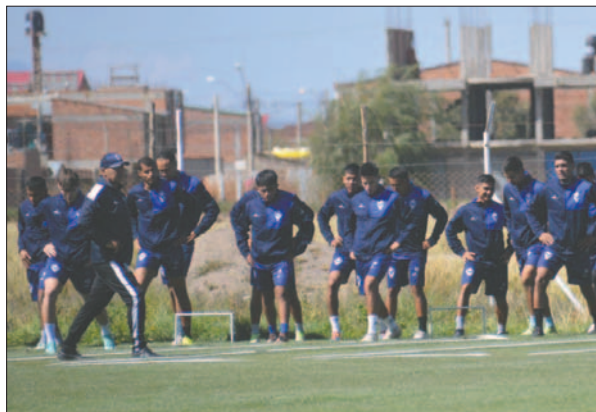
El plantel se encuentra motivado para afrontar los cuartos de final del torneo Apertura

ja para darle tranquilidad al plantel, para que se enfoque solo en el tema deportivo y más aún en este momento crucial para las aspiraciones del club.