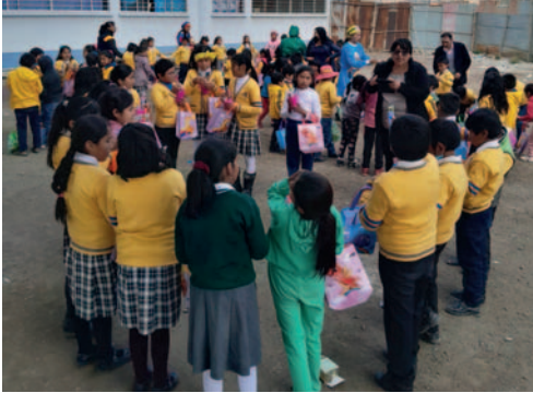
Actividad "Cuido mis dientes" fue organizada por Soroptimist Internacional Oruro