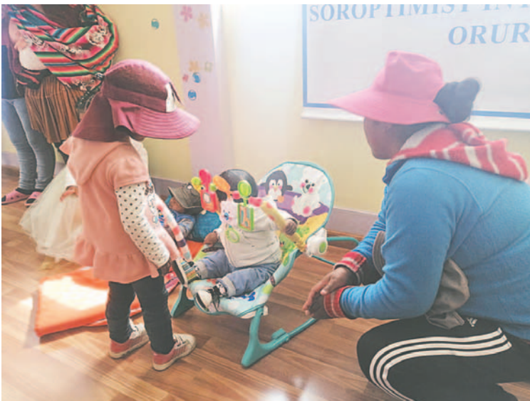
Ambientes de la guardería del penal La Merced

En el centro penitenciario se busca garantizar el bienestar integral de los menores durante su estancia. Se destaca la labor conjunta con organizaciones no gubernamentales y voluntarios en la implementación de la guardería y parque infantil.