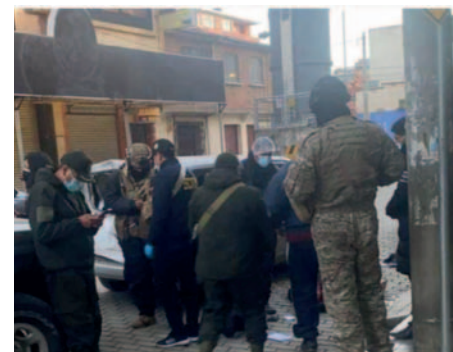
El uniformado fallecido fue emboscado junto a otros dos militares en la zona de Senkata por un grupo de contrabandistas en noviembre de 2021

Los condenados cumplirán su pena en la cárcel de San Pedro, ubicada en La Paz. El Viceministerio de Lucha Contra el Contrabando resaltó que esta sentencia es el primer fallo contra contrabandistas y sienta un precedente importante en la justicia boliviana.