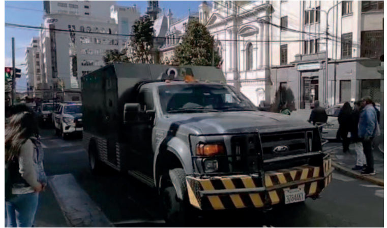
Los lingotes fueron trasladados a las bóvedas del BCB