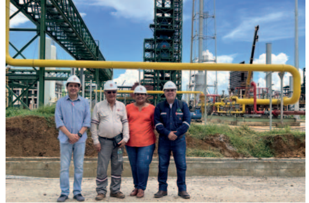
Autoridades y encargados de la Siderúrgica del Mutún en las instalaciones que están cercanas a concluirse

“De nuestra parte, les brindaremos unas tres o cuatro alternativas multimodales, com-