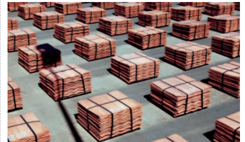
En febrero de 2024, Chile registró una producción de 417.000 toneladas métricas de cobre