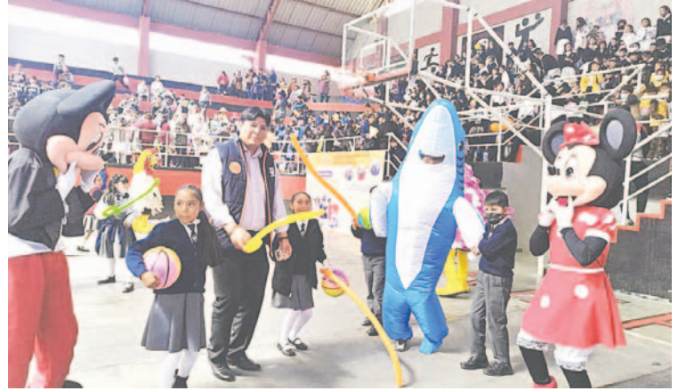
Niños gozaron de una jornada dedicada a ellos

"Queremos llegar a ustedes con un abrazo grande, una protección única y que cada uno sienta que vamos a estar trabajando con ustedes",