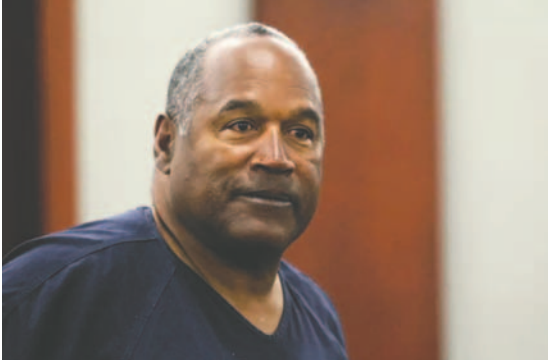
El exjugador de la NFL y locutor O.J. Simpson falleció a los 76 años a causa de cáncer

El exjugador de la NFL y locutor O.J. Simpson falleció a los 76 años a causa de cáncer, según anunció su familia el jueves en un comunicado. Simpson, conocido por su absolución en el caso de los asesinatos de su exesposa Nicole Brown Simpson y Ron Goldman en 1995, dejó un legado deportivo marcado por la controversia.