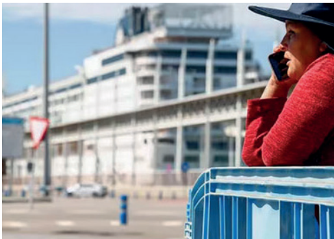
65 bolivianos regresan a Bolivia desde España

El crucero MSC Armonía, proveniente de Brasil