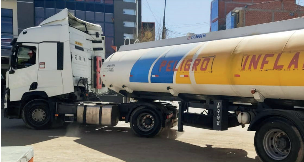
Varios camiones cisternas quedaron varados por varios días en Paraguay