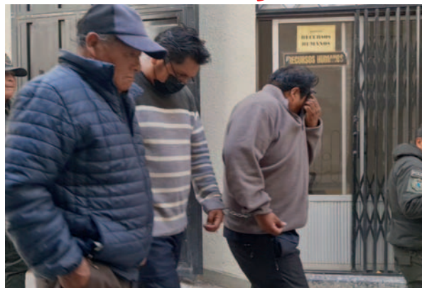
Los tres sindicados fueron enviados a prisión preventiva

Como resultado de esta operación, se procedió a la aprehensión del propietario del vehículo, así como del conductor principal