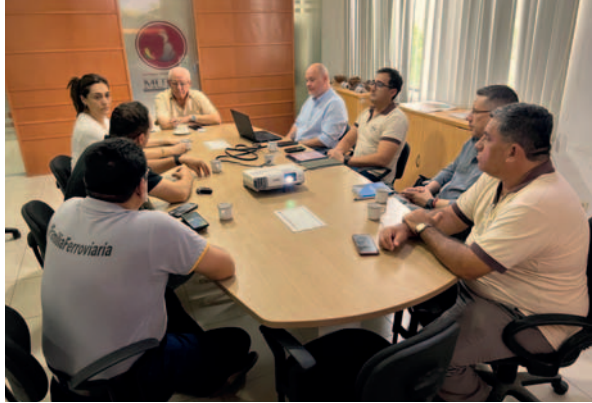
Reunión entre representantes de la ESM y Ferrovía Oriental S.A. para coordinar el futuro transporte del acero

En febrero de 2025, se concluirá con la séptima planta de Reducción Directa del Hierro (DRI) y en marzo se pondrá en marcha en su totalidad, con una etapa de ajustes y pruebas hasta alcanzar el máximo de la producción. El Complejo Siderúrgico del Mutún producirá aproximadamente 200.000 toneladas de acero en barras corrugadas y alambón de diferente diámetro, sustituyendo casi el 50% de las importaciones de este material en el país.