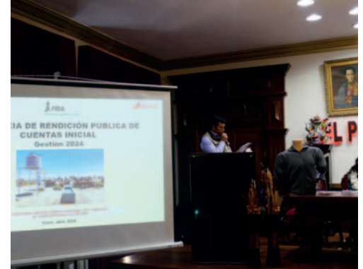
Rendición pública de cuentas del programa Pro-Camélidos