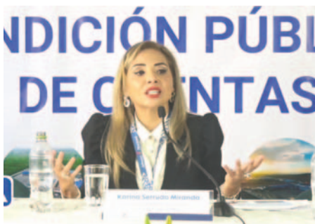
La presidenta Ejecutiva de la Aduana Nacional, Karina Serrudo Miranda