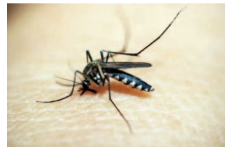
El oropouche es una enfermedad viral que provoca fiebre alta y síntomas similares al dengue

La mayoría de los pacientes se recuperan dentro de siete días, pero la convalecencia puede durar semanas en algunos casos.