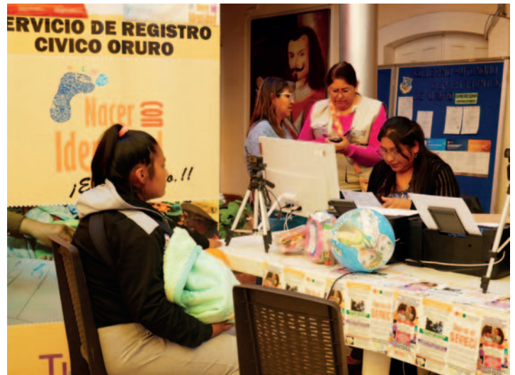
Campaña registral dedicada para los niños