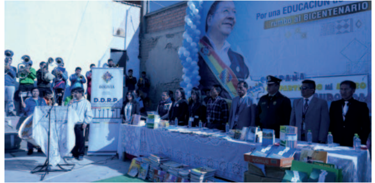
Campaña “Bolivia Lee” recolectó libros para los centros penitenciarios

“Como administración penitenciaria departamental, estamos dispuestos a trabajar por los privados de libertad. No solo deben cumplir su condena en los centros penitenciarios, sino que también debemos demostrar a la sociedad que, en estos centros, los privados de libertad tra-