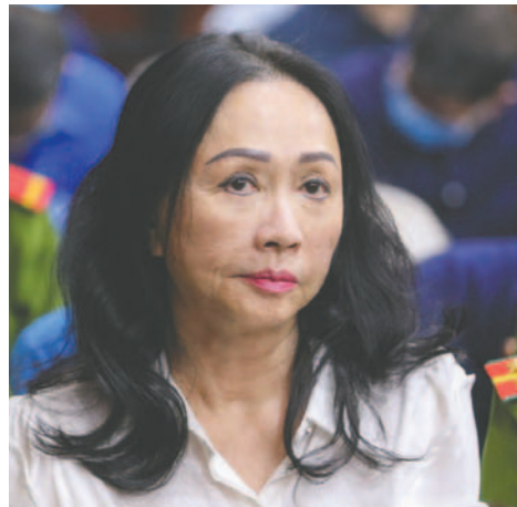
La empresaria Truong My Lan asiste al juicio en Ho Chi Minh (Vietnam) en el que fue condenada a muerte por el desfalco de 12.500 millones de dólares del Banco Comercial de Saigón (SCB)

El caso del SCB, el mayor banco en activos del país, es uno de los mayores fraudes en Asia, ya que los