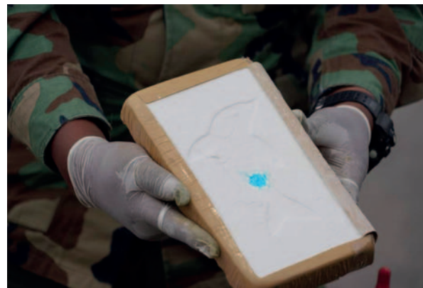
La sustancia controlada cuyo destino era Argentina

dividuos detenidos fueron revisados, no encontrándose registros previos en el sistema. Sin embargo, según información proporcionada por la Felcn, se determinó que la sustancia confiscada estaba destinada a la frontera con Argentina, específicamente a la localidad fronteriza de Villazón, con el propósito