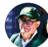
Grover Torres Aranibar, juez agroambiental

Choferes y vecinos protestaron ayer contra el mal estado de la carretera a Santiváñez y demandaron la ejecución de los proyectos comprometidos.