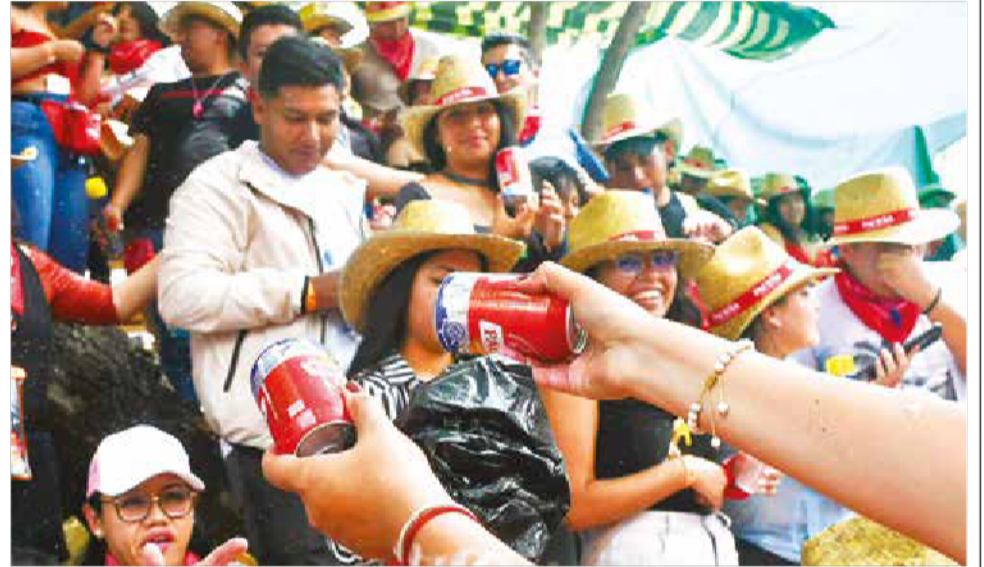
Las fiestas patronales y otras actividades son escenarios de consumo de bebidas. D.JAMES

“Tiene una alta prevalencia de vida son los varones con el 64,3 por ciento”, dijo la directora Choque.