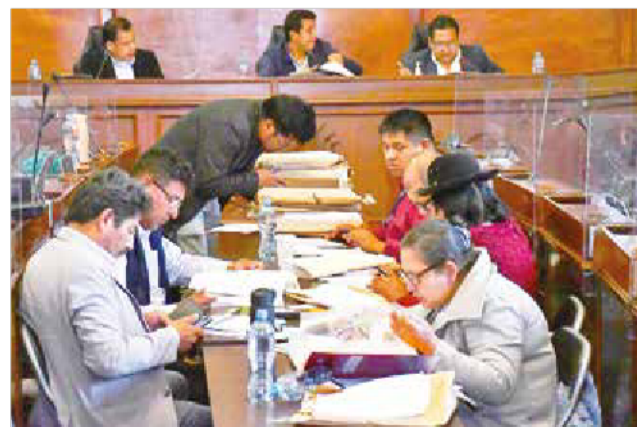
La Comisión Mixta de Constitución en tareas de verificación de requisitos.

“Nosotros vamos a hacer todo lo humanamente posible para que nadie pueda frenar esta elección, porque es la expectativa del pueblo boliviano sediento de justicia que se cambien las auto-