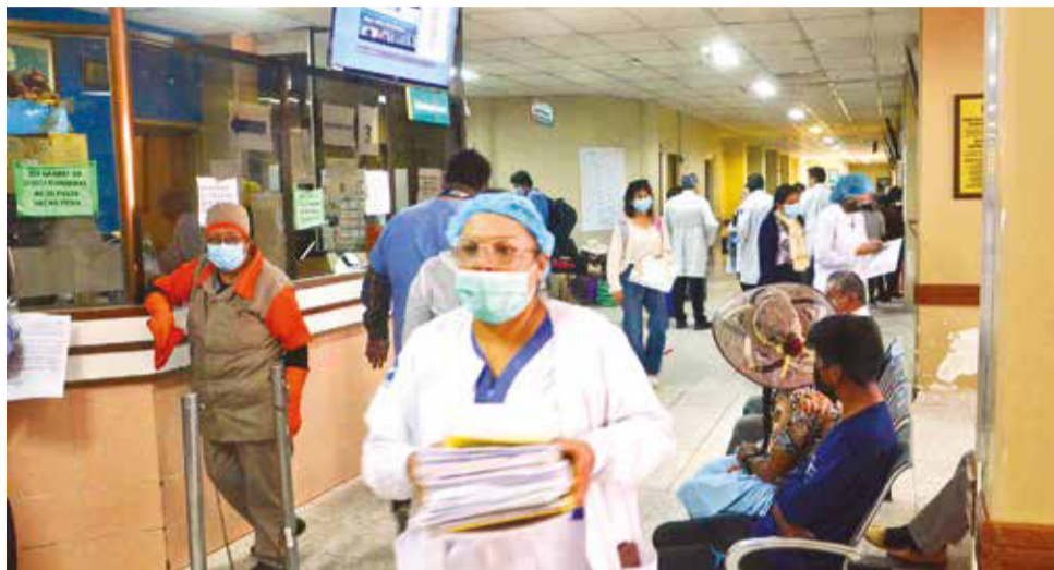
Pacientes en el hospital Viedma la semana pasada en Cochabamba. HERNÁN ANDÍA

Los maestros reclaman porque la jubilación a los 65 años significará rentas bajas.