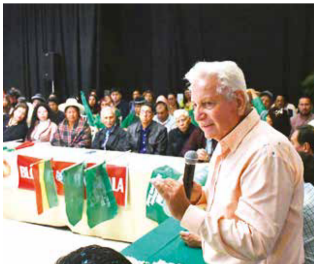
Rubén Costas participa del encuentro nacional en Cochabamba, ayer. CARLOS LÓPEZ

es juntar a todas las fuerzas democráticas para enfrentar al MAS en los comicios del próximo año, con un programa de desarrollo para el país.