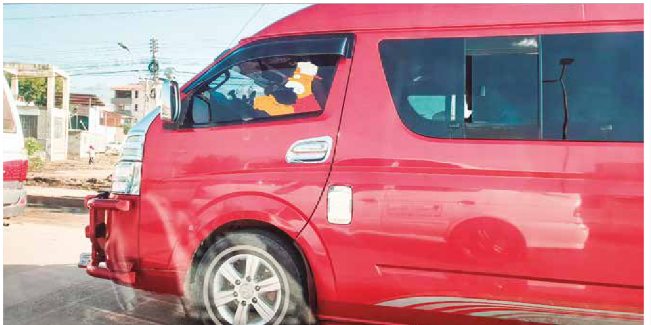
CREATIVIDAD. Un chofer incluyó en su vidrio polarizado la figura de un personaje de los Simpson que aparenta ser el conductor del vehículo. Robaba risas a su paso.

ENVÍE SU FOTO PARA PUBLICARLA EN ESTA SECCIÓN: fotografia@lostiempos-bolivia.com