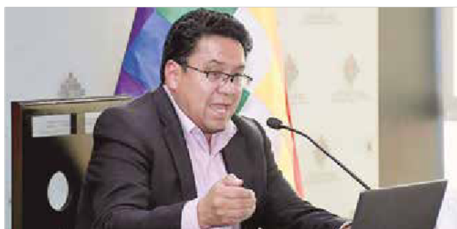
El procurador General del Estado, César Siles.

Casos. Entre las denuncias relevantes se encuentran los relacionados con la estabilidad laboral de exjueces y el caso terrorismo.