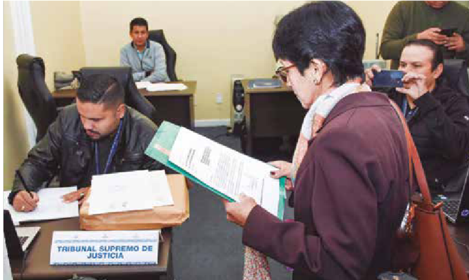
De las 715 postulaciones, 405 aspirantes pasaron a la fase de evaluación de méritos.