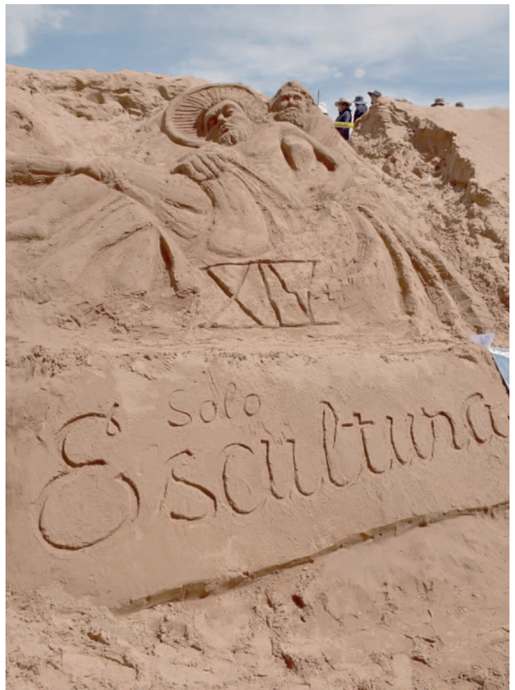
Colectivos de todo el país llegaron para representar la Vía Crucis en arena