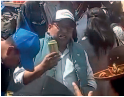
El diputado Jáuregui bebiendo en la vía pública /CAPTURA DE PANTALLA