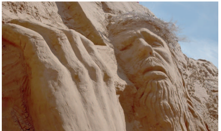
El sufrimiento de Jesús fue plasmado por los talentosos artistas