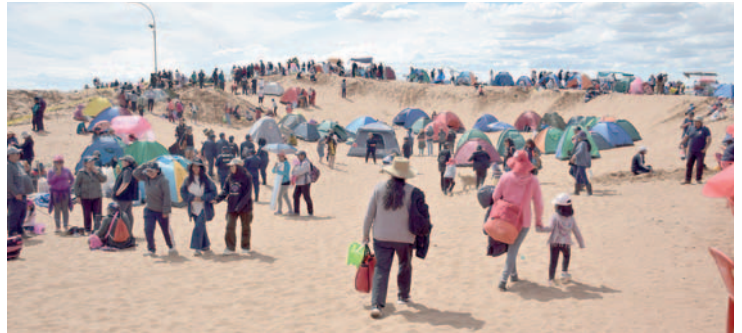
Miles de personas se dieron cita a los arenales de Cochiraya