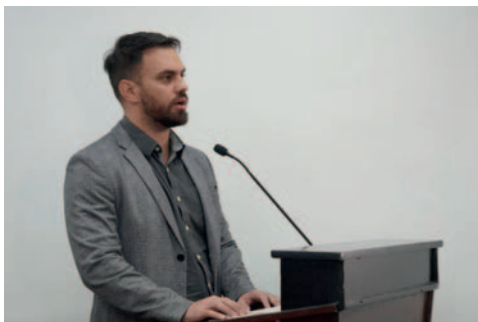
El ministro de Gobierno, Eduardo Del Castillo

Del Castillo afirmó que la decisión de no llevar a cabo el traslado se debe a