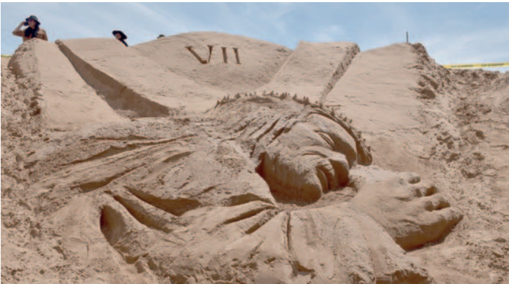
La segunda caída de Jesús representada en la escultura de la Séptima Estación/LA PATRIA