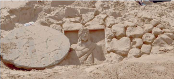
La resurrección del Señor, una de las esculturas más admiradas