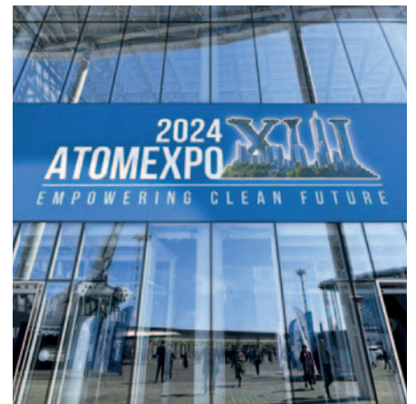
Atomexpo 2024 en Sochi, Rusia