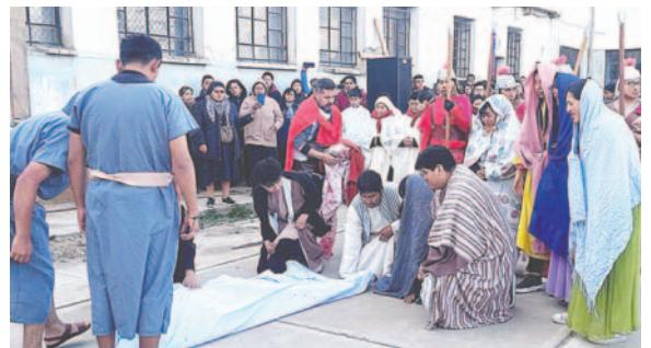
Jóvenes representaron el sacrificio y sufrimiento de Cristo

"Realmente la Pasión, Muerte y Resurrección son los misterios que tienen que marcar nuestra vida, y este silencio tiene que