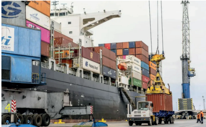
Tras 8 días de bloqueo en el Puerto de Iquique, Bolivia enfrenta pérdidas millonarias en comercio exterior