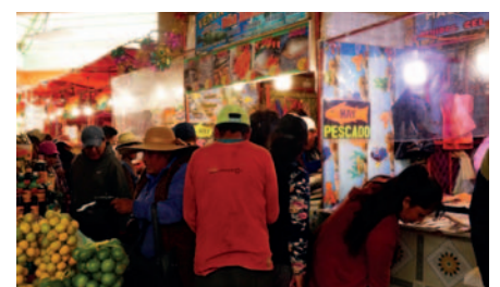
Creció la demanda de productos en centros de abasto durante el Viernes Santo

Dentro de los centros de abasto, se vio gran cantidad de personas que fueron a comprar algunos productos que les faltaba para la preparación de las recetas de Semana Santa.