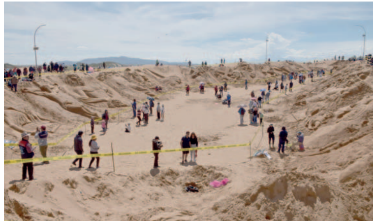
Poco a poco la gente comenzó a llenar la exposición de esculturas de arena/LA PATRIA