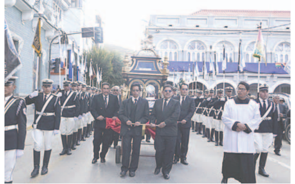
Fieles acompañaron la procesión en el Viernes Santo