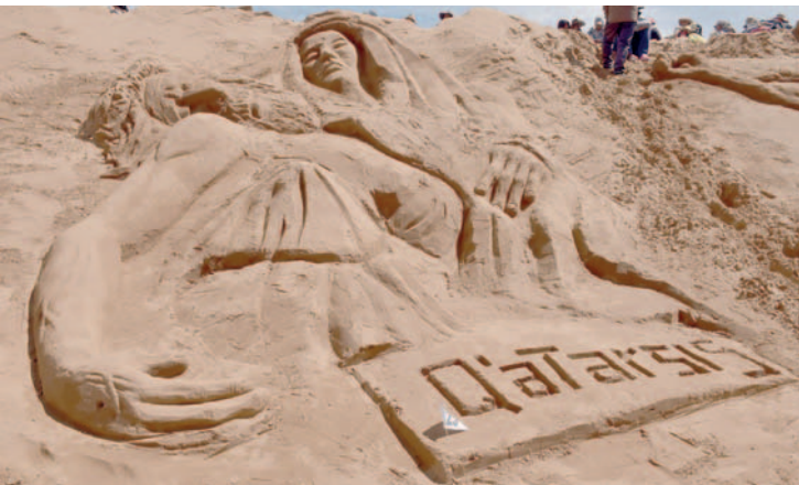
Q'ataris representó a Jesús en los brazos de su madre