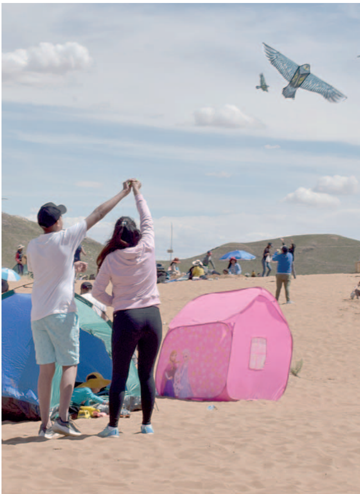
El volar cometas ya es tradicional en la visita a arenas

Algunos instalaron redes para jugar voleibol y otros deportes, incluso hubo concursos de voladores y muchas actividades más. Paralelamente, se instalaron contenedores de basura para evitar la contaminación, ya que el principal pedido es la preservación del sitio patrimonial