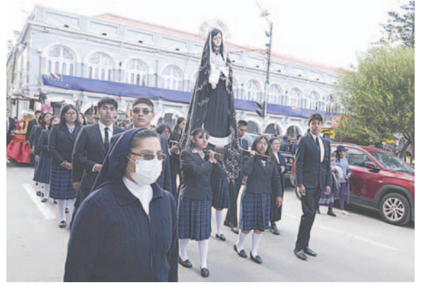
Estudiantes del Colegio Bethania acompañaron la imagen de la Dolorosa

La procesión partió de La Catedral, siguió por la calle Adolfo