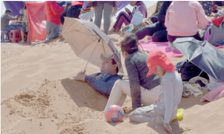
Familias enteras pasaron tiempo juntas el Viernes Santo