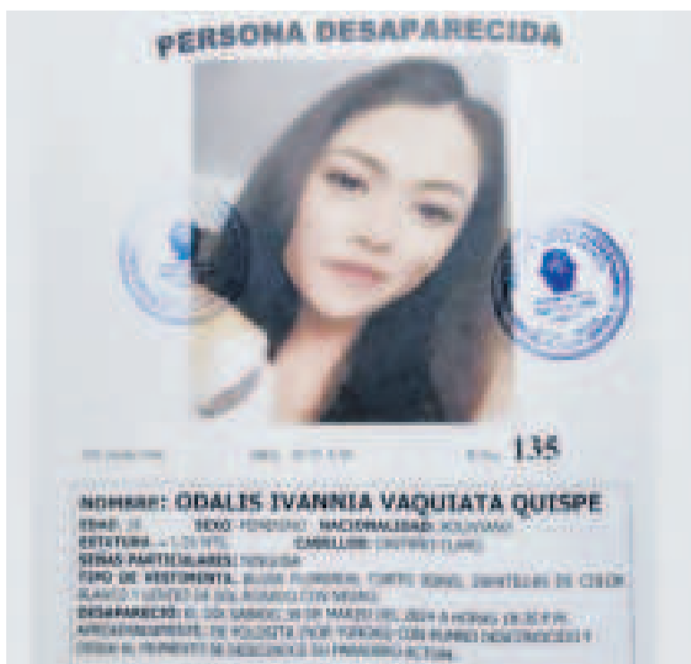
El afiche divulgado por la FELCC.