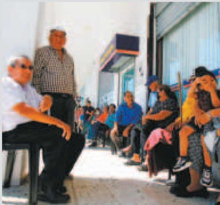
Los jubilados cobran su renta.