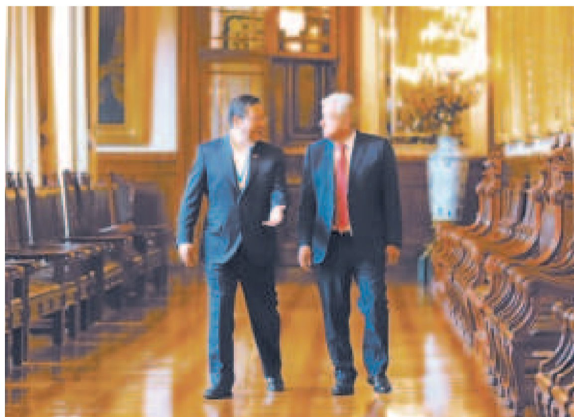
El presidente Luis Arce junto al mandatario de México, Manuel López Obrador.

El presidente Arce espera que los organismos multilaterales tomen una decisión para impedir que se vuelva a repetir otro allanamiento.