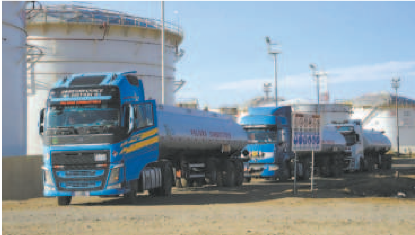
Cisterna en Santa Cruz.

Jiménez explicó que con los dirigentes de los cisternas se quedó en que las notificaciones para el uso de GPS que efectúa la ANH se harán cuando se esté adquiriendo el combustible, ante observaciones de que las notificaciones llegaban antes de cargar el combustible.