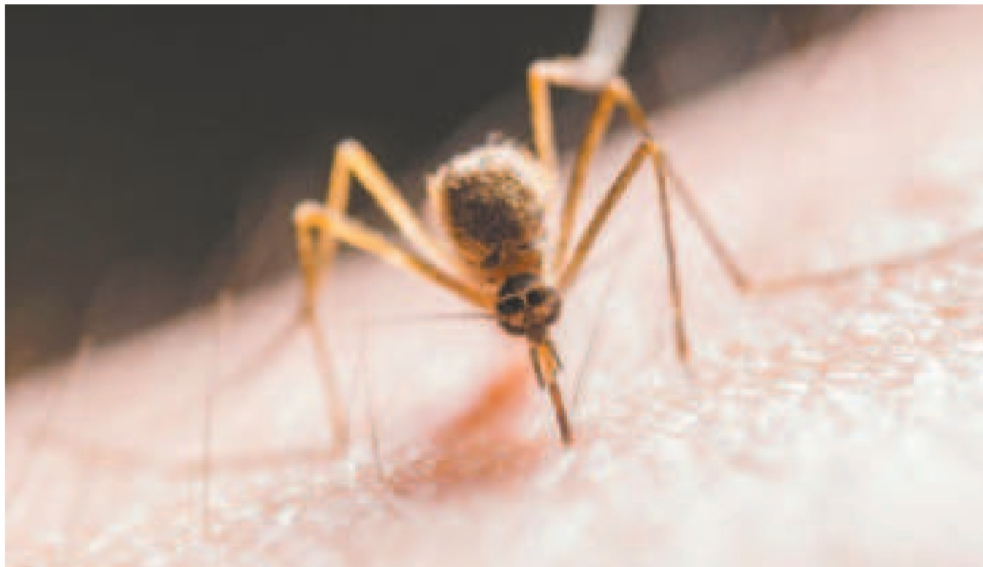
El mosquito Culex, transmisor del oropouche.