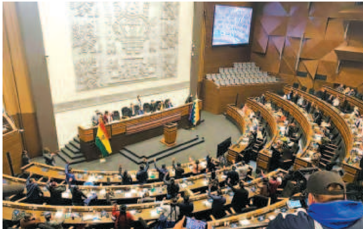
El pleno de la Asamblea Legislativa tendrá en sus manos la selección última de candidatos.

La evaluación de la formación académica, en la que se