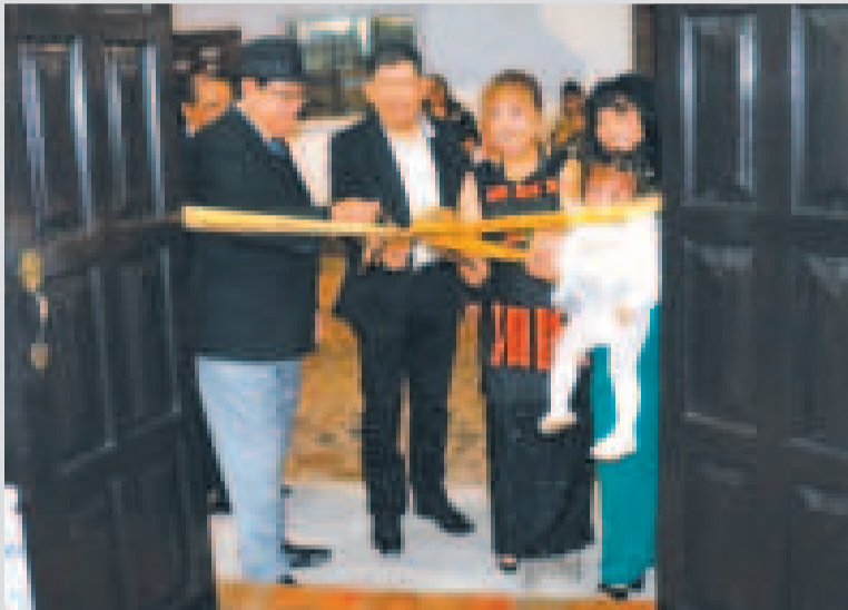
Inauguración del nuevo centro cultural.