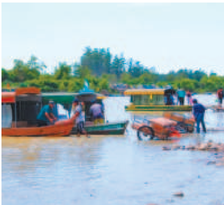
El paso fronterizo en Bermejo, Tarija.

Según el reporte de la radio, diariamente ciudadanos argentinos ingresan al territorio boliviano para comprar diversos productos e incluso alimentos.