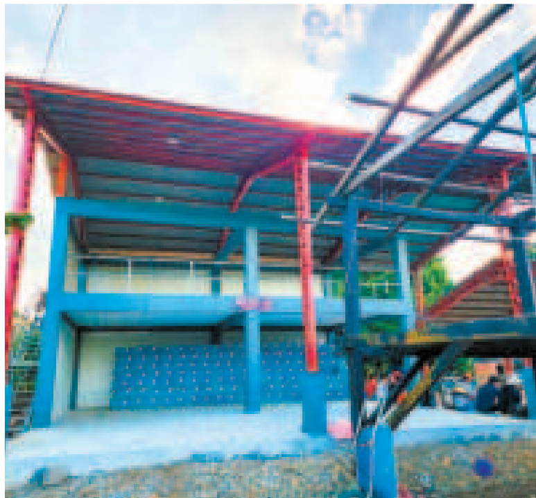
Esta entrega tiene una capacidad de empaque de mil cajas por día.