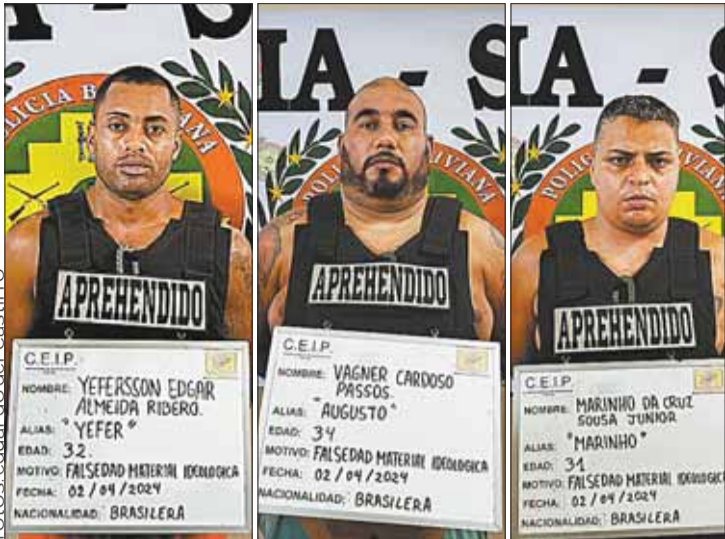
EXPULSIÓN. Los brasileños serán entregados a la Policía de Brasil.