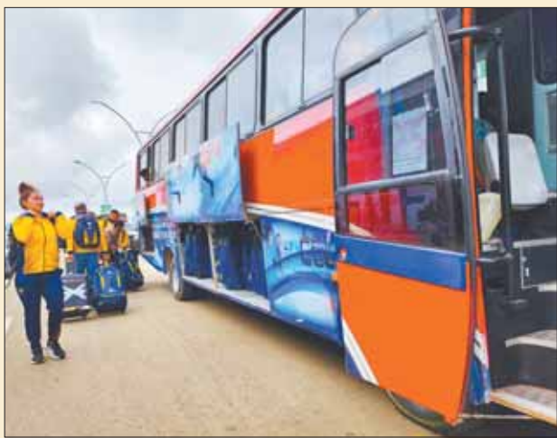
LLEGADA. La delegación de Colombia en Sucre.