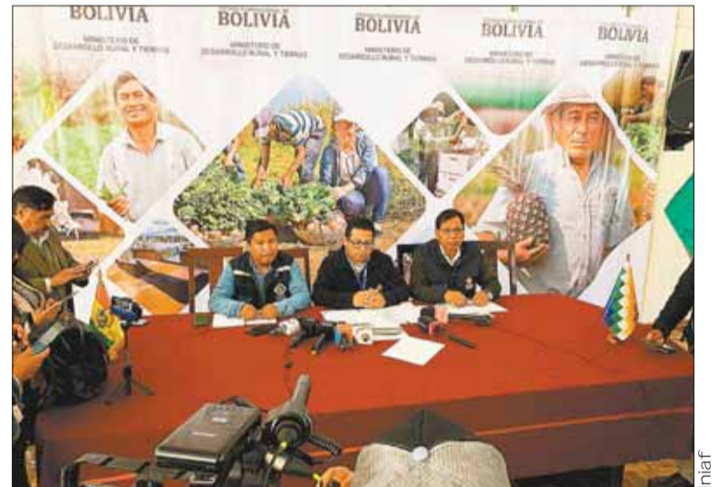
INNOVACIÓN. Autoridades del INIAF, en conferencia de prensa.