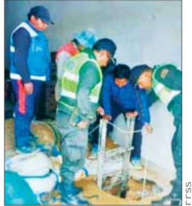
EL túnel cavado en Achocalla.

El propietario del inmueble también fue aprehendido y la Justicia determinó detención domiciliaria mientras continúan las investigaciones, pese a que él denunció el forado en su vivienda.