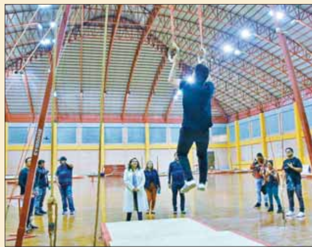
DEMOSTRACIÓN. Un atleta muestra el uso de argollas.