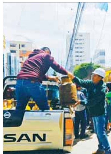
Garrafas comisadas por la ANH.

La ANH intervino una vivienda en la zona Sur de la ciudad de La Paz