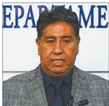
El fiscal William Alave.

Se pedirá su detención preventiva; hay 191 pruebas contra Méndez