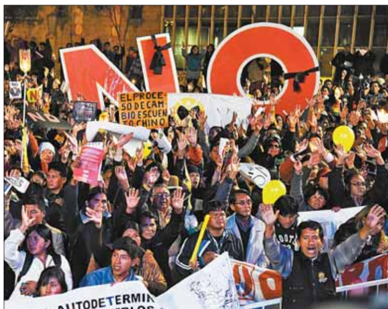
REFERÉNDUM. La campaña por el No en en la consulta de 2016.

El objetivo era buscar una segunda repostulación, una más que la permitida, con la modificación del artículo 168 de la CPE. En la votación, el No a la modificación ganó con 51,3% de los votos frente al 48,7% del Sí.