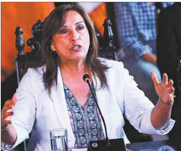
CONFIANZA. Boluarte debe ahora enfrentar la presión política.

Desde antes de la votación, el gobierno confiaba en conseguir la mitad más uno de votos sobre los 130 escaños del Congreso gracias a los grupos parlamentarios que van desde el centro hasta la ultraderecha a los que se ha aferrado Boluarte durante su presidencia ante la falta de bancada propia.