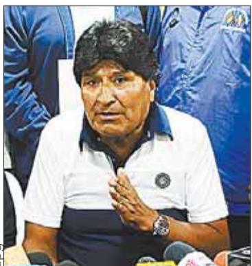
Evo Morales, jefe del MAS.

NACIONAL. Morales indica que ambas fechas son por la ‘confusa’ conminatoria