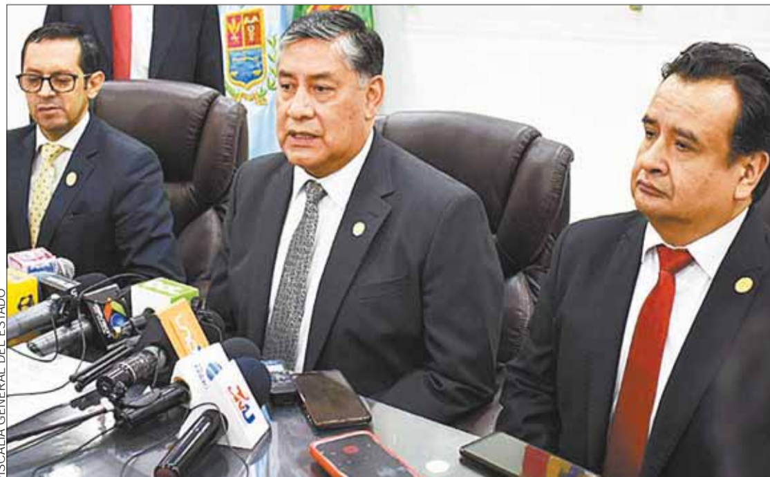
CONFERENCIA. El fiscal general del Estado, Juan Lanchipa, dio información del caso Pedrajas.

Asimismo, el fiscal Lanchipa remarcó que hay procesos de investigación en Cochabamba, Tarija, Chuquisaca y Santa Cruz, que están a cargo de una comisión de fiscales, por los delitos de violación de infante, niño, niña o adolescente, y abuso sexual.