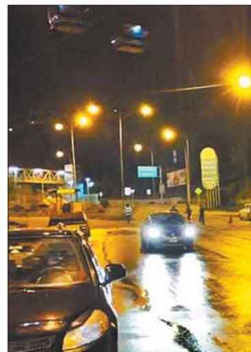
La vía se encuentra transitable.

“Esto ha estado 15 días cerrado y hemos trabajado en esos 15 días, más de 50 obreros que han puesto todo de sí para habilitarla lo más pronto posible. Teníamos