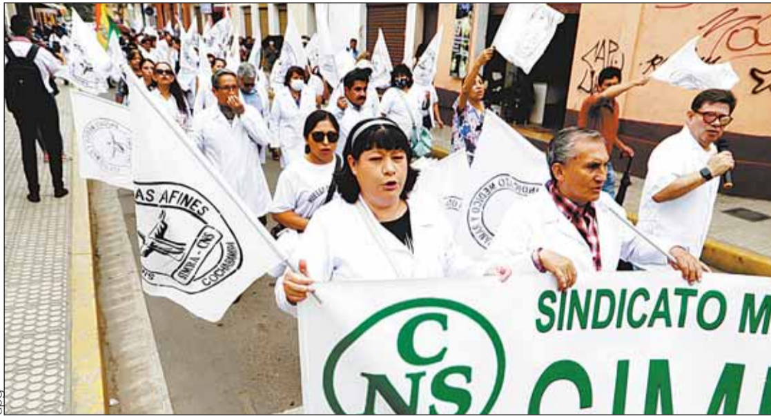
PROTESTA. El sector salud cumple un paro de 48 horas y se moviliza contra la 'jubilación forzosa'.