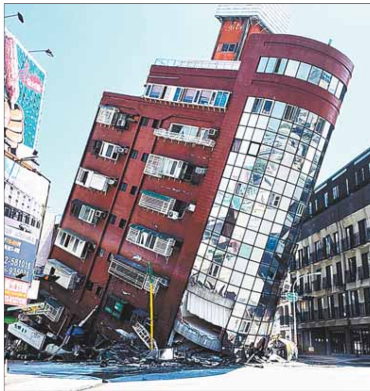
TRAGEDIA. La gente busca a personas desaparecidas en el temblor.