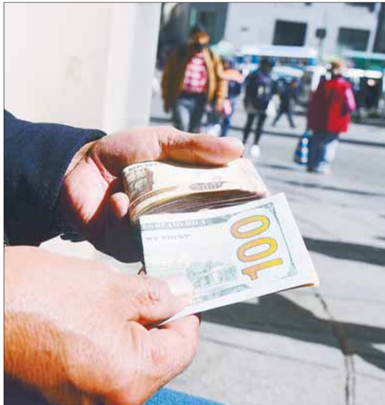
COMERCIALIZACIÓN. Venta de dólares en el mercado paralelo.

Hasta antes de la aplicación de las medidas, la cotización del dólar en el mercado paralelo estaba