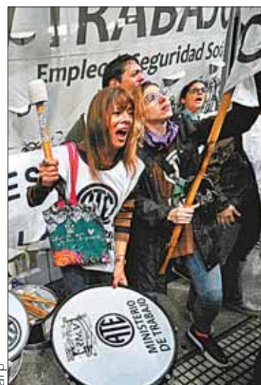
Protestas en los ministerios.

Estados Unidos ofreció a Taiwán "toda la ayuda necesaria" y una portavoz del Consejo de Seguridad Nacional afirmó que están monitoreando "la información sobre el impacto del terremoto en Taiwán" y "su posible repercusión en Japón". En 1999, un terremoto de magnitud 7,6 mató a unas 2.400 personas en Taiwán.