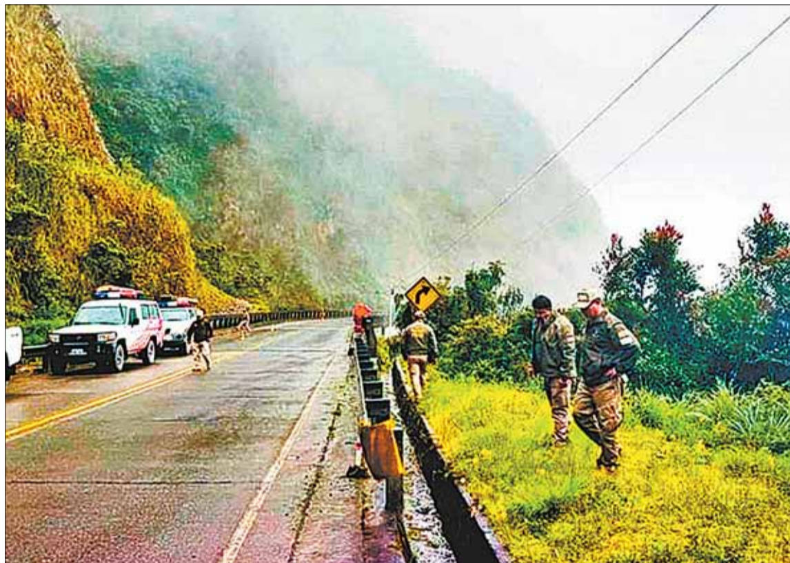
TRABAJO. La Policía moviliza a diferentes de sus unidades para poder dar con la mujer de 28 años.

“En base al trabajo de triangulación y otro tipo de análisis que nosotros tenemos en la investigación, vamos a empezar a reducir el campo de búsqueda sin descartar algunos elementos que nos siguen llegando”, informó el director nacional de la Fuerza Especial de Lucha Contra el Crimen (FELCC), coronel Jhonny Chávez.