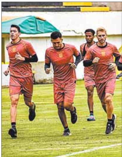
Jugadores de The Strongest.