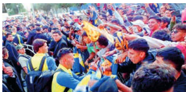
Llegada del plantel Boca Juniors a Sucre, ayer.

Boca Juniors llegó ayer a Sucre, donde pasó la noche. El viaje a Potosí se iniciará a las 14:00 de hoy, con la idea de