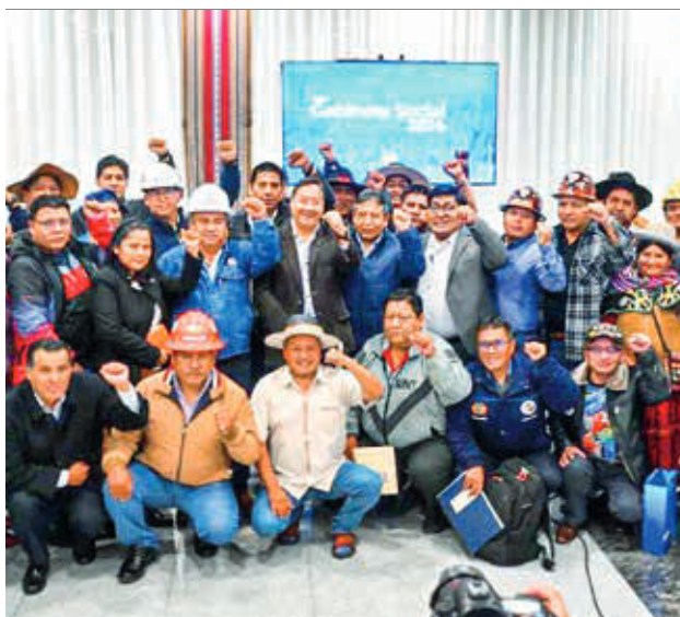
El presidente Luis Arce en reunión con el gabinete social.

El 17 de octubre de 2023, en el denominado Gran Cabildo del Pueblo, desarrollado en la ciudad de El Alto, se aprobó el mandato de conformación de un gabinete Social, que sea artífice en la profundización del proceso de cambio.