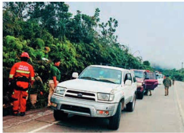
La búsqueda de la joven en Los Yungas, ayer.

"La pareja ha sido aprehendida con fines de investi-