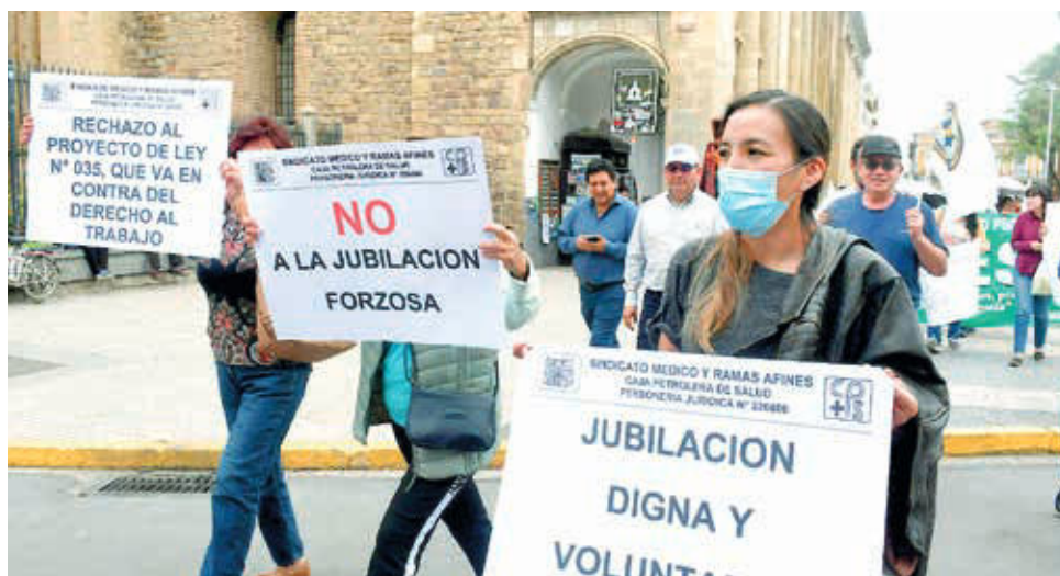
Personal de salud marcha en Cochabamba, el 12 de marzo. CARLOS LÓPEZ

En el caso de los trabajadores que tienen salarios bajos y no cumplen los 35 años de aportes, su jubilación bajará en 40%. Para los que ganan más de Bs 25 mil se incrementa del 5 al 5,74% y para los que tienen salarios superiores a Bs 35 mil, sube de 10 a 11,48%.