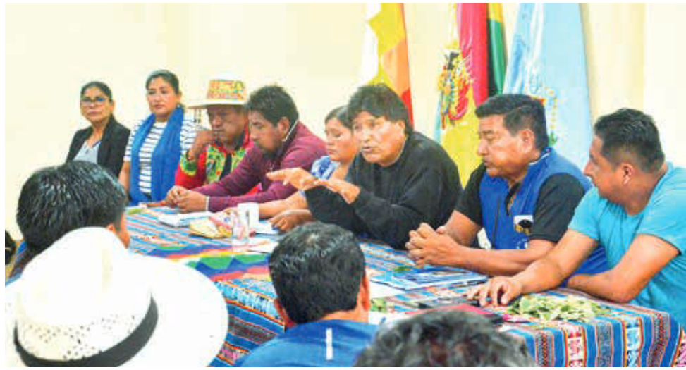
Dirigencia nacional del MAS evista reunida en Cochabamba, ayer. DANIEL JAMES

La Secretaría de Cámara del TSE realizó observaciones a la solicitud de acompañamiento al congreso de arcistas que debían subsanarse hasta ayer. La primera fue que ninguno de los solicitantes del congreso figura como dirigente nacional del MAS-IPSP, registrado ante el Órgano Electoral, ni tampoco es delegado del partido. Tampoco se adjuntó la nómina de representantes que conducirán el congreso, ni acreditaron que la convocatoria al congreso haya sido emitida por la Dirección Nacional del MAS, previo consenso con las organizaciones matrices.