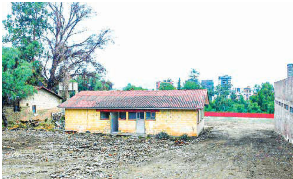
El predio para el teatro en la actualidad, en la av. Circunvalación. CARLOS LÓPEZ