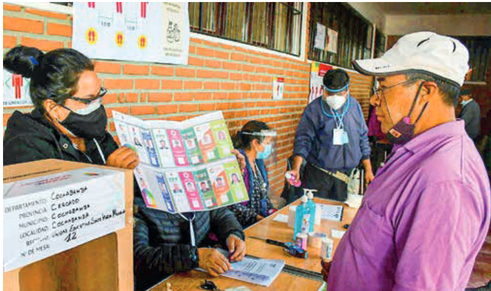
Ciudadanos votan en una elección anterior.

Las organizaciones de las naciones y pueblos indígena originario campesinos no podrán convertirse en partidos políticos ni en agrupaciones ciudadanas.