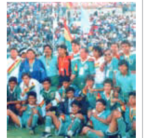
El equipo campeón de los Bolivarianos 1993. LT