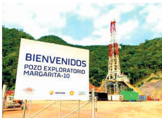
El pozo exploratorio de gas Margarita-10.

En enero de la gestión pasada, las exportaciones de manufacturas sumaron 440,0 millones de dólares, mientras que este año bajaron a 243,8 millones de dólares, refiere el reporte. Esta cifra muestra una merma de 196,2 millones de dólares.