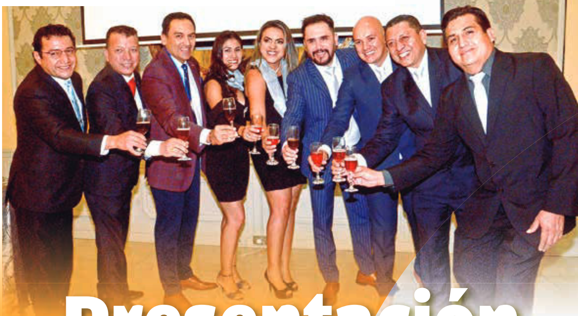
Ceremonia. Brindis del directorio entrante 2024-2026.