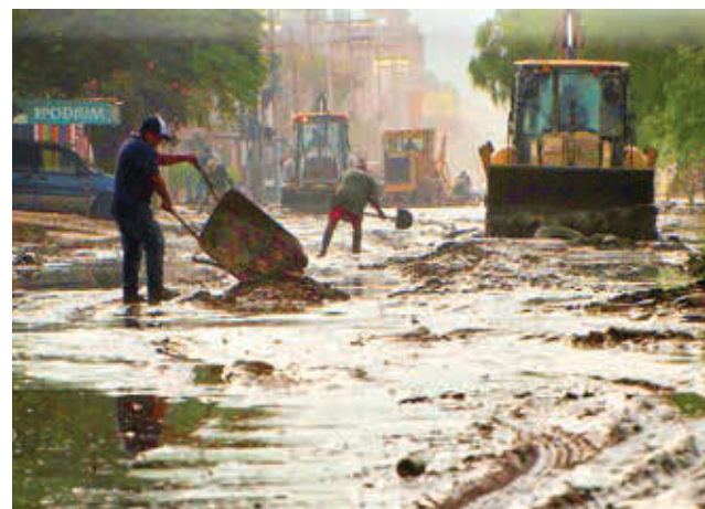
El lodo que cubrió las calles de Florida, ayer.

En tanto, el director departamental del Servicio Nacio-