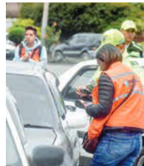
Los controles de Univida, en Cochabamba. JOSÉ ROCHA

El gerente de Univida señaló que en los 472 accidentes registrados, los