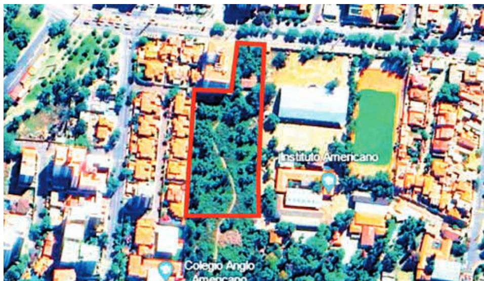
Una imagen del sitio para el teatro con un espacio verde en junio de 2023.