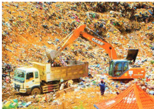
Camiones retiran la basura de la playa.