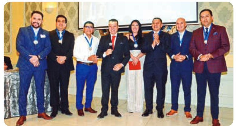
Misión cumplida. El directorio saliente.