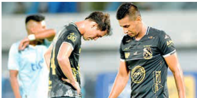
Jugadores de Vaca Díez, en la temporada 2023.

Simón Bolívar. Las inscripciones de clubes cerraron el lunes 1 de abril, pero las listas de buena fe tienen plazo hasta el viernes 5