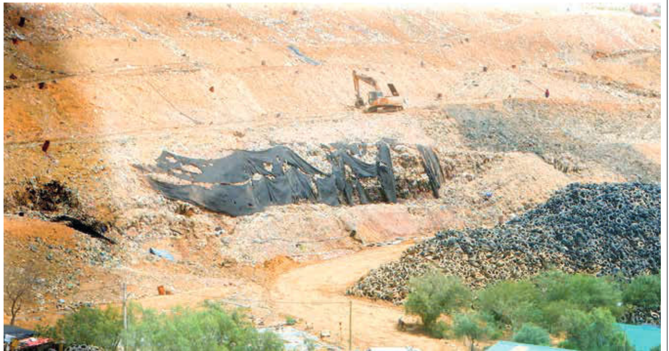
El lugar donde se derrumbó la playa de descarga de los residuos en K'ara K'ara.

MULTIMEDIA: Escanee este QR para ver el video de la nota. www.lostiempos.com