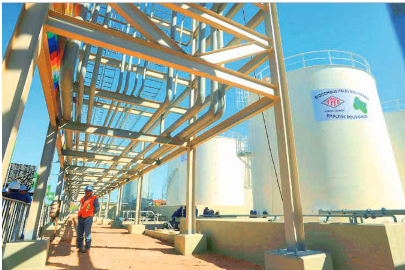
Instalaciones de la nueva planta de diésel inaugurada el martes en la ciudad de Santa Cruz.

Las dos primeras plantas producirán 1.500 barriles de biodiésel por día, aunque se desconoce el costo de producción. Es decir, si éste será menor al precio del diésel subvencionado: 3,74 bolivianos por litro.