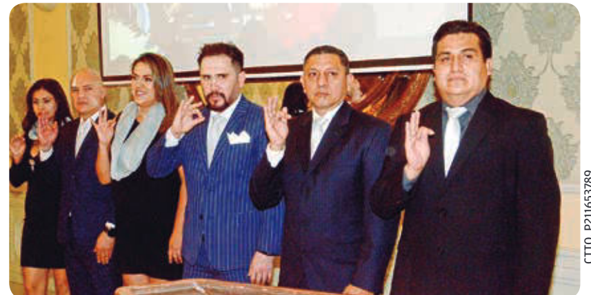
Ceremonia. Juramento del directorio entrante 2024-2026.