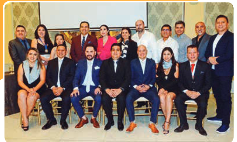
Grupo. Sociedad Boliviana de Implantología Oral.