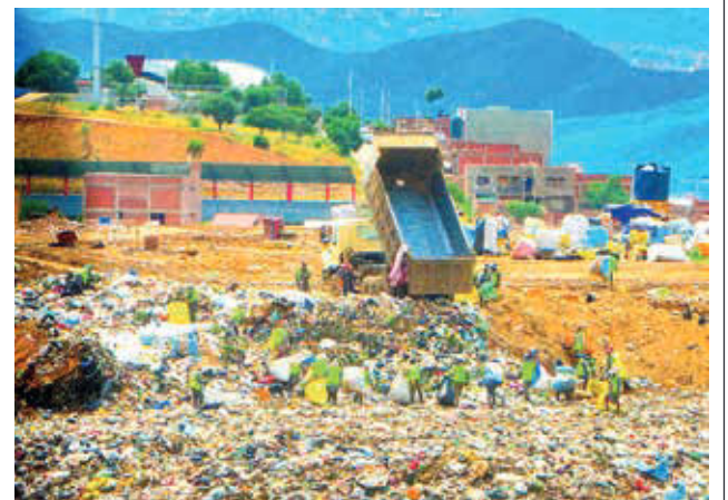
Descarga de residuos en un nuevo espacio.