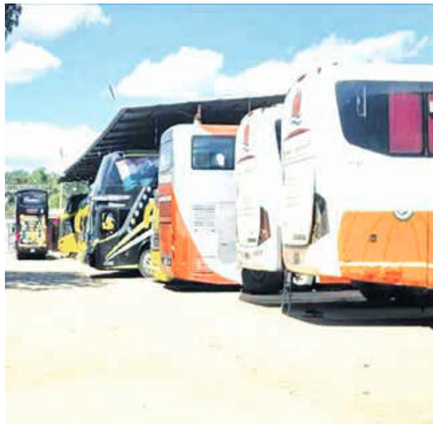
Algunos de los buses precintados en Santa Cruz por sospecha de transporte de droga.

El fiscal antidrogas asignado añadió: "Se está solici-