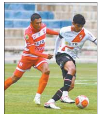
Incidencia del Always-Inde.

Always jugará este jueves ante el colombiano Independiente Medellín por Copa Sudamericana.