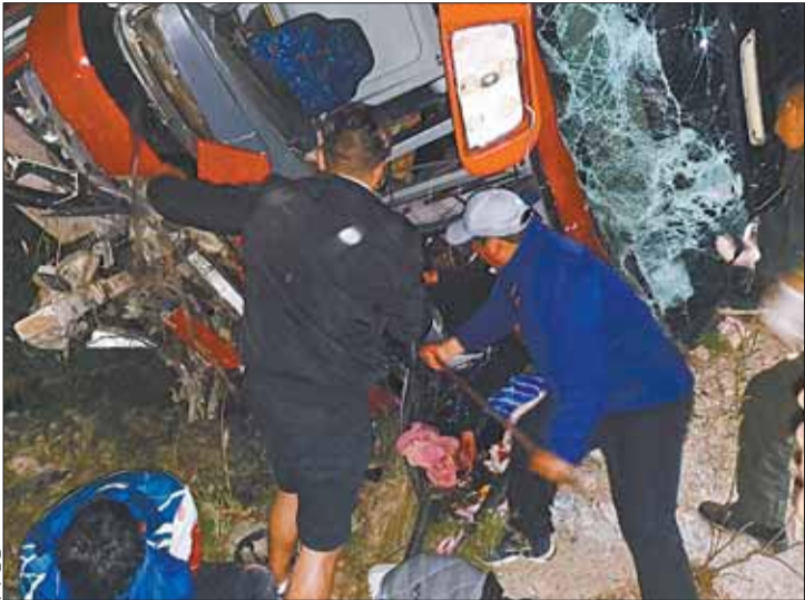
ACCIDENTE. El bus se embarranco entre 20 y 30 metros.