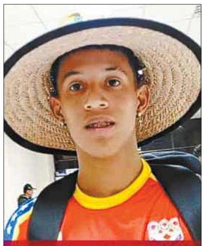
Un deportista venezolano en Sucre.

La ciudad se apresta también para acoger a la delegación de Boca Juniors