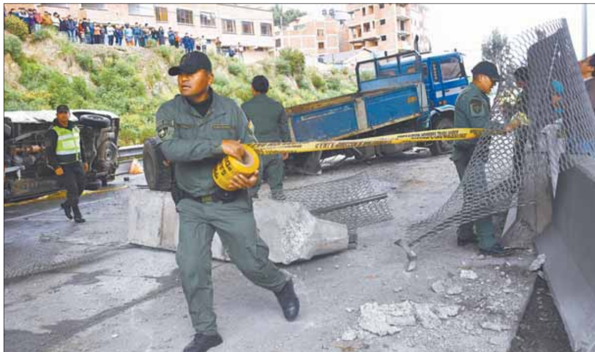
TRAGEDIA. El caso se encuentra en investigación; efectivos policiales y de Bomberos acudieron para ayudar.

Este último motorizado resultó más afectado. En el minibús viajaban varias personas desde la ciudad de La Paz hacia El Alto, pero el impacto de esta volqueta se cruzó en su camino y causó la muerte de cuatro pasajeros.