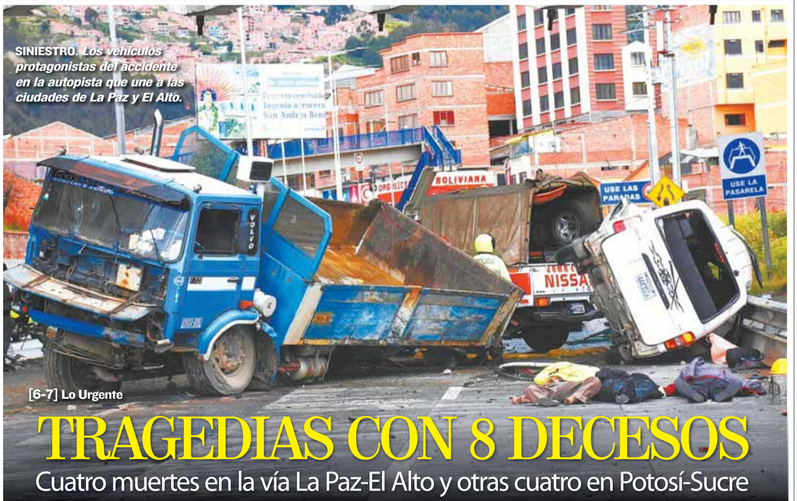
SINIESTRO. Los vehículos protagonistas del accidente en la autopista que une a las ciudades de La Paz y El Alto.