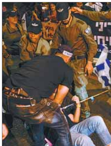
Protestas en Israel.

En Israel crecen las protestas pidiendo la liberación de los rehenes