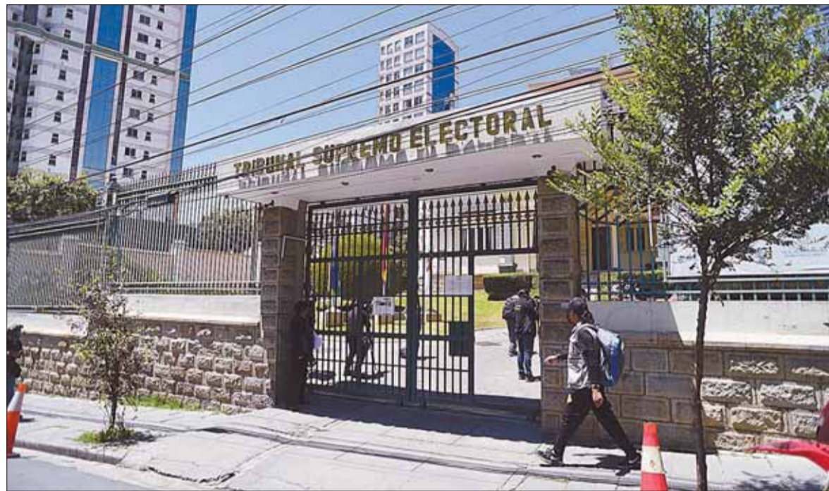
ÓRGANO. La sede del Tribunal Supremo Electoral (TSE) en la plaza Abaroa de la ciudad de La Paz.

La Ley 1096 indica que las organizaciones políticas deben elegir a su binomio ‘en un proceso electoral primario, obligatorio y simultáneo convocado por el TSE’