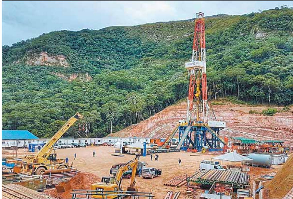
EXPLORACIÓN. Trabajos de perforación en el pozo Itacaray, en el departamento de Chuquisaca.

En diciembre de 2015, el gobierno de Evo Morales promulgó la Ley 767, de Promoción para la Inversión en Exploración y Explotación Hidrocarburífera, con la finalidad de incrementar las reservas y producción de hidrocarburos mediante incentivos económicos para garantizar la seguridad y