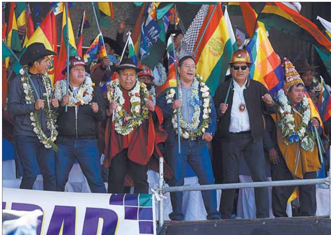
PASADO. Evo Morales y Luis Arce, en la manifestación en defensa del Gobierno, el 25 de agosto de 2022.

Si bien el presidente Arce no se manifestó sobre la iniciativa ni el Gobierno emitió una posición ins-