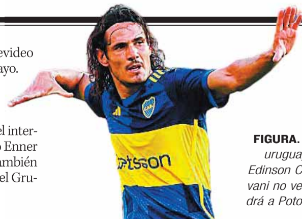
FIGURA. El uruguayo Edinson Cavani no vendrá a Potosí.

El Inter de Porto Alegre, otro gigante brasileño, que apuesta a los goles del internacional ecuatoriano Enner Valencia, debutará también hoy en Córdoba por el Grupo C ante Belgrano.