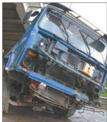
La volqueta implicada en el caso.

Se aguarda el resultado de las investigaciones sobre este accidente