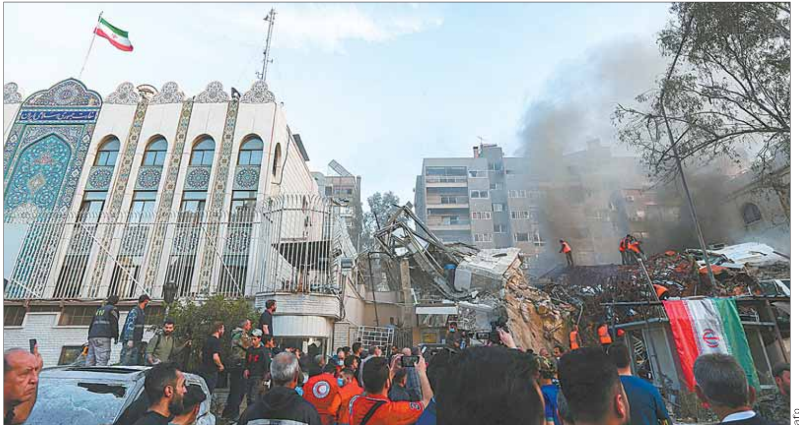
TRAGEDIA. Bombardeos de Israel en Siria, en una embajada de Irán, 11 personas perdieron la vida y se esperan duras reacciones.

"El bombardeo destruyó todo el edificio, matando e hiriendo a todos los que estaban dentro. Se está trabajando para recuperar los cuerpos y rescatar a los heridos de entre los escombros", afirmó el Ministerio sirio de Defensa mientras en el lugar, los servicios de emergencia buscaban víctimas bajo los restos y sonaban las sirenas. Las fuerzas de seguridad acordonaron el perímetro ante una multitud de curiosos que se agolpaban cerca de vehículos calcinados. Un periodista de AFP constató que el bombardeo sólo dejó en pie la puerta del edificio, con un cartel que mencionaba "la sección consular de la embajada de Irán". El embajador iraní en Siria, Hossein Akbari, quien resultó