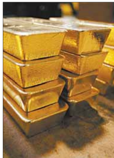
Lingotes de oro.

El costo de la onza pasó de los 2.265 dólares y hay un nuevo vendedor