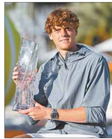
El italiano Jannik Sinner.