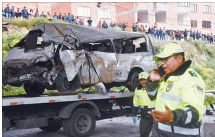
VEHÍCULO. Un minibús fue el más afectado en este accidente.

“Las víctimas fatales) se encontraban en el interior de un minibús, tres de sexo masculino y una de sexo femenino. Entre los fallecidos se encuentra el conduc-