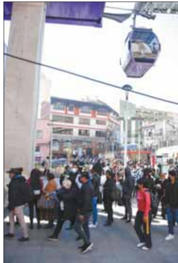
Pasajeros en la Línea Morada.

SOCIEDAD. La empresa trabaja en un proyecto de mejora de sus 10 líneas