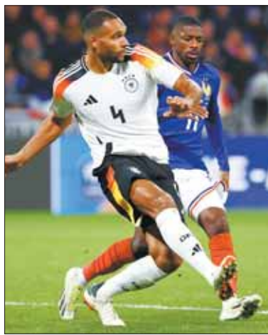
Alemania-Francia en un amistoso.