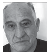
José Pimentel Castillo fue dirigente sindical minero.

El pasado 21 de marzo, un día antes de cumplir 86 años, murió Octavio Carvajal, dirigente minero de la vieja guardia sindical. Su vida laboral comenzó en 1954, cuando —con 16 años— ingresó a trabajar en la Empresa Minera Catavi, con el cargo de peón en la sección Fundición. Fueron las épocas gloriosas del pueblo boliviano: se había nacionalizado las minas, dictado la reforma agraria, se inauguraría el voto universal en 1956 que institucionalizó la revolución, poniendo orden: reorganización del ejército, racionalización en las minas, devaluación monetaria, inversión extranjera en el petróleo, cierre de las minas de Pulacayo, Kami, Bolsa Negra, supresión de la pulpería, etc., medidas resistidas por los sindicatos de Siglo XX y Catavi. La mayoría de los sindicatos consideraba que las medidas eran necesarias y el sacrificio era pasajero, así se impulsó el retorno de Paz Estenssoro, acompañado por Juan Lechín. El enroque no sirvió para nada, Lechín fue enviado al exilio dorado, mientras se imponían las recomendaciones del informe Ford & Bacon.