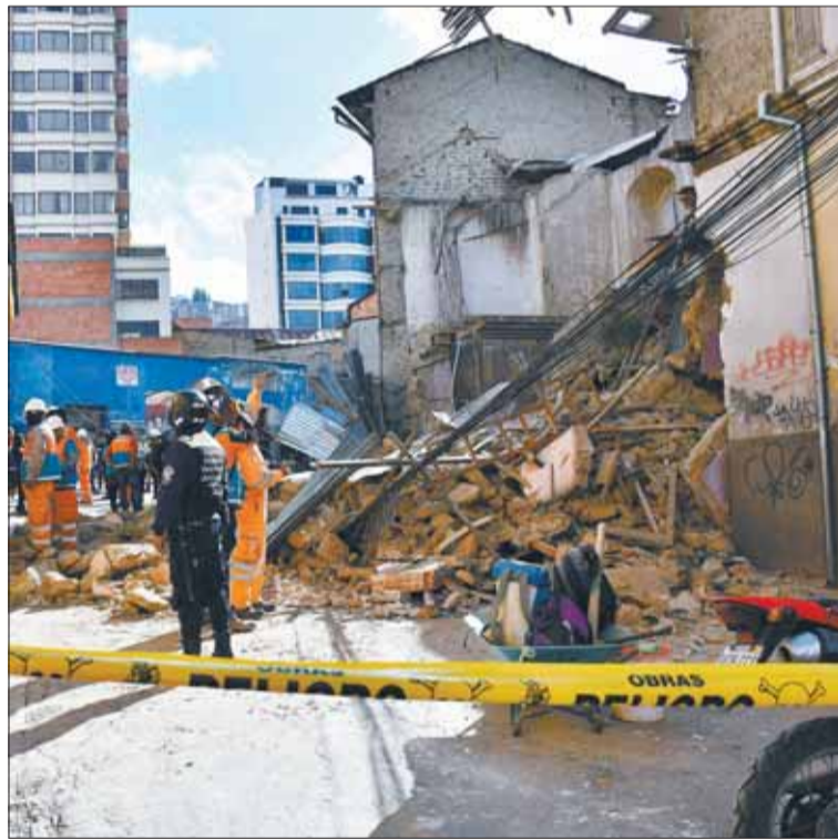
RIESGOSO. Bomberos llegaron a la casa que se desplomó en la Bueno.

que los cables eléctricos queden sobre el piso. Por el derrumbe, personal edil cerró los accesos al mercado Yungas y adyacentes, además, para precautelar la seguridad de los estudiantes de una escuela que colinda con el lugar.