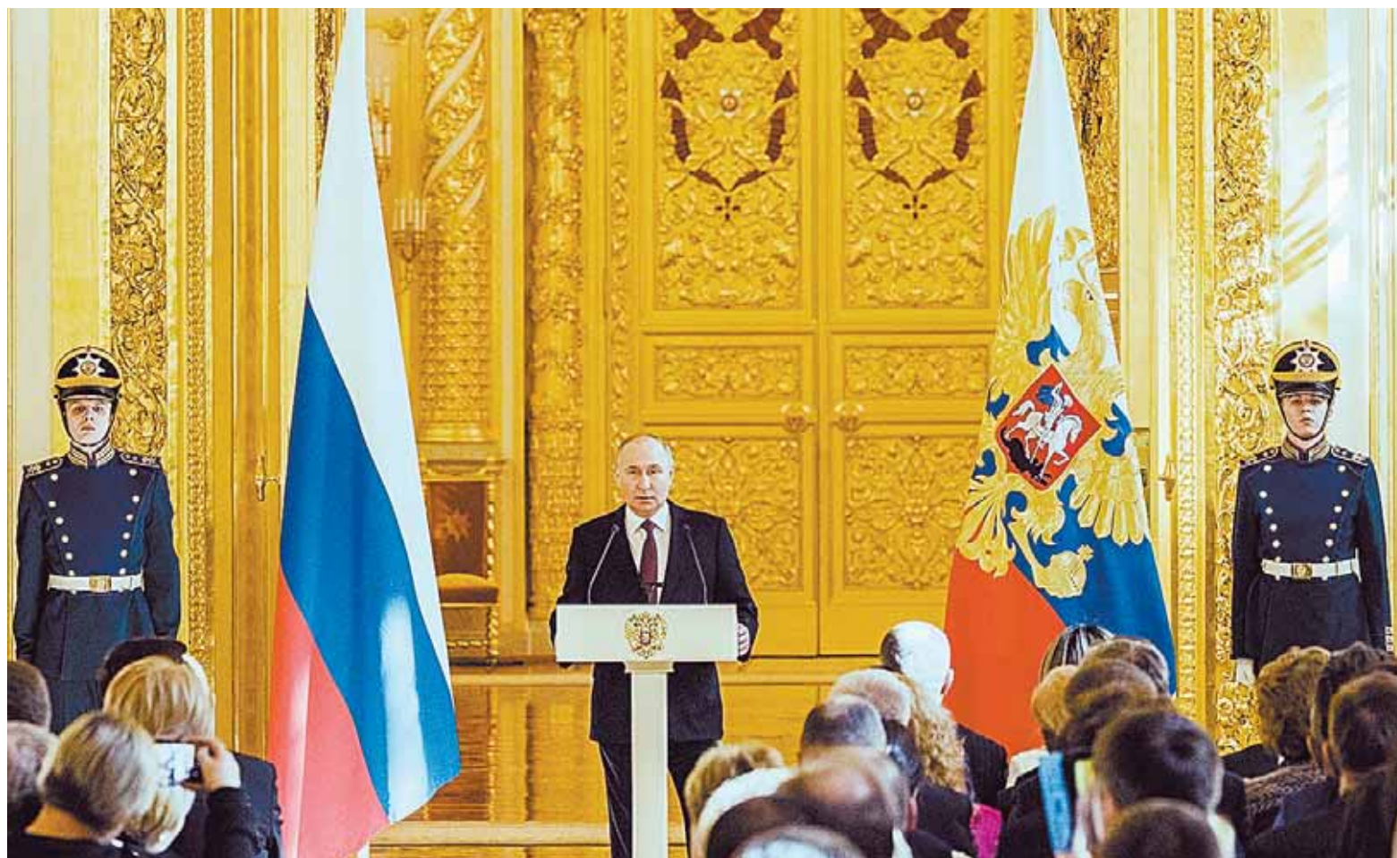
El presidente ruso, Vladimir Putin, realiza declaraciones en el Kremlin en Moscú, el miércoles 20 de marzo de 2024.