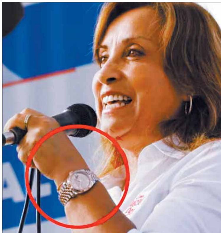
POLÉMICA. Se acusa a Boluarte de no haber declarado sus Rolex.

Cuestionado por el aumento de la inseguridad ciudadana, el ministro se desempeñaba como máximo responsable de la policía, que el fin de semana allanó junto a la Fiscalía la vivienda y despacho presidencial de Boluarte en el marco del llamado Rolexgate.