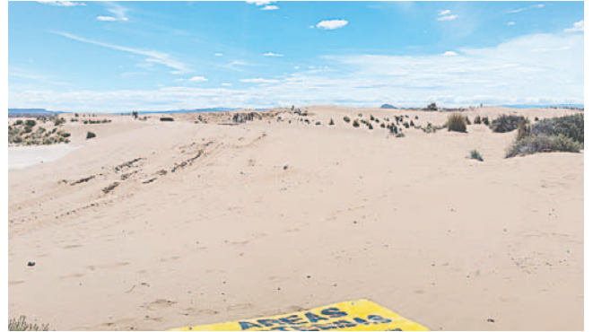
Los tres arenaless de Oruro fueron limpiados ayer y se colocó letreros de Área Protegida

En este punto se comprometió una limpieza el lunes con los estudiantes de la U.E. Freddy Nuñez como voluntarios. Luego del colocado de letreros, se trasladó hasta los Arenaless del Tagarete, donde efectivos policiales retiraron a va-