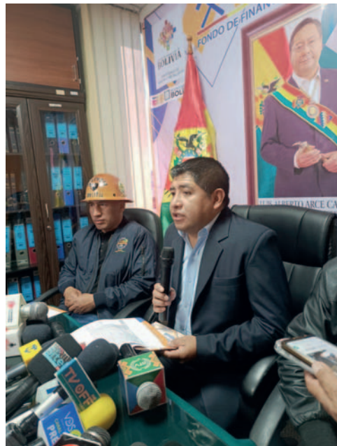
Los mineros cooperativistas ven con buenos ojos este trabajo coordinado con Fofim /Fofim