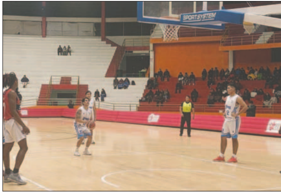
Leones tuvo un buen comienzo, ahora va por su segundo triunfo / RRSS

Sin tiempo para lamentarse, el Equipo de Saracho regresó rápidamente de la Villa Imperial para ultimar detalles de cara al segundo encuentro en la Liga Boliviana de Básquetbol (Libobásquet). Este viernes, desde las 20:30 horas, recibirán al equipo de Leones de Potosí en el coliseo conocido como el "nido del águila", donde buscarán hacer valer su localía y conseguir su primer triunfo en el torneo.