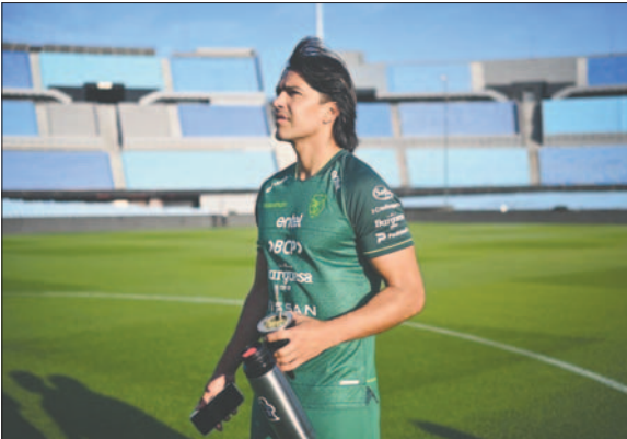
Marcelo Martins dejará el fútbol profesional el próximo 7 de abril

También militó en varios clubes chinos y en Brasil estuvo igualmente en las filas del Gremio y el Flamengo, otros dos de los clubes más tradicionales del país suramericano.