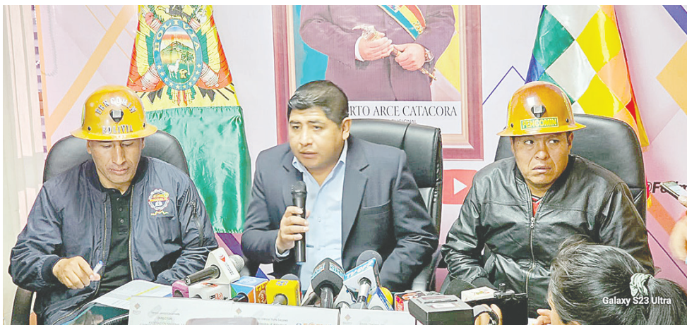
Las autoridades de Fofim informaron sobre los préstamos