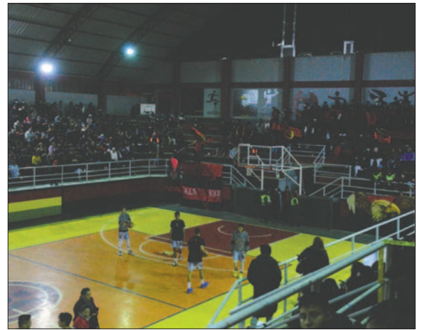
El coliseo del colegio Saracho albergará nuevamente a la Libobásquet / LA PATRIA

Para Saracho, la premisa es hacer respetar la casa y sumar la mayor cantidad de puntos posible para no tener dificultades en la cla-