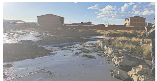
Se prevé que los resultados sean entregados el sábado

En el caso del agua potable, Oruro tiene dos instancias autorizadas para el suministro, el pri-