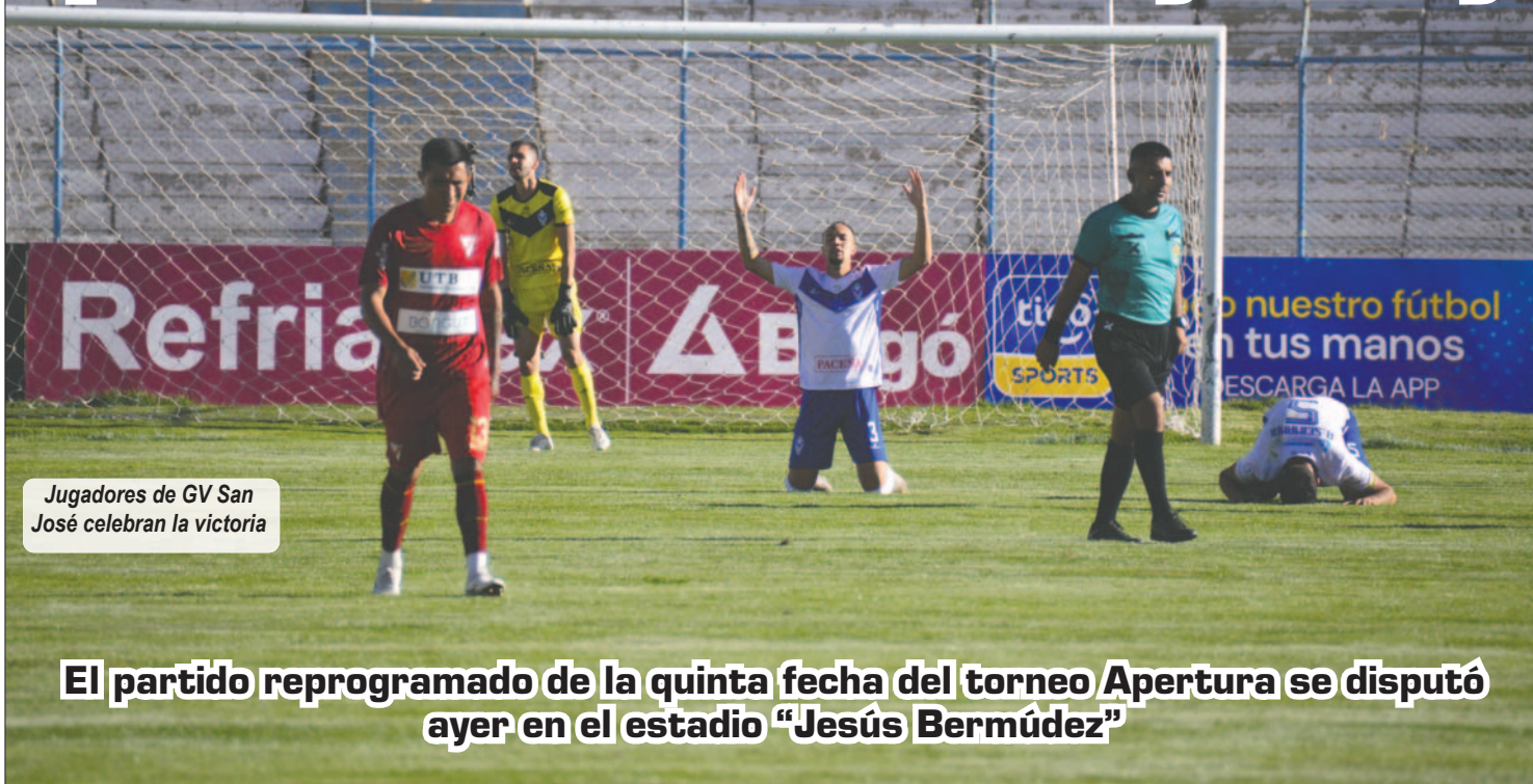
Jugadores de GV San José celebran la victoria

El partido reprogramado de la quinta fecha del torneo Apertura se disputó ayer en el estadio "Jesús Bermúdez"