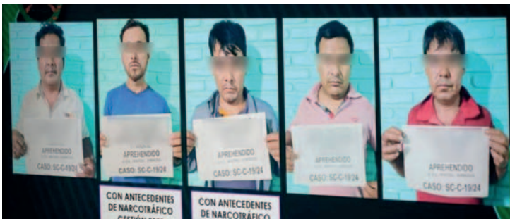
La Justicia determinó enviar a la cárcel, con detención preventiva, a las cinco personas que fueron aprehendidas en un operativo

Tres personas irán a la cárcel de Palmasola y dos a la cárcel de Okinawa. Fueron aprehendidas cuando intentaban comercializar 205 kilos de droga en el municipio de Santa Rosa