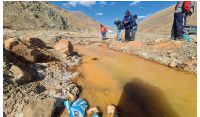
Un infante de 2 años superó los niveles permitidos de plomo en sangre

Estas pruebas fueron realizadas luego de que cuatro miembros de la comunidad dieran positivo por plomo,