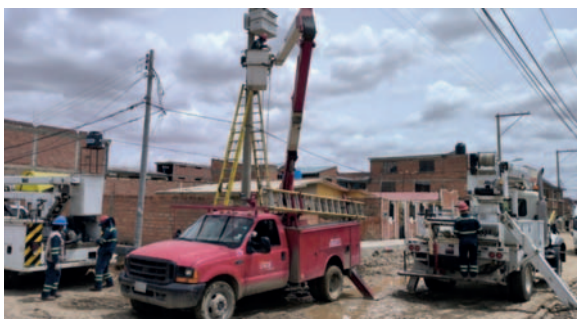
ENDE realizó trabajos de mantenimiento en Oruro, La paz y Beni

En Oruro, específicamente en la zona Norte de la ciudad, ENDE ha realizado diversas acciones para mejorar la infraestructura eléctrica. Entre las tareas ejecutadas se encuentran la reubicación de postes de concreto, el traslado del centro de transformación T-505, instalaciones de protecciones en baja tensión y recableado con cable trenzado. Estas labores fueron realizadas por cuadrillas especializadas utilizando equipos adecuados para minimizar las interrupciones en el servicio.