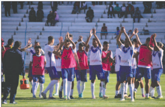
Jugadores de GV San José celebran el triunfo conseguido ante Always Ready

Pasaron tres años, tres meses y 21 días para que un equipo orureño celebre una victoria en la División Profesional, algo que sin duda alegró bastante a la gente amante del fútbol en Oruro.