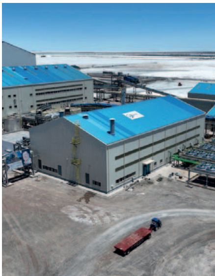
La directora de YLB confirmó la producción de 3 mil toneladas de litio