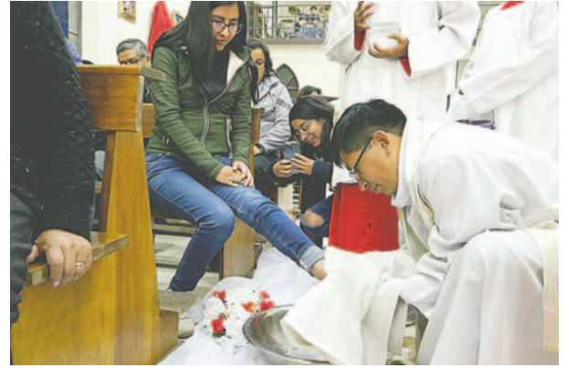
Lavatorio de pies representa un ejemplo de amor y servicio a los demás

Este año se observó una buena afluencia de fieles que realizaron su visita por los diferentes templos de la ciudad en familia. Efectivos de las fuerzas del orden fueron desplazados por las diferentes iglesias para resguardar la seguridad.