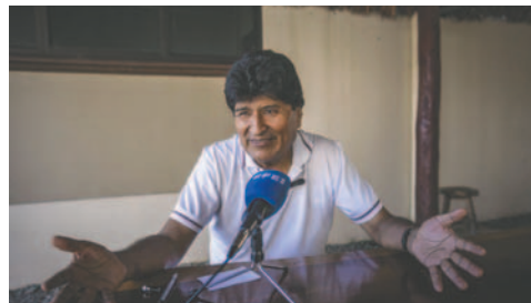
El expresidente de Bolivia Evo Morales en Villa Tunari

A la división por el aniversario del MAS se suma