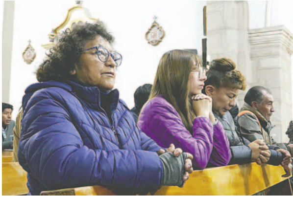
Famílias fueron parte de la misa de la Última Cena del Señor

Después de la misa, las familias realizaron la tradicional visita a los siete templos la cual simboliza el acompañamiento de los fieles a Jesús en cada uno de sus recorridos desde la noche en que fue apresado hasta su crucifixión.