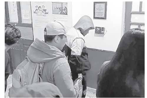
En las próximas horas un juez determinará si el sujeto es enviado a prisión preventiva

Ante esta situación, la Defensoría de la Niñez de Cochabamba señaló que todo indica un posible caso de proxenetismo y trata de personas, por lo que solicitará a la Fiscalía que la investigación se centre en estas figuras legales.