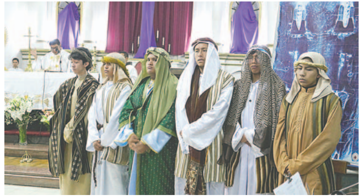
Estudiantes del Colegio San Francisco representaron a los apóstoles