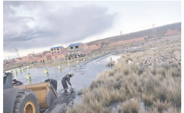
Autoridades departamentales iniciarán medidas legales en tres niveles por daño ambiental en el sector de Vinto - Socamani

Según detalló Paravicini, la medida administrativa podría tener como sanción máxima la suspensión de operaciones de la empresa, según el procedimiento. Ante el Tribunal Agroambiental se pretende que la instancia haga que EMSA garantice la reparación de los daños sufridos por las familias del lugar y la zona. Finalmente, la acción penal podría resultar en sanciones por el impacto ambiental.