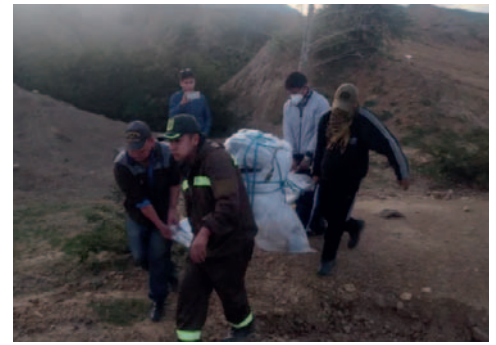
El cuerpo fue encontrado dentro de una bolsa y ésta al interior de un turril

Durante los primeros exámenes, se evidenció la existencia del turril que contenía el cuerpo en po-