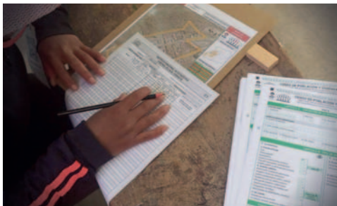
El INE comenzó el procesamiento de información

"Los problemas limítrofes que han dificultado la consecución del Cen-