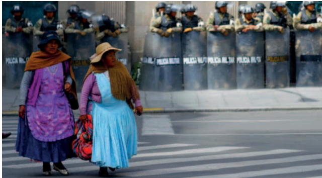
Se anuncian medidas de presión desde el ala “evista” del MAS/Meer

Según su criterio, los radicales no tienen nada que reclamar, especialmente sobre el congreso del MAS que es una de sus mayores polémicas, porque los estatutos establecen claramente que las organizaciones