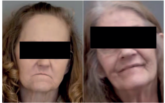
Las dos mujeres tienen extensos antecedentes penales