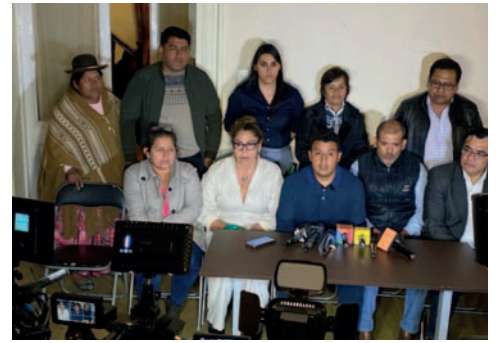
En la madrugada de este jueves 28 de marzo concluyó la etapa de impugnaciones, ahora viene la etapa del recurso de revisión

cal del Tribunal Supremo Electoral (TSE), Tahuichi Tahuichi, y el exmagistrado Gualberto Cussi, fueron nuevamente inhabilitados. Ambos amenazaron con presentar amparos constitucionales en contra de las resoluciones de las Comisiones Mixtas.