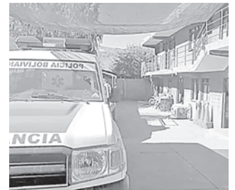
Vista interior del Comando Provincial de la Policía de Camargo

Paralelamente, la hermana de la menor le avisó a su mamá y juntas fueron hasta la Policía. Al llegar reclamaron por la adolescente, pero el sargento agresor