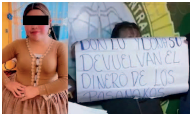
Las personas estafadas serían de diferentes departamentos e incluso habría algunas que son del exterior

Según la investigación preliminar, son 11 las víctimas que fueron captadas mediante ese medio, y cada una puso montos de 2.500 bolivianos. La acusada les había asegurado pagar de manera puntual. Sin embargo, los afectados aseguran que