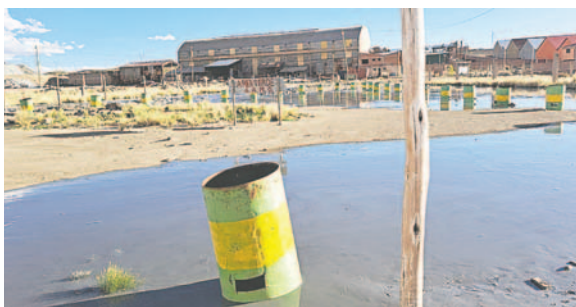
El colapso del dique de colas llegó hasta el río y gran parte de área e incluso casas

“Hemos elevado nuestros informes a la Secretaria de Medio Ambiente y hemos sido los primeros en estar en el sector del desborde del dique de la EMSA