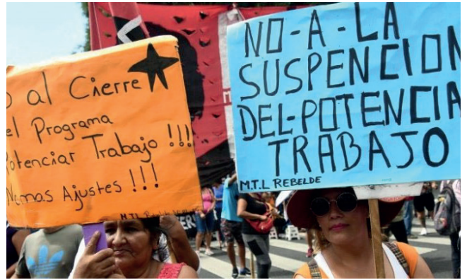
Una protesta en Argentina contra la suspensión del programa Potenciar Trabajo

Sin embargo, los manifestantes que presentaron el amparo consideran que la suspensión de estos pagos es inconstitucional, discriminatoria y