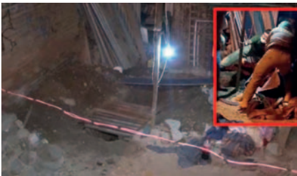
La Fuerza Especial de Lucha Contra el Crimen (Felcc) encontró el cuerpo de un hombre enterrado en el patio de una vivienda