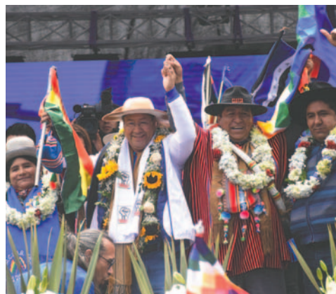
El Presidente Luis Arce junto a dirigentes de sectores sociales afines al MAS

Luis Arce y Evo Morales están distanciados debido a las tensiones internas en el oficialismo que comenzaron a finales de 2021 y que se profundizaron por el congreso nacional del MAS celebrado en octubre pasado en el Trópico de Cochabamba, el bastión político y sindical del