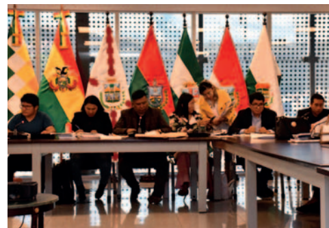
Las comisiones revisaron la documentación de los postulantes y advirtieron la falta de mujeres en algunos espacios

"Quiero decirle al pueblo boliviano que haremos todo lo posible para que tengamos elecciones judiciales y autoridades judiciales. Hay varias op-