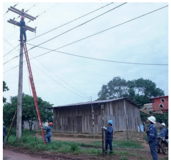
El objetivo es mantener operativas las redes eléctricas en el país

A través del Plan Anual de Mantenimiento se busca mantener operativas las redes eléctricas dis-