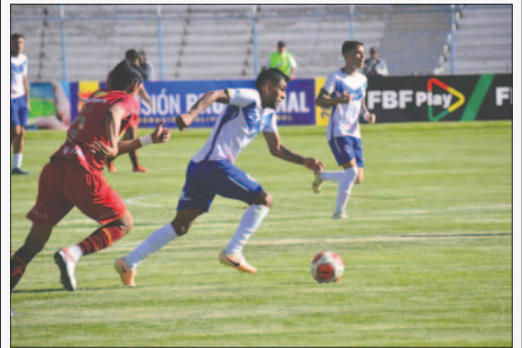
GV San José dejó el último lugar en la tabla acumulativa

Hrs. 20:00.- Cochabamba: Wilstermann vs. GV San José