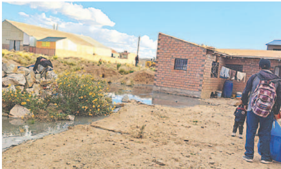
El material tóxico llegó a algunas viviendas

Aunque EMSA tenía permiso como comercializadora, que funciona desde hace más de 10 años, no obtuvo la licencia ambiental para el dique de colas que colapsó porque no presentó un plan de medidas correctivas. Por lo tanto, esta ampliación de actividad se realizó de manera ilegal, presumiblemente desde 2022, según se detalló.