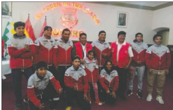
Los pilotos orureños listos para el nacional de motociclismo