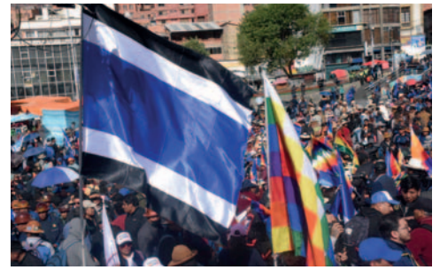
El congreso del MAS convocado por afines al gobierno está en duda

La pasada jornada, Ponciano Santos amenazó con “convulsionar el país” si es que el Tribunal Supremo Electoral (TSE) no reconoce el congreso del MAS en Lauca Ñ como el único legítimo. Además, declaró que Evo Morales será Presidente en 2025, por las buenas o por las malas, y que también habrá movilizaciones si se lo inhabilita.