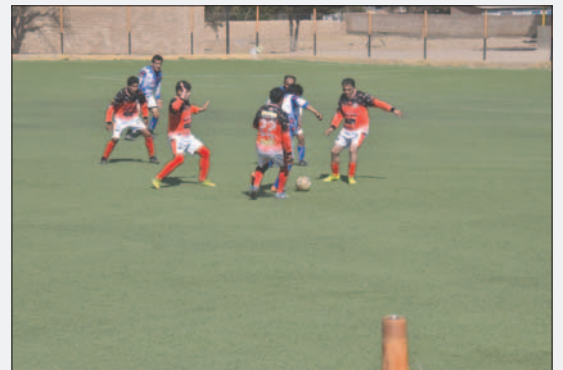
Seis partidos importantes en el cierre del torneo de exfutbolistas / LA PATRIA

Súper Máster - por el título Hrs. 15:30.- España FC vs. Deportivo Catco