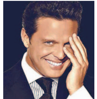
El "Sol de México" anunció la cancelación del concierto por problemas logísticos atribuidos a bloqueos en el país

Para acceder a este programa de devolución, las personas titulares de la compra deben dirigirse al sitio web oficial de la empresa organizadora ( www.viesgroupbo.com ), descargar un formulario, llenarlo y enviarlo junto a una copia del carnet de identidad y la entrada escaneada al correo soporte@viesgroupbo.com.