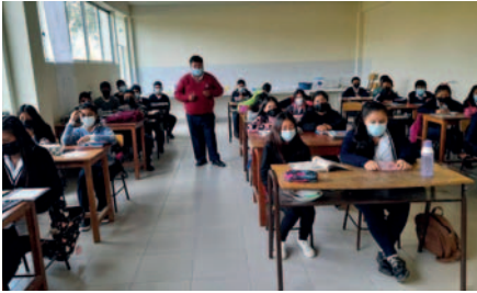
Educación recalca que se implementen protocolos y medidas de bioseguridad en colegios