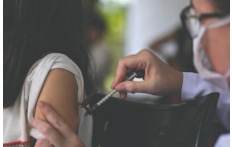
Una profesional de la salud aplica una dosis de la vacuna contra el dengue, en Brasilia (Brasil), en una fotografía de archivo