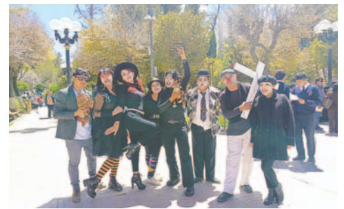
Actores presentan teatro callejero para conmemorar el 27 de marzo