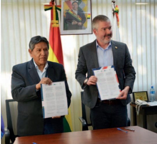
Firman Memorándum de Entendimiento que busca cooperación técnica en áreas estratégicas de investigación geológica

La reunión contó con la presencia de diplomáticos de la embajada británica