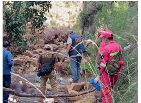
La víctima fue hallada cerca del río de Kuchu Tambo

Cuando el fiscal de turno, el médico del Instituto de Investigaciones Forenses (IDIF) junto a la Policía se hicieron presentes en el lugar del hecho, se procedió al registro del lugar donde se observó el cadáver y manchas pardo rojizas en diferentes lugares del río, así también se