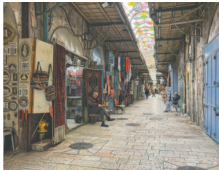
La Ciudad Vieja de Jerusalén vacía por el impacto de la guerra en la Franja de Gaza

Pero para los pocos cristianos que han decidido hacer el viaje en estas fechas, la falta de aglomeraciones y de colas para visitar los lugares sagrados compensa con creces la incertidumbre.