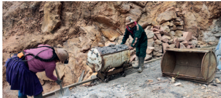
El objetivo es mecanizar a las cooperativas mineras