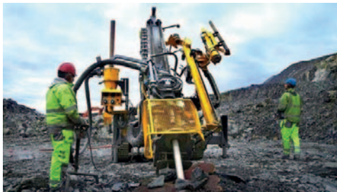
Funcionario aseguró que el Perú cuenta con garantía de una estabilidad jurídica y tributaria

En el año 2023, el sector minero enfrentó desafíos, pero se destacaron señales positivas. Se aprobaron alrededor de 28 proyectos de exploración por la Dirección General de Minería, representando una inver-