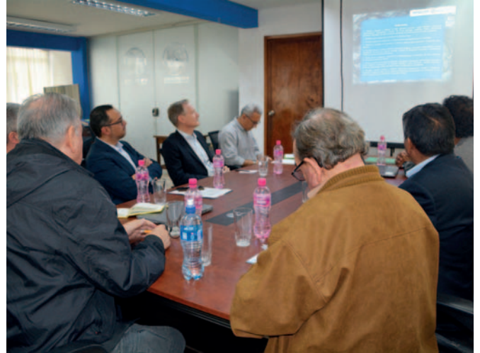
Integrantes de Sergeomin y el Servicio Geológico Británico