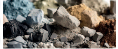
Las tierras raras o minerales raros representan una pieza fundamental en la cadena de suministro de nuevas tecnologías