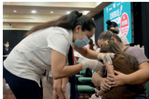
Los centros de salud de primer nivel cuentan con las pruebas necesarias para diagnosticar la influenza

En cuanto a la vacunación contra la influenza,