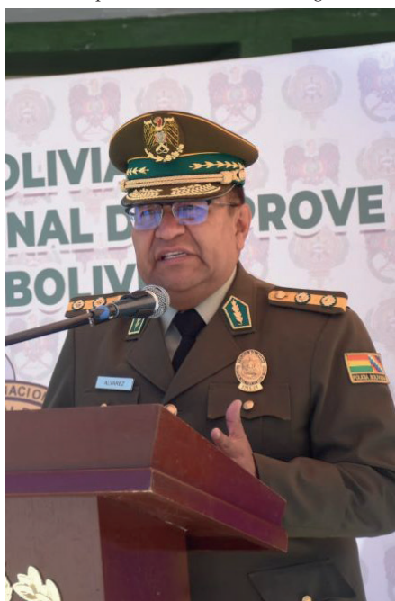
El comandante de la Policía, general Álvaro Álvarez

En relación a las críticas sobre las armas con mira telescópica, el ministro Del Castillo señaló que estas son necesarias para mejorar la efectividad en operativos contra el narcotráfico en una región conocida por su actividad ilegal.