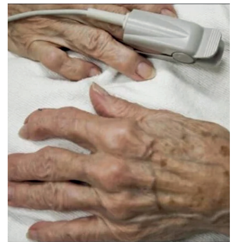
La mujer fue hospitalizada tras enterarse que su inquilina se habría convertido en la propietaria de su casa /REFERENCIAL

Las vecinas protestan contra este acto injusto y claman por justicia para la fallecida. La falta de respuesta por parte de las autoridades ha generado indignación en la comunidad, que exige una investigación exhaustiva sobre este caso para evitar situaciones similares en el futuro.