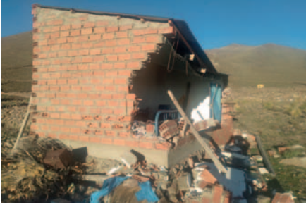
La casa quedó inhabitable, denunció el hombre