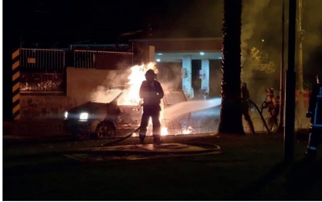
El vehículo ardió en llamas luego de cargar combustible en un surtidor

La Agencia Nacional de Hidrocarburos (ANH) establece que la venta de combustible en bidones u otros recipientes está permitida entre las 13:00 y las 15:00 en las estaciones autorizadas en Cochabamba. Sin embargo, el surtidor donde ocurrió el incendio no estaba autorizado para esta práctica, lo