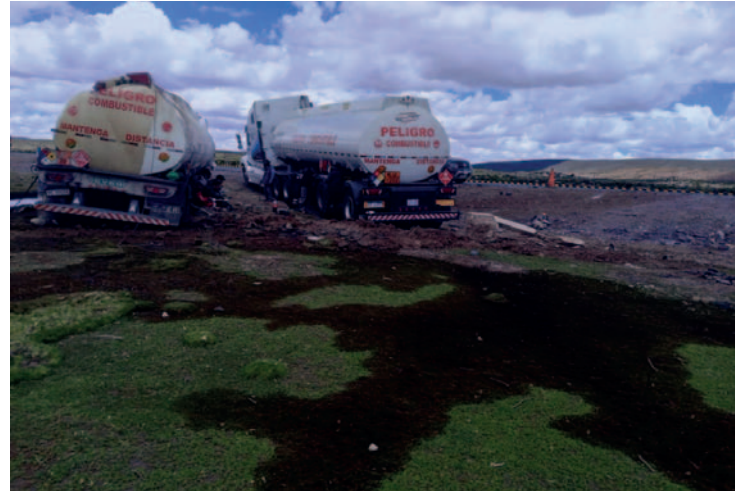
Zona de pastoreo de animales con combustible derramado

Por su parte, desde la Secretaría Departamental de Medio Ambiente de la Gobernación, ayer por la mañana se hizo conocer a LA PATRIA que nadie