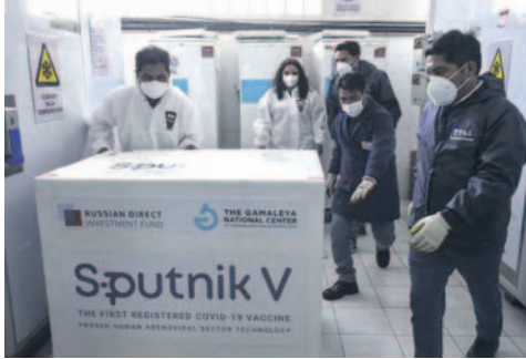
Adquisición de vacunas Sputnik V, en 2021

B olivia enfrenta una posible demanda internacional por parte de una empresa rusa debido a una deuda pendiente por la adquisición de vacunas Sputnik V. La Procuraduría General del Estado (PGE) busca conciliar la deuda tras el contrato firmado en diciembre de 2020, lo que podría desencadenar un arbitraje en Singapur.