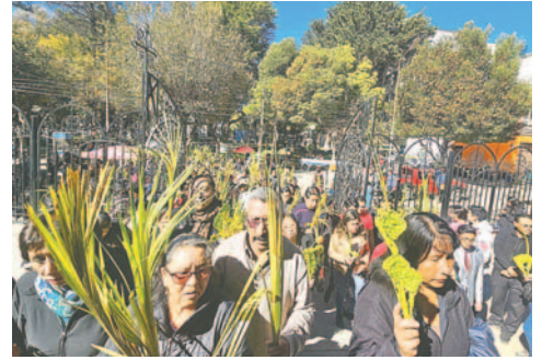
Oruro vive la Semana Santa con diversas actividades culturales y religiosas

En ese sentido, se anunció que se desplegará a la Guardia Municipal