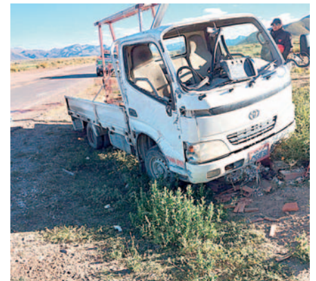
El motorizado sufrió daños de consideración /TRÁNSITO

El Ministerio Público está al tanto del caso y se espera que se tomen medidas legales correspondientes.