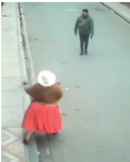
Las cámaras de seguridad capturaron al sujeto amedrentando a sus víctimas