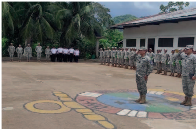
Entre las cuatro víctimas, dos son menores de edad y los otros dos son mayores de 18 años

Por aproximadamente una hora, el sargento habría golpeado a los conscriptos, propinándoles patadas y puñetes. Entre las cuatro víctimas