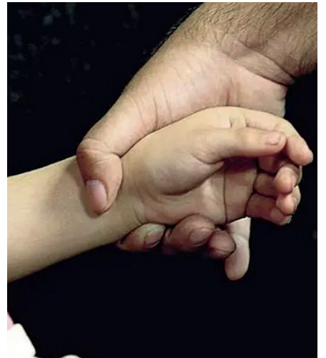
El agresor fue aprehendido por la Felcv. La víctima confesó a su madre los abusos que cometía a diario su papá / REFERENCIAL