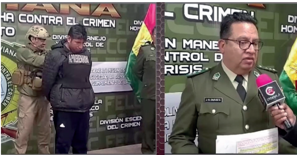
Cae chofer que atracaba a sus pasajeros en su minibus