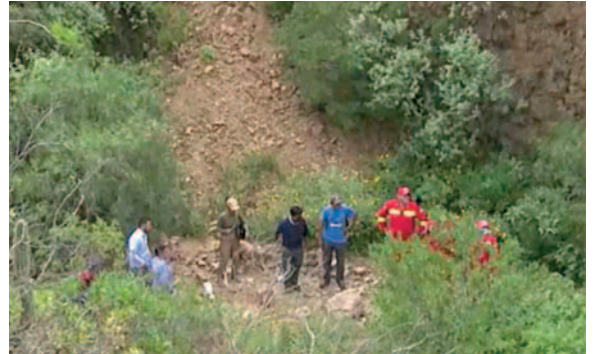
El cuerpo fue encontrado en un barranco cerca de un río en Pacata Alta

Posteriormente, el personal de Homicidios trasladó el cuerpo al Instituto de Investigaciones Forenses (IDIF) para llevar a cabo una autopsia y determinar las causas exactas del fallecimiento de la ahora occisa.