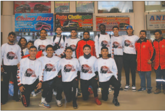
Saracho quiere tener un buen inicio en la Libobásquet

tica liviana al mediodía en el coliseo de la calle Potosí y Montesinos, los jugadores del equipo de Saracho fueron citados a las 16:30 horas en la Estación de Autobuses Oruro. Allí tomaron el ómnibus que los trasladó hasta la Villa Imperial, donde pernoctaron en un céntrico hotel. Este miércoles por la mañana realizarán el reconocimiento del campo de juego y luego los preparativos para el encuentro contra el equipo de la banda roja.