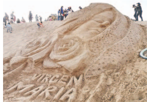
Cuenta regresiva para las Esculturas en Arena

"La novedad para Oruro y el mundo, es la construcción de las esculturas de arena van a tener un alto de nueve metros y un ancho de seis en promedio, esa va a ser una calidad de obras que van a estar en los Arenales de Cochiraya y los