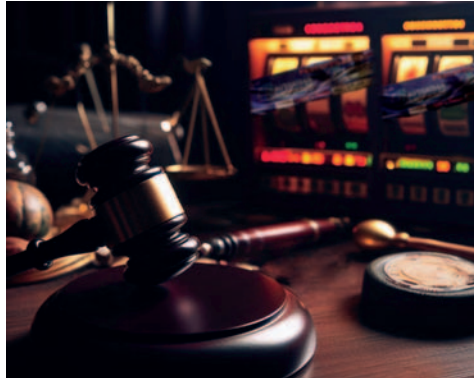
Una persona fue sentenciada por enriquecimiento ilícito al tener una casa de juego ilegal /REFERENCIAL

Los propietarios de estos sitios serán procesados en resguardo de los derechos de la población boliviana a participar en juego de azar de forma legal, transparente y con mecanismos que ayuden en la prevención de la ludopatía.