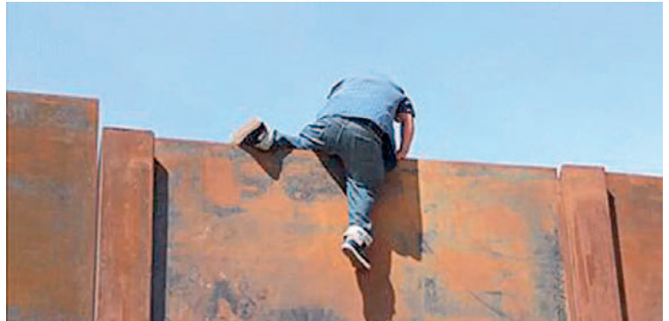
El sujeto trepó un muro para cometer el delito /REFERENCIAL

De momento las autoridades continúan investigando este caso para determinar, según las leyes vigentes, los delitos exactos por los que se imputará al sujeto y determinar la cantidad de años de cárcel a los que podría ser sometido, considerando el agravante de que la víctima era menor de edad y además que el hecho se hizo tras ingresar de manera ilegal al hogar de la adolescente.