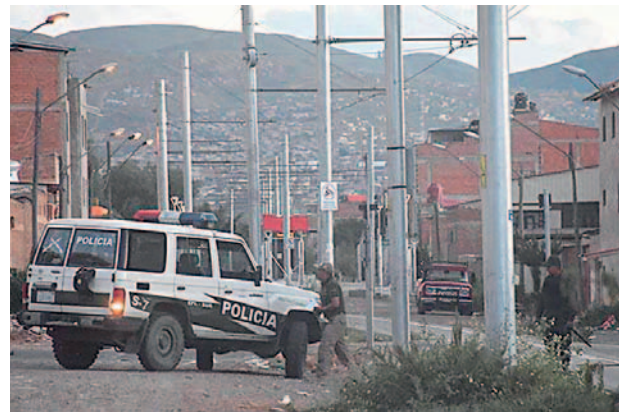
Las disputas entre pandillas ocurrieron el lunes y la Policía intervino

Según declaraciones de vecinos quienes también fueron testigos presenciales de este enfrentamiento, aseguran que la violencia desatada entre las pandillas ha aumentado en los últimos meses, poniendo en riesgo la seguridad y tranquilidad de los habitantes del sector sur de Cochabamba. La falta de medidas preventivas por parte de las autoridades locales ha generado preocupación en la comunidad sobre la escalada de estos conflictos callejeros.