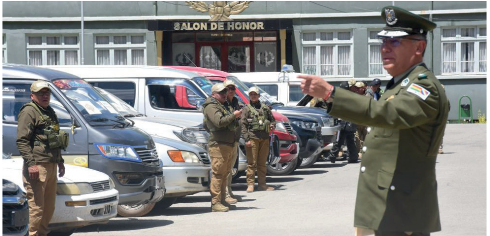
Vehículos fueron recuperados y entregados a sus dueños legítimos