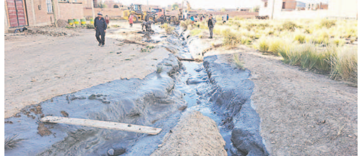
El derrame hizo que el lodo avance rápido e incluso entro a las viviendas

Según información extraoficial, desde la empresa argumentaron que, por las constantes lluvias, se remojó la parte Este del talud y se desplomó la pared, por ello se derramó el