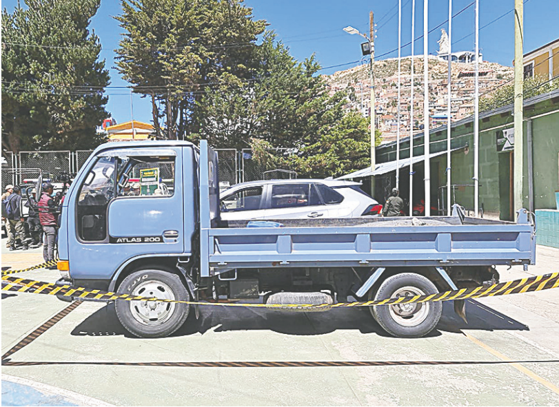
La camioneta fue sustraída en Arica y hallada en Totorá