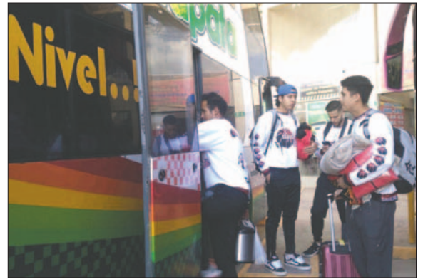
El equipo de Saracho que viajó a la Villa Imperial con la ilusión de ganar

Sin duda, un debut complicado para el equipo orureño, pero sus jugadores son conscientes que deben afrontar todos los encuentros con el mejor espíritu y ganar todo lo necesario para obtener los primeros lu-