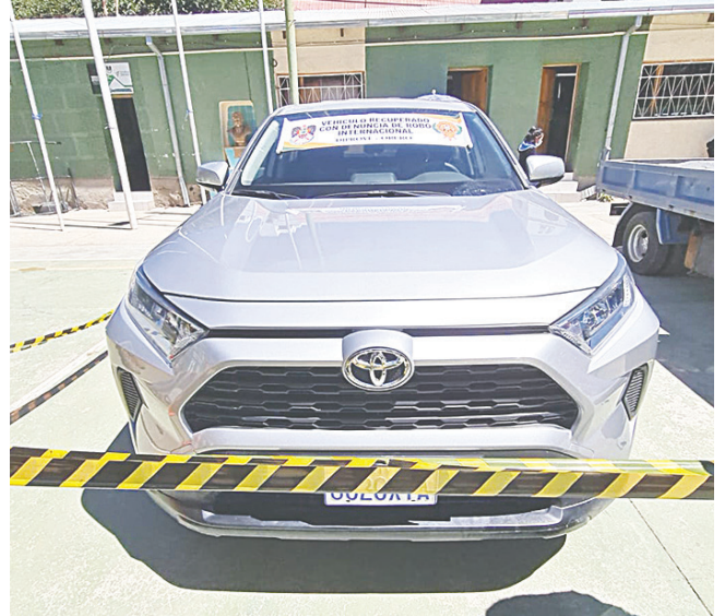
El segundo motorizado confiscado tenía el número de chasis modificado