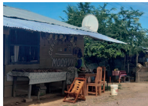
El juez determinó 15 años de cárcel que deberá cumplir en el penal de Mocoví

"Dentro de este caso se presentó la denuncia verbal de la madre en con-