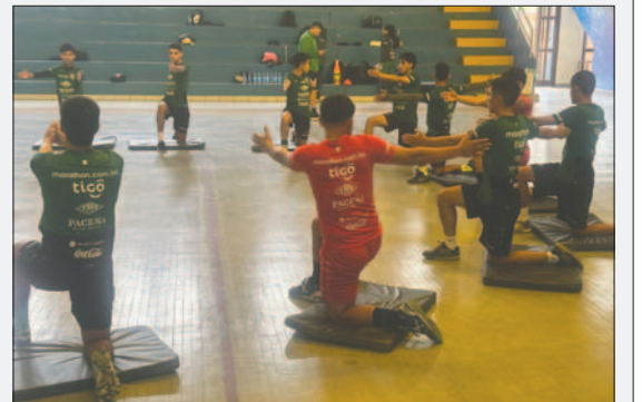
La selección nacional de fútbol entrena en el Cefed de Cochabamba

El combinado nacional se entrena desde hace algunas semanas en el Centro de Formación y Entrenamiento Deportivo (Cefed) de La Tamboorada, en Cochabamba. Trabajan 12 jugadores, pero la lista final se reducirá a 10 en los primeros días de abril.