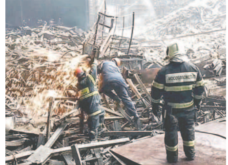
Una imagen fija tomada de un video distribuido por el Ministerio de Situaciones de Emergencia de Rusia muestra a los rescatistas limpiando los escombros y extinguiendo incendios en la sala de conciertos Crocus City Hall después de un Ataque a tiros en Krasnogorsk, en las afueras de Moscú, Rusia, el 23 de marzo de 2024

Las autoridades rusas han detenido a once personas en relación con el atentado, cuatro de las cuales fueron acusadas de ejecutar la matanza y pueden ser condenadas a cadena perpetua.