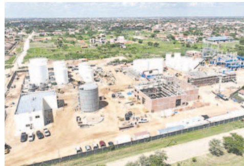
Construcción de la Planta de Biodiésel FAME I en Santa Cruz/YPFB

La construcción de la planta comenzó en 2022 y tendrá una capacidad nominal de producción de 1.500 barriles de biodiésel por día, pudiendo llegar a los 2 mil barriles en plena operación. Además del biodiésel, la planta también producirá borra, materia grasa y glicerina, según datos de YPFB.