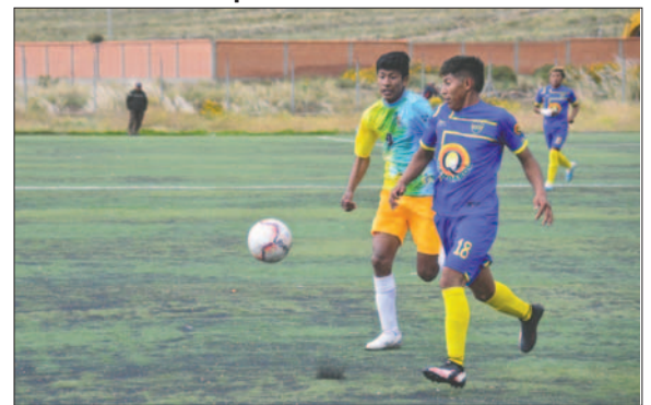
Boca Juniors tendrá dos encuentros de local en la ronda de las revanchas

Desde las 10:00 horas, en la cancha del Sindicato de Colectivos, Micros y Minibuses en Servicio Urbano (minis celestes), ubicada en la zona Oeste de la ciudad, el equipo de Litoral de Coipasa será local frente al plantel de Municipal Bolívar Antequera. Este partido es crucial para ambos equipos, ya que no querrán repetir el empate 1-1 del partido de ida, un resultado que perjudicaría a ambos conjuntos. El equipo "minero" actualmente tiene 5 puntos, mientras que los "fronterizos" tienen 4 unidades. El que obtenga las tres unidades dará un salto cualitativo