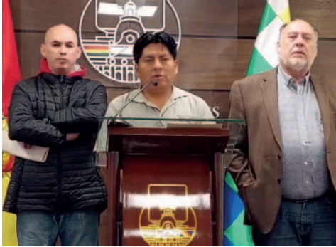
La propuesta tiene por objetivo recuperar las interpelaciones contra ministros /CAPTURA DE VIDEO