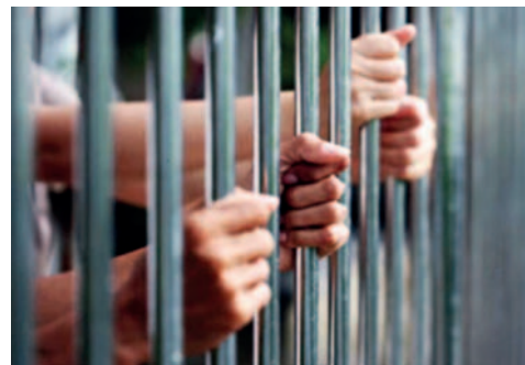
Los responsables de la muerte del joven ya tienen sentencia /REFERENCIAL