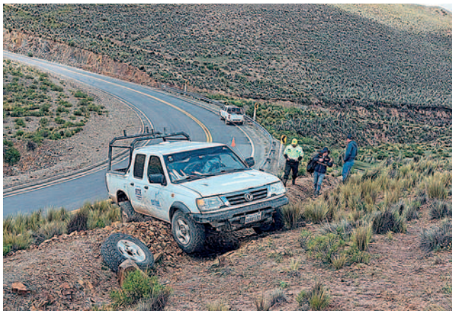
El motorizado quedó a un lado de la carretera

Tras las investigaciones pertinentes, se confirmó que el conductor estaba sobrio al momento del accidente y poseía licencia categoría C. El vehículo implicado, es una camioneta blanca