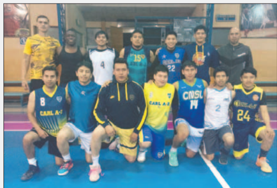
El cuadro azul y amarillo ya tiene al plantel listo para la Libobásquet

El equipo orureño ya tiene casi todo listo para el encuentro del sábado, que se llevará a cabo a partir de las 20:00 horas en la cancha oficial "Luis Lazzo Quinteros".