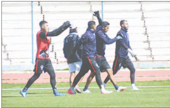
Los jugadores aprovecharon bien el entrenamiento en el "Bermúdez"