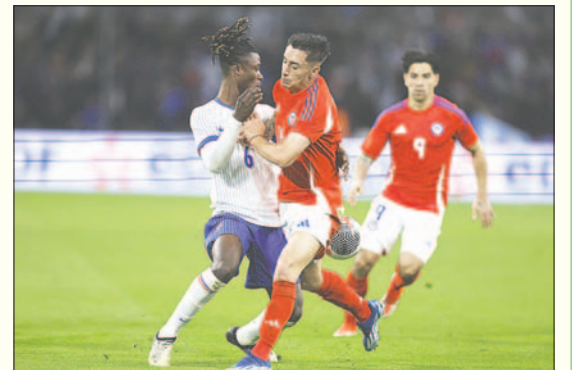
Una acción del partido entre Francia y Chile