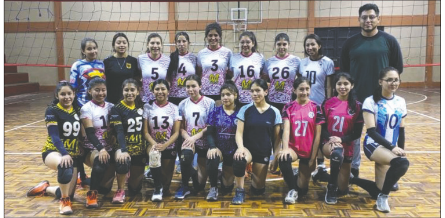
El conjunto orureño comenzará el certamen rivalizando con Santa Ana

El equipo orureño de Avidal está preparado para enfrentar este certamen con el objetivo de obtener buenos resultados y alcanzar los primeros lugares en la serie para luchar por la clasificación a la Liga Promocional de Voleibol. Ya se ha conformado el equipo con las 12 jugadoras que formarán parte del mismo y confían en lograr buenos resultados. Entre las protagonistas se encuentran jugadoras de alto nivel