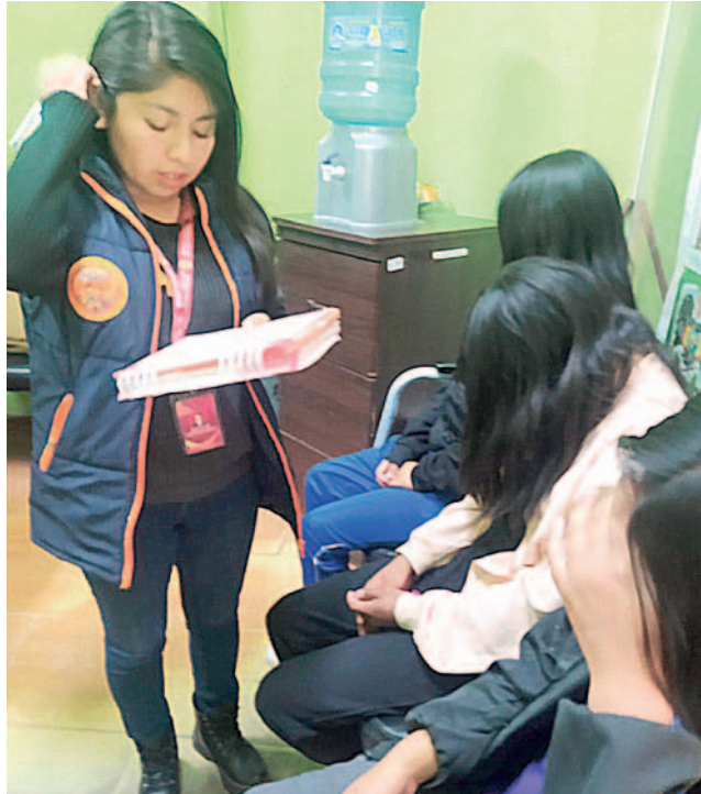
Las menores fueron interceptadas por agentes de la policía que patrullaban la ciudad y entregadas a la DNA /DIO

“Junto con la Dirección de Igualdad de Oportunidades, estaremos haciendo el seguimiento correspondiente y recomendando siempre a nuestra población en general un mayor control sobre sus hijos, especialmente cuando son estudiantes”,