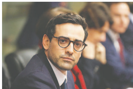
Foto de archivo del ministro francés de Exteriores, Stéphane Séjourné

Y aunque no se adelantaron datos sobre la disputa territorial ante la Corte Internacional de Justicia, Francia y Guyana aseguraron que ambos comparten el mismo compromiso de valores democráticos y de respeto hacia la ley internacional, la soberanía y la integridad territorial de los estados.