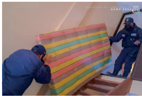
Decomisan mobiliario durante la clausura de la casa de citas

Durante el operativo, la persona a cargo admi-