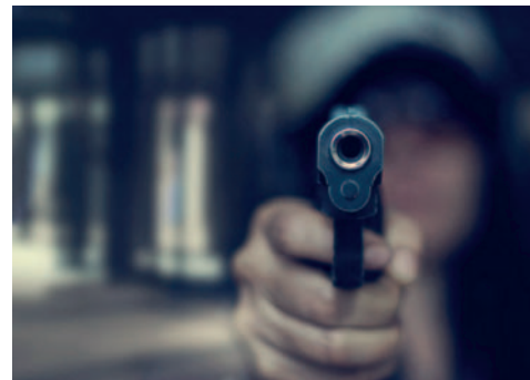
El sujeto amenazó a su expareja con un arma de fuego /REFERENCIAL

La fiscal departamental de Cochabamba, Nuria Gonzáles, informó que, durante la jornada del Censo de Población y