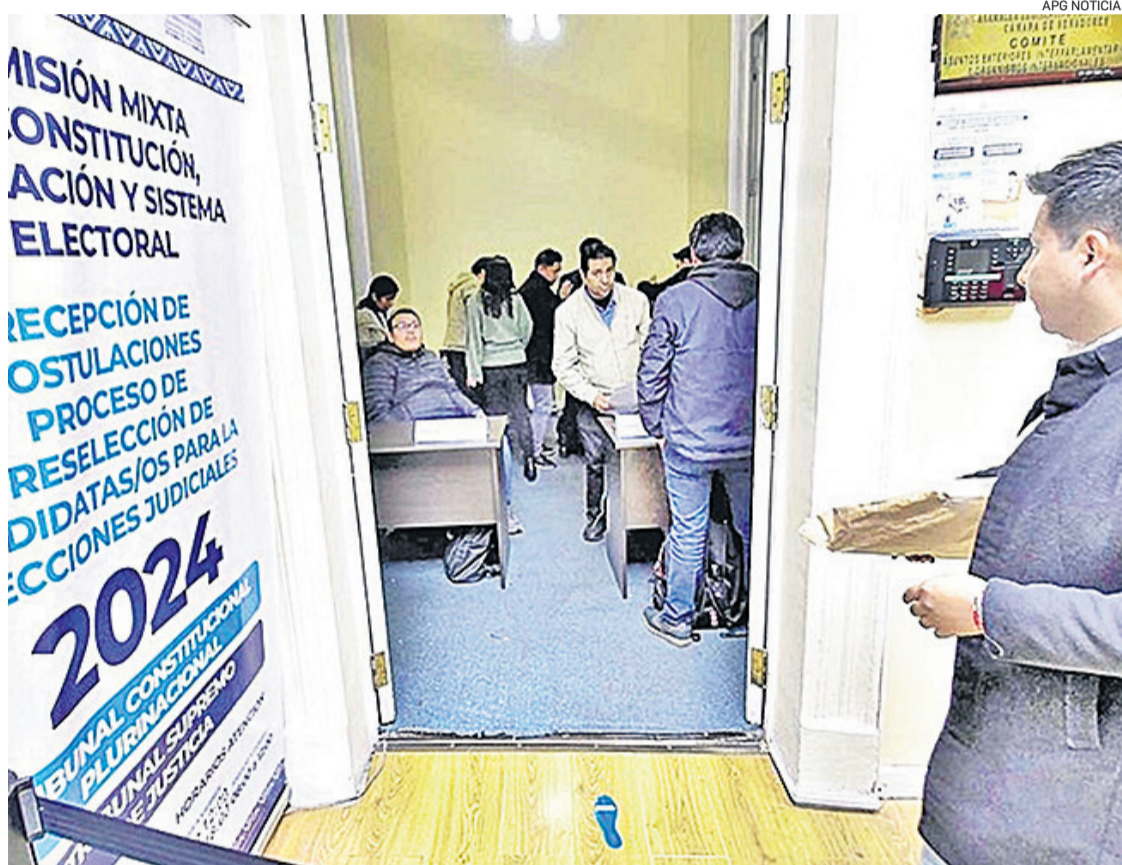
Las comisiones volverán a recibir quejas de inhabilitaciones, esta vez en segunda instancia

Habrán para tratar los recursos de apelación que lleguen hasta el parlamento