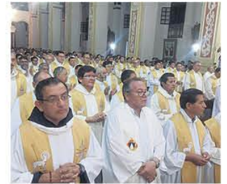
La misa crismal en la Catedral

durante más de una década. Los acusaron de separatismo. El proceso no llegó a su fin. Las denuncias avanzan en la CIDH. A2-3