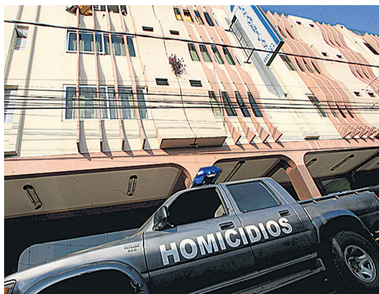
El frontis del hotel Las Américas, en Santa Cruz de la Sierra.

derechos humanos. Adoptar las medidas de compensación económica y satisfacción; Disponer las medidas de atención en salud física y mental necesarias para la rehabilitación de las víctimas; iniciar una investigación penal para esclarecer los hechos, identificar a los responsables e imponer sanciones por las graves violaciones de derechos humanos. Hasta la fecha, el Estado boliviano no cumplió ninguna de las recomendaciones.