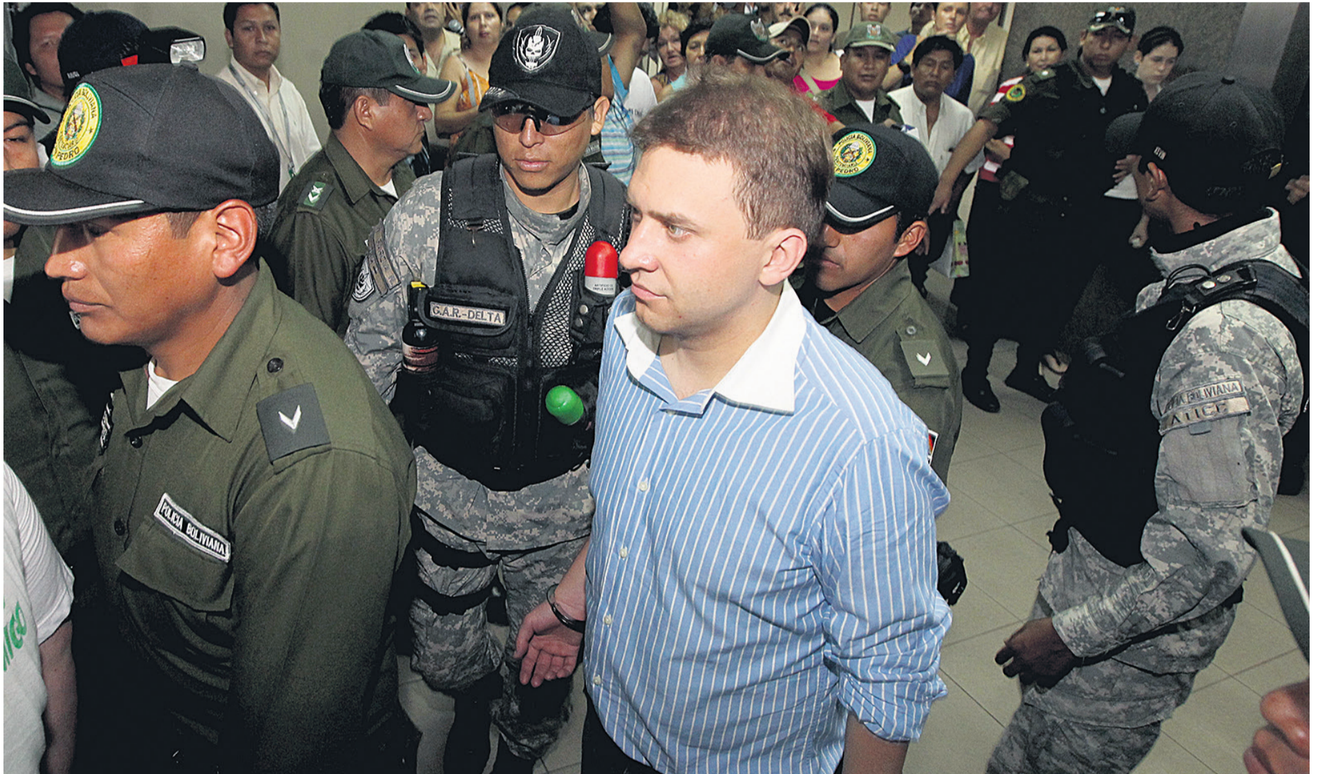
El húngaro Elöd Tóásó fue inculcado por el gobierno de Evo en el supuesto caso de Terrorismo que estalló en Santa Cruz de la Sierra, cuando hubo el asalto al Hotel Las Américas.