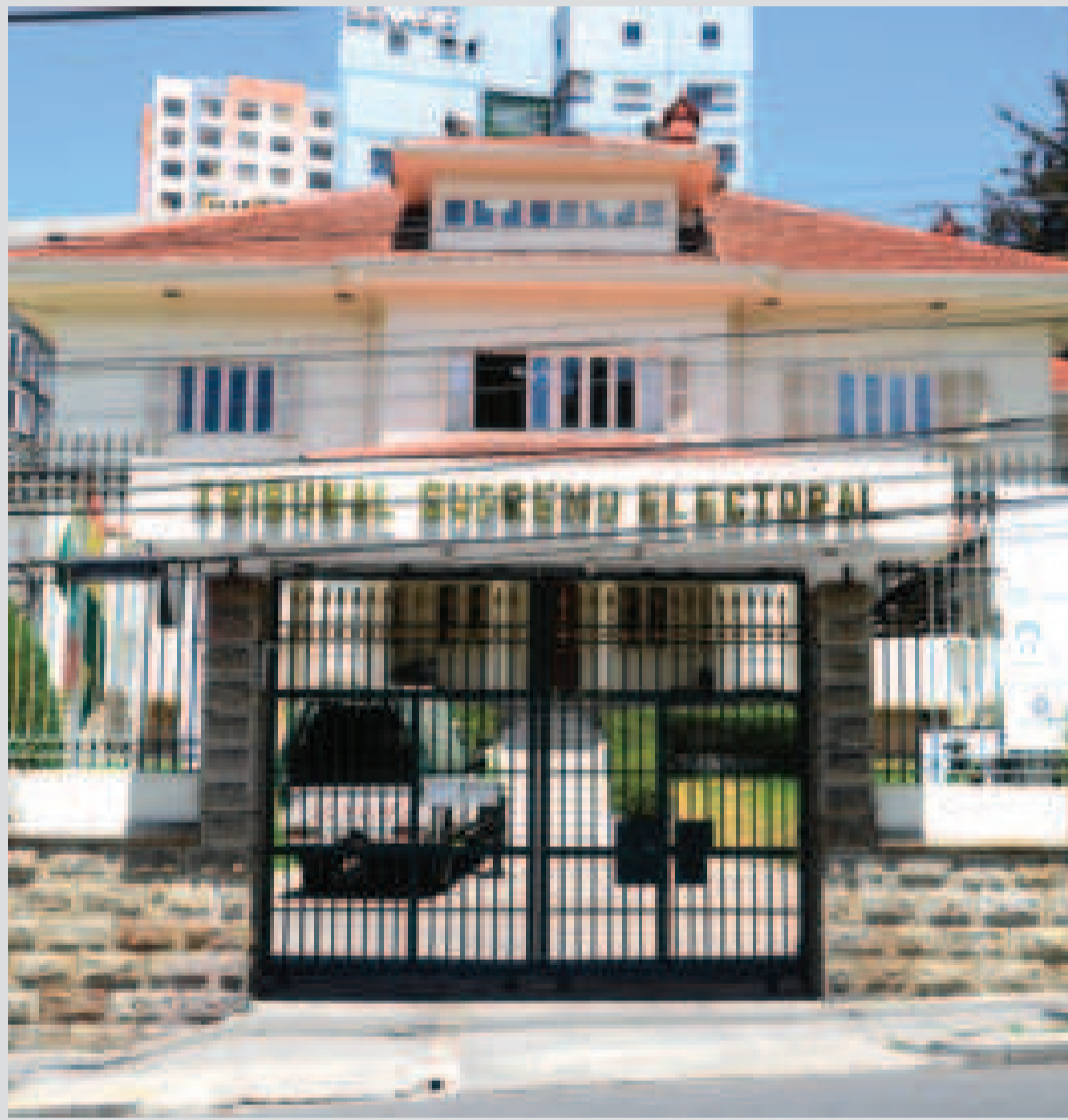
Frontis del TSE en la ciudad de La Paz.