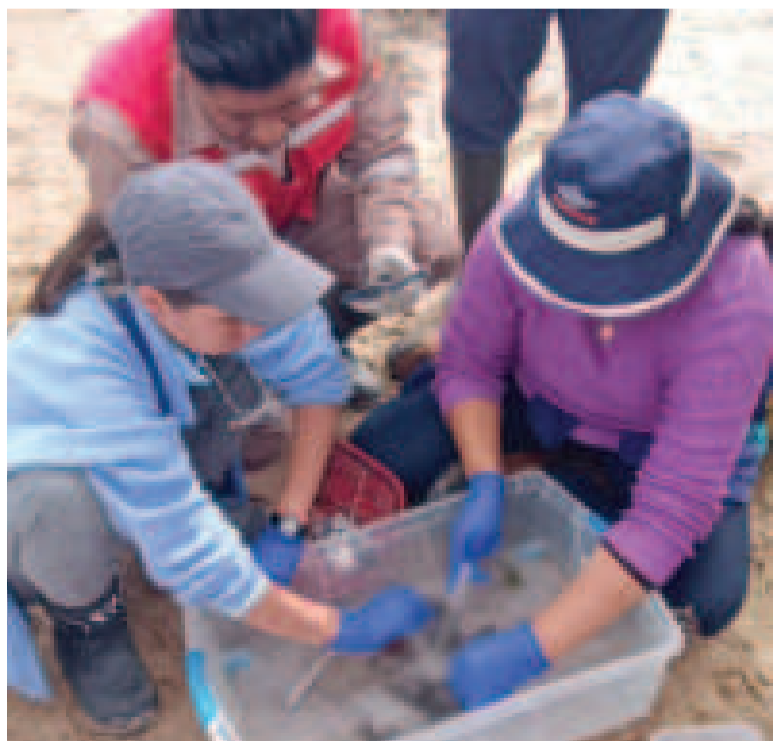
Personal técnico en la recolección de las pruebas.