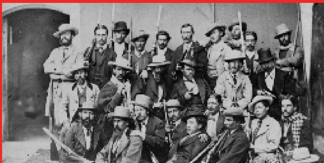
Defensa de Calama, 23 de marzo de 1879.

Durante la etapa de alegatos orales Chile había reconocido que Bolivia tiene derechos sobre la canalización instalada en las aguas del Silala, lo cual fue ratificado en el fallo. En consecuencia, el Estado Plurinacional consolida su derecho soberano a decidir si es que mantiene los canales o decide desmantelarlos.