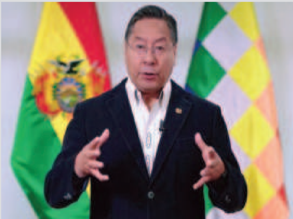
El presidente Luis Arce durante su mensaje del viernes en la noche.