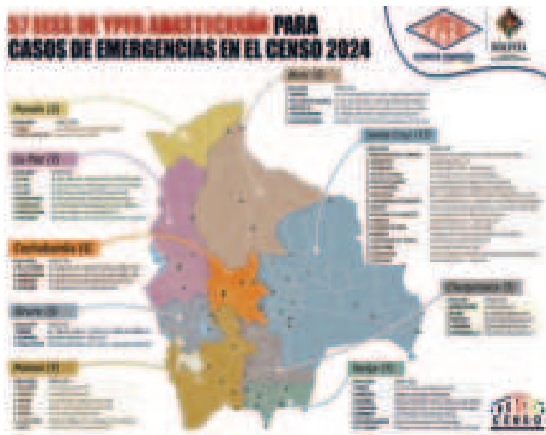
La distribución de los surtidores habilitados en el país.