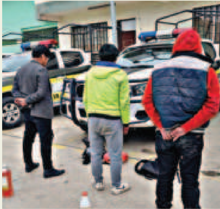
Detenidos en La Paz por incumplir el Auto de Buen Gobierno por el Censo 2024.

“Vamos a salir a hacer las inspecciones respectivas, entendemos que ya hay arrestados, entonces va a existir una jornada muy ardua, es por eso que estamos poniendo fiscales de turno para que puedan estar presentes ante cualquier situación”, añadió Alave.