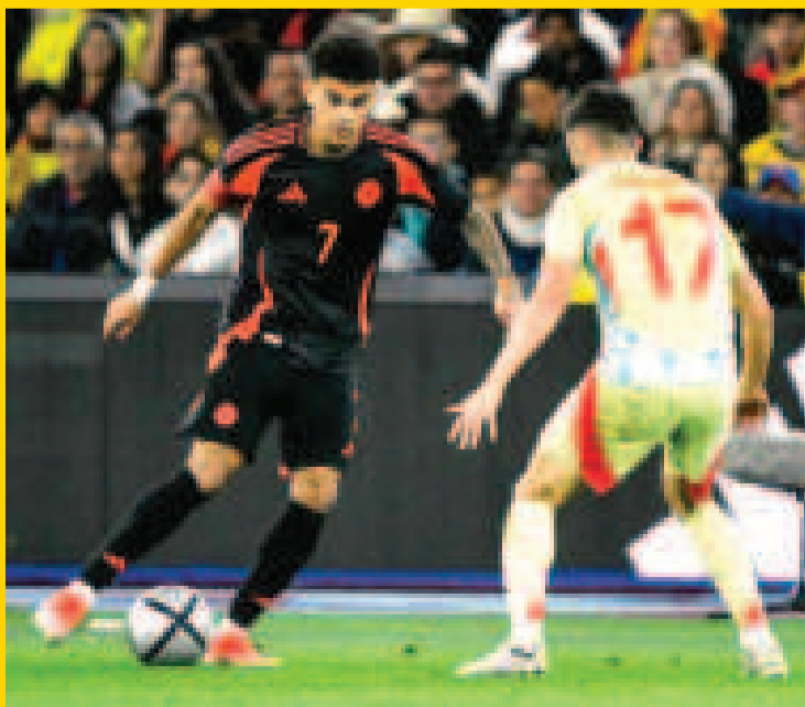
Una escena del cotejo amistoso entre Colombia y España.