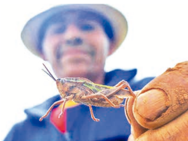
Un agricultor agarra con sus dedos una langosta.

Panorama. Las autoridades locales descartan declarar emergencia porque consideran que la afectación no es muy significativa. Se han tomado algunas medidas para eliminar al insecto, como el fumigado