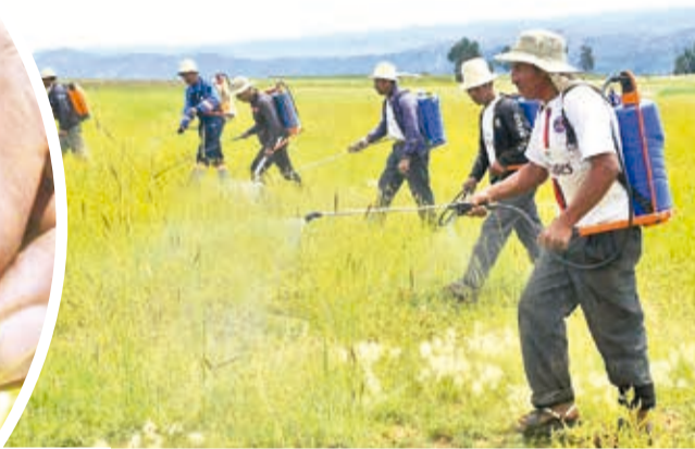
Pobladores fumigan los campos infestados de langostas.