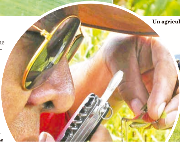
El entomólogo observa una langosta.

“La situación no es para declarar emergencia, no es una