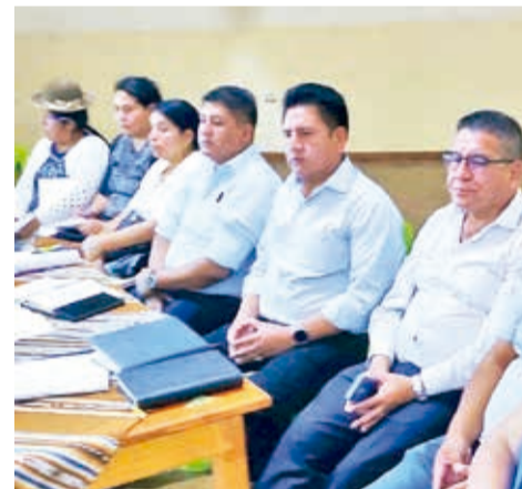
La asamblea que realizó Sacaba el lunes por el fallo del TSJ. DANIEL JAMES