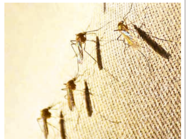
Los mosquitos que proliferan en época de lluvia.