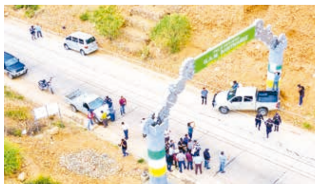
El portal de Santiváñez en el límite con Cercado. GAMC

ciliar se encuentra con la frontera con Cercado. Pinto indicó que próximamente se reunirán con los técnicos de ambos municipios para resolver la disputa de este sector.