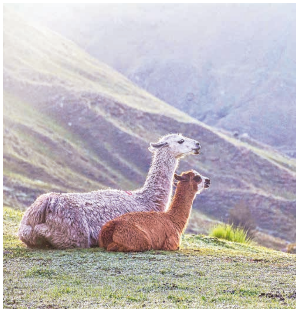
MARAVILLAS DE TIRAQUE. Esta llama y su pequeña cría descansaban en la cumbre de un cerro del valle alto con el paisaje andino visto desde las alturas.

ENVÍENOS SUS FOTOS PARA PUBLICARLAS EN ESTA SECCIÓN: fotografia@lostiempos-bolivia.com