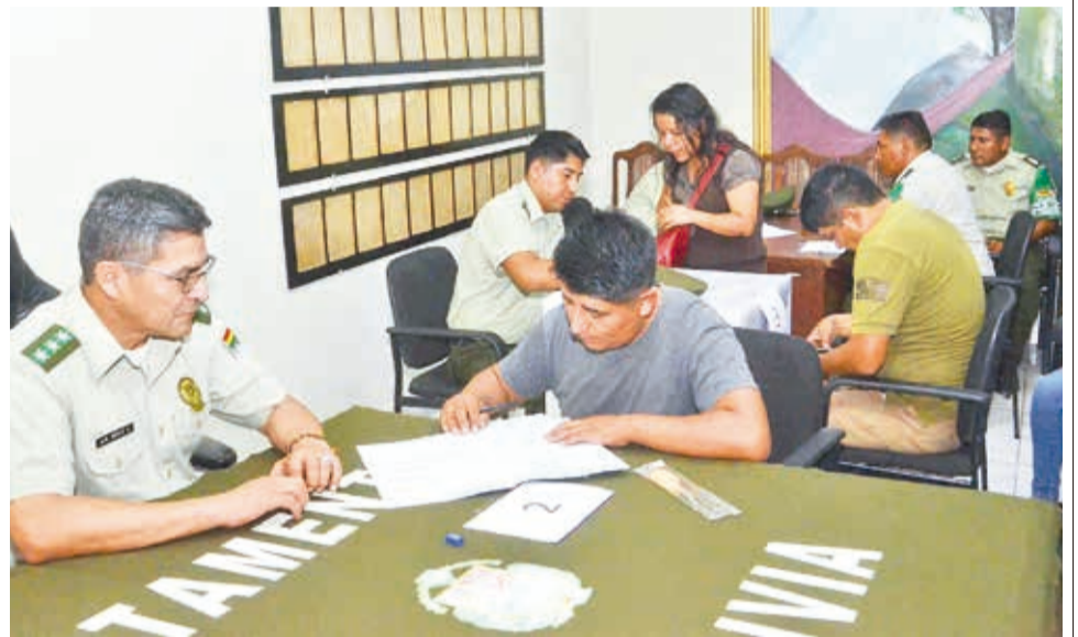
Los policías fueron los primeros censados por el INE, ayer. HERNÁN ANDÍA

Contar con datos actuales permite conocer la situación del país que servirán para la planificación de políticas de desarrollo a través de las instancias departamentales y nacionales.