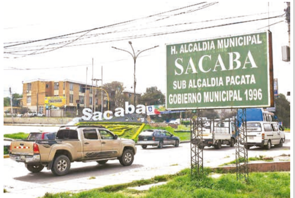
La zona de Pacata, en conflicto de límites entre Cercado y Sacaba. CARLOS LÓPEZ

MULTIMEDIA: Escanee este QR para ver el video del jefe de Límites. www.lostiempos.com