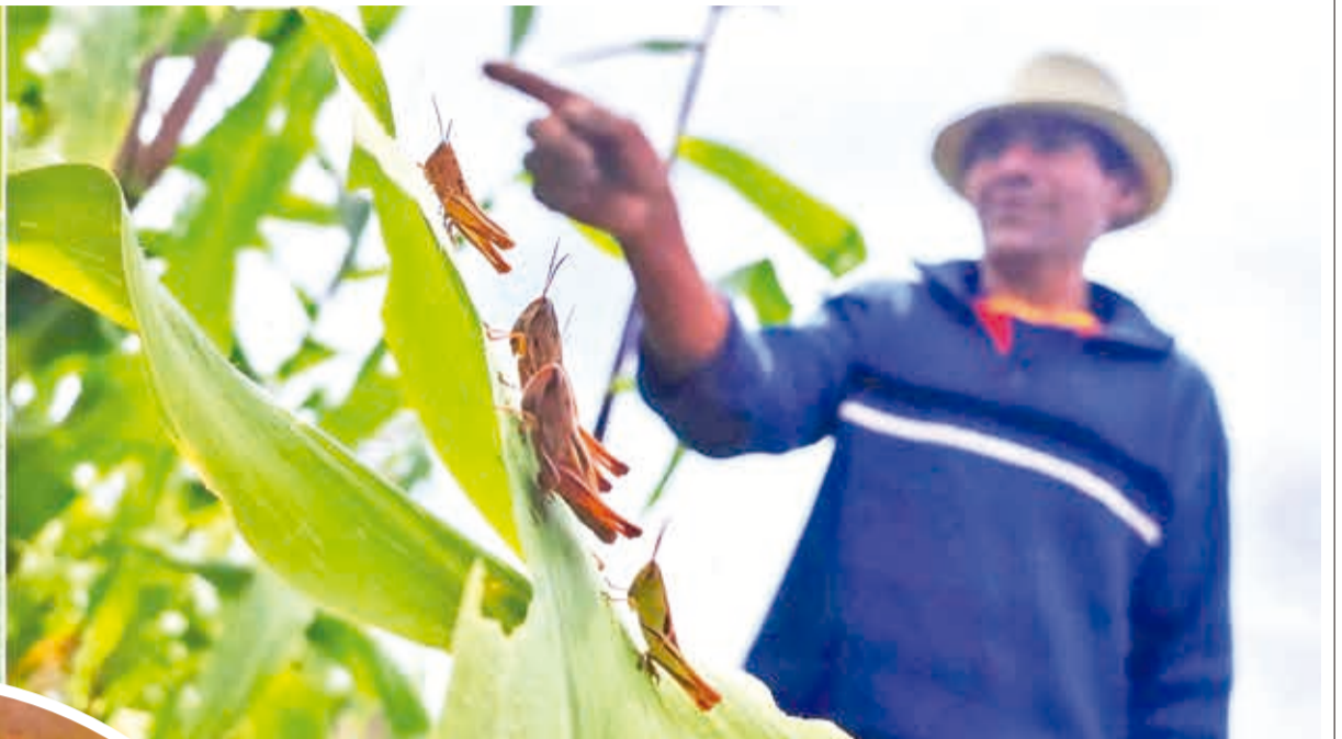
Un agricultor muestra el daño que ocasionan las langostas.