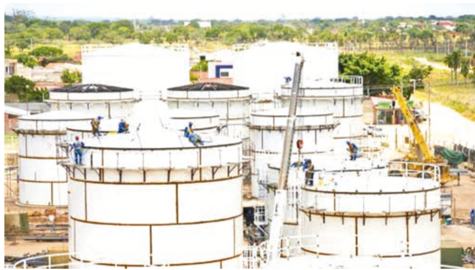
Obras de la planta de biodiésel en Santa Cruz.

Según datos de Yacimientos Petrolíferos Fiscales Bolivianos (YPFB), la Planta de Biodiésel I demandó una inversión de 47 millones de dólares y procesará diariamente 1.500 barriles de biodiésel con materia prima provenientes de aceites vegetales como el de macororó, de palma y de soya, entre otros.