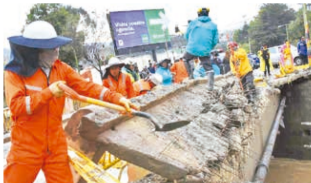
Inundaciones en la ciudad de La Paz, ayer.

El personal de la Alcaldía limpió el material de arrastre en el sector y cerraron el tránsito vehicular. “La vía está bien, pero cerraron el paso vehicular”, indicó Pinto.