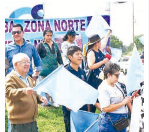
Vecinos de Pacata celebran el fallo del TSJ favorable a Cercado. CARLOS LÓPEZ