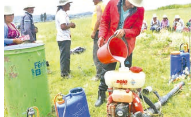
Un comunario carga el tanque de una fumigadora.

pérdida grande, pero sí es un daño. Lo que queremos es controlar la plaga porque se están reproduciendo (los insectos)”, remarcó el funcionario.