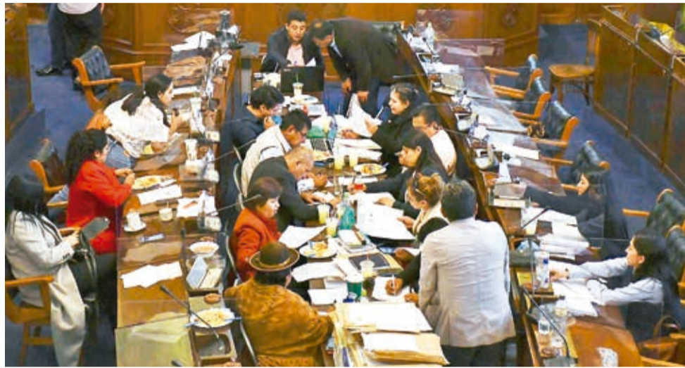
Miembros de la Comisión de la ALP revisan documentación de postulantes.

La Ley Transitoria para las Elecciones Judiciales incluye el principio de equidad, que garantiza una preselección equitativa de hombres y mujeres. Por tanto, la ALP está obligada a presentar listas paritarias para las cuatro instancias al final del proceso de preselección ante el Tribunal Supremo Electoral (TSE). Para el Tribunal Supremo de Justicia (TSJ) y para el Tribunal Constitucional Plurinacional (TCP), tiene que presentar una lista para cada una de estas instancias que incluya un mínimo de 36 postulantes.