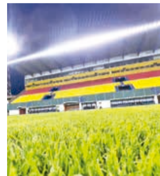
El estadio Víctor Agustín Ugarte de Potosí.

La mejora encarada en cuanto a la iluminación, tras un trabajo realizado entre la Empresa Estratégica Boliviana de Construcción y Conservación de Infraestructura Civil (EBC) y la Gobernación de Potosí,