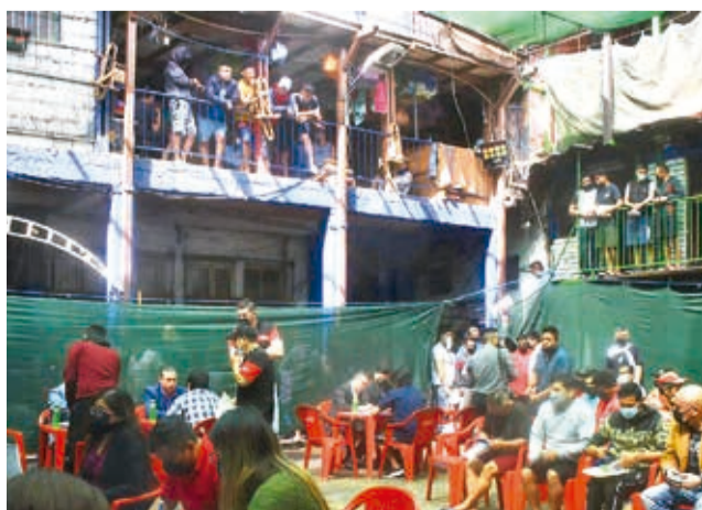
El frontis de la cárcel de San Sebastián varones. JOSÉ ROCHA

gimen Penitenciario, los voluntarios son: