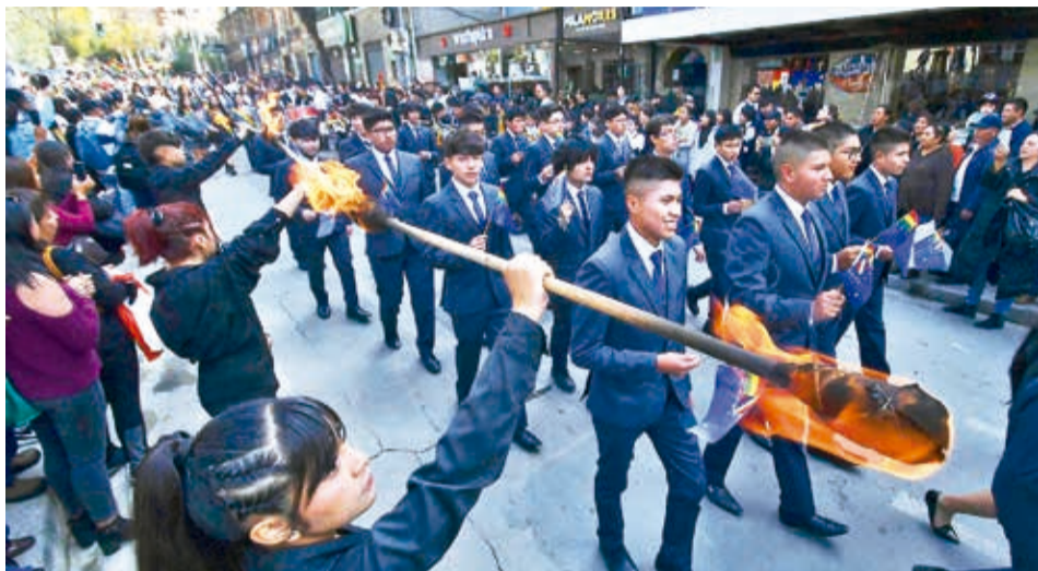
Los actos conmemorativos oficiales por el Día del Mar empezaron ayer en La Paz.

“El derecho a la salida soberana al mar de los bolivianos es irrenunciable y ese