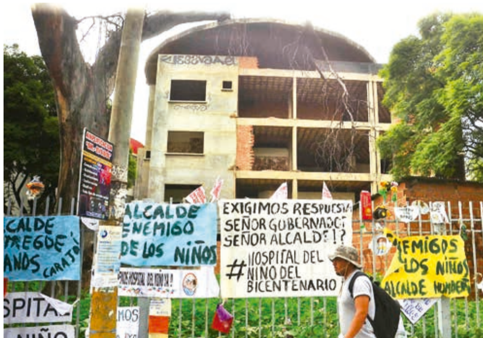
El edificio del hospital del niño, abandonado y a medio construir.

Tras pasarse la competencia de los hospitales de tercer nivel —en este caso el Viedma— a las gobernaciones, mediante la Ley 031, en 2023 se acordó entre la Alcaldía y la Gobernación que el municipio gestionaría el cierre administrativo y fi-