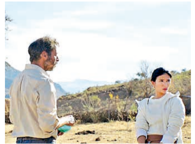
Producción. Una escena de la película Los de abajo , del cineasta Alejandro Quiroga. BOLIVIA LAB

Séptimo arte. Las principales salas cinematográficas del país proyectarán hoy películas producidas por cineastas bolivianos