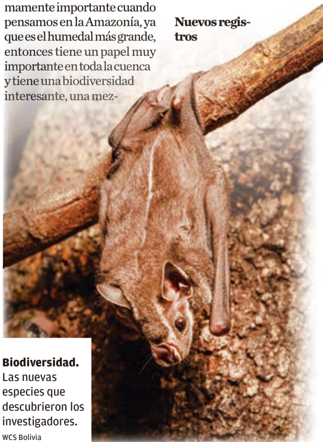
Biodiversidad. Las nuevas especies que descubrieron los investigadores.

La investigación fue impulsada por la WCS, en la que participaron el Centro de Investigación de Biodiversidad y Medio Ambiente (Cibio-ma), el Centro de Recursos Acuáticos (CIRA) de Beni, el Instituto de Ecología de la Universidad Mayor de San Andrés, el Museo Nacional de Historia Natural con apoyo financiero de la Fundación Gordon y Betty Moore.