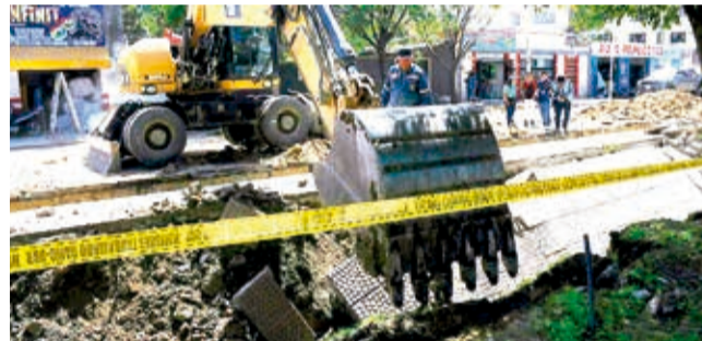
Retiran los escombros del deslizamiento.

Esta obra de 1,5 kilómetros de extensión consiste en la implementación de una doble tubería de 600 milímetros de diámetro en la avenida 6 de