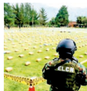
La marihuana incautada ayer en Cochabamba.