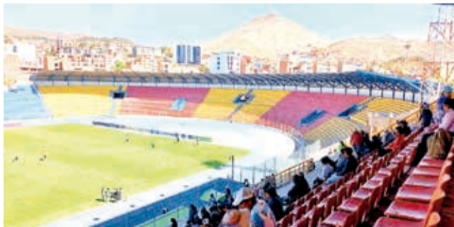
Vista general del estadio Víctor Agustín Ugarte de Potosí. ACHP

Grupo D. El estadio de la Villa Imperial espera el informe final de Conmebol para poder ser sede de este certamen