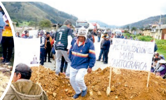
Un bloqueo por límites en Colomi en enero. DANIEL JAMES