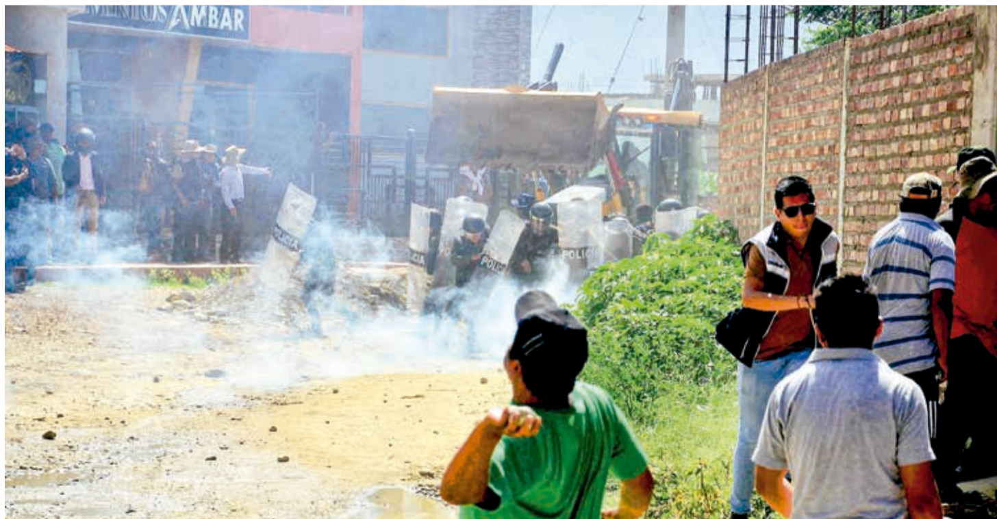
La Policía gasifica tras un enfrentamiento entre vecinos de Quillacollo y Vinto ayer en el límite de ambos municipios.

Litigios. Al problema Cercado-Sacaba, se sumó el de Vinto y Quillacollo (que ayer tuvieron una pelea campal), además de Colomi, el valle alto y el cono sur. Pág. 8