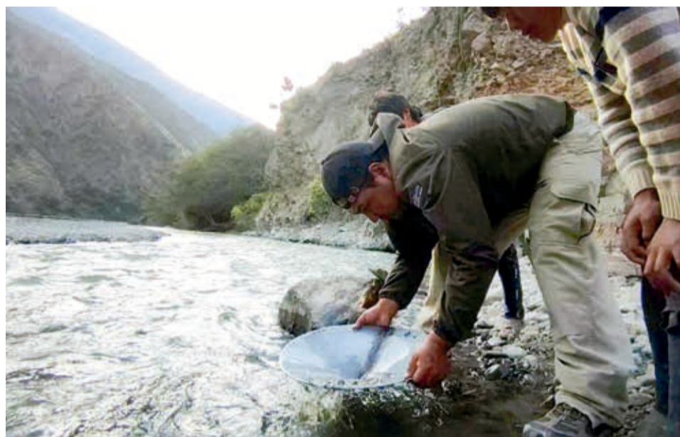
Explotación de oro en el departamento de Cochabamba.

En 2021, el ingreso por regalía minera fue sólo de 14 millones de bolivianos, en 2022 se recaudó 18 millones de bolivianos y para este año la Gobernación espera superar los 40 millones de bolivianos.