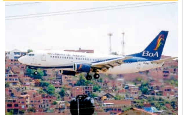
Un avión de la aerolínea estatal BoA.

“Existe la imperiosa necesidad de fortalecer a la industria y no debilitarla. Para este propósito se debe trabajar en políticas públicas que generen un clima de seguridad para las inversiones con ajustes y modernización de la normativa laboral, tributaria, la ley de inversiones”, añadió la CNI.