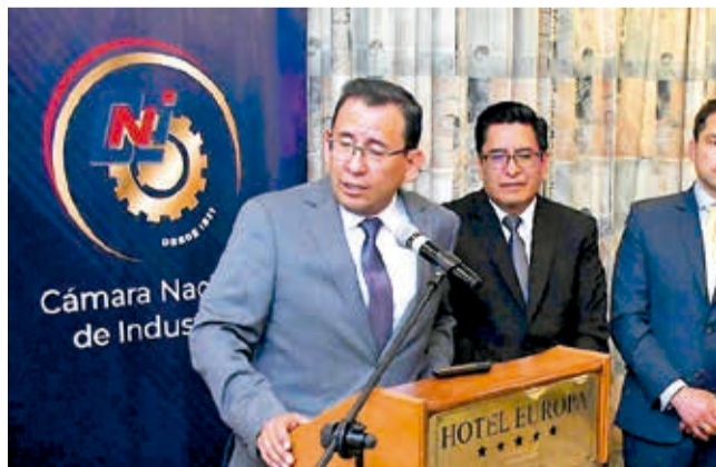
El presidente de la CNI, Pablo Camacho.

Argumento. La CNI calificó de “inviabilidad” un aumento salarial como exige la COB, de 8% al mínimo nacional y 7% al básico