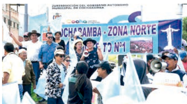
Vecinos de Pacata celebran fallo del TSJ.