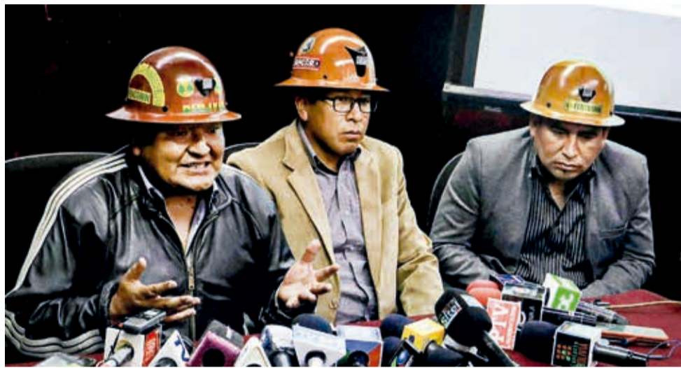
El ministro de Minería, Alejandro Santos Laura, ante la prensa.

Así lo establece el DS 5134, norma que además señala que esta nueva empresa funcionará con un aporte de capital de 102,9 millones de bolivianos. El directorio estará conformado por un representante del Ministerio de Minería, tres del Ministerio de Economía y uno del Ministerio de Planificación.