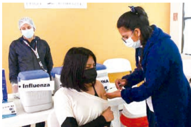
La vacunación contra la influenza (archivo). CARLOS LÓPEZ

La población adulta mayor y niños menores de 5 años son