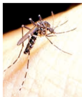
El mosquito del dengue Aedes aegypti . RRSS