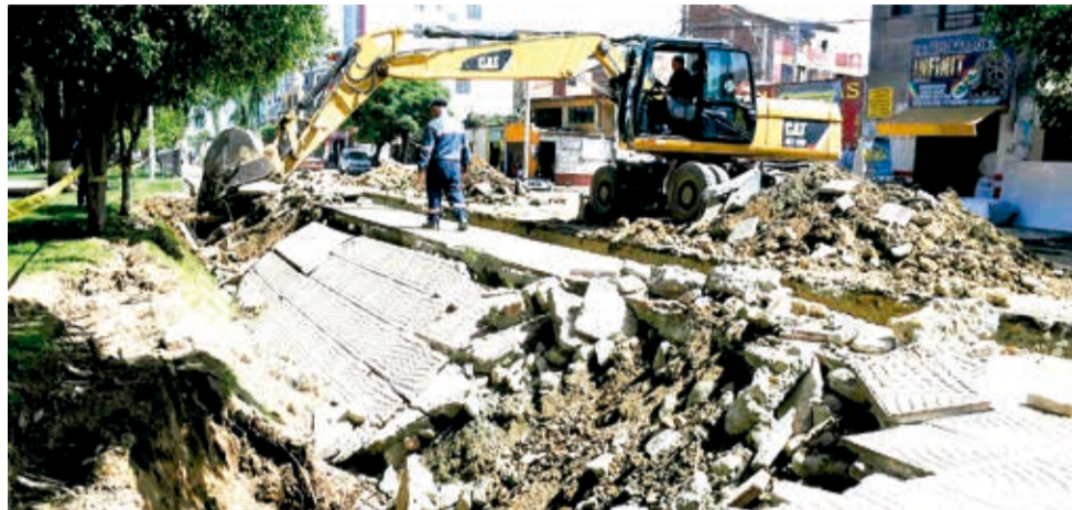
Los escombros por el hundimiento de la “serpiente negra” en la av. 6 de Agosto. C. LÓPEZ

MULTIMEDIA: Escanee este QR para ver los hundimientos del canal de la “serpiente negra”.