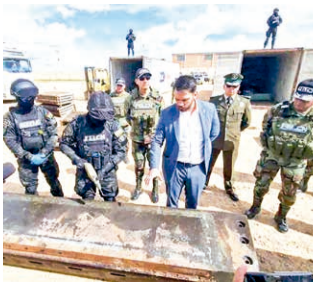
El ministro de Gobierno, Eduardo del Castillo, y la droga incautada en Oruro, el lunes.

“No ha existido filtración alguna (...), la información se dio a conocer el 15 de marzo a las 22:30; son más de 36 horas que el Ministerio Público informó a la sociedad de los