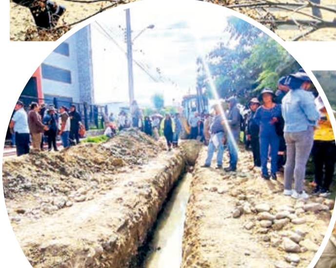
La zanja entre Vinto y Quillacollo, ayer. DANIEL JAMES