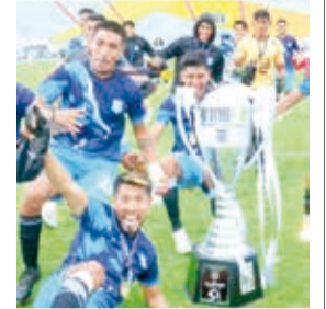
Festejo de Pasión Celeste, campeón de la Primera “A” de la AFC. HA