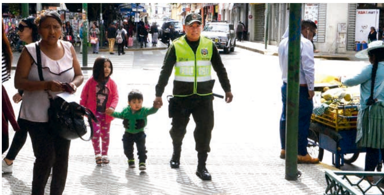
ACOMPÑANDO A LOS HIJOS. Un policía, en el Día del Padre, lleva de la mano a sus hijos rumbo al colegio. Para muchos padres no es día de fiesta, sino uno más en el que no se pueden evitar las responsabilidades con la familia mezcladas con las del trabajo. La foto fue tomada en la avenida Ayacucho esquina General Achá.

ENVÍE SU FOTO PARA PUBLICARLA EN ESTA SECCIÓN A: fotografia@lostiempos-bolivia.com