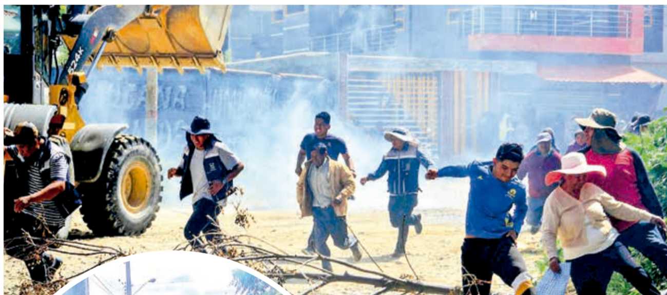
El enfrentamiento y gasificación en Chulla Jayata. DANIEL JAMES

Diálogo. Varias autoridades municipales buscan reunirse con el INE para evitar que el 23 de marzo los pobladores de las comunidades en disputa no sean censados y evitar problemas a los censistas voluntarios