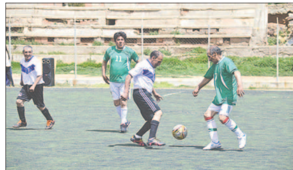
Itos y San José revivieron el clásico minero de fútbol