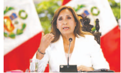
Fotografía de archivo en la que se registró a la presidenta de Perú, Dina Boluarte, durante una rueda de prensa, en Lima (Perú)