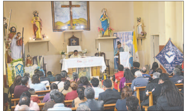
Durante la tradicional misa en honor al señor de San José

Durante el acto, diferentes oradores coincidieron en que la única salida para el cuadro "santo" es la unidad de los hinchas y los orureños para solucionar los múltiples problemas y así buscar resurgir de sus cenizas.