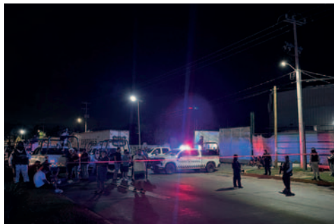
Integrantes de la Guardia Nacional resguardan la zona

Servicio Médico Forense (Semefo) ubicado en la capital del estado de Guerrero, Chilpancingo.