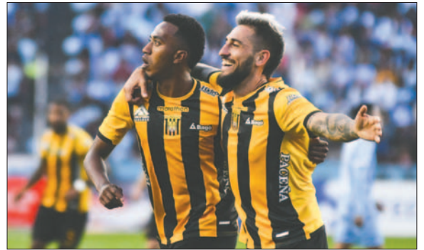
Los "atigrados" comienzan de local jugando contra el Gremio

Los dos primeros de cada grupo accederán a los octavos de final de la Libertadores y los terceros tendrán una reivindicación saltando a los playoffs de la Copa Sudamericana, jugando contra los segundos de los grupos de éste certamen.