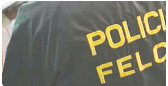
El acusado espera su audiencia de medidas cautelares /REFERENCIAL

Los familiares del occiso retornaron al sobrino, identificado como