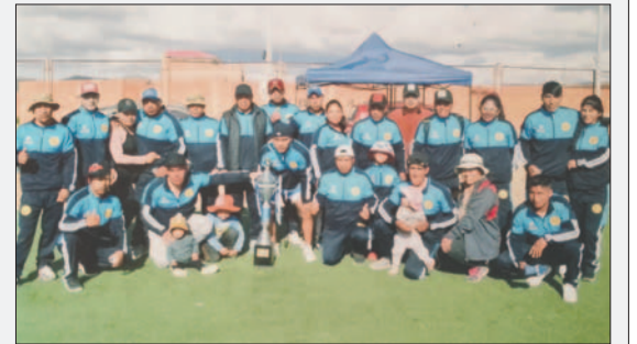
El equipo campeón del Intercuadrillas de la Cooperativa Jallpa Socavón

Al finalizar la jornada, los organizadores llevaron a cabo la entrega de premios correspondiente, que consistió en trofeos y llamas para los equipos ganadores. La tabla de posiciones quedó formada de la siguiente manera: Capos en primer lugar, Deportivo Cielo en segundo lugar, Ni Más Ni Menos en tercer lugar y Ranas en cuarto lugar.