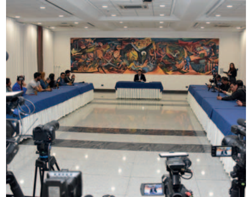
El Presidente Luis Arce conversó con los medios de comunicación ayer

Del mismo modo, por el auto de buen gobierno, todas las actividades a nivel nacional quedan suspendidas para el sábado 23 de marzo, al igual que la libre circulación de vehículos y personas. Solo el personal autorizado podrá movilizarse.