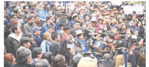
Representantes del Pacto de Unidad en conferencia de prensa

“El instrumento político, basado en nuestro estatuto y bajo la dirección de nuestro legítimo y legal