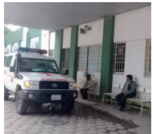
La víctima padece de 60 días de incapacidad /REFERENCIAL

Durante la discusión en el segundo piso de su casa, la mujer se encontraba con amigas y colegas de trabajo. Testigos afirman que no es la primera vez que sufre daño físico y psicológico por parte de su novio. Tras la caída, fue trasladada al Hospital San Juan de Dios donde se determinó su diagnóstico y estado crítico.