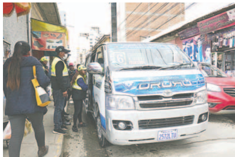
Denuncian tarifas irregulares en servicio de transporte urbano en Oruro

"Creo que los pasajes se están cobrando depen-