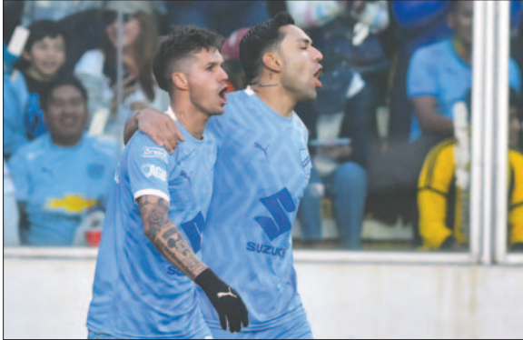
Los "académicos" inician esta fase jugando de visita ante el Palestino

grupo "C" de la Copa Libertadores, abriendo esta carrera contra Gremio (Brasil). Mientras, Bolívar arrancará como visitante el jueves 4 de abril