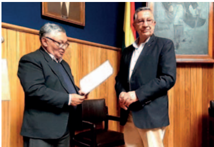
Reconocimiento a docentes de la UTO que trabajaron en la Comisión del Estatuto Orgánico

El Estatuto Autonómico vigente fue elaborado en 1952 y entró en vigencia un año después, es decir desde 1953. Ahora se busca actualizar el Estatuto Orgánico propuesto que estuvo a cargo de la comisión.