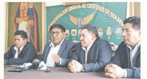
Los choferes esperan información para asumir una posición

Según las declaraciones de Gómez, la Confederación busca respuestas concretas del Ministerio de Hidrocarburos y YPPF,