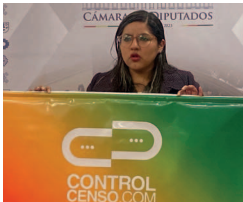
La diputada opositora presentó la plataforma de fiscalización

una Petición de Informe Oral (PIO) a la Comisión de Autonomías y el INE presente exactamente las mismas papeletas para contrastar la información.