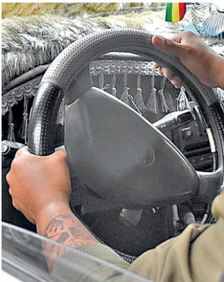
Pasajeros son robados por conductor de taxi en El Alto