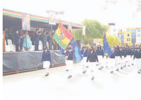
Actos por el Día del Mar se adelantan

Asimismo, el jueves 21 de marzo se tiene programada la ofrenda flo-