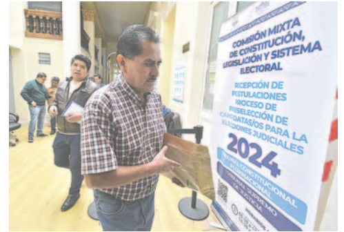
Se denunciaron irregularidades en la preselección de las elecciones judiciales

Por su parte, el presidente del Estado, Luis Arce, mencionó que se debe investigar la veracidad de los audios y de los hechos que señala la grabación y preferir no ade-