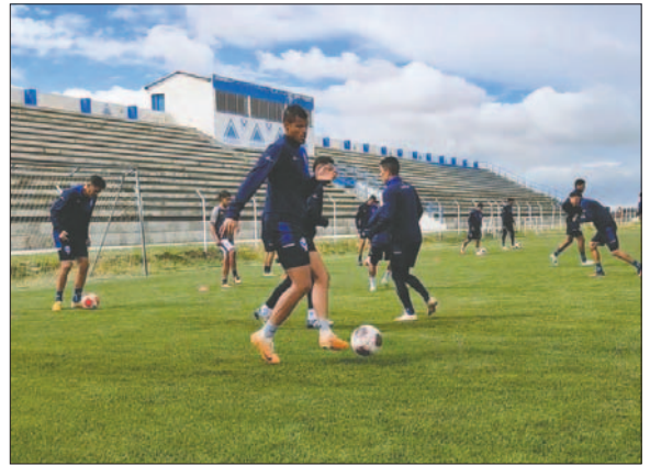
El plantel orureño retomó las prácticas a pesar de no tener un entrenador