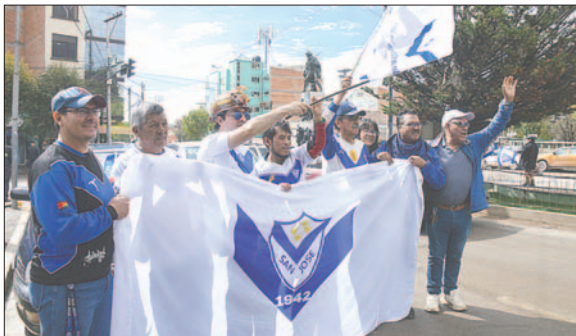
San José, un sentimiento que se ganó el corazón del hincha orureño

En el partido principal, el equipo "santo", que actualmente juega en la Primera "B" del fútbol orureño, se enfrentó a Ingenieros, que se prepara para la Copa "Simón Bolívar". El "chivato" ganó por 5-0.