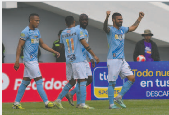
El partido entre Aurora y Royal Pari corresponde a la primera fecha