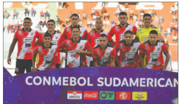
El "rancho guitarra" debutará de local frente a Boca Juniors

En cuanto a Always Ready su primer cotejo será contra Independiente Medellín el jueves 4 de abril