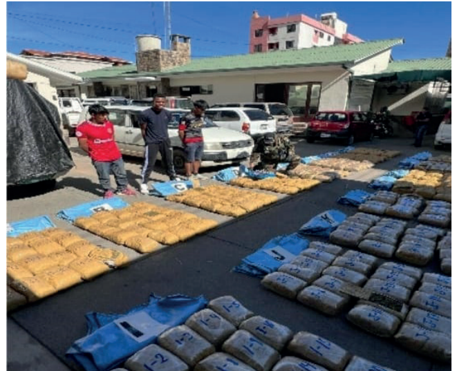
Incautaron media tonelada de droga en Cochabamba

El hecho tuvo lugar el pasado 15 de marzo alrededor las 14:00 horas