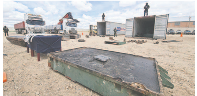
El operativo permitió la incautación de 7.2 toneladas de droga

El primer contenedor llegó al depósito aduanero en Pisiga el 11 de marzo, seguido por el segundo el 13 de marzo y el tercero el 14 de marzo. El Ministerio de Gobier-