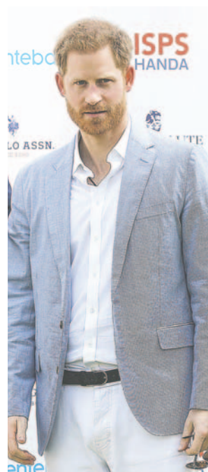
Fotografía de archivo en la que se observa al príncipe Enrique del Reino Unido

"A veces ves a esos actores en la pantalla y luego los ves en la vida real y te preguntas: ¿Es la misma persona que viste en la película?", añadió.