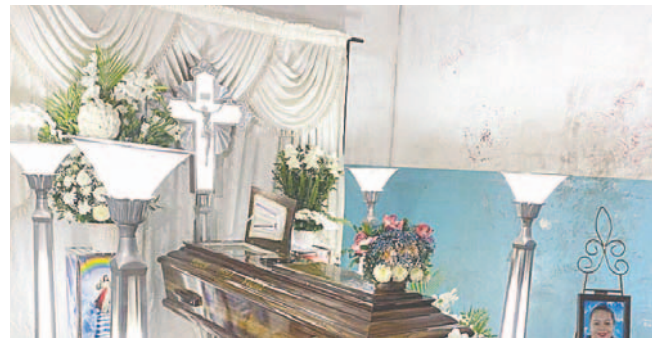
La familia realizó el velatorio en su domicilio

En las primeras horas del domingo 17 de marzo, se halló sin vida a una joven que ingresó con un hombre a la habitación del establecimiento. Las cámaras de seguridad registraron el momento en que ambos entraron al recinto a las 05:17 horas y posteriormente se observa al individuo salir solo a las 06:56, realizando el pago antes de huir corriendo por