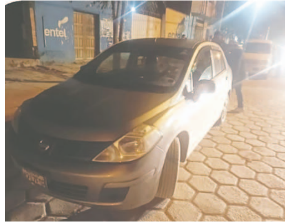
El motorizado utilizado en el acto criminal

secuestro en las inmediaciones del Cementerio de Iroco, Marco Antonio fue trasladado a dependencias de la Felcc para brindar su declaración informativa. Posteriormente, fue aprehendido y puesto a disposición del Minis-