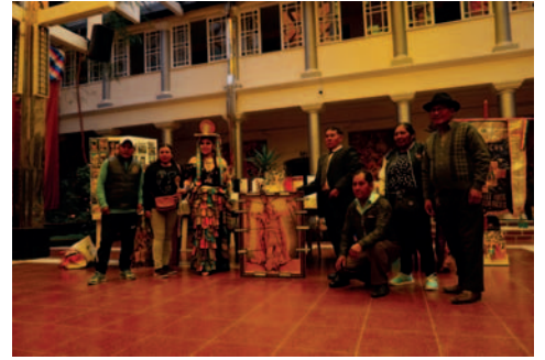
Exposición del conjunto Fraternidad Hijos del Sol "Los Incas" / LA PATRIA

"Es la muestra de la muerte de Atahualpa y la conquista del imperio incaico, por