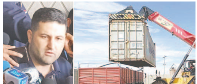
“¿Dónde están los responsables de filtrar la información?”, cuestionó el legislador