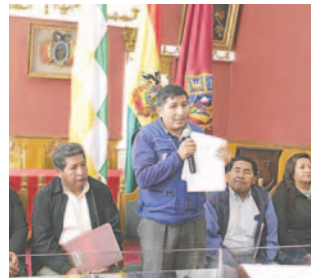
Intensifican campañas para que los habitantes se censan en el municipio

“Creemos y estamos seguros de que estamos preparados para poder afrontar este Censo; sin embargo, seguimos trabajando y reuniéndonos con las instituciones. Se está llevando a cabo una campaña masiva con perifoneo en las diferentes zonas”, aseveró.