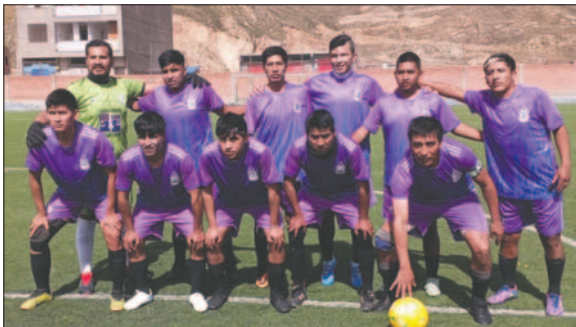
Santos de Belén obligado a sumar para salir del fondo

Para el jueves 21 de marzo, a partir de las 16:00 horas en la cancha "C" del complejo Jesber, el equipo Unión Huayllamarca será local frente a Litoral de Coipasa. Unión Huayllamarca busca conseguir su primer triunfo en el campeonato y frenar el avance de los fronterizos.