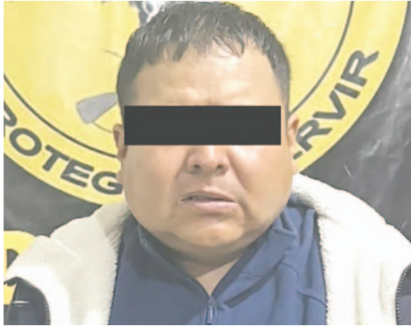
El acusado se encuentra en prisión con detención preventiva