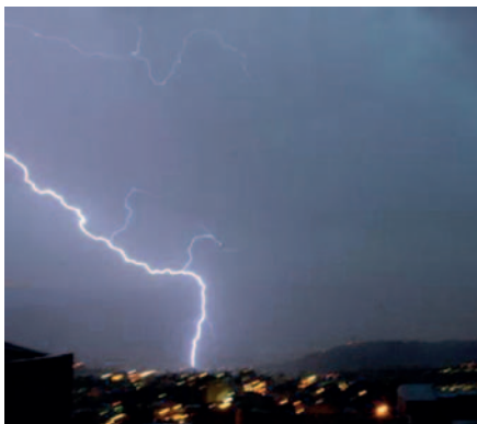
Las intensas lluvias y descargas eléctricas han afectado a varias comunidades de la Villa Imperial

Durante esta temporada también se han registrado derrumbes y riadas que han afectado a comunidades en el Norte y centro de Potosí.