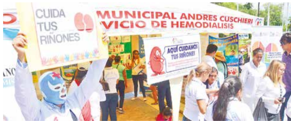
Una campaña para cuidar la salud y evitar la insuficiencia renal. JOSE ROCHA

La bacteria es conocida por su resistencia a múltiples antibióticos y su capacidad de causar infecciones, como neumonías, en personas con sistemas inmunológicos debilitados. Las pacientes aisladas e internadas presentan cuadro febril.