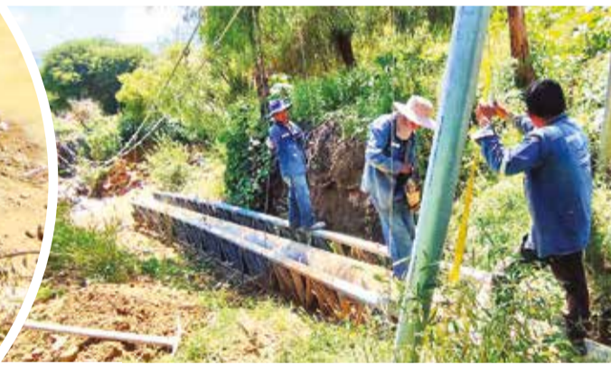
Los trabajadores que realizan la reparación de la tubería.

tas, han sido construidas con materiales deficientes, el sistema de aducción es de mala calidad. Si bien se construyeron para evitar contaminación, pero siguen haciéndolo”, aseguró.