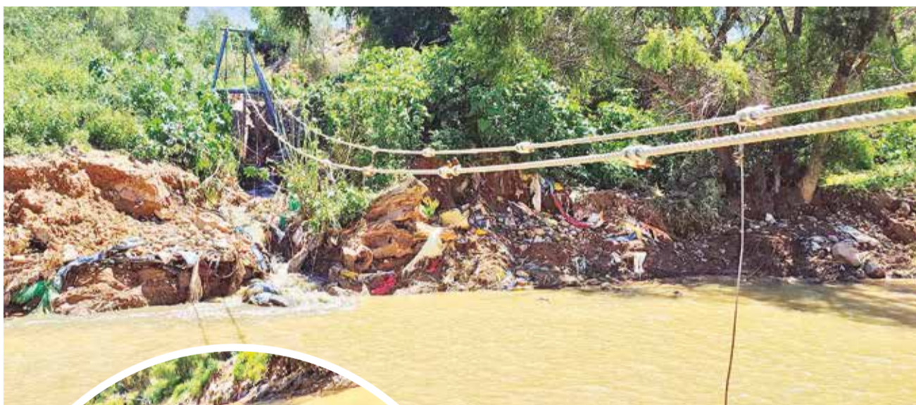
El punto de ingreso de las aguas servidas de Pucara al río.