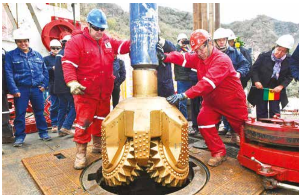
Trabajos de exploración de hidrocarburos en Bolivia. YPFB

“Hemos pedido un informe (al Gobierno) de los pozos a perforar. Nos dicen que