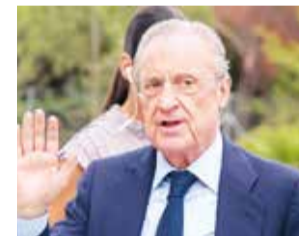
Florentino Pérez, presidente Superliga.

Durante el juicio que se celebró ayer en el juzgado de lo Mercantil número 17 de Madrid, los abogados de la European Superleague Company SL y de A22 Sports Management SL coincidieron en que así lo ha reflejado el Tribunal de Justicia de la Unión Europea (TJUE), al que el juzgado pidió su parecer sobre la conformidad de las normativas de la UEFA y la FIFA con el Derecho de la Unión.