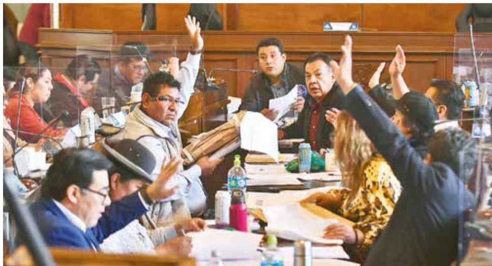
Miembros de la Comisión Mixta de la ALP revisan documentos de los postulantes.