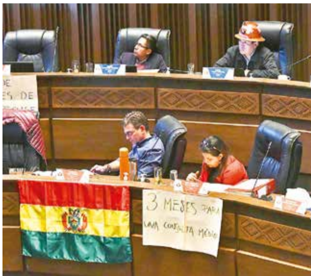
Sesión en la Cámara de Senadores para tratar créditos.

El segundo crédito, aprobado con el respaldo de 14 de 21 senadores, viabiliza el acceso a 56.050.000 dólares para la construcción de la carretera Faja Norte del municipio de