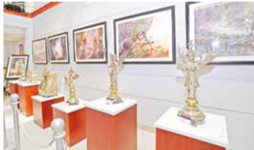
Exposición. Apertura de la primera temporada en MIC BancoSol Cochabamba.