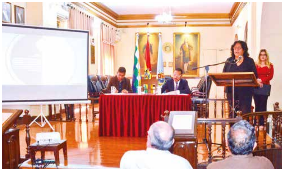
La presentación del Informe de Rendición de Cuentas del Concejo Municipal. H. ANDIA

Después de enfrentar divisiones internas y acusaciones, Vidaurre detalló que el Concejo aprobó 136 leyes y avanzó en la redacción de la carta