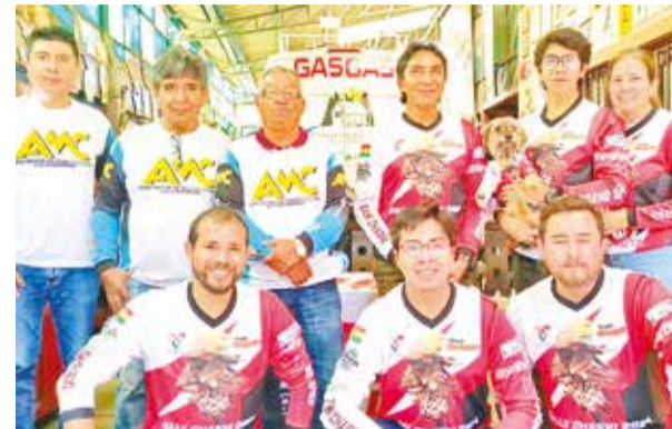
Presentación de la primera fecha departamental.