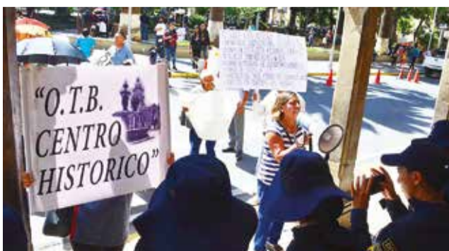
Vecinos del centro protestan en la Alcaldía. HERNAN ANDIA

“Hay mucha inseguridad y delincuencia que atemoriza. Los comerciantes se apoderaron de las aceras con. No sé