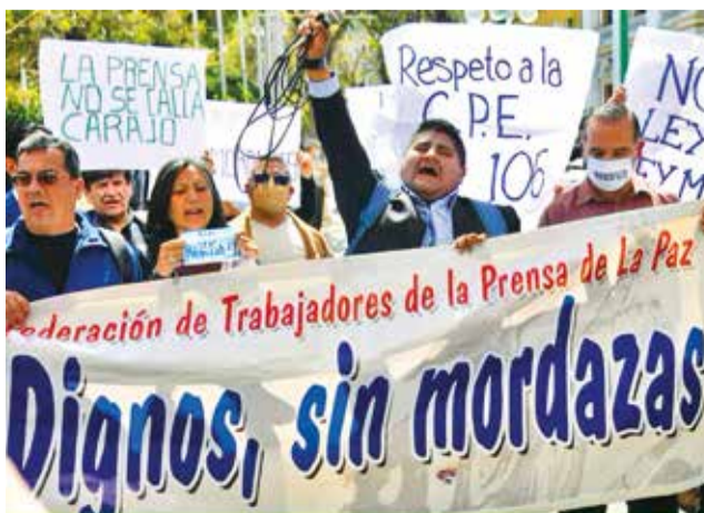
Una marcha que pide equidad en la pauta publicitaria. LT

Además, la Comisión reportó denuncias de que “la asignación de pauta oficial se usa como premio o castigo según las líneas editoriales, lo que es con-