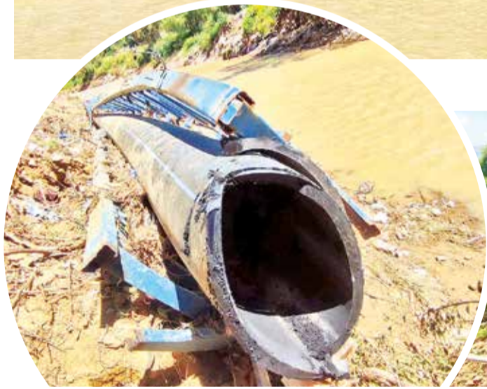
El ducto que se rompió con la crecida del río.