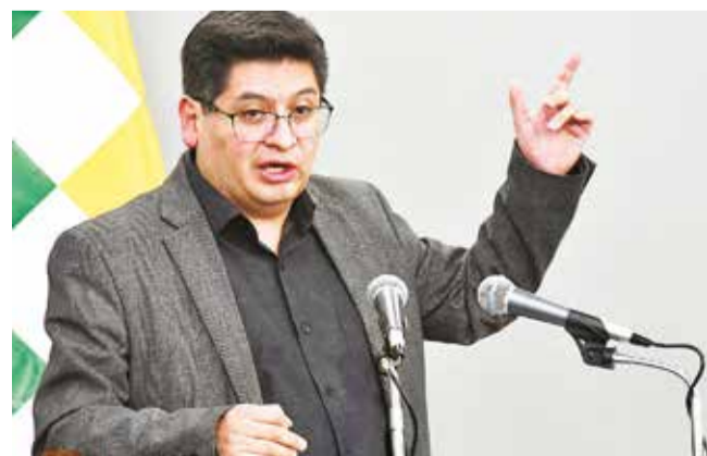
El ministro de Economía, Marcelo Montenegro.

El miércoles, el Gobierno aseguró que no hay razón para el incremento de precios.