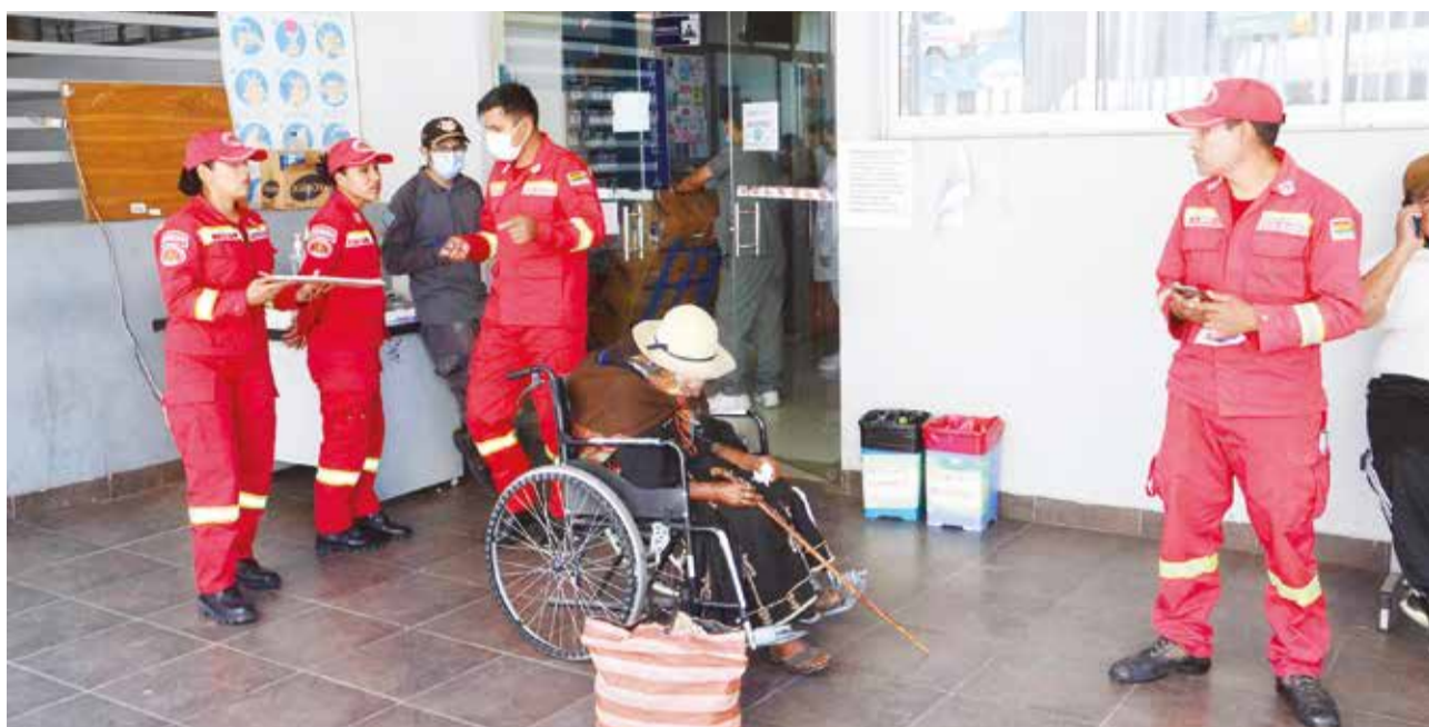
ESPERA ETERNA. Bomberos de la Policía trasladaron a una anciana hasta el hospital Viedma de manera urgente; sin embargo, se quedaron horas y horas para que pueda ser atendida.

ENVÍE SU FOTO PARA PUBLICARLA EN ESTA SECCIÓN A: fotografia@lostiempos-bolivia.com