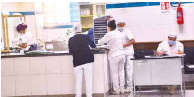
El personal de salud en el Hospital Cochabamba.

Procedimiento. El Sedes señaló que la evaluación del caso "es un proceso largo que no se resuelve de la noche a la mañana"