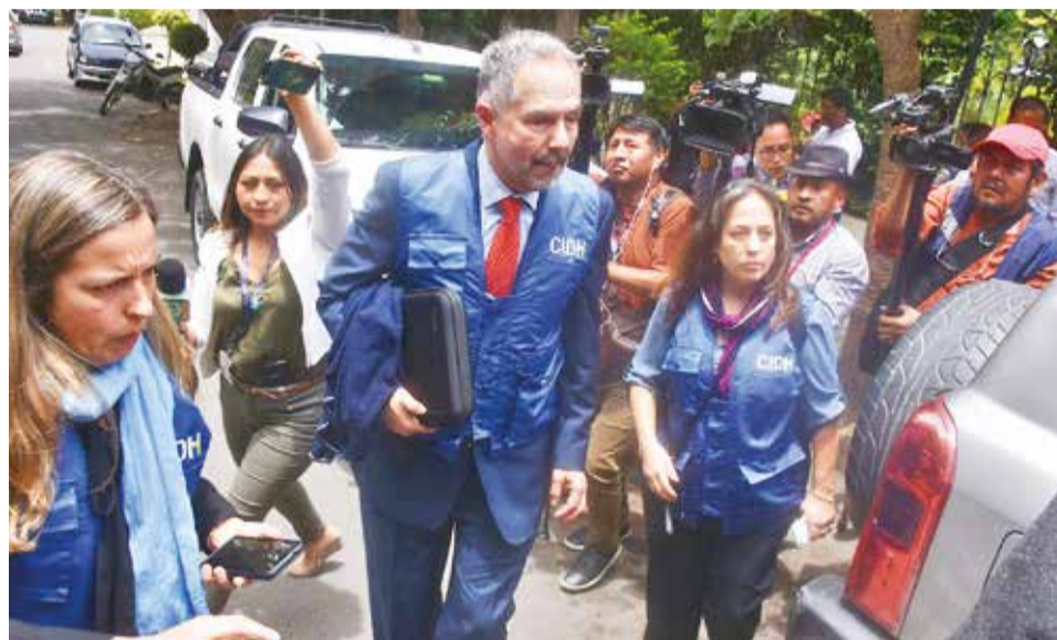
Los integrantes de la CIDH con organizaciones sociales de Bolivia, en marzo de 2023. J.R.

Pide crear e implementar una política pública nacional para reducir el hacinamiento en las cárceles, que incluya la gestión unificada y eficiente de la información que permita identificar el estado de cumplimiento de las condenas y agilizar las órdenes de libertad, además de investigar, juzgar, sancionar y reparar, con la debida diligencia, de casos de graves violaciones a los derechos humanos, así como adoptar políticas públicas y reformas legales que comprendan medidas de no repetición.