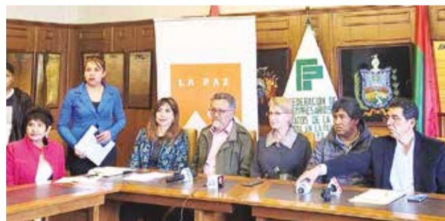
Representantes del sector turístico ante la prensa. SDSN

Comparación. La agroindustria y la minería del oro generaron $us 3.000 MM en 2022, el turismo aportaría $us 4.000 MM.