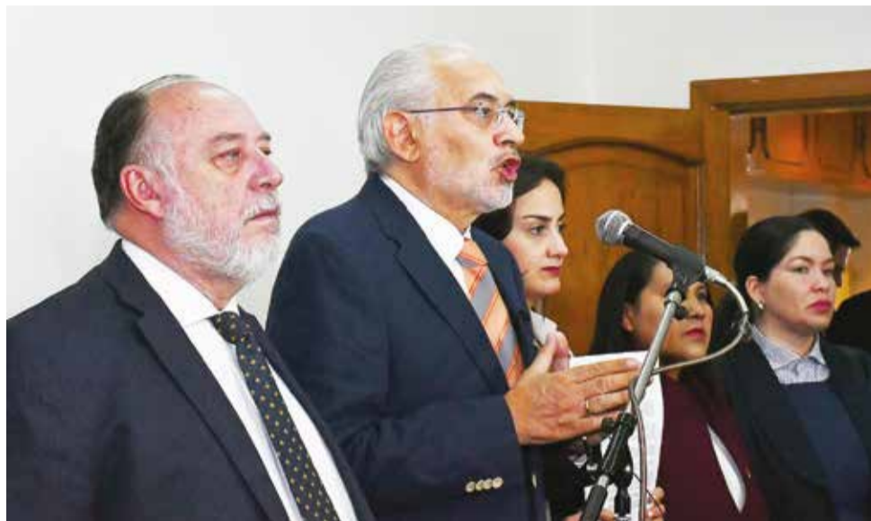
El expresidente y jefe de Comunidad Ciudadana, Carlos Mesa, en conferencia de prensa.