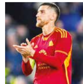
Lorenzo Pellegrini aplaude tras la clasificación de Roma, ayer.