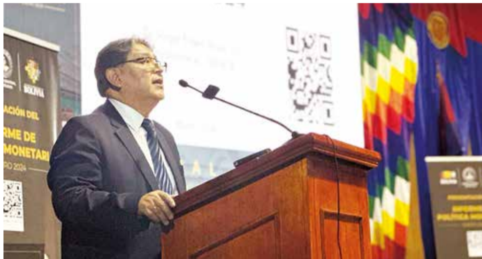
El presidente del BCB, Edwin Rojas, ayer en el paraninfo de la UPEA.

La compra de oro local inyectó 209 millones a las reservas; la repatriación de recursos de empresas públicas en el exterior 197 millones; los aportes de los bancos al Fondo para Créditos destinados al Sector Productivo (CPRO) 20 millones; el tipo de cambio prefe-