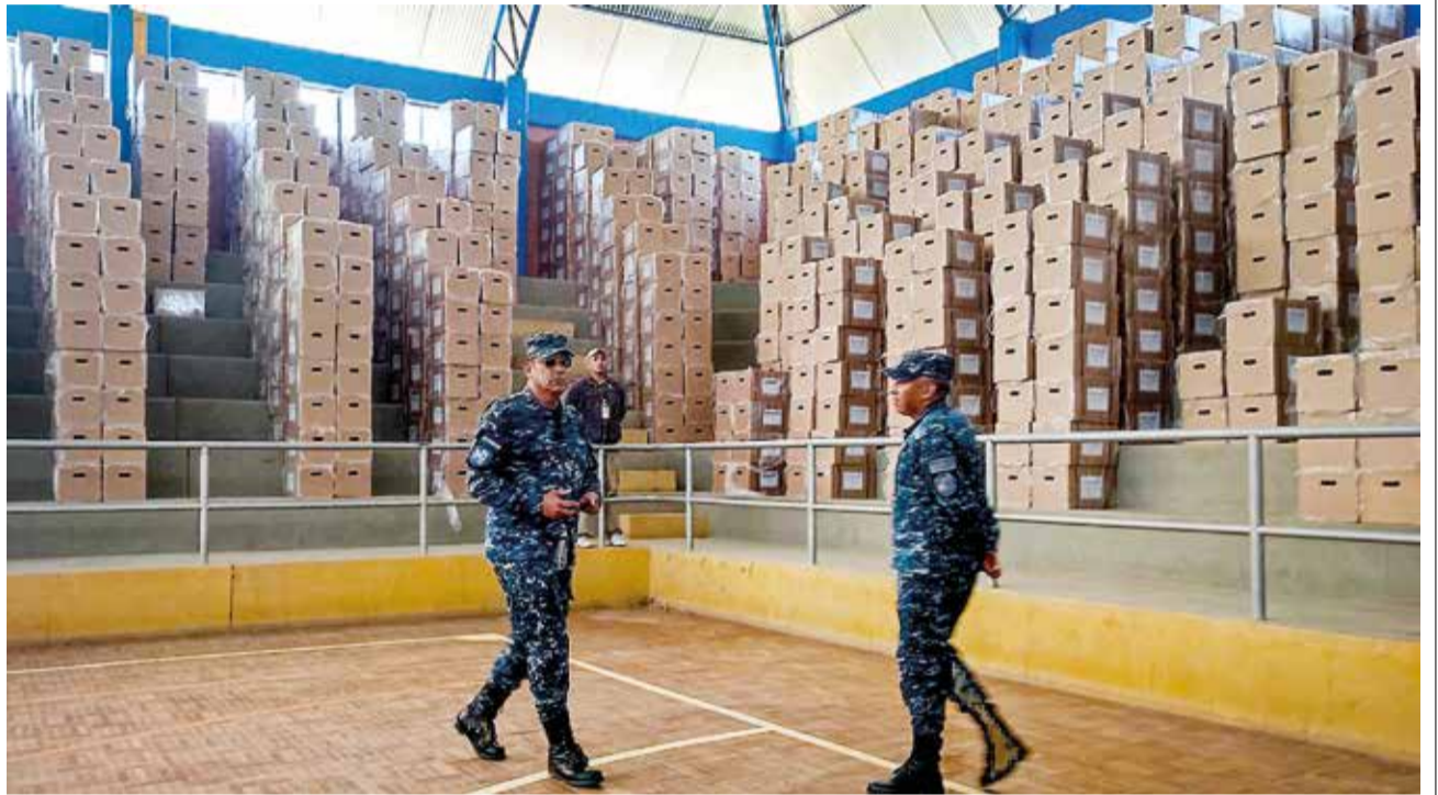
Cajas censales son resguardadas por las Fuerzas Armadas. DANIEL JAMES

y Uruguay) e incluso algunos directores de estadística del continente. Avances A dos semanas del censo, las cajas censales fueron distribuidas a todos los departamentos y, a partir de la fecha, se hará llegar el material censal a cada rincón del país, se iniciará por los municipios y comunidades más lejanas. “La distribución del material censal y el armado de cajas fueron concluidos al 100 por ciento a nivel nacional, ahora se inicia la distribución del material censal a los 343 municipios, sean estos Go-