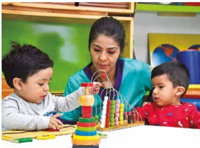
De lunes a jueves se reciben a niños de 0 a 6 años.

MULTIMEDIA Escanee el QR para conocer más sobre las ludotecas www.lostiempos.com