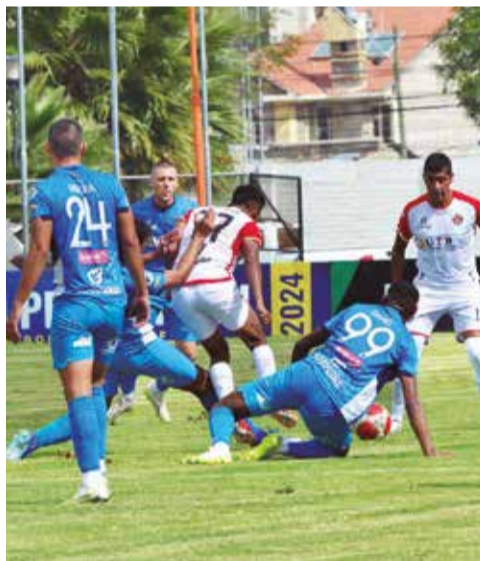
Una incidencia del primer tiempo entre Universitario y San Antonio.