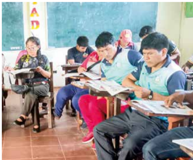
Capacitación de agentes censales en Cochabamba. INE