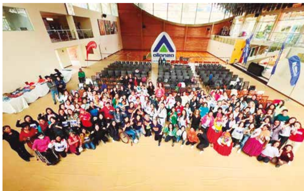
Mujeres en la II Cumbre del Movimiento Strong Women Better World, en La Paz. SWBW

Lo que se busca con este tipo de escuelas y capacitación de las mujeres es contar con más figuras líderes y referen-