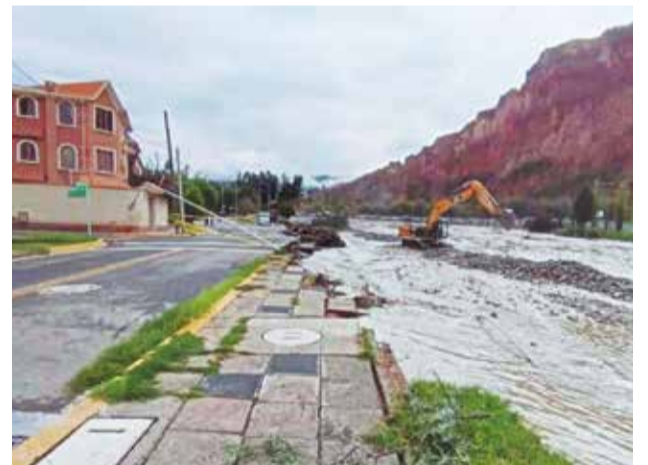
La zona Amor de Dios sufrió el socavamiento de parques y calles.

Este sábado su cuerpo fue hallado en el Valle de Poco Poco.