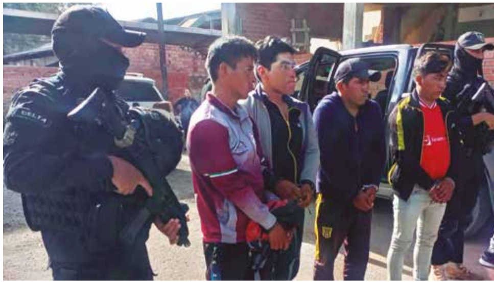
Los reclusos custodiados por la Policía de Cochabamba, ayer.

“Tú que nos estás viendo, estamos cerca de ti, te vamos a capturar”, dijo la autoridad. Molina se encontraba cumpliendo una condena de cuatro años por del delito de evasión, pues se escapó cuando fue aprehendido para ser procesado por robo en el Trópico.