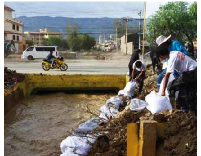
El canal de riego quedó con mazamorra en Tiquipaya. H.A.