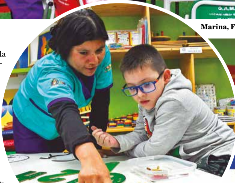
Los niños eligen cómo y dónde jugar y aprender.

Asimismo, la ludoteca móvil, “que se mueve como gusano”, extiende el alcance de este proyecto, llevando sesiones de juego y aprendizaje a