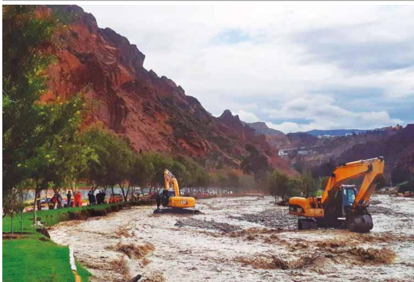
Así quedaron las calles y parques en la zona Amor de Dios de la ciudad de La Paz, ayer. GANLP