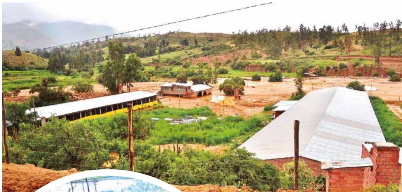
Las casas enterradas por el lodo aún no son visibles a dos semanas del desastre en Laquiña.

Las carencias, las necesidades y las responsabilidades para atender con alimentación a los operadores de maquinaria pesada están dividiendo y ocasionando problemas en la distribución de ayuda, según los testimonios de los mismos afectados.