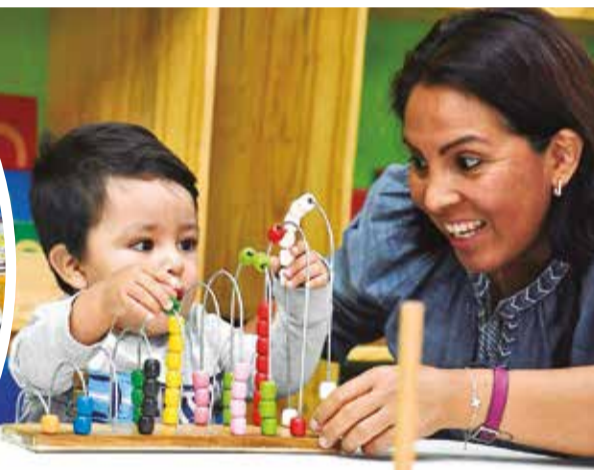
Los padres también acompañan las sesiones de sus hijos.