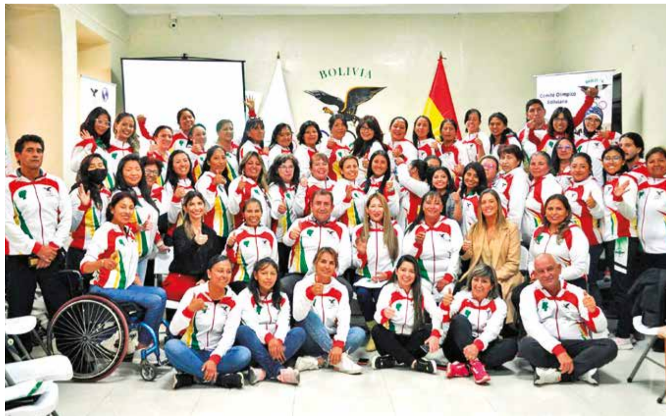
Atletas, entrenadoras, deportistas y médicos que fueron parte del Curso Igualdad de Género y Deporte Seguro.