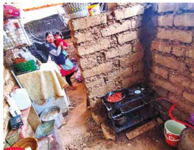
La cocina improvisada en una cabaña en Laquiña Baja.