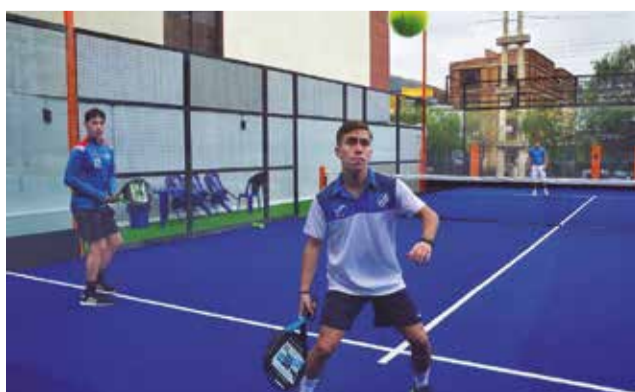
Las canchas del club Pádel VIP Park. CARLOS LÓPEZ

Pádel VIP Park, ante la creciente demanda de la población, dispuso de distintas comodidades para los depor-