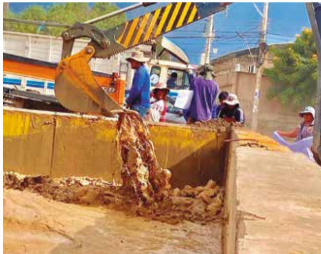
Las avenidas inundada por el desborde del río Tolavi. C.N.