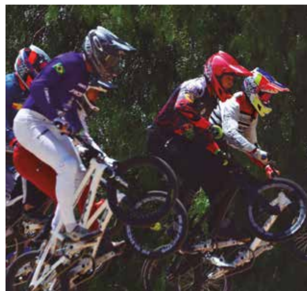
La competencia de BMX, ayer en el circuito de la Tamborada.