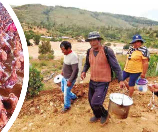
Un grupo de comunarios traslada alimentos para los operadores de equipos que hacen la limpieza del río.