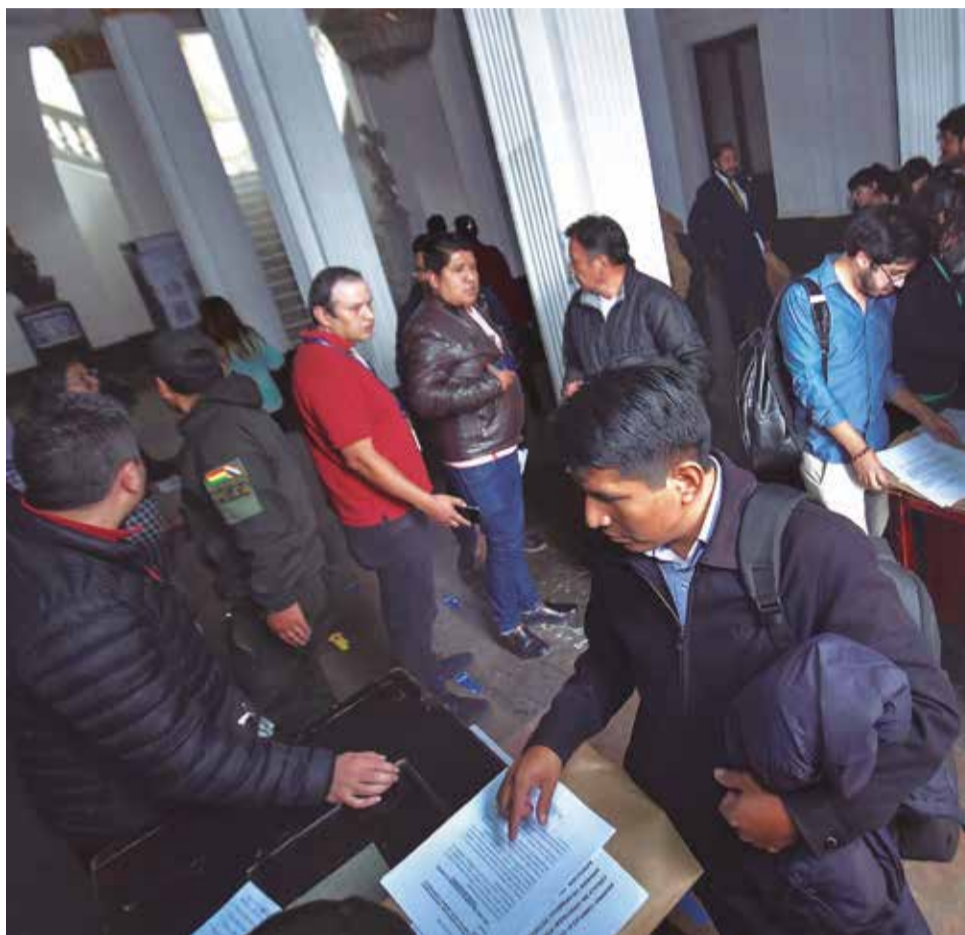
Varias personas hacen fila para presentar su postulación, ayer.