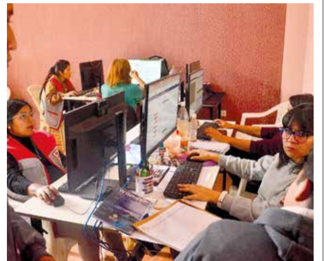
Centro de monitoreo del INE en Cochabamba. CARLOS LÓPEZ