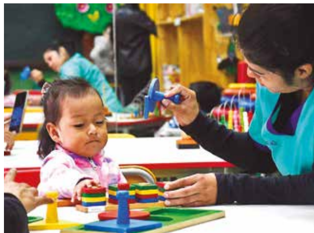
Los viernes, se amplía la atención hasta los 12 años.