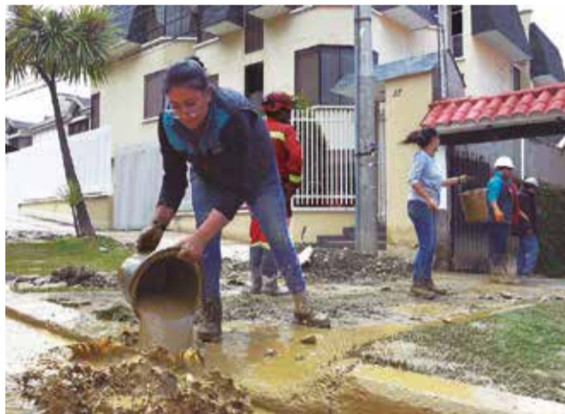
La crecida del río Achumani inundó varias viviendas.