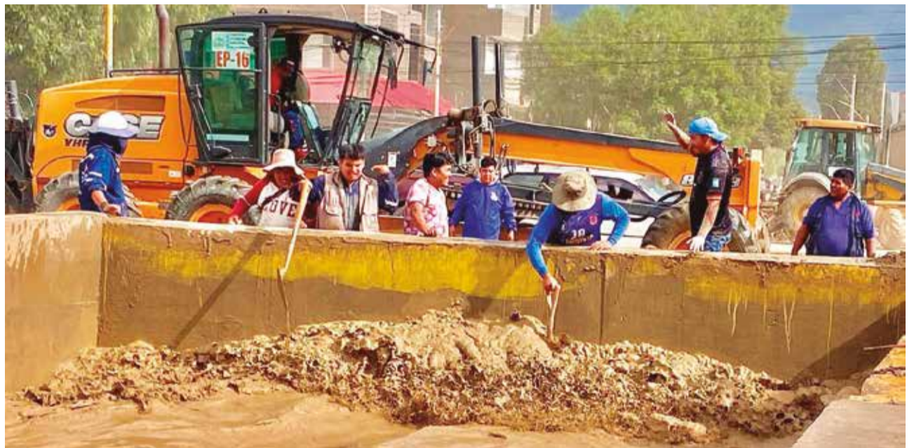
Funcionarios trabajando en la limpieza de la mazamorra, ayer en Tiquipaya.

Las alcaldías de los municipios involucrados señalaron que están listos para cualquier emergencia que se presenten en estos días debido a que las lluvias continuarán.