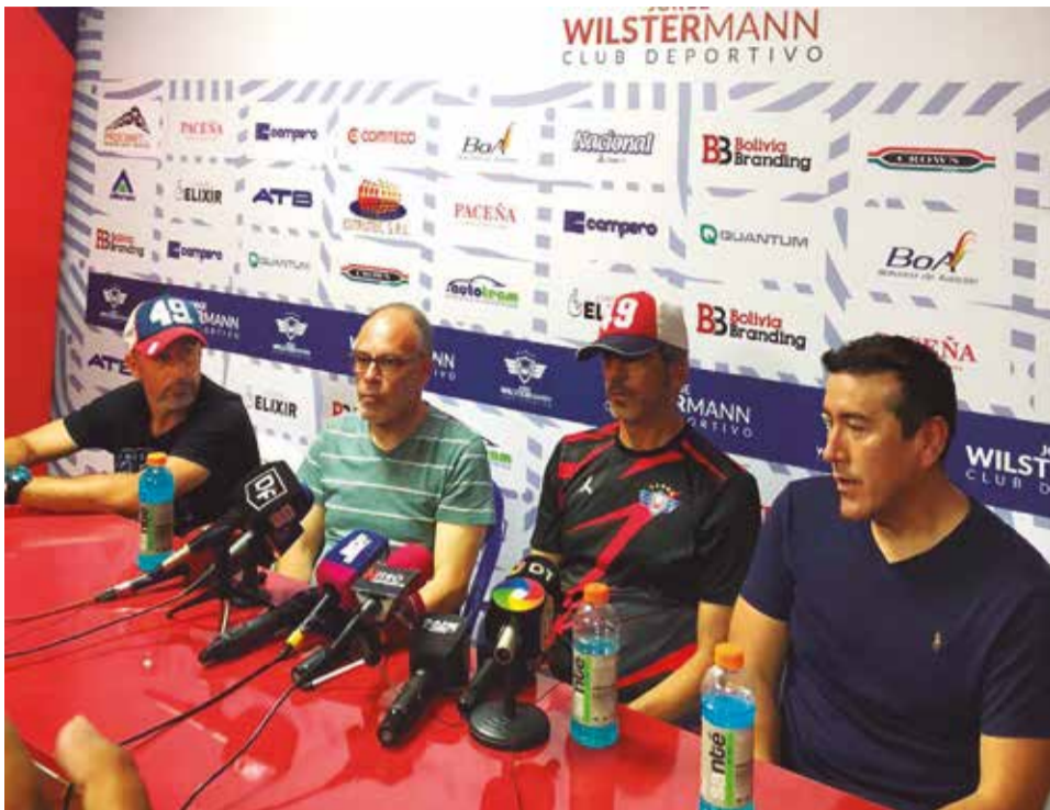
Los dirigentes de Wilster junto al cuerpo técnico, ayer. WILSTERMANN