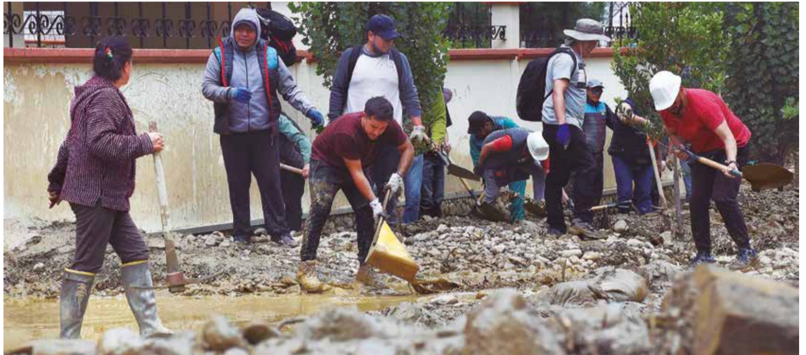
Lluvias torrenciales ocasionan el desborde de ríos en la zona de Achumani de La Paz que llenó de escombros y lodo este sector de la ciudad.

Según datos, las fuertes lluvias provocaron el deslizamiento