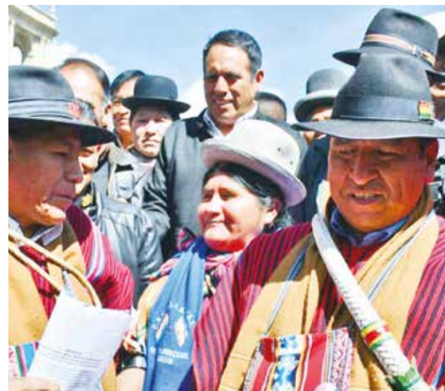
Integrantes del Pacto de Unidad arcista en conferencia de prensa, ayer.

Explicó que la convocatoria al congreso fue acordada por los ejecutivos de organizaciones sociales legítimas.