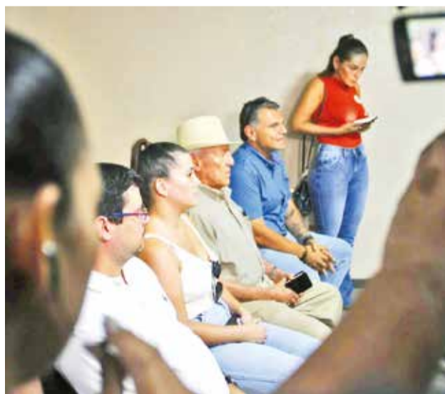
Audiencia del gobernador Luis F. Camacho.