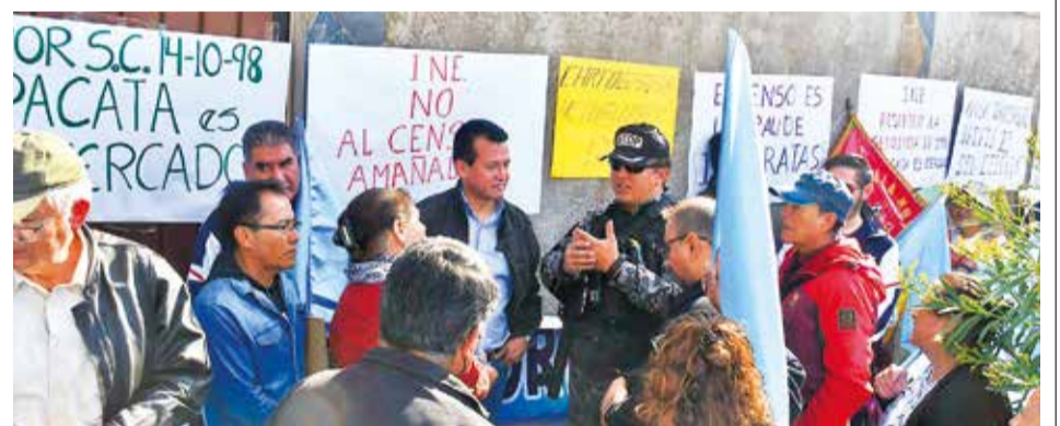
La protesta de los vecinos del D-1 de Pacata en el INE. CARLOS LÓPEZ

El cáncer cervicouterino, pese a no presentar síntomas en fases iniciales, es completamente detectable y curable con el diagnóstico correcto y oportuno, dijo. La vacuna contra el VPH, aplicada a niñas de 10 años dentro del Programa Ampliado de Inmunización (PAI), es una medida preventiva clave. Sin embargo, se recomienda que todas las mujeres realicen exámenes de control anuales con su ginecólogo.