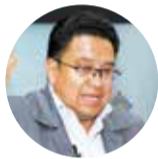
César Siles, Procurador General del Estado