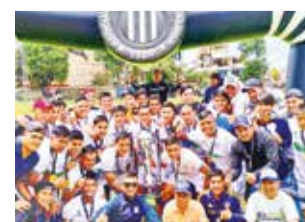
Millonarios, campeón del Provincial valluno. AFC

El club Millonarios y Deportivo Amanecer, ambos de Vinto, representarán a Cochabamba en la Copa Simón Bolívar 2024, luego de coronarse campeón y subcampeón del