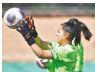
Entrenamiento de la selección femenina.

Ecuador, Uruguay, Argentina, Paraguay y Perú.