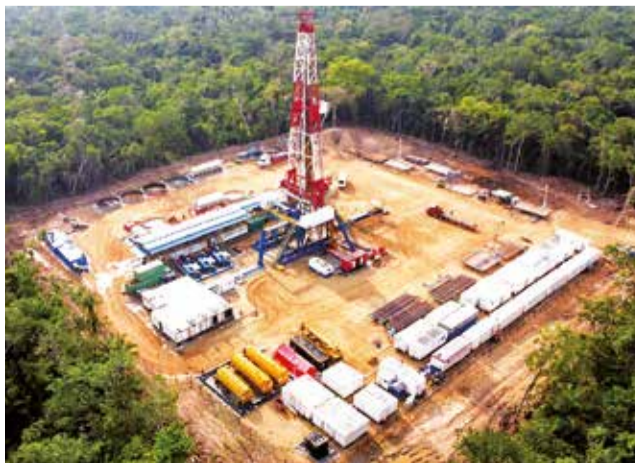
Uno de los pozos de gas en el sur del país.

“Si se hubiera hecho ese trabajo de manera adecuada, hoy estaríamos traba-