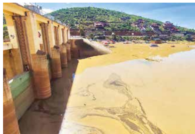
Mejora el caudal de la represa de La Angostura.

El recorrido abarcó el Sindicato Agrario La Capilla, por el barrio Crucero, Huasa Calle y Ucureña, donde se evi-