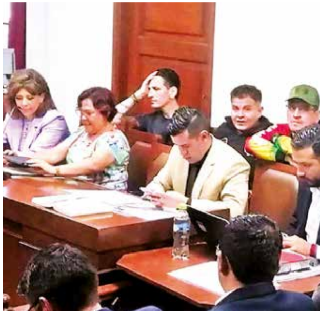
La audiencia del juicio contra la RJC, ayer en Cochabamba.