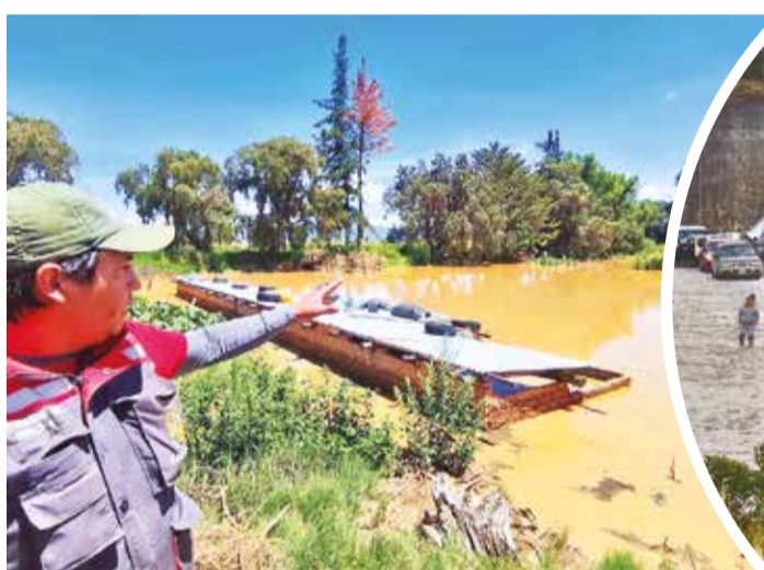
El desborde de los canales cubrió cultivos y casas en Cliza, valle alto, ayer.