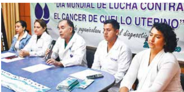
El lanzamiento de la campaña, ayer. CARLOS LÓPEZ

Atención. La campaña se realizará del 11 al 29 de marzo. Las interesadas deben llevar su documento de identidad o SUS