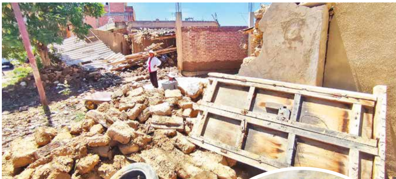
Una de las 10 casas derrumbadas en Cliza, Ucureña, ayer.