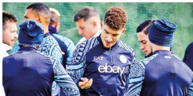
Giovanni Di Lorenzo (centro), capitán de Nápoles.

Liga de Campeones. El cuadro italiano se juega, además, una millonaria bolsa ante el Barça. El otro duelo será Arsenal vs. Porto