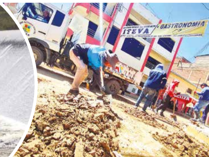
Cuadrillas de emergencia limpian las calles del centro de Cliza.