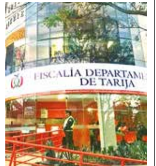
Fachada de la Fiscalía de Tarija.

"Se asignó un fiscal de materia al caso, quien inició la recolección de indicios que coadyuven resolver este hecho de sangre, como el registro del lugar, el levantamiento y la autopsia legal del cadáver de la mujer, entre otros, que