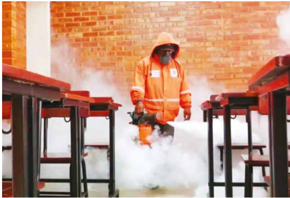
La fumigación contra el mosquito del dengue Aedes aegypti en la UE Otto Brawn. GAMC

“Estamos precautelando la salud de nuestros niños por el mal tiempo y las lluvias de los últimos días. Atendemos todas las solicitudes y coordinamos la limpieza y