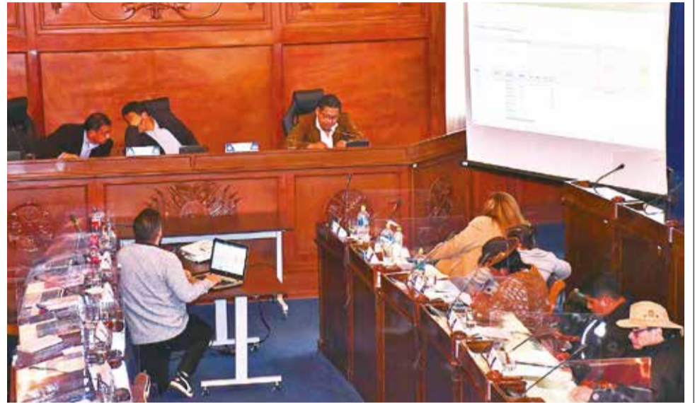
Los integrantes de la Comisión Mixta de la ALP empiezan la revisión de documentos.

Ante esta situación y para definir acciones, la presidencia de la Comisión Mixta de Constitución determinó cuarto intermedio hasta las 14:00 de este martes.