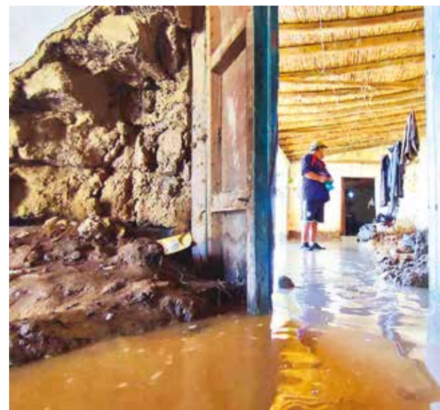
El lodo que entró a las casas en el valle alto.