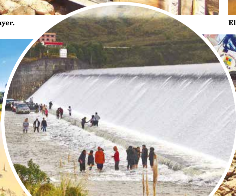
La represa de Corani rebalsa y recibe visitantes que se mojan y pasean en botes.